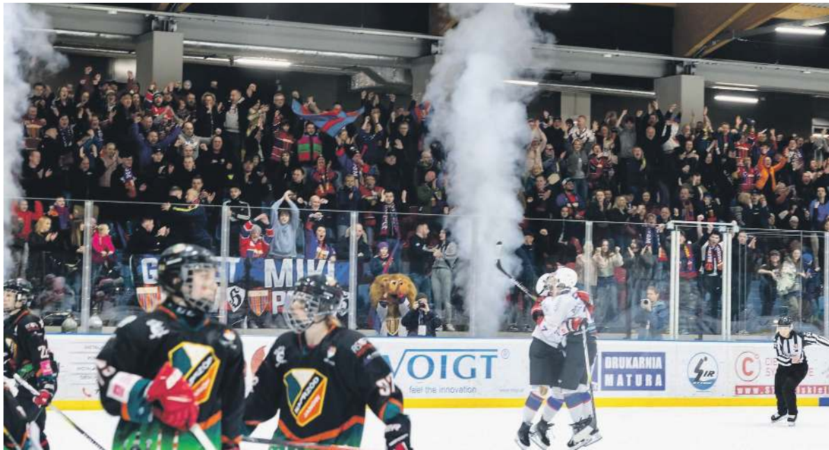
Tak było podczas szesznarocznego finału pomiędzy Polonią, a Kojotkami. Tym razem też można się spodziewać gromkiego dopingu

JANÓW, BYTOM. JAK DOTĄD W FILMIE POD TYTUŁEM „HOKEISTKI POLONII BYTOM BRONIĄ MISTRZOSTWA POLSKI I ZDOBYWAJĄ JE PO RAZ CZTERNASTY W OGÓLE, A DZIEWIĄTY Z RZĘDU” WSZYSTKO DZIEJE SIĘ ZGODNIE Z DOKŁADNIE ZAPLANOWANYM SCENARIUSZEM. W MINIONĄ SOBOTĘ NASZE ZAWODNICZKI NA WYJEŹDZIE OGRAŁY 4:2 KOJOTKI NAPRZÓD JANÓW I 22 MARCA U SIEBIE MAJĄ DO ODEGRANIA JUŻ TYLKO JEDNĄ SCENĘ. MUSZĄ WYGRAĆ JESZCZE RAZ.