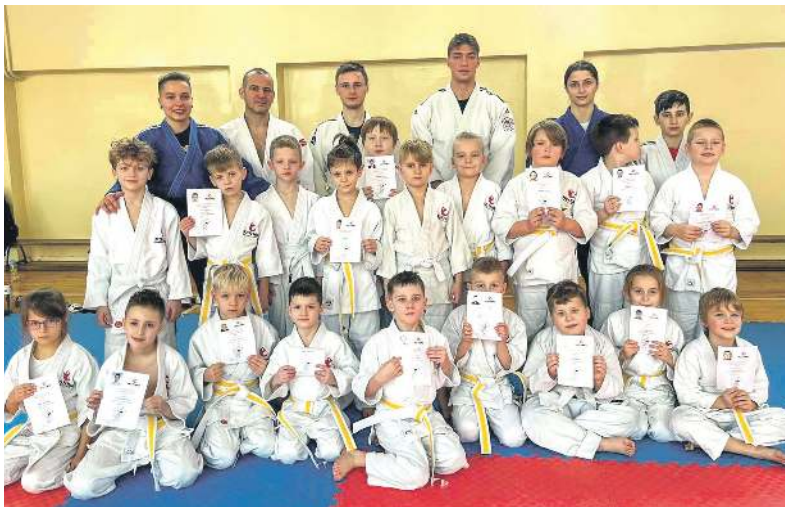
W UKS Feniks Bytom trenują dzieci i młodzież

Feniks to nie tylko zajęcia w Bytomiu. To także wyjazdy na zagraniczne turnieje i obozy treningowe. Właśnie grupa zawodników wróciła z turnieju w Grecji, inni byli na obozie na Litwie. Ale są też dalsze wyjazdy: co roku Feniks organizuje dla zawodni-