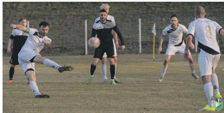
Szombierki nie zagrały, ale obroniły pozycję lidera

Nie pograły sobie natomiast piątligowe Szombierki. Po krótkim epizodzie wiosennym zima przypomniała o sobie i murawa na boisku Znicza Kłobuck, z którym Zieloni mieli rywalizować nie nadawała się do tego, by biegali po niej piłkarze. Decyzją gospodarzy spotkanie w Kłobucku zostało odwołane. ŚIZPN wyznaczył nowy termin meczu na środę 7 maja o godz. 18.