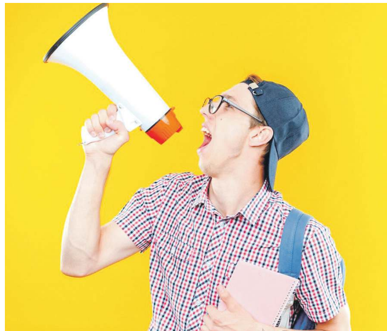
Tyn chop z megafonem na zicher narobi kupa larma

Larmo mocie tyz na szpilu, jak fto szczeli tor, abo tora niy szczeli, abo jesce jak syndzia sie łołyli ze spalonym,