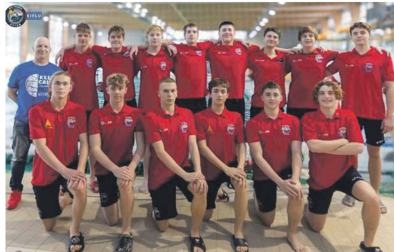
Juniory WTS Polonia Bytom

Zespół juniorski U19 WTS Polonia Bytom wziął udział w turnieju piłki wodnej zorganizowanym na gliwickiej pływalni. Nasi odnieśli trzy zwycięstwa, a dwa razy musieli uznać wyższość rywali.