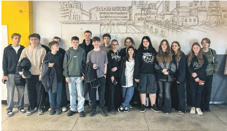
Uczniowie szombierskiego ZST mają powody do zadowolenia

Zaawansowane prace budowlane przewidziano nie tylko w salach dydak-