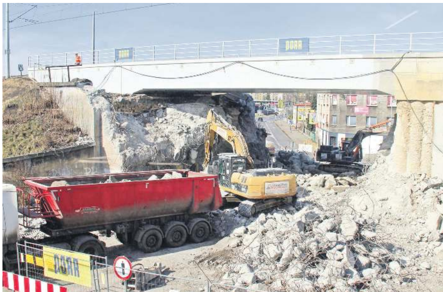
Stary wiadukty6 bronii się długo, ale ciężki sprzęt w końcu dał mu radę

Na szczęście i zgodnie z oczekiwaniami władz Radzionkowa przed zamknię-