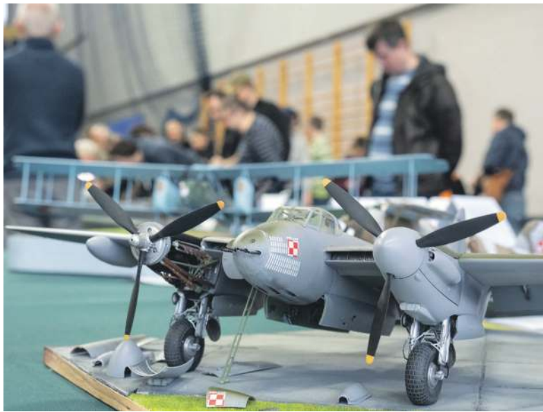
Przygotowanie modeli zaprezentowanych na Festiwalu zabiera modelarzom wiele czasu

Stworzenie zredukowanych do małych rozmiarów modeli pokazywanych na wystawie zajęło im mnóstwo czasu, czasem to nawet kilka miesięcy poświęconych na żmudną i co naj-