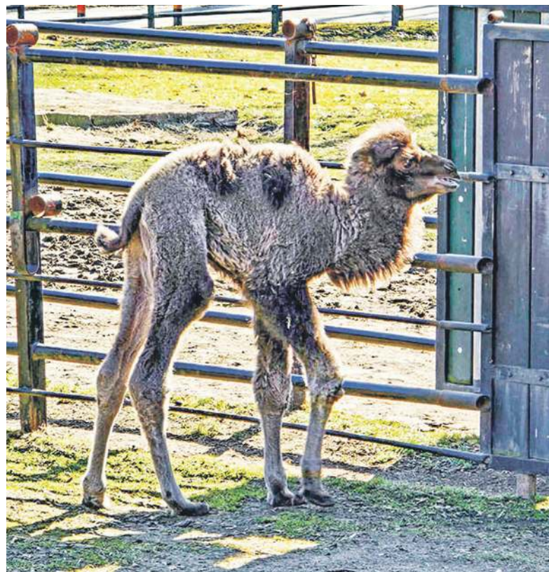
Franek na razie nabiera sił

Mały wielbłąd z chorzowskiego ZOO to jednak nie tylko uroczy wygląd. On już teraz w pełnej krasie pokazuje swoją osobowość. Z jednej strony jest odważnym odkrywcą, który z wielką ciekawością bada otoczenie, z drugiej zaś potrafi być niezwykle czułym dziusiem, który uwielbia być blisko