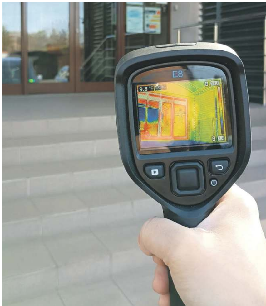
Niewielka kamera ma ogromne możliwości

Po przeprowadzonym badaniu termowizyjnym gmina dostaje szczegółowy