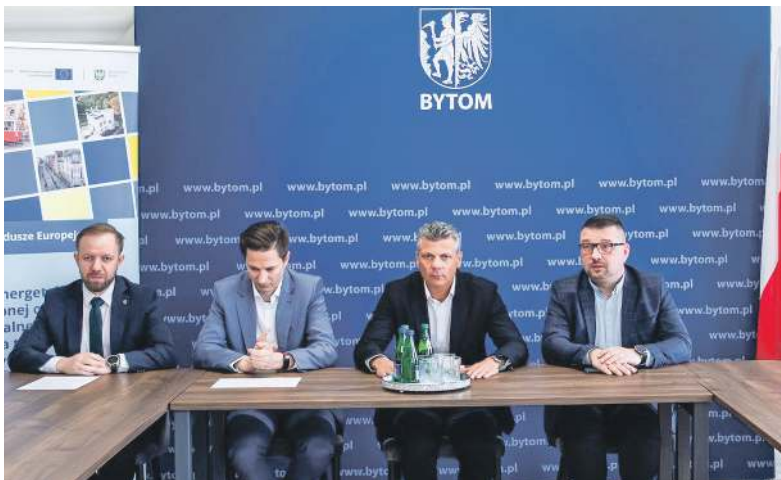
O założeniach projektu poinformowano podczas konferencji prasowej zorganizowanej w Ratuszu

W efekcie do końca przyszłego roku realizacji doczekają się 143 inwestycje związane z instalacją odnawialnych źródeł energii w budynkach mieszkalnych. Chodzi o 122 powietrzne pompy ciepła do centralnego ogrzewania lub ciepłej wody użytkowej, 136 instalacji fotowoltaicznych, 130 magazynów energii elektrycznej oraz 119 systemów zarządzania energią, które przygotowane zostały na podstawie deklaracji złożonych przez mieszkańców.