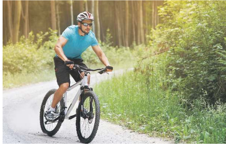
Jazda na rowerze to przyjemność, ale musimy pamiętać o zasadach bezpieczeństwa

Zbliżając się do przejścia dla pieszych, rowerzysta jest obowiązany zachować