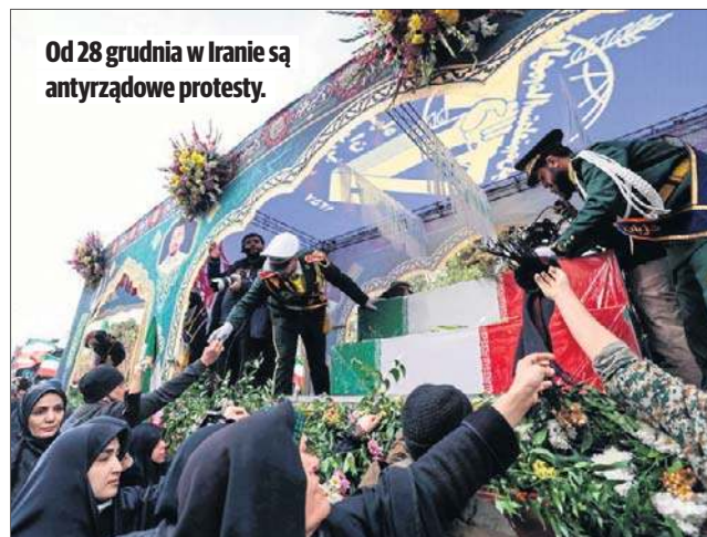
Od 28 grudnia w Iranie są antyrządowe protesty.

Wcześniej prezydent USA Donald Trump zagroził Irano-