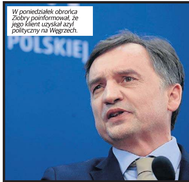
W poniedziałek obrońca Ziobry poinformował, że jego klient uzyskał azyl polityczny na Węgrzech.

- Zmiana polegała na doprecyzowaniu i uszczegółowieniu sposobu zabezpieczenia majątkowego poprzez wyraźne wy-