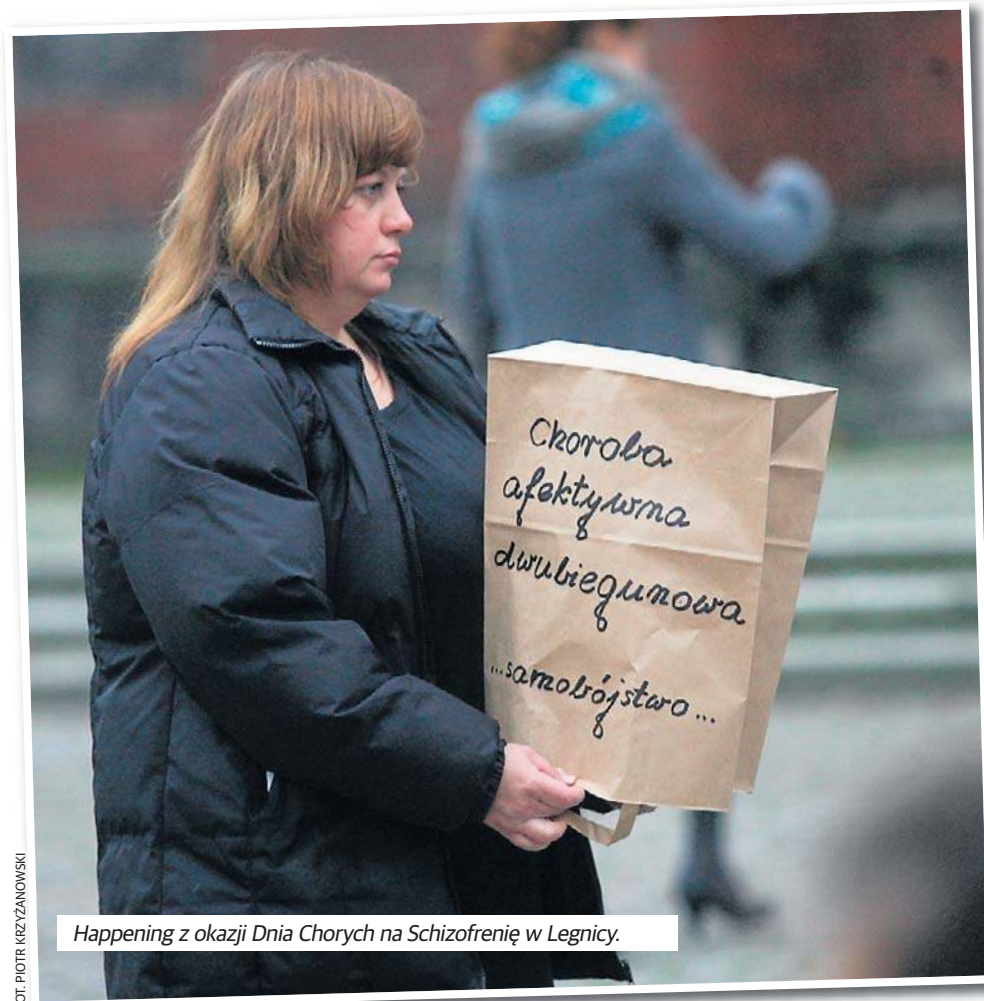
Happening z okazji Dnia Chorych na Schizofrenię w Legnicy.

Że nie są same. Że jest pomoc, choć system daleki jest od ideału. Centra Zdrowia Psychicznego to wielki krok naprzód, ale wciąż trzeba walczyć. Ważne, żeby nie poddawać się, żeby szukać wsparcia. I żeby pamiętać, że choroba nie definiuje, kim jesteś. Możesz być sobą mimo niej - ja dopiero teraz to odkrywam.