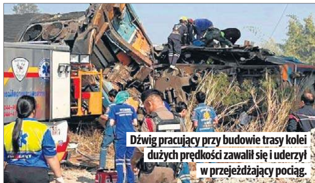
Dźwig pracujący przy budowie trasy kolei dużych prędkości zawałił się i uderzył w przejeżdżający pociąg.

Władze Danii wysłały na Grenlandię tzw. wysunięte dowództwo, które ma przygotować wzmocnienie obrony wyspy własnymi oraz międzynarodowymi wojskami - podał w środę duński nadawca publiczny DR. O wzmocnieniu obecności wojskowej na Grenlandii mówił we wtorek szef resortu obrony Danii Troels Lund Poulsen, podkreślając, że chodzi o większe zaangażowanie duńskich sił zbrojnych, a także obecność wojsk państw sojuszników. Obecnie duńskie wojsko na Grenlandii liczy 250-300 żołnierzy i podlega Dowództwu Arktycznemu w Nuuk.