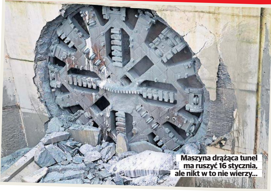
Maszyna drążąca tunel ma ruszyć 16 stycznia, ale nikt w to nie wierzy...

● Ale czy serce Kacpra Kuszewskiego jest już zajęte? STR. 13