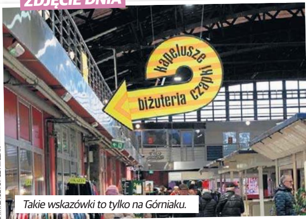
Takie wskazówki to tylko na Górnika.