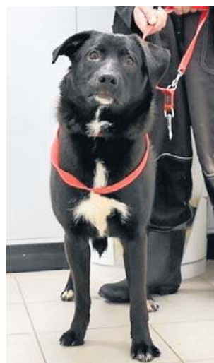
FOT. SCHRONISKO ŁÓDŹ