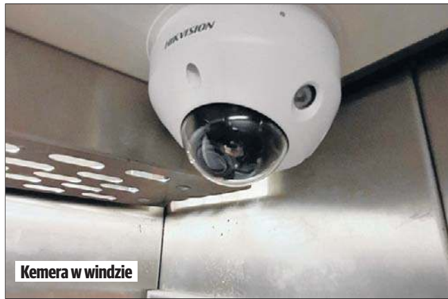
Kamera w windzie