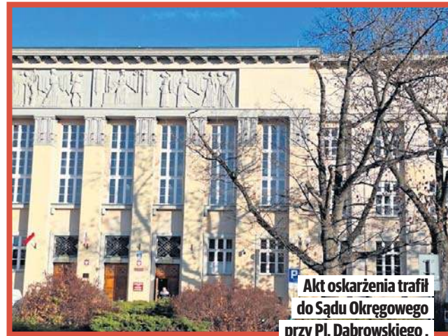
Akt oskarżenia trafił do Sądu Okręgowego przy Pl. Dąbrowskiego.

Śledztwo prowadziła Prokuratura Rejonowa Łódź - Bałuty. Z jej ustaleń wynika, że do zbrodni doszło w dniach 21 - 23 marca 2025 roku. W tym czasie w hostelu, z powodu trwającej przeprowadzki, którą wynajmowała 73-letnia kobieta będąca w kontakcie telefonicznym z 27-letnią wnuczką. Gdy kontakt się urwał zaniepokojona wnuczka poprosiła pracowników hostelu, aby sprawdzili, co dzieje się z jej babcią. Niestety, seniorka nie żyła. Została brutalnie uduszona. Ruszyło śledztwo. Gdy śledczy zapytali 70-letnią sprzątaczkę czy w hostelu jest monitoring, ta zaprzeczyła. Skłamała. Kamery nie tylko były, ale jedna z nich była skiero-