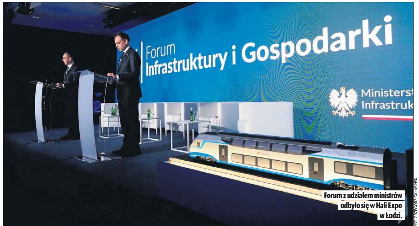
Forum z udziałem ministrów odbyło się w Hali Expo w Łodzi.

Jak podkreślił podczas rozmowy z łódzkimi dziennikarzami PKP PLK przygotowuje