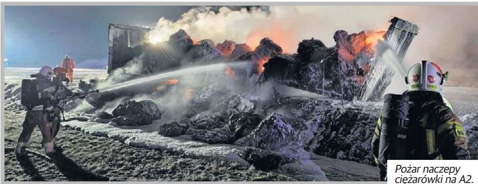
Pożar naczepy ciężarówki na A2.

W akcji wzięli udział strażacy ze Specjalistycznej Grupy Ratownictwa Chemicznego JRG 4 Łódź. W gaszeniu pożaru brały też udział jednostki JRG Łowicz, JRG Brzeziny, JRG Stryków oraz OSP Łyszkowice i OSP Kalenice. Ruch na A2 w kierunku Warszawy był całkowicie wstrzymany.