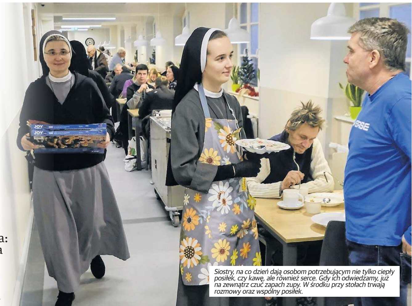
Siostry, na co dzień dają osobom potrzebującym nie tylko ciepły posiłek, czy kawę, ale również serce. Gdy ich odwiedzamy, już na zewnątrz czuć zapach zupy. W środku przy stołach trwają rozmowy oraz wspólny posiłek.