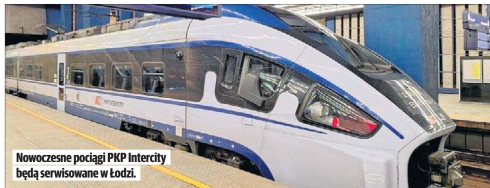
Nowoczesne pociągi PKP Intercity będą serwisowane w Łodzi.

- Hala zostanie zaprojektowana z myślą o realizacji konkretnych