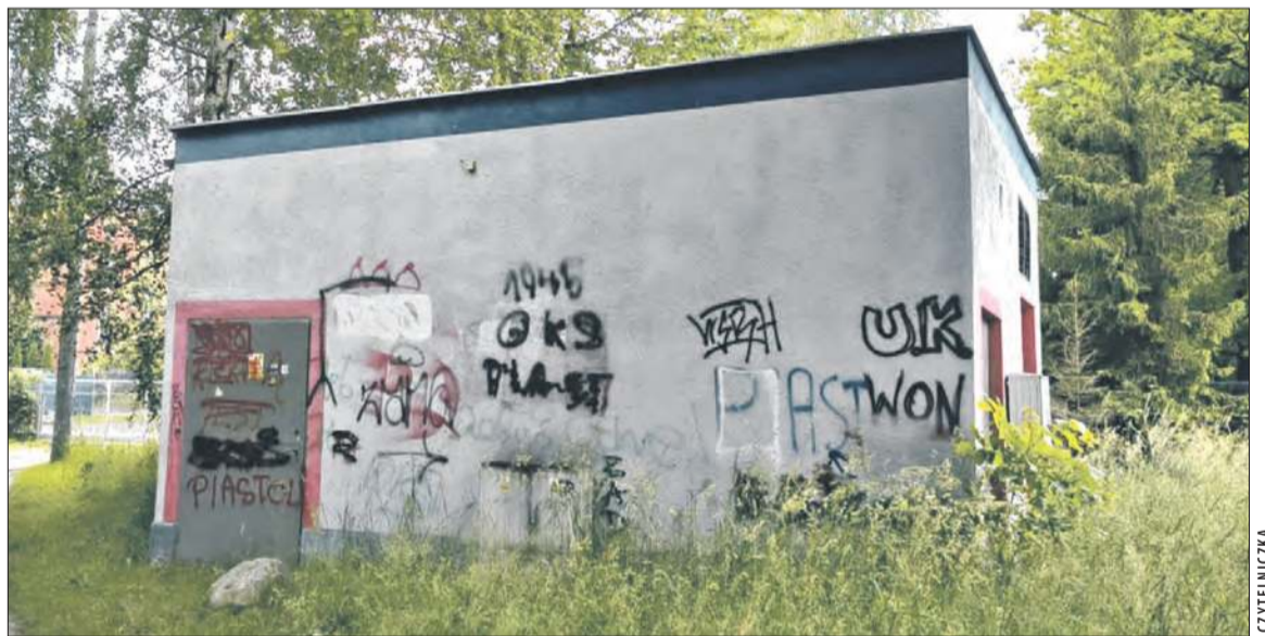
Czytelniczka: - Ulica Legionów, miejski słup ogłoszeniowy?