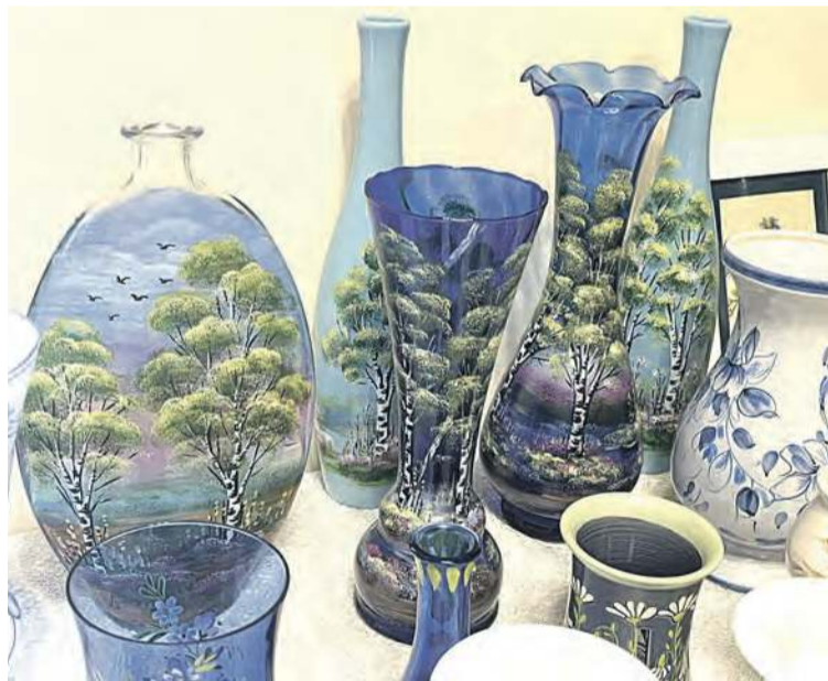
Rośliny także na różnych produktach, płótnach, czy na ceramice