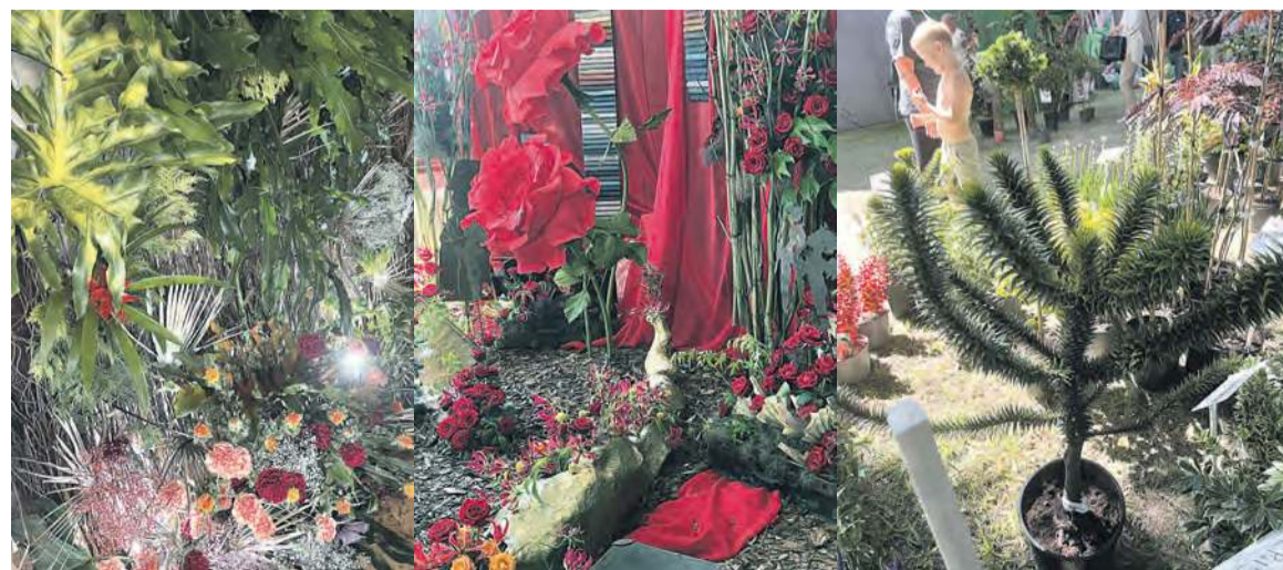
Lato Kwiatów w Otmuchowie to przede wszystkim królestwo roślin ozdobnych

W cyklu koncertów letnich „Náš pááááateček, aneb V létě nikam nespěcháme” w Krnowie odbędzie się koncert u Bauera: AV Blues & Swing (duet Aleš Nitra i Vláda Vondráček; muzyka blues, swing, dixieland, rock'n'roll). Godz. 18.00. ■