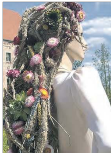
Najróżniejsze kompozycje roślinne

Rodziny Piknik, z pokazami iluzji, występami i dobrą kuchnią.