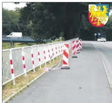
Ul. Kolejowa w Prudniku

Na odbudowę drogi powiatowej Łąka Prudnicka – Pokrzywna w Moszczance trafi 8,3 miliona złotych. Jak zapowiada starosta Radosław Roszkowski, nowa droga zostanie wykonana w technologii, która znacznie lepiej zabezpieczy ją przed skutkami kolej-