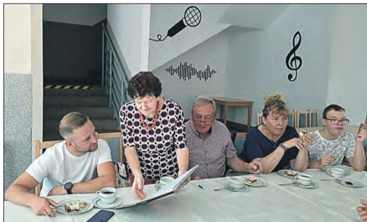
Spotkanie w Gminnym Centrum Kultury w Białej