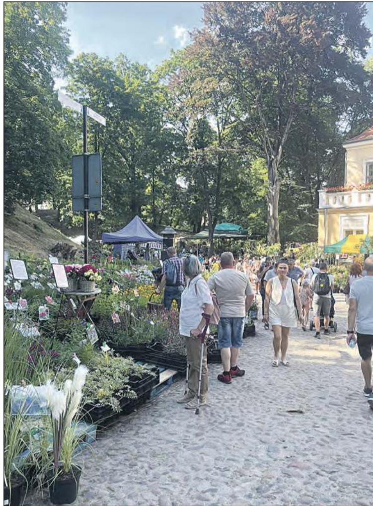
Na zamku i wokół otmuchowskiego zamku mnóstwo stoisk z roślinami