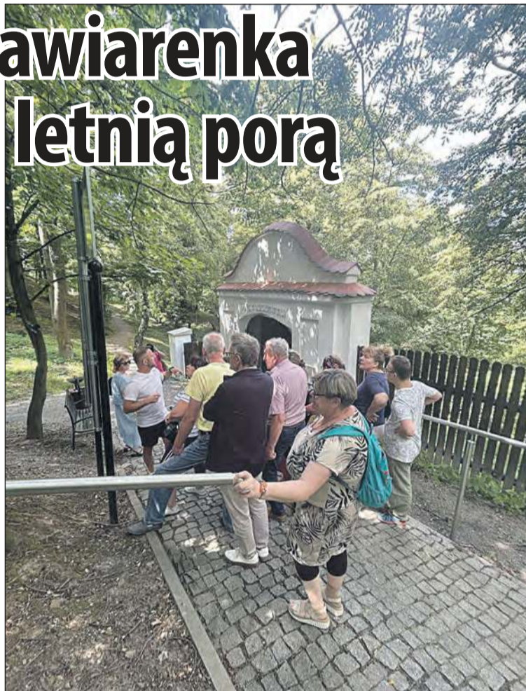
Poeci przed nową bramą na biański kirko