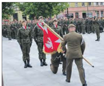
Przysięga żołnierzy odbyła się w Opolu

Podczas ceremonii, po uroczystej przysiędze, żołnierzom wręczono Chorągiew Wojska Polskiego – symbol tradycji, honoru i odpowiedzialności za Ojczyznę. To wyjątkowe wyróżnienie podkreśla zaangażowanie Brygady, która od początku swojej działalności aktywnie wspiera mieszkańców Opolszczyzny – m.in. w czasie powodzi.