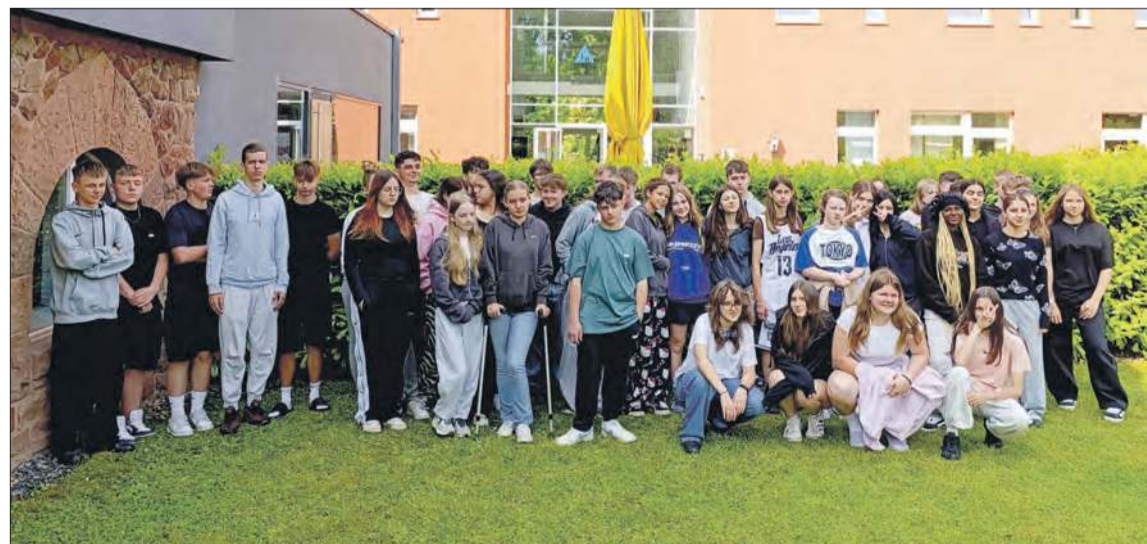
Młodzież z Polski i Niemiec

Projekt „Kinder ohne Grenzen” to nie tylko wspólne działania edukacyjne i artystyczne, ale przede wszystkim budowanie mostów porozumienia i przyjaźni między młodymi ludźmi z Polski i Niemiec. Cieszymy się, że mogliśmy być częścią tej wyjątkowej inicjatywy! ■