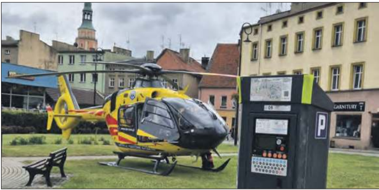
Pilot wylądował w centrum Prudnika