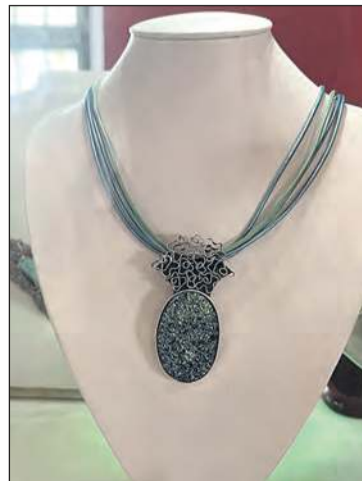
Bizuteria z motywami roślinnymi