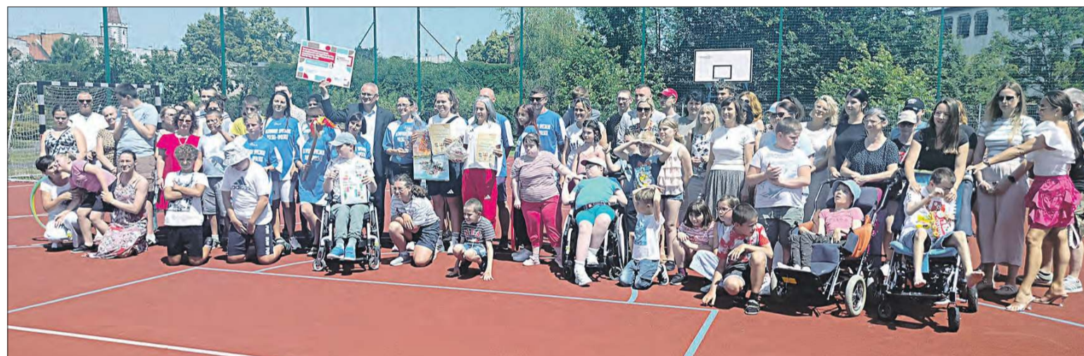
Uczestnicy spotkania z paraolimpijką Barbarą Bieganowską-Zajac