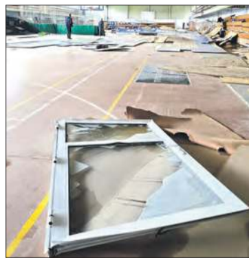
Zniszczone wnętrze hali przy ul. Łucznicznej w Prudniku