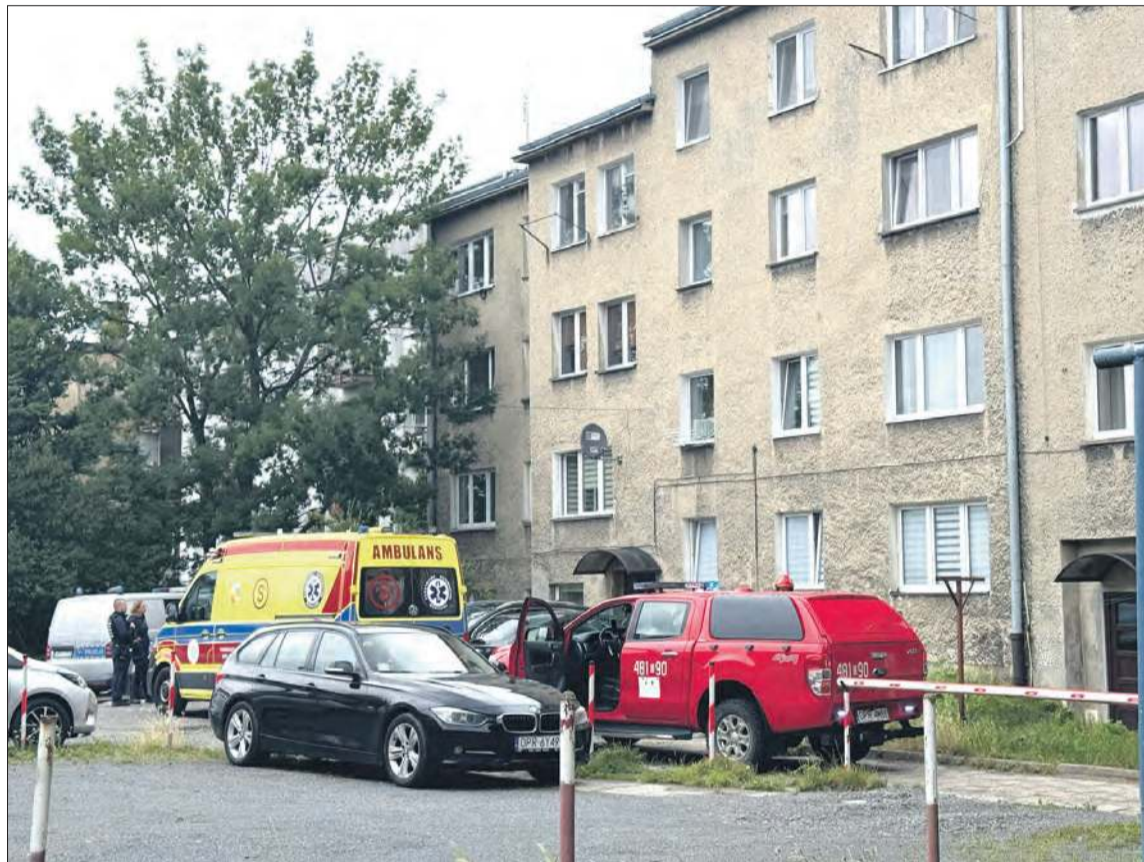
Do dramatycznych scen doszło w jednej z kamienic przy ul. Kołłątaja

Był środowy, pochmurny poranek, około godziny dziewiętej nad miastem zaczął krążyć śmigłowiec LPR. Pilot szukał miejsca do wylądowania. Pierwotnie miał posadzić maszynę nieopodal szpitala, ostatecznie wskazano mu skwer przy Placu Zamkowym. Uzbrojeni po zęby w sprzęt i wiedzę medycy udzielili wsparcia załodze pogotowia, która przecznice dalej toczyła walkę o życie poszkodowanego malucha. Na miejscu wypadku obecna już była policja, a także strażacy, przy pomocy których żółty statek powietrzny mógł bezpiecznie usiąść na ziemi między zabudowaniami. Przechodnie w napięciu oczekiwali na rezultat działań służb ratunkowych, łapiąc się za głowy i roniąc łzy.