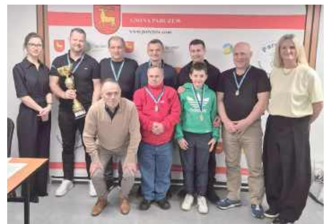
Drugie miejsce w rywalizacji piłkarskiej zajęła Grupa Pamiętająca Teleranek z Parczewa

sportowej, bez której realizacja wydarzeń nie byłaby możliwa.