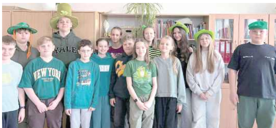
Cała społeczność szkolna wyglądała jak jedna wielka, zgrana drużyna szczęścia

- Już od samego rana korytarze wypełniły się uczniami ubranymi w różne odcienie zieleni - od jasnych, wiosennych barw po głębokie, butelkowe kolory. Trudno było znaleźć osobę, która nie włączyła się w tę wyjątkową tradycję. Zielone koszulki, bluzy, dodatki, a nawet kreatywne