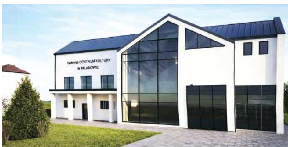
Nowocześnie i z klasą, tak będzie się prezentować Centrum Kultury w Milanowie po przebudowie

Gminny Ośrodek Kultury w Milanowie już wkrótce przejdzie ogromną metamorfozę. Za kwotę 11 mln zł obiekt ma zmienić się w nowoczesny i funkcjonalny kompleks. Dzięki inwestycji nowe oblicze zyska również teren wokół budynku. To coś więcej niż tylko remont, to gruntowna przebudowa i rozbudowa budynku, która całkowicie odmieni jego dotychczasowy wygląd i funkcjonalność. Projekt obejmuje nadbudowę, która pozwoli na stworzenie nowych pomieszczeń oraz przestrzeni użytkowych. Pro-