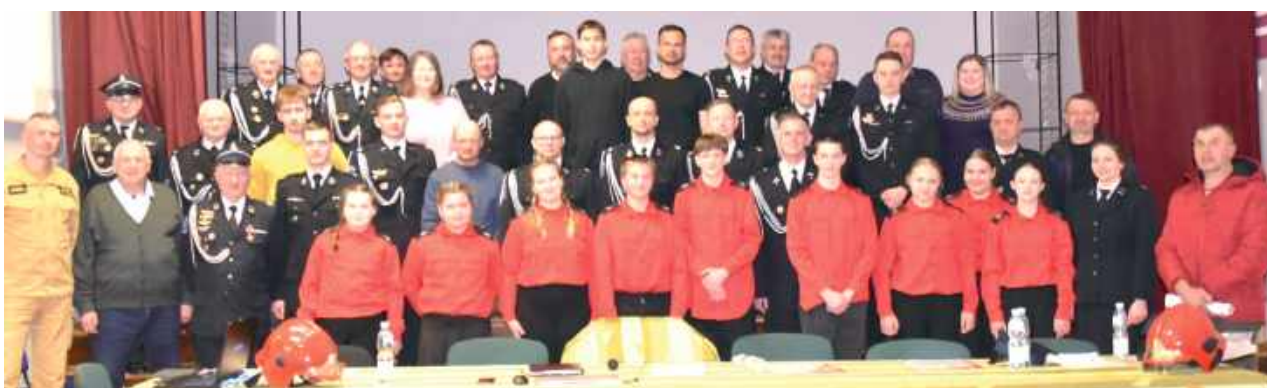
Oto pełny skład OSP Milanów

Za nami walne zebranie sprawozdawczo-wyborcze członków OSP Milanów za 2025 rok.