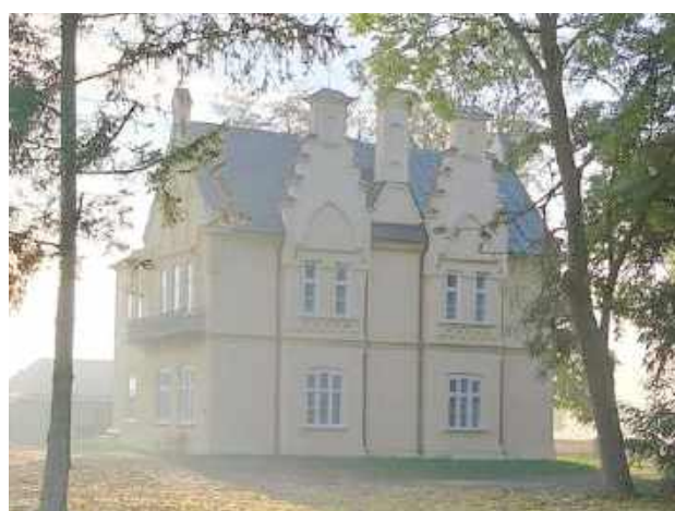
Pałac Łubieńskich w Kolanie stał się przestrzenią aktywności społecznej i kulturalnej

artystyczna - sceniczna i wygrał. W prezentacjach wystąpiło 14 uczestników, a konkurs zorganizowany był w trzech kategoriach - wydarzenie kulturalne, twórczość artystyczna i odkrycie roku. Ale to nie koniec nagród dla reprezentantów gminy Jabłoń, wyróżnienie w kategorii Odkrycie Roku otrzymał Pałac Łubieńskich w Kolanie. Tym samym Kalina będzie reprezentować powiat parczewski podczas konkursu na szczęblu wojewódzkim, jaki ma się odbyć w maju w Lublinie.