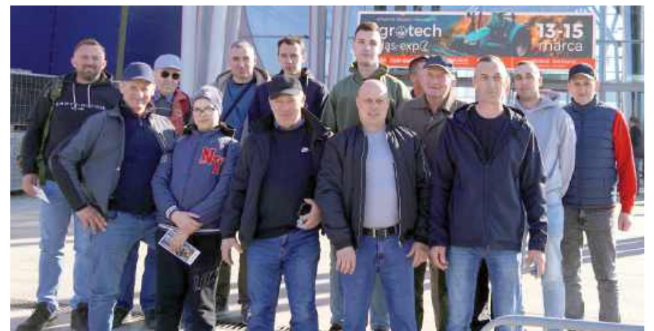
Ekipa Gminy Borki na AGROTECH KIELCE 2026