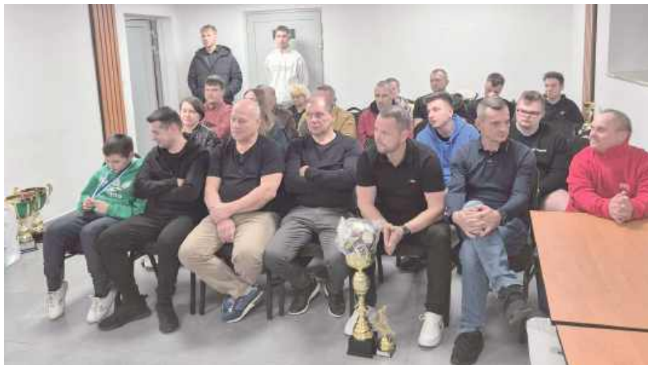
W sali konferencyjnej pod sceną Miejskiego Ośrodka Sportu i Rekreacji w Parczewie odbyło się uroczyste podsumowanie dwóch ważnych, cyklicznych wydarzeń sportowych: Grand Prix Parczewa w tenisie stołowym oraz Parczewskiego Futsalowego Cyklu trzech turniejów piłki halowej

Kulminacyjnym momentem uroczystości było wręczenie nagród. Najlepsi zawodnicy odebrali puchary burmistrza Parczewa, medale oraz nagrody rzeczowe. Dekoracji dokonali zaproszeni goście, dziękując jednocześnie uczestnikom za sportową postawę i zaangażowanie.