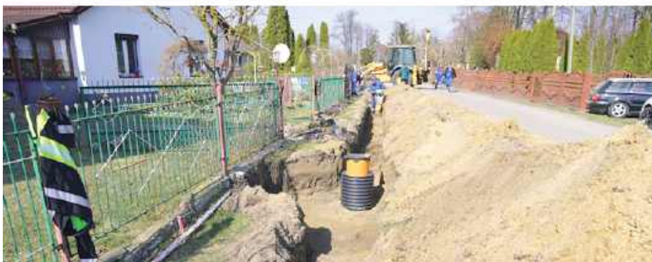
Inwestycja o wartości ponad 673 tys. zł jest współfinansowana z Krajowego Planu Odbudowy