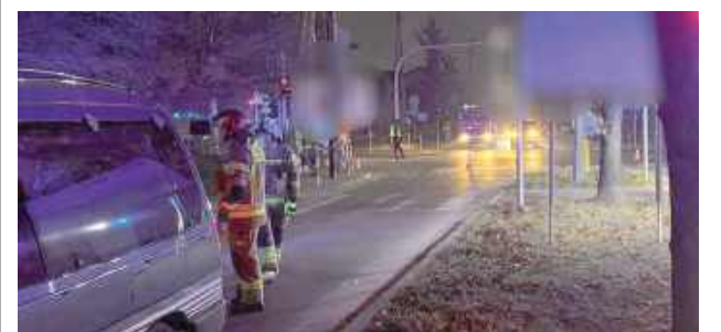
Do tragicznego wypadku doszło 18 grudnia około godz. 15 na skrzyżowaniu Al. Tysiąclecia i ul. Szaniawskiego

Do tragicznego wypadku doszło 18 grudnia około godz. 15 na skrzyżowaniu Al. Tysiąclecia i ul. Szaniawskiego.