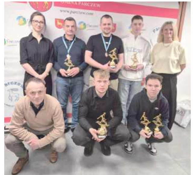
Wyróżnieni gracze zmagani