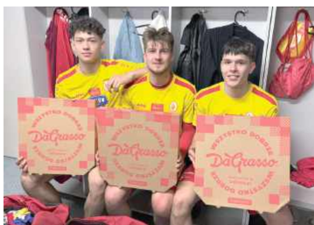
Wielka radość w Łukowie. Pierwsze zwycięstwo Orłąt w tym roku, a piąte w sezonie