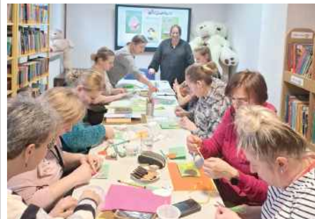
Kartki świąteczne to nieodłączny element naszej tradycji

Milanów: Tym razem Gminna Biblioteka Publiczna w Milanowie na warsztaty rękodzieła zaprosiła dorosłych. Panie z Koła Gospodyń Wiejskich w Milanowie tworzyły kartki świąteczne.