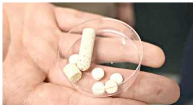
Implant polimerowo-ceramiczny ma być wszczepiany już po złamaniu i wypełniać będzie ubytek w tkance

LUBLIN: Naukowcy z Politechniki Lubelskiej i Uniwersytetu Medycznego w Lublinie stworzyli implant kości, który ma pomagać chorym na osteoporozę. Rozwiązanie powoli uwalnia lek, ale robi to tylko wtedy, gdy jest to niezbędne.