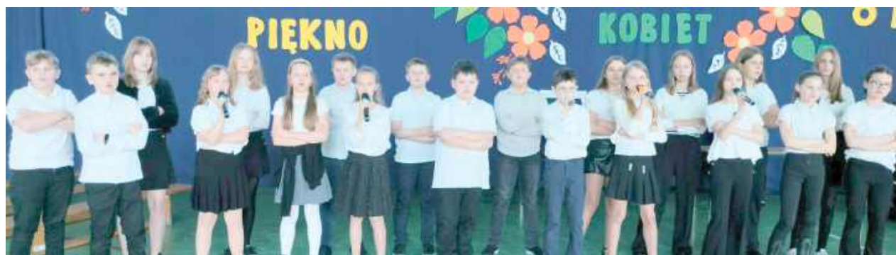
Uczniowie zaprezentowali bogaty program artystyczny, ukazując swoje liczne talenty

W połowie marca w Szkole Podstawowej nr 1 w Parczewie miała miejsce uroczysta Akademia z okazji Dnia Kobiet, przygotowana przez uczniów klas 6a, 6b, 4a oraz 4b pod czujnym okiem wychowawców.