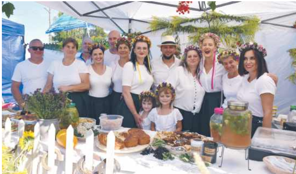
X Wojewódzkie Święto Ziół w Fajstawicach

Gmina Fajstawice wciąż się rozwija, by być lepszym miejscem do życia dla naszych mieszkańców. Na zrealizowane w 2024 r. zadania wydatkowaliśmy kwotę ponad 10 mln 300 tys. zł. Było to możliwe w głównej mierze dzięki środkom zewnętrznym, które samorząd stara się zawsze maksymalnie pozyskiwać.