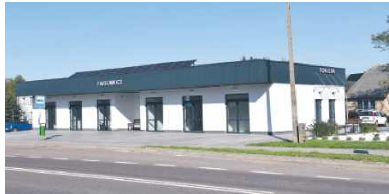
Nowy budynek przystankowo-usługowy w centrum Fajstawic

W przyszłym roku Gmina Fajstawice planuje wydać na inwestycje blisko 13 mln zł, za które zrealizuje szeroką gamę projektowych zadań.