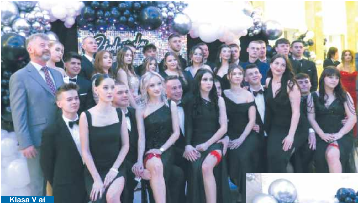
Klasa V at