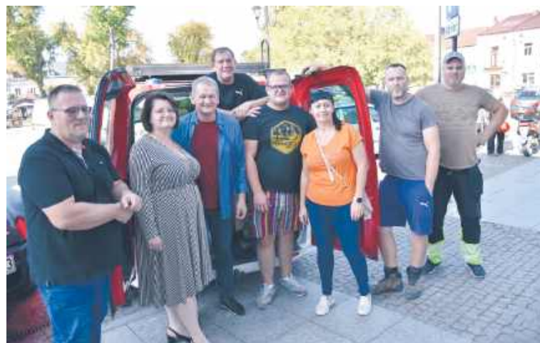
Przekazanie darów dla powodźian