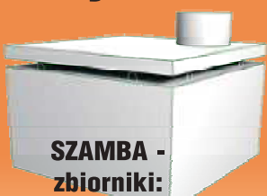
SZAMBA - zbiorniki: