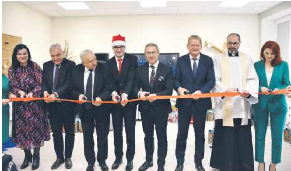
Otwarcie Gminnego Żłobka Małe Ziółka w Boniewie

Rok 2024 przyniósł wiele dobrego dla gminy Fajstawice – zrealizowane inwestycje, ciekawe wydarzenia, ale i nowe wyzwania do pokonania – jak lipcowa nawałnica, która z jednej strony pozostawiła po sobie niemałe spustoszenia, ale pokazała również, że w obliczu trudnej sytuacji gmina potrafi sobie poradzić.