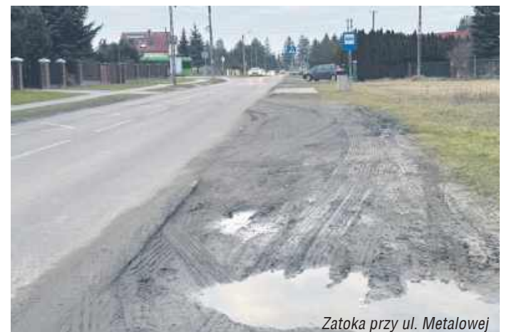
Zatoka przy ul. Metalowej

- Natomiast jeżeli chodzi o wskazaną zatokę przy wyjeździe z miasta (przy Metalowej), w ubiegłym roku miasto nabyło tę działkę i rozważana