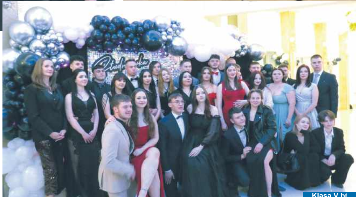
Klasa V bt