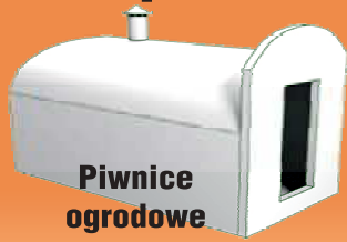
Piwnice ogrodowe typu „Loch”

• Sprzedaż • Transport • Montaż • Kompleksowe roboty ziemne