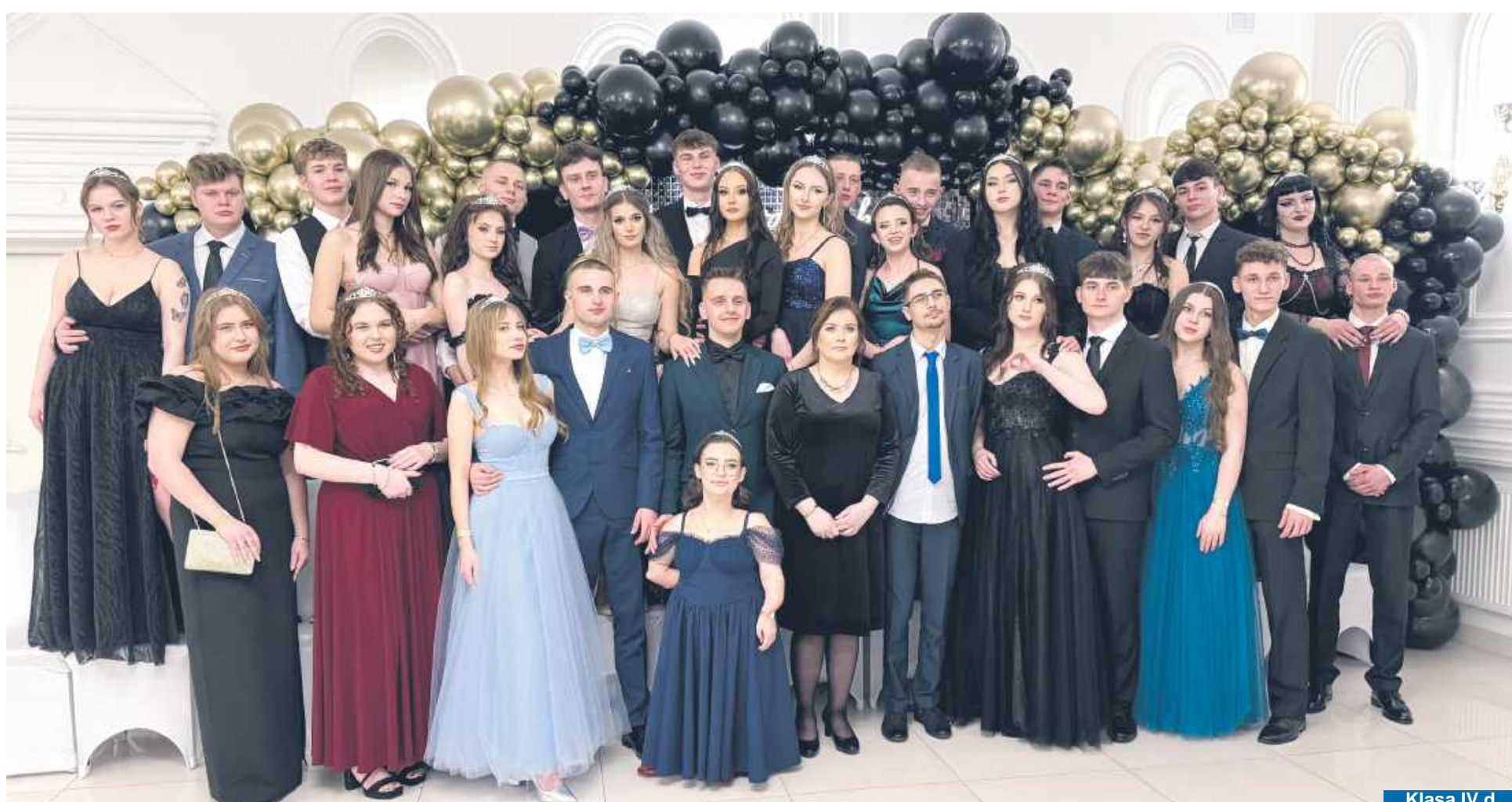
Klasa IV d