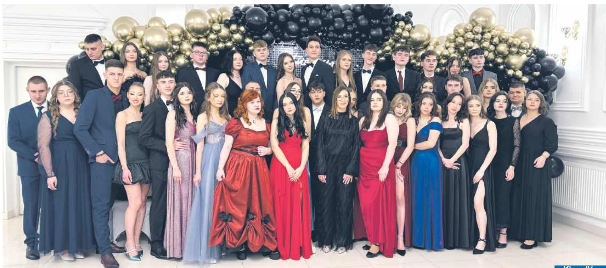
Klasa IV e