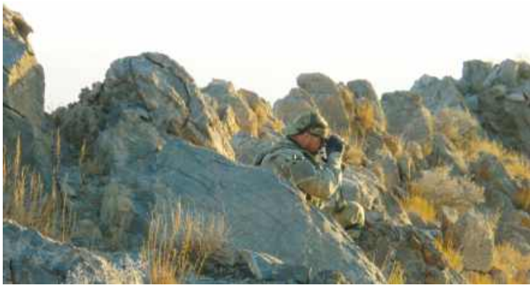
Akcja w Afganistanie

Część druga w kolejnym wydaniu tygodnika. Olga Gajda