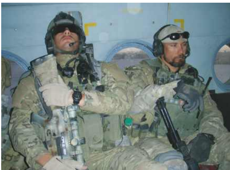
Żołnierze GROM w Ghazni