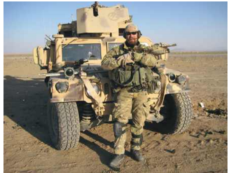
Akcja w 2010 r. w Afganistanie