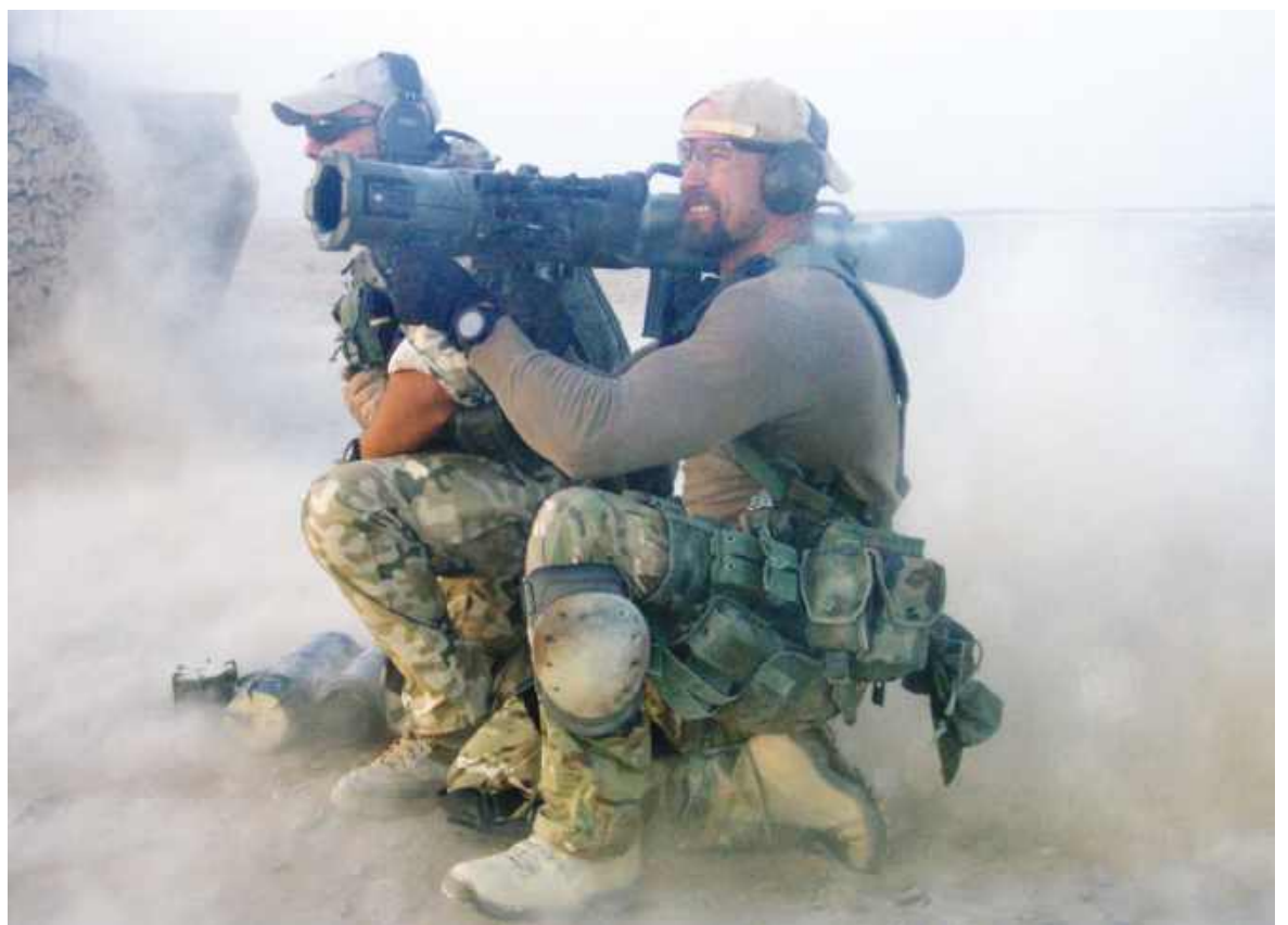
GROM w bazie sił sojuszniczych pod polskim dowództwem