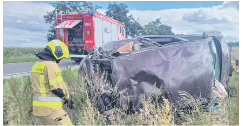
Samochód był doszczętnie zniszczony. Trudno było rozpoznać jego markę i model

Zaledwie kilkanaście minut po zdarzeniu na miejsce przybyły dwa zespoły straży pożarnej, w tym OSP z Wiązowa. Druhowie przejęli dalsze czynności związane z bezpieczeństwem rannego, jak i miejscem zdarzenia. Przyjechało także pogotowie ratunkowe. Dzięki szybkiej reakcji świadków i służb