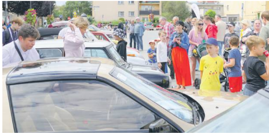
Piękne klasyki zaparkowały pod ratuszem, wzbudzając duże zainteresowanie mieszkańców

w kierunku Zamku Topacz, gdzie odbyła się główna część MotoClassic Wrocław.