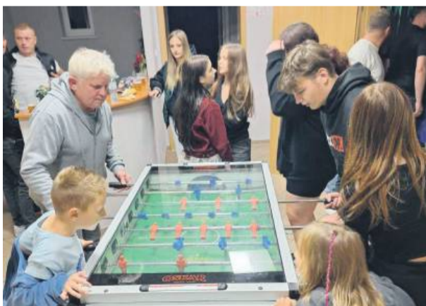
Na najmłodszych czekało wiele atrakcji