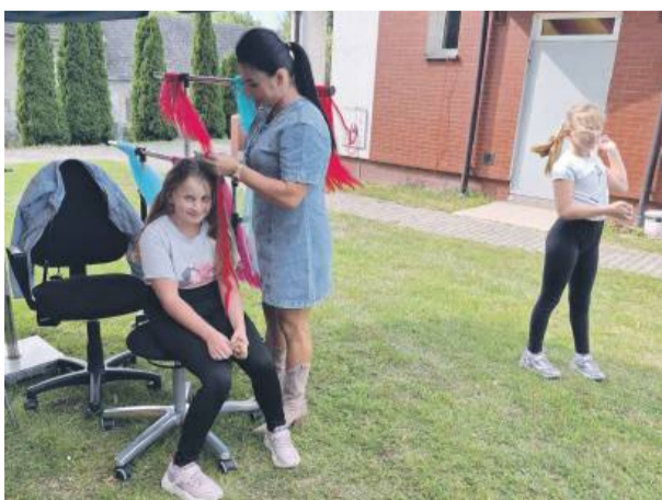
Podczas zabawy była możliwość skorzystania z zaplatania warkoczków

Strzelin blisko strategicznej inwestycji