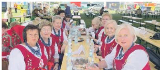
Zespół „Przewornianie” w Kobierzycach.

W sobotę, 23 sierpnia, w Kobierzycach odbył się XIV Festiwal Kultury Ludowej. To wydarzenie od lat przyciąga zespoły, kultywujące tradycje i muzykę ludową z całego regionu. W tegorocznej edycji udział wzięło aż dziesięć zespołów, a konkurencja była naprawdę wymagająca.