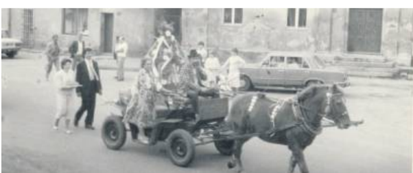
Dożynki w gminie Borów za dawnych lat.