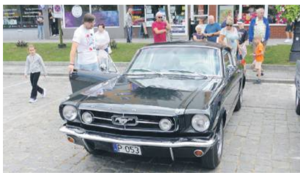
Zabytkowy ford mustang