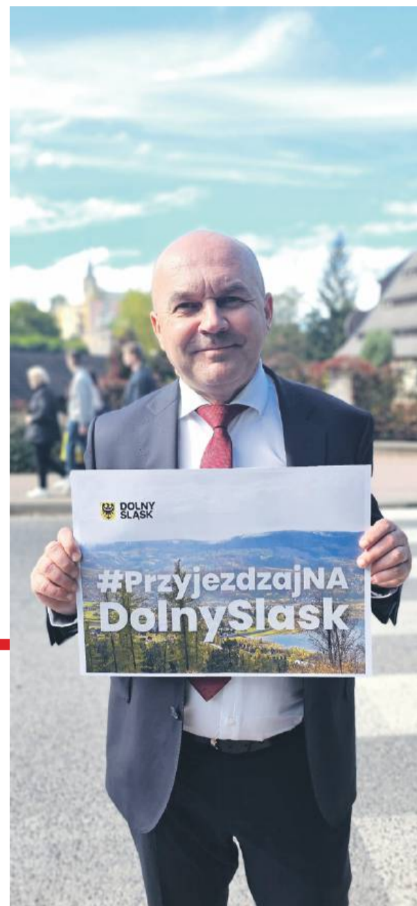
Wicemarszałek Wojciech Bochnak podczas wizyty w Dusznikach-Zdroju

- Bardzo zależało mi na tym programie, bo dzięki temu projektowi pomagamy nie tylko uczniom i nauczycielom, ale także lokalnym przedsiębiorcom, którzy najbardziej odczuli skutki zeszłorocznej katastrofy naturalnej - zaznacza wicemarszałek Bochnak. - W dolnośląskiej branży tu-