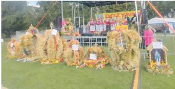
Piękne wieńce i występ zespołu Ślężanki

Po Mszy świętej barwny korowód dożynkowy przeszedł z kościoła na boisko sportowe, w którego bramach czekały wspaniałe pszczoły z ogromnymi skrzydłami. Te piękne dekoracje zarówno na wejściu, jak i w kościele oraz na scenie przygotowali pracownicy Gminnej Biblioteki Publicznej w Borowie. Staro-