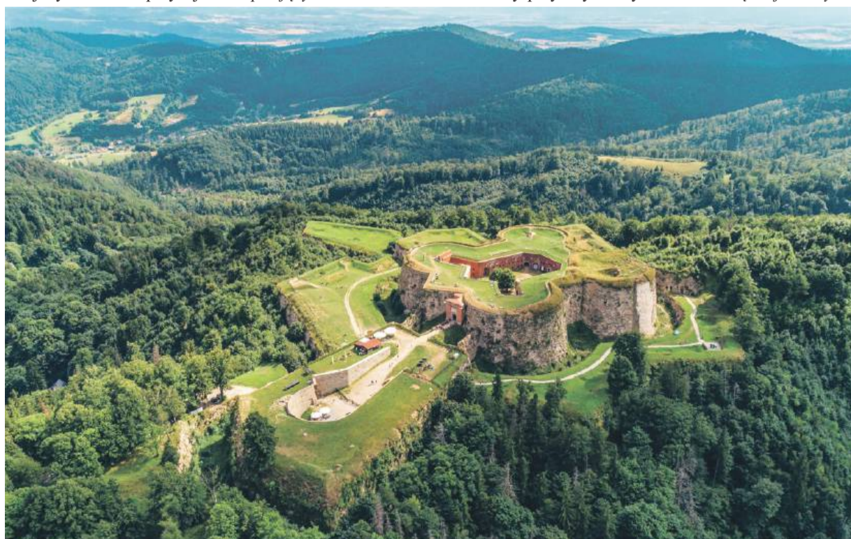
Twierdza Srebrna Góra – widok z lotu ptaka

Uczniowie z tych placówek będą mieli okazję odwiedzić najciekawsze miejsca Dolnego Śląska, często takie, które dotąd znali tylko z lekcji lub opowieści. Dla wielu z nich będzie to pierwsza okazja do poznania np. Karkonoszy, Kotliny Kłodzkiej, Doliny Baryczy, Zamku Książ, czy Kotliny Jeleniogórskiej. Projekt ma również wymiar integracyjny - dzięki niemu uczniowie z różnych części regionu mogą spotkać się, budować wzajemne kontakty i wymieniać doświadczenia, które wykraczają poza granice ich szkół i gmin. Lista dolnośląskich atrakcji turystycznych dostępna kompleksowo na stronie internetowej www.dolnyslask.travel