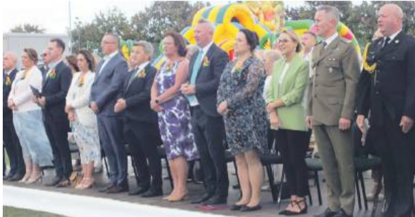
W uroczystości udział wzięło wielu zaproszonych gości

korowód dożynkowy, który wyruszył spod Gminnego Ośrodka Kultury i przejechał na stadion sportowy,