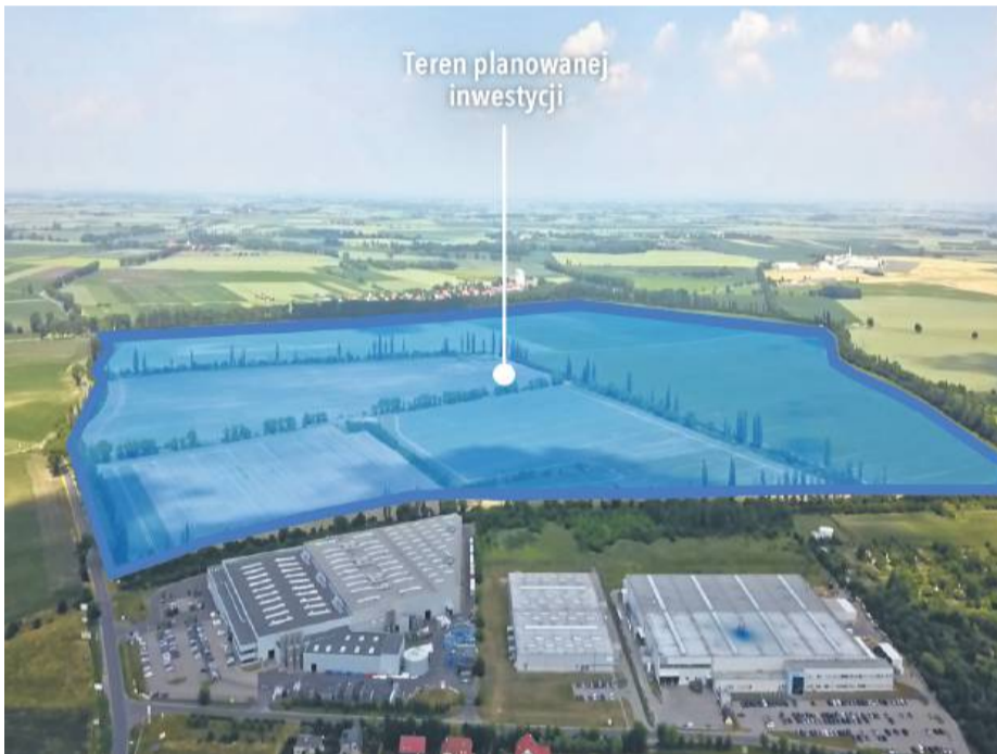
Tak prezentuje się teren, na którym miałyby powstać przyszła inwestycja

Władze gminy Strzelin prowadzą zaawansowane rozmowy i przygotowania związane z budową nowoczesnej fabryki z sektora obronności. Inwestycja miałaby strategiczne znaczenie zarówno dla bezpieczeństwa Polski, jak i dla rozwoju gospodarczego regionu.