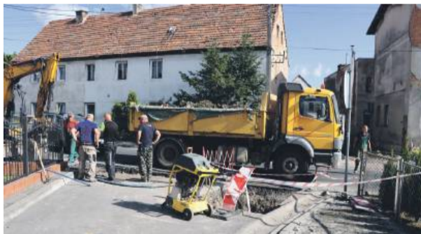
Awaria sieci wodociągowej przy ulicy Strzebińskiej w Przewornie