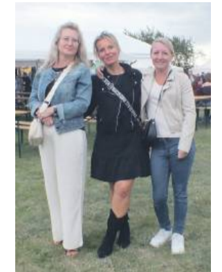
Mieszkańcy gminy bawili się doskonale