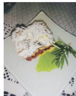
Ciasto można na końcu posypać cukrem pudrem

widelcem i piecz ok. 20 min w 170°C. W tym czasie umyj śliwki, i podziel je na półów-