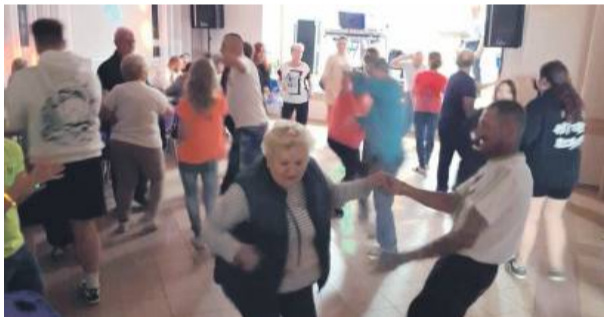
Ze względu na deszcz, imprezę przeniesiono do świetlicy