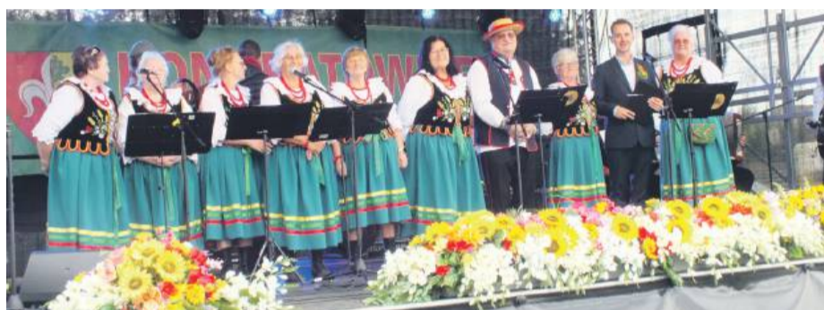
Występ zespołu Złotokłose

wali również lokalni di-dżeje, a dużym zaintereso-