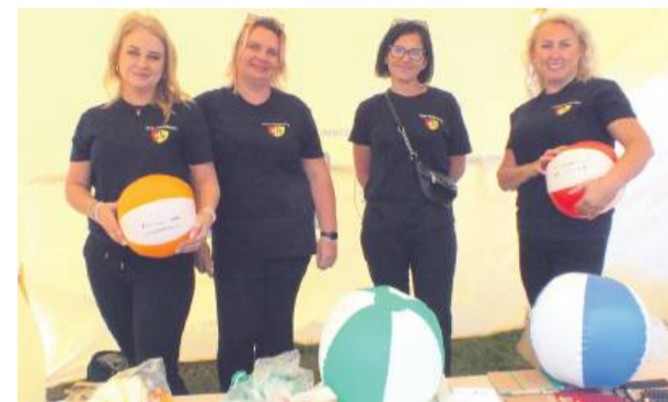
Na uczestników zabawy czekało wiele stanowisk z atrakcjami

Nie zabrakło artystycznych atrakcji. Na scenie