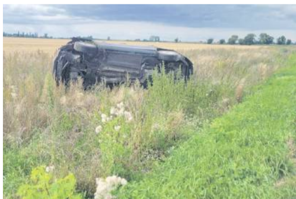
Pojazd zatrzymał się na polu w odległości niemal 200 metrów od pierwszych śladów, jakie pozostawiły opony na asfalcie