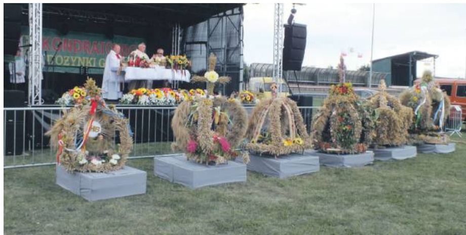
Odbył się także konkurs wieńców dożynkowych

na została uroczysta Msza święta, podczas której dzie-