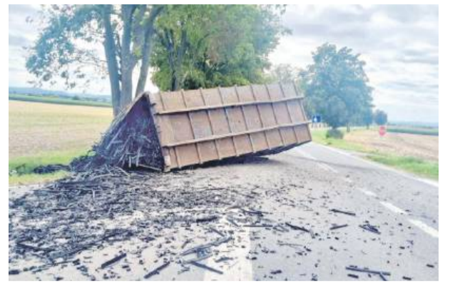
18 sierpnia w pobliżu Wawrzęć kierujący ciągnikiem rolniczym zmusił kierowcę ciężarowego Mercedesa do zjazdu na pobocze, aby uniknąć zderzenia.

33-letniego mieszkańca powiatu ząbkowickiego. Podczas interwencji mężczyzna znieważał funkcjonariuszy słowami powszechnie uznawanymi za obraźliwe, a także groził im pozbawieniem życia. Nikt nie doznał obrażeń i nie było konieczności pomocy medycznej. Sprawą zajmują się kryminalni.