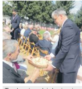
Tradycyjne dzielenie się chlebem