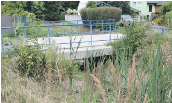
Tak wygląda Potok Nieszkowicki w centrum wsi

– Po moich licznych spotkaniach z przedstawicielami Państwowego Gospodarstwa Wodnego Wody Polskie i wie-