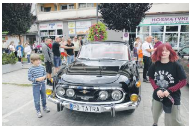
Piękna zabytkowa tatra przyciągała uwagę nie tylko dorosłych, ale także dzieci

organizatorom i uczestnikom za ponowną wizytę w mieście. – Rajd to nie tylko okazja do podziwiania motoryzacyjnych