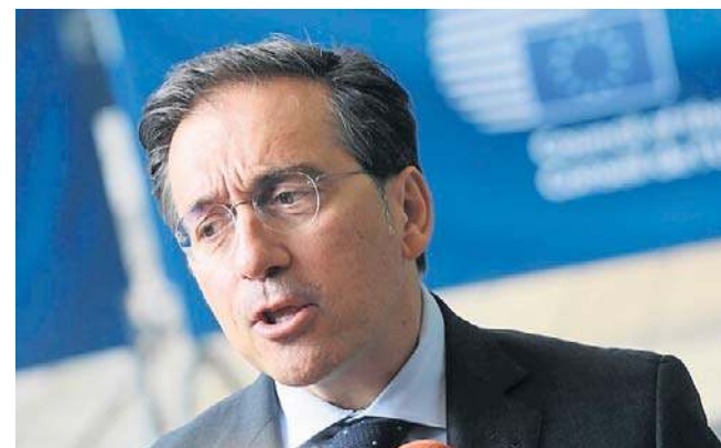
Jose Manuel Albares w Luksemburgu powiedział o propozycji zawieszenia umowy z Izraelem

Decyzja o zawieszeniu umowy stowarzyszeniowej wymaga jedności wszystkich państw członkowskich. PAP