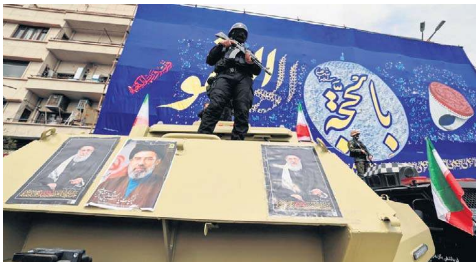
Członek sił specjalnych IRGC stojący na straży pojazdów opancerzonych oklejonych portretami zamordowanego irańskiego najwyższego przywódcy