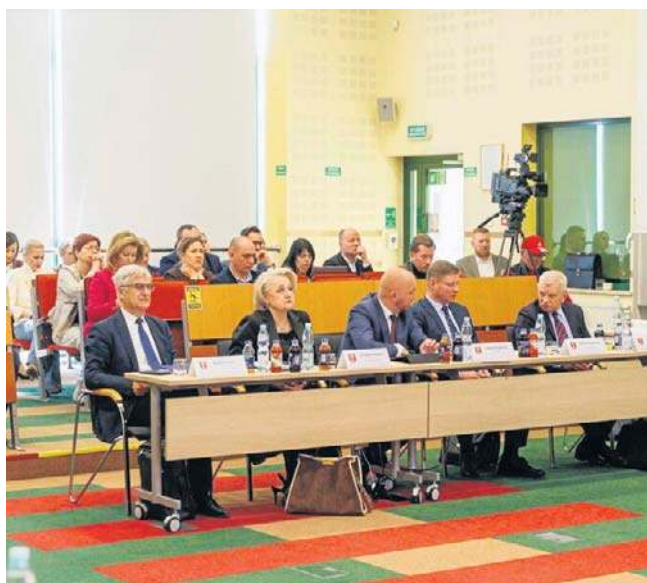
Ostatecznie radni zgodzili się większością głosów sejmikowej koalicji poręczyć kredyt