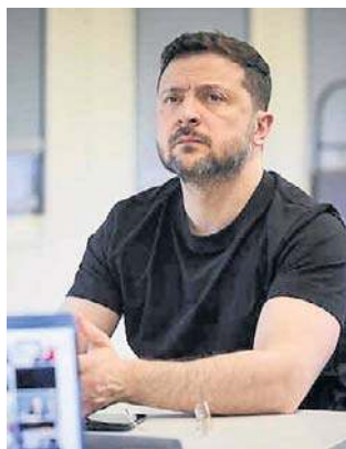
Słowa Zelenskigo wywołały wzbурzenie

Zapytany w tym samym wywiadzie telewizyjnym, czy