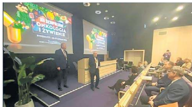
Tegoroczna edycja sympozjum skupiała się na praktycznych aspektach medycyny żywieniowej