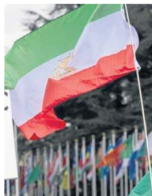
Demonstracje odbyły się na terenie kilku uczelni

Potem studenci starli się z funkcjonariuszami Basij, ochotniczej formacji paramilitarnej, która odegrała znaczącą rolę w stłumieniu poprzednich protestów politycznych. Na filmach