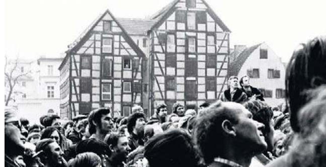
Konkurs bydgoskiej delegatury IPN dla dzieci i młodzieży