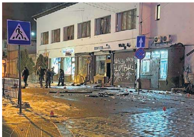
Do dwóch eksplozji doszło, gdy wezwano policję do włamania do sklepu blisko centrum Lwowa

Szef MSW Ukrainy podał, że w zamachu rannych zostało 25 osób. Obecnie w placówkach medycznych przebywa 11 poszkodowanych, z czego sześć funkcjonariuszy jest w stanie ciężkim. PAP