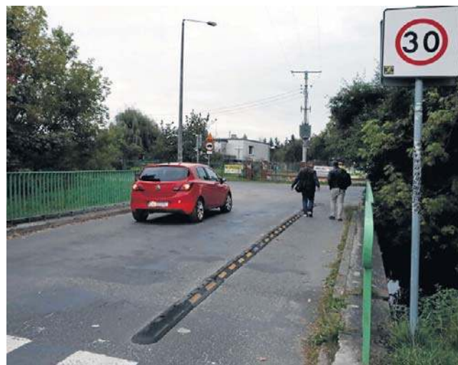
Mostek jest wąski i niebezpieczny przede wszystkim dla pieszych, m.in. uczniów idących do SP nr 4

Od strony ul. Paderewskiego nie będzie dojazdu do Szkoły Podstawowej nr 4, a także prywatnego przedszkola i żłobka „Sikorka”. Ob-