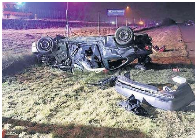
Do tragedii na autostradzie A2 w Brzezinach pod Łodzią doszło 7 stycznia 2023 roku. Rodziny ofiar rozczarowane są tym, jak długi był proces w Brzezinach oraz karą, którą nazwać można tylko symboliczną

- Sąd Okręgowy w Łodzi zaostrzył jednak całość kary.