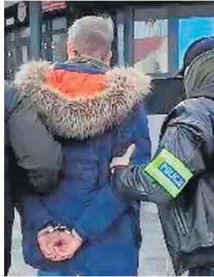
46-letniemu napastnikowi grozi do 5 lat więzienia

- Na efekty pracy funkcjonariuszy nie trzeba było długo czekać. Już następnego dnia kryminalni z bydgoskiej komendy miejskiej oraz komisariatu na Szwederowie ustalili personalia i zatrzymali agre-