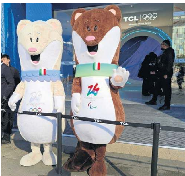
Maskotki XXV Zimowych Igrzysk Olimpijskich i XIV Zimowych Igrzysk Paralimpijskich - gronostaje Tina i Milo

- Skialpinizm miał fenomenalny start, w naprawdę niesamowitej atmosferze - wyjaśnił szef komitetu organizacyjnego.