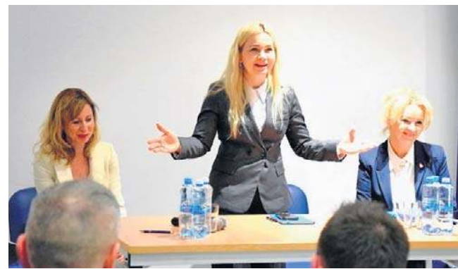
Wiceminister odpowiadała na pytania, m. in. o ceny mleka

Wiceministerem rolnictwa jest dopiero od października 2025 roku, jednak jako polityk i samorządowiec ma już spore doświadczenie. Pochodzi z małej wsi