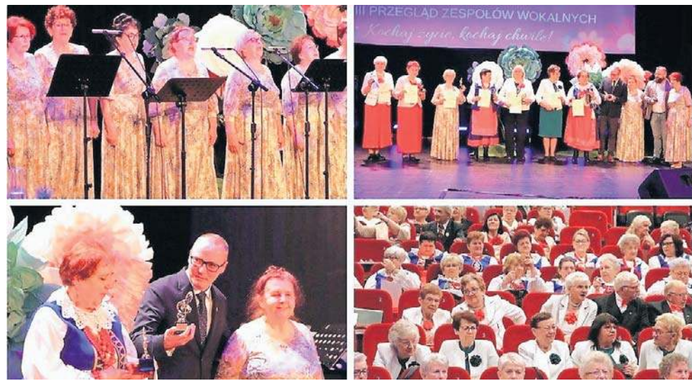
W III Przeglądzie w Barcinie uczestniczyło sześć zespołów z trzech powiatów

Warto podkreślić, że impreza zgromadziła nie tylko wykonawców, ale też liczną grupę widzów, seniorów z powiatów żnińskiego, inowrocławskiego i mogileńskiego.