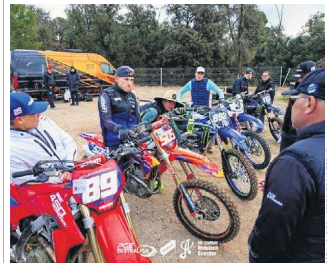
Żużlowcy Pres Toruń pierwszy kontakt z motocyklami w tym roku mają na crossie w Hiszpanii

Tłuchowia zmierzyła się na wyjeździe z - grającymi również w Betclie 3. Lidze (Grupa 1) - rezerwami ekstraligowej Wisły Płock. Zespół z Tłuchowa wygrał 1:0 po голу Wiktora Walczaka w 85. minucie. Warto dodać, że obie połowy trwały po godzinie. W sobotę o godz. 12 w pierwszym ligowym spotkaniu rundy wiosennej Tłuchowia zagra na wyjeździe z Flotą Świnoujście.