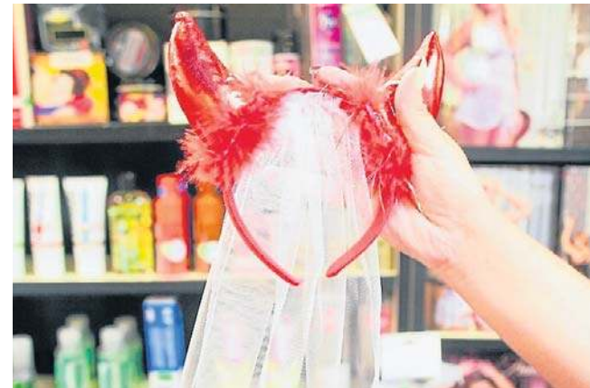
Sklepy oferowały kuszącą bieliznę

tycznego tygodnika i postanowili wspólnie zapoznać. Tygodnik z ich zdjęciami trafił do kiosków w Błazkach. Para została natychmiast rozpoznana. Młodzi ludzie wstydziły się wyjść na ulicę. Tłumaczyli potem, że nie zarobili dużo, starczyło na spłacenie długu w sklepie.