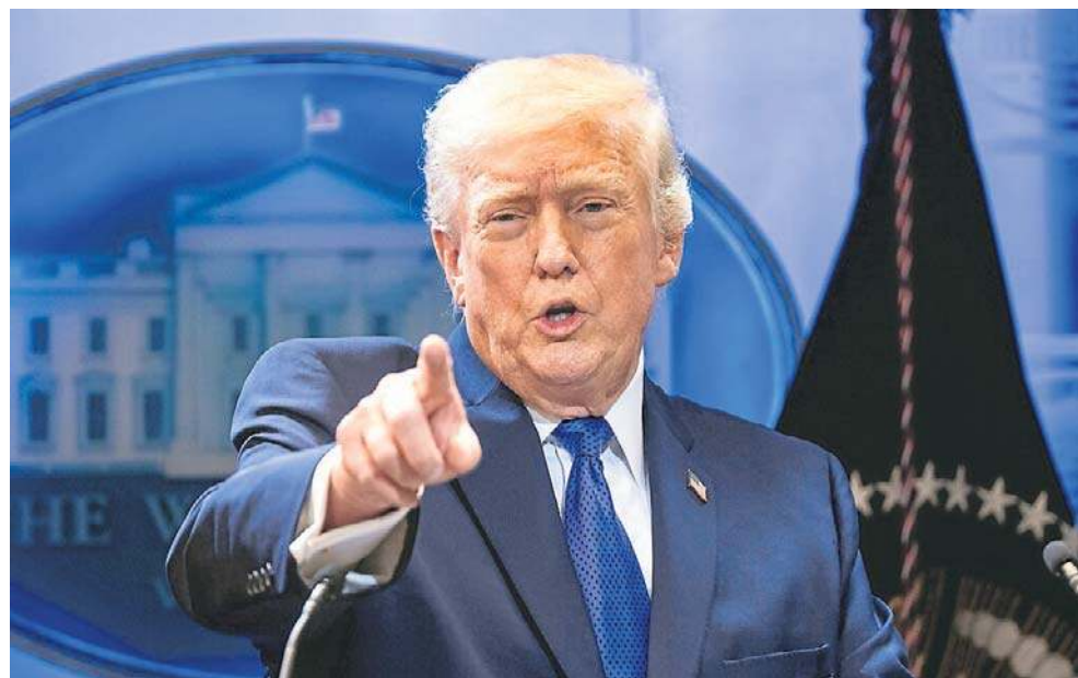
Prezydent USA Donald Trump na konferencji prasowej skrytykował decyzję Sądu Najwyższego, który unieważnił większość jego ceł

Po piątkowej decyzji Sądu Najwyższego o unieważnieniu ceł nałożonych przez prezydenta