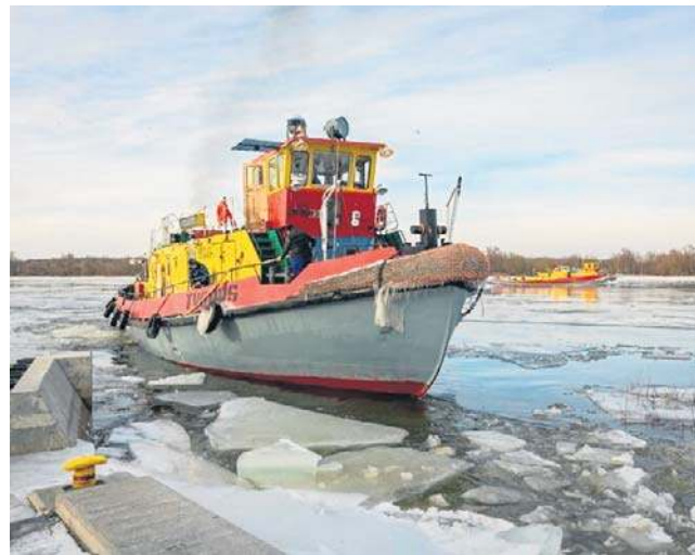
Zespół lodołamaczy: Tygrys, Rekin, Orka i Foka pracują na czele akcji. Krusząc i rozbijając pokrywę lodową

Dzięki takim działaniom poziom wody obniża się, a zagrożenie powodziami maleje. - Aby usunąć zator lodowy, nie wystarczy rozbić lód w jednym miejscu. Konieczne jest zapewnienie pełnej drożności rzeki na długim odcinku, tak aby połamana kora mogła swobodnie odpłynąć wraz z nurtem - informuje RZGW.