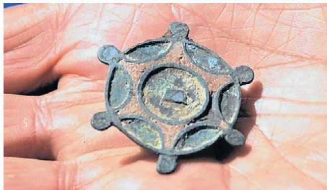
Zgromadzone na wystawie eksponaty pozwolą odbyć symboliczną podróż przez kilka historycznych epok

Wystawa w Domu Rodziny Jana Kasprowicza w Szymborzu czynna będzie od 28 lutego do 28 czerwca br. Oglądać można ją w godz. otwarcia tej filii Muzeum im. Jana Kasprowicza. Szczegóły na stronie internetowej placówki. ©©