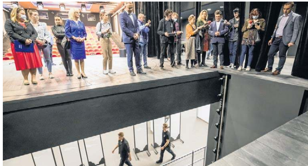
Jednym z beneficjentów jest bydgoski Teatr Kameralny im. Wandy Rucińskiej, który na zakup wyposażenia otrzyma 303 tysięcy złotych

- Rozbudowana infrastruktura techniczna otwiera nowe możliwości realizacyjne, po-