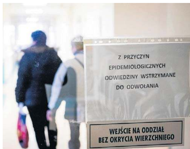
Szpitalne w Kujawsko-Pomorskiem ograniczają odwiedziny w związku z sezonem grypowym

Ważtowny wzrost liczby chorych zmusza dyrekcje szpitali do wprowadzenia nadzwyczajnych obostrzeń. W związku z dużą liczbą zachorowań na grype i inne infekcje niektóre szpitale wprowadziły czasowe ograniczenia odwiedzin.