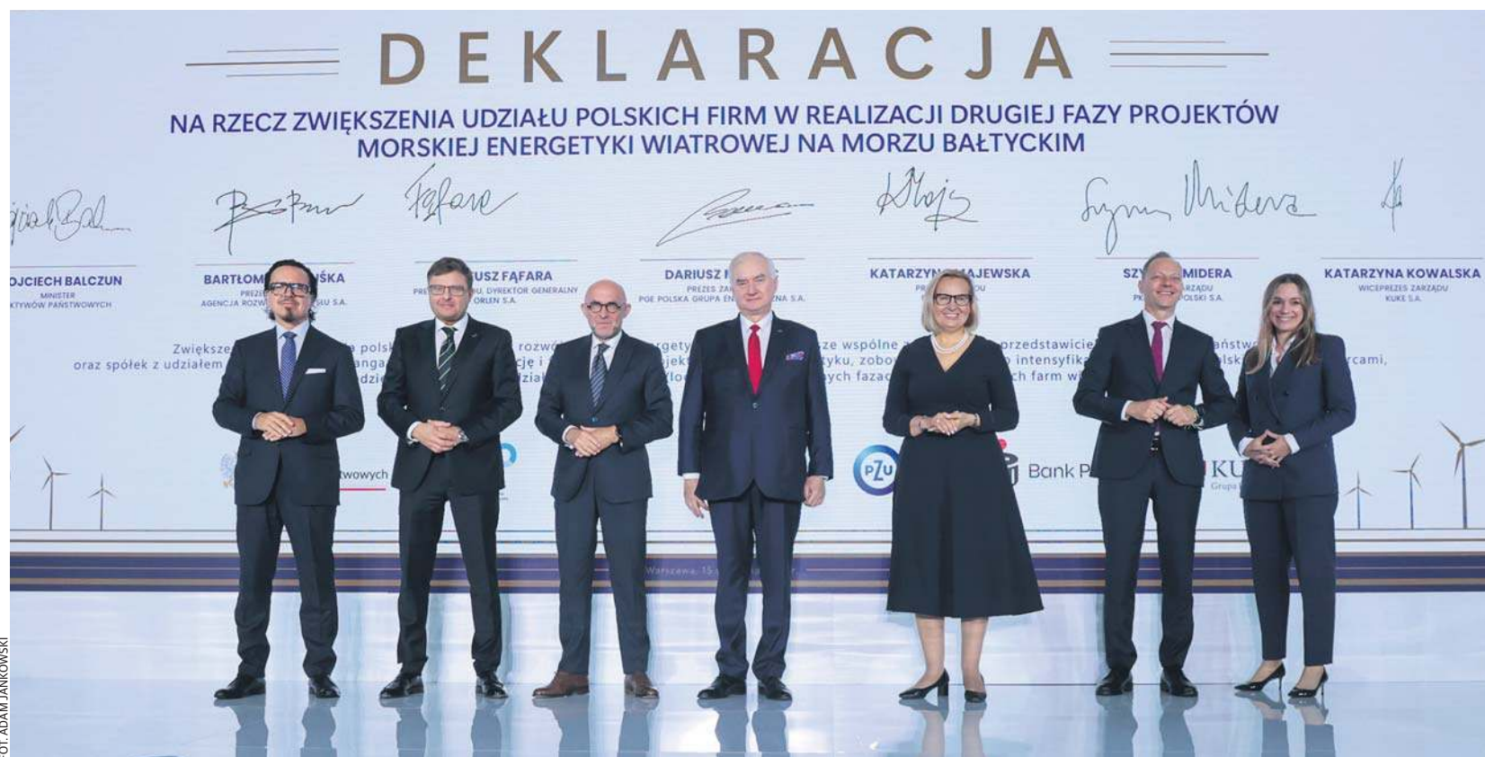
II edycja Forum „Energia z Polski”. Podpisanie deklaracji o udziale polskich firm w budowie morskich farm wiatrowych.

Wydarzenie odbywa się pod hasłem „Wind Factory of Europe” i jest adresowane szczególnie do sektora małych i średnich przedsiębiorstw (MŚP). Dzięki swojej elastyczności i innowacyjności to właśnie one mogą stać się strategicznymi