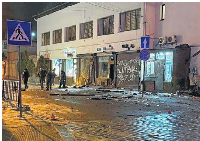
Do dwóch eksplozji doszło, gdy wezwano policję do włamania do sklepu blisko centrum Lwowa

Szef MSW Ukrainy podał, że w zamachu rannych zostało 25 osób. Obecnie w placówkach medycznych przebywa 11 poszkodowanych, z czego sześćdziesięciu funkcjonariuszy jest w stanie ciężkim. PAP