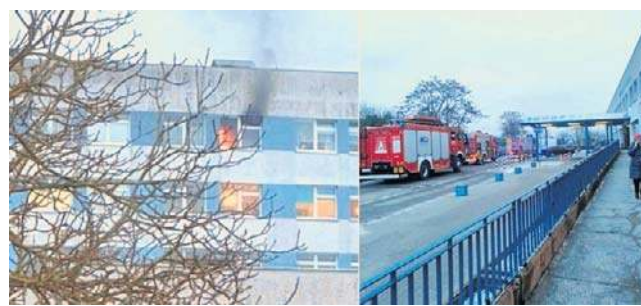
W związku z pożarem wstrzymano przyjęcia pacjentów

Jak wynika z komunikatu, całkowicie wstrzymano przyjęcia na Oddział Laryngologiczny i Oddział Okulistyczny. W przypadku pozostałych oddziałów ograniczenia dotyczą