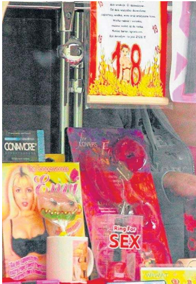
W latach 90. nikt nie zasłaniał witryn

- Przed jedną z ustawionych tam budek, przypominających wóz Drzymały, stała długa kolejka złożona z samych mężczyzn - wspomina. - Zaciekało mnie, co tam się dzieje. Okazało się, że był to rodzaj peep shopu. W budce było małe okienko