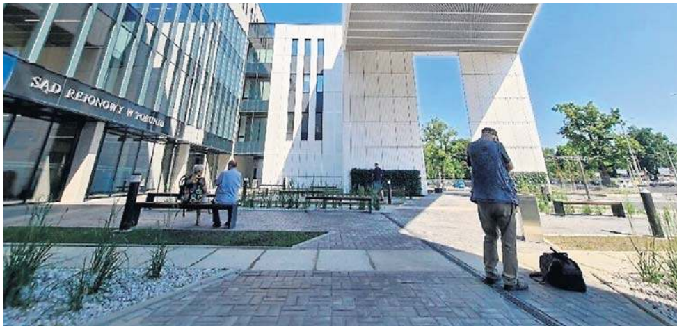
Proces znanego społecznika oskarżonego o znęcanie się nad żoną prawniczką i dziećmi oraz o gwałt, toczy się w Sądzie Rejonowym w Toruniu 6 rok