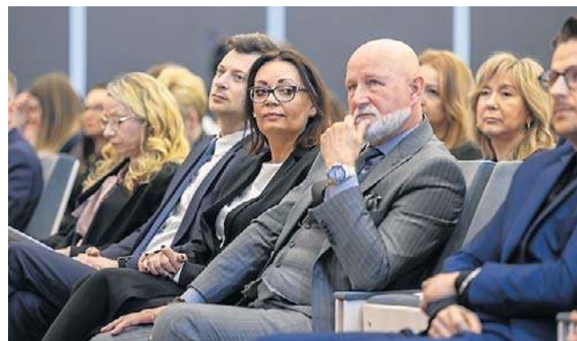
W piątek w auli CM UMK przy ul. Jagiellońskiej zorganizowano konferencję „Nauka dla wszystkich”

Kadra naukowa z 17 Katedr przygotowała 22 tematy zajęć. Młodzież mogła m.in.: zbadać zawartość kwasu acetylosalicylowego w lekach, dowiedzieć się, co kryje w sobie włos i dlaczego łysiejemy, samodzielnie sporządzić powstałe preparaty