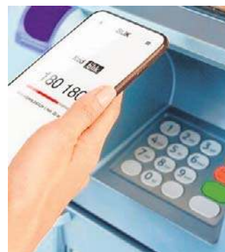
Coraz mniej bankomatów

Spółka tłumaczy to względami ekonomicznymi i koniecznością ograniczenia narastających strat. Ocenia, że obecny system rozliczeń z Polskim Standardem Płatności nie pokrywa kosztów utrzymania bankomatów. Argumentuje, że obsługa takich wy-