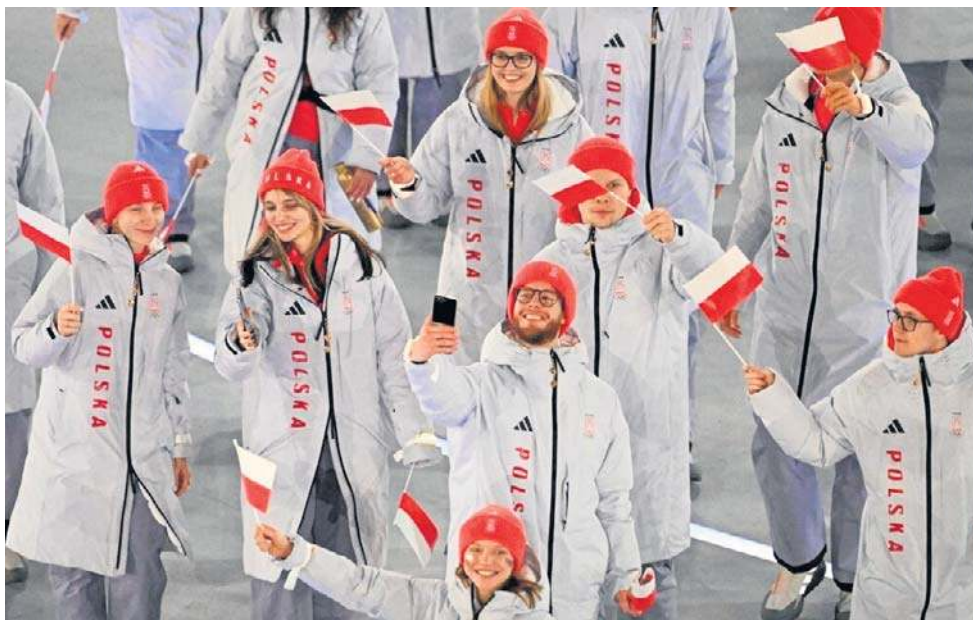
Reprezentanci Polski zdobyli cztery medale na igrzyskach olimpijskich we Włoszech

Cieszymy się, że okres dwunastu lat bez medalu dla Polski w łyżwiarstwie szybkim na igrzyskach został wreszcie zakończony. Poza medalem