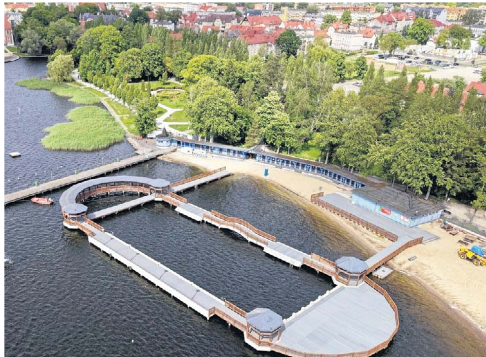
Projekt znajduje się obecnie na liście rezerwowej Zintegrowanych Inwestycji Terytorialnych.

Pierwszym krokiem do realizacji inwestycji było wyłonienie wykonawcy dokumentacji projektowej. Spośród sze-