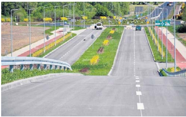
Łącznik ulic Szczecińskiej i Strefowej tuż przed oddaniem