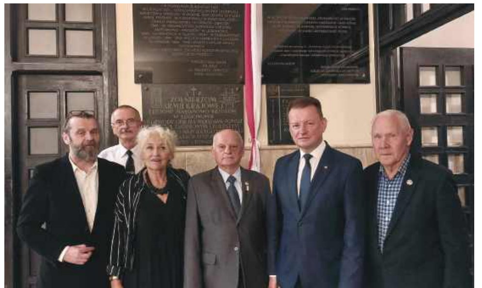
W Legionowie odsłonięto tablicę pamiątkową