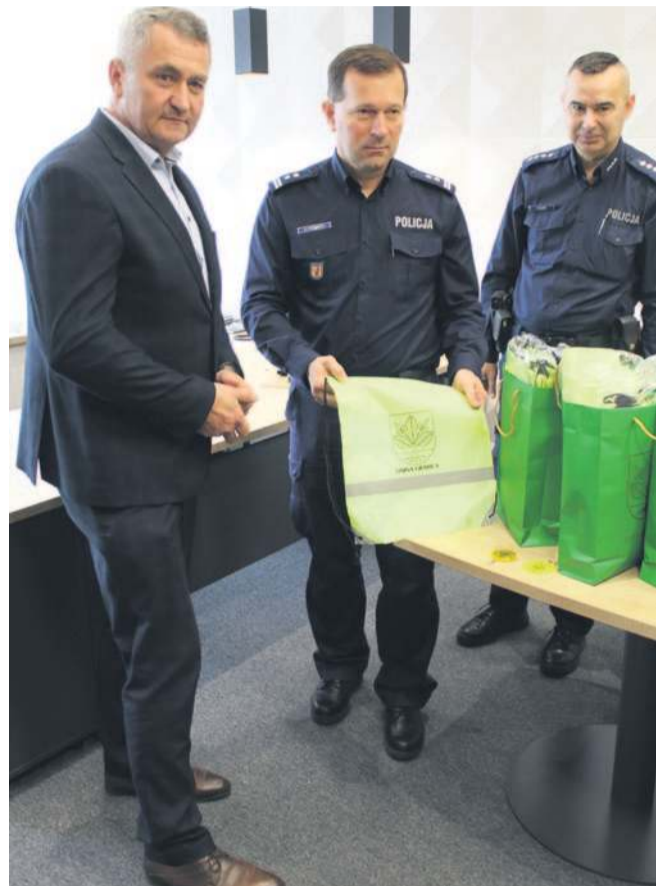
wszystkich uczestników ruchu drogowego. #daj się zauważyć #noś odblaski# - to nie tylko hasło, to nasz wspólny cel!