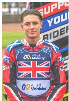
Anglik postawił na flat track i już pierwsze starty pokazały, że nie był to przypadkowy wybór.