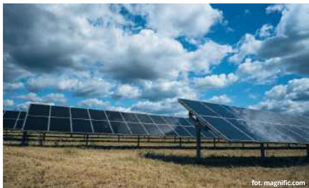
Spółka z Warszawy chce wybudować w Dorohusku farmę fotowoltaiczną. Procedury administracyjne w tej sprawie trwają.

Warszawska spółka Enpower Dorohusk została wezwana do uzupełnienia raportu o oddziaływaniu na środowisko naturalne. O dodatkowe wyjaśnienia wystąpił Regionalny Dyrektor Ochrony Środowiska w Lublinie. Firma musi doprecyzować