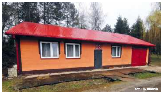
fol. UG Rudnik

Planowana inwestycja obejmuje szeroki zakres prac modernizacyjnych. W obu budynkach mają zostać wykonane m.in. docieplenie, wymiana stolarki okiennej i drzwiowej oraz modernizacja instalacji wewnętrznych. W planach jest także montaż nowoczesnych systemów ogrzewania opartych o odnawialne źródła energii, w tym pomp ciepła i instalacji fotowoltaicznych. Uzupełnieniem mają być energooszczędne systemy oświetlenia oraz rozwiązania