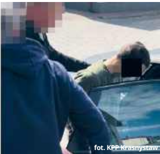
Areszt i surowa kara

Śledztwo wykazało, że duet ten działał na szeroką skalę. Policjanci powiązali ich z podobnymi oszustwami w Zamościu, Świdniku oraz Lubartowie. Łącznie czterech seniorów straciło przez nich ponad 180 tysięcy złotych. Podczas przeszukania samochodu, którym poruszali się mężczyźni, funkcjonariusze znaleźli również środki odurzające.