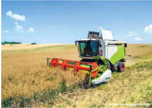
Gmina Leśniowice przygotowuje się do realizacji inwestycji, która będzie polegała na budowie dojazdu do pól w miejscowości Leśniowice.

Urząd poinformował, że pewną część budżetu, jaki został zabezpieczony na pokrycie wszystkich kosztów, stanowią środki z województwa lubelskiego. W zakresie koniecznych prac pojawiły się między innymi roboty przygotowawcze, wykonanie całej konstrukcji drogi - podbudowy z gruntu stabilizowanego cementem, podbudowy z kruszywa łamanego, nawierzchni z mieszanek mineralno-bitumicznych grysowych, warstwy wiążącej asfaltowej, nawierzchni z mieszanek mineralno-bitumicznych grysowych oraz finalnej warstwy ścieralnej asfaltu.