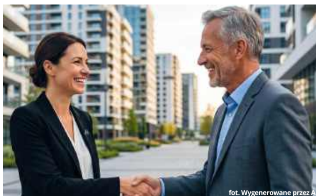
fol. Wygenerowane przez AI

Straty te wynikają z kilku kluczowych obszarów, z których najpoważniejszym jest złe oszacowana cena ofertowa. Brak dostępu do rzeczywistych cen transakcyjnych sprawia, że właściciele często albo odstrasza