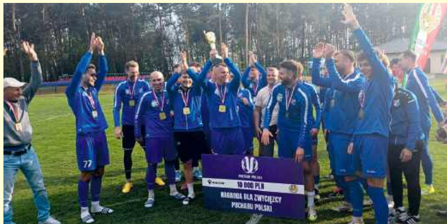
fot. Start Krasnystaw

lubelskim 2:0 pokonała Lewart Lubartów, zaś w okręgu zamojskim Hetman Zamość 1:0 wygrał z Tomasovią Tomaszów Lubelski. Finał mają jeszcze do rozegrania Orleńscy Podlaski i Podlasie Biała Podlaska, które zmierzą się ze sobą 20 maja. MP