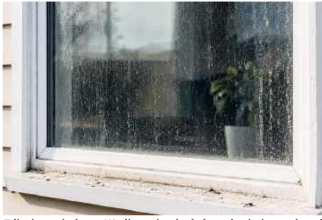
Zdjęcie poglądowe. Według mieszkańców pył osiada na oknach i parapetach nawet kilka razy w tygodniu.

Według relacji przedstawionej na komisji hałas ma być wyraźnie odczuwalny w okolicy, a dodatkowym problemem jest pył. Najbardziej obrazowy był opis codziennych problemów mieszkańców. Jak wskazywano, pył ma osiadać na oknach i pose-