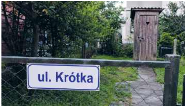
Zdjęcie poglądowe. Nie przedstawia rzeczywistej posesji ani konkretnego miejsca przy ul. Krótkiej.

Z wypowiedzi radnego wynika, że problemem nie są pieniądze. Mieszkanka posesji jest gotowa sfinansować wykonanie przyłącza we własnym zakre-