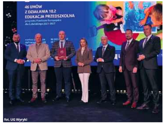
Ujęcie: UG Wyryki