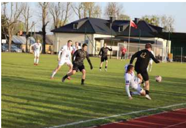
Unia Rejowiec - Astra Leśniowice