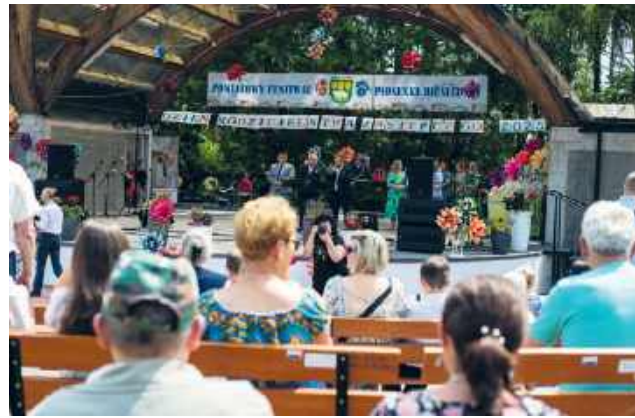
Amfiteatr w Nowinach podczas imprez tętni życiem.