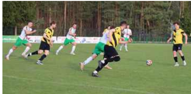
Vitrum Wola Uhruska - Eko Różanka