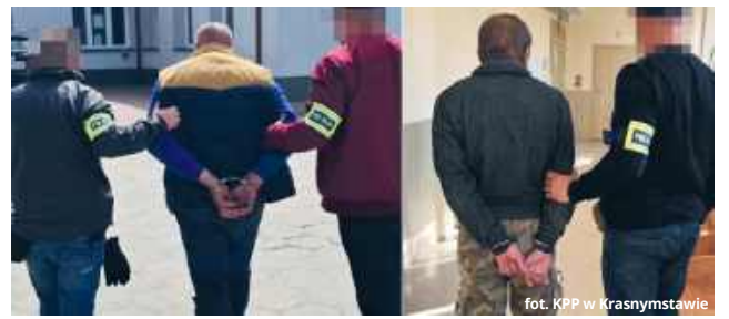
fort. KPP w Krasnymstawie

Agresja narastała, aż przerosła się w drastyczną przemoc fizyczną. Podczas jednej z ostatnich