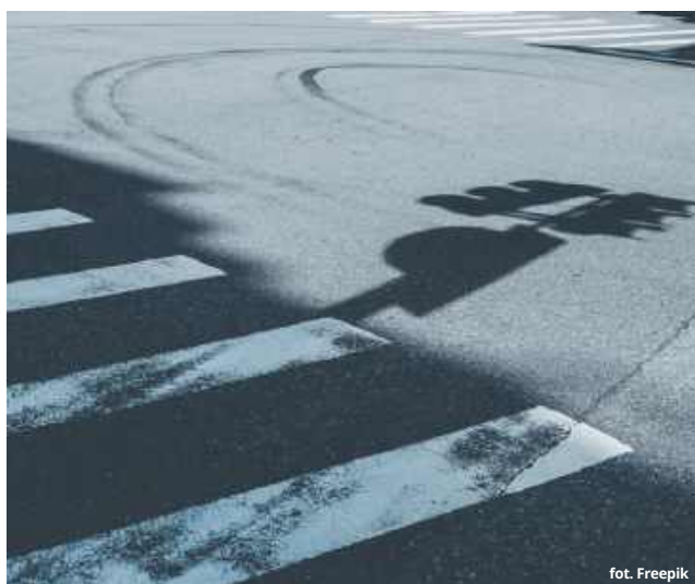
O dodatkowe przejście dla pieszych gmina zabiega już od dłuższego czasu. W tej chwili trudno jednak powiedzieć, kiedy konkretnie mieszkańcy mogliby skorzystać z nowej infrastruktury.