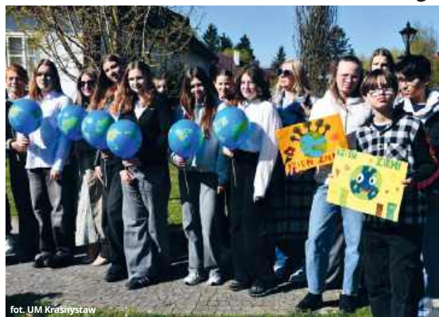
fol. UM Krasnystaw

To właśnie tam posadzono klon palmowy. Wybór nie był przypadkowy. Drzewo to uznawane jest za symbol harmonii, równowagi i piękna natury. Wyróżnia się charakterystycznymi, powycinanymi liśćmi oraz dużą zmiennością kolorystyczną – od