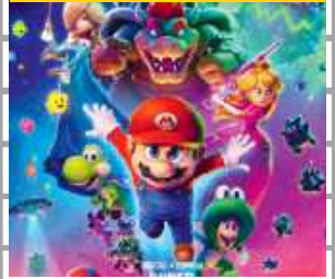
Przygodowy, Animacja, Komedia

Po tym jak Mario i Luigi udaremnił plan Bowsera na poślubienie Księżniczki Peach, muszą teraz zmierzyć się z nowym zagrożeniem ze strony jego syna. Bowser Jr. jest zdeterminowany, by uwolnić swojego uwięzionego ojca i przywrócić potęgę swojej rodziny. Z pomocą starych i nowych sojuszników bracia wyruszają w międzygwiazdową podróż, przemierzając kolejne planety, aby powstrzymać ambitnego dziedzica i jego niebezpieczną misję.