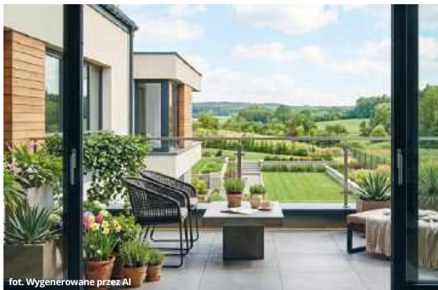
fol. Wygenerowane przez AI

To najlepszy moment na prezentację domu. Agenci Północ Nieruchomości podają kluczowe powody, dla których warto zorganizować dzień otwarty właśnie teraz. To przede wszystkim efekt „First Impression” i duża rola ogrodu.