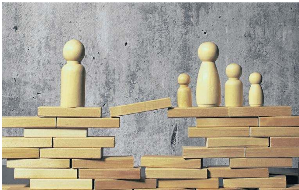
Po sądowych bitwach o pieniądze na dzieci i awanturach przepaść w rodzinie rośnie.

Oczywiście i niemieckie sądy indywidualizują poszczególne przypadki i nie są zobowiązane do sztywnego trze-