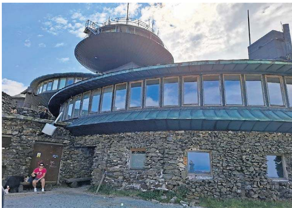
Do 2015 roku czynne były toalety i restauracja. Dziś dolny spodek jest zamknięty.