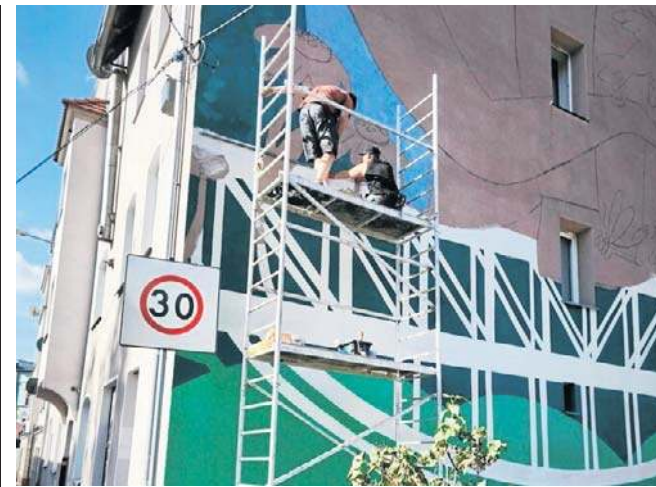
FOT. UM WAŁBRZYCH/WAŁBRZYCH MOJE MIASTO

Podkreślił, że tego rodzaju szkolenia są niezwykle potrzebne. Tego rodzaju umiejętności mogą bowiem przydać się podczas służby, ale i w różnych sytuacjach w prywatnym życiu. ©©