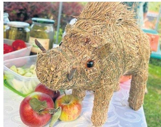
Widzieliście kiedyś dzik z siana? Był jedną atrakcją wiejskiego, ziemniaczanego pikniku w Kolicach.