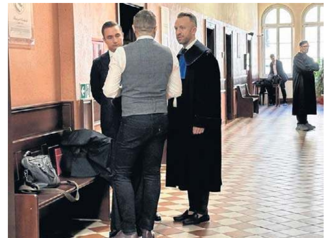
Strony procesu prezentują zupełnie odmienne stanowiska.