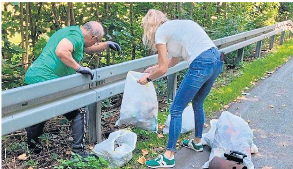
Akcja rozpoczęła się 20 września o godz. 10.00. Pracy było na dobre kilka godzin.