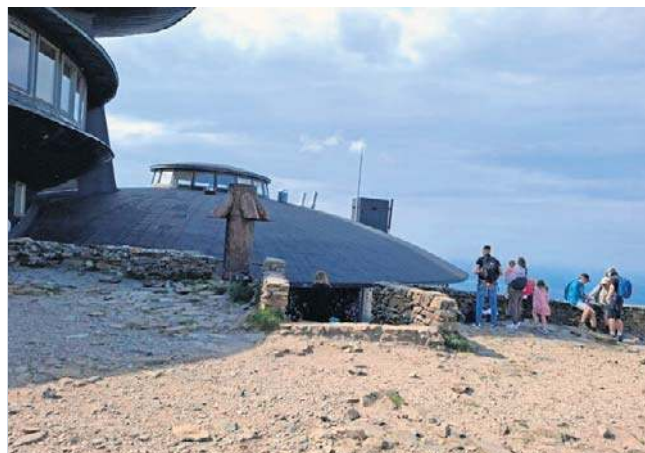
Codziennie setki ludzi stoją w kolejkach do WC, które są przy bufecie oraz stacji kolei linowej po czeskiej stronie.