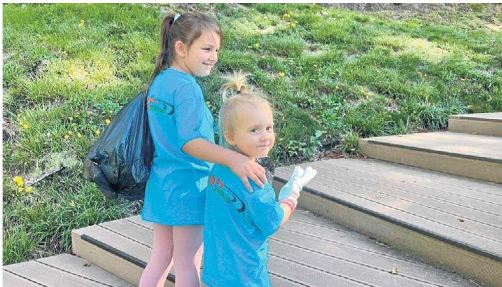
Młodzi ludzie wyruszyli z workami w rękach z Parku Aktywności „Czarodziejska Góra”.