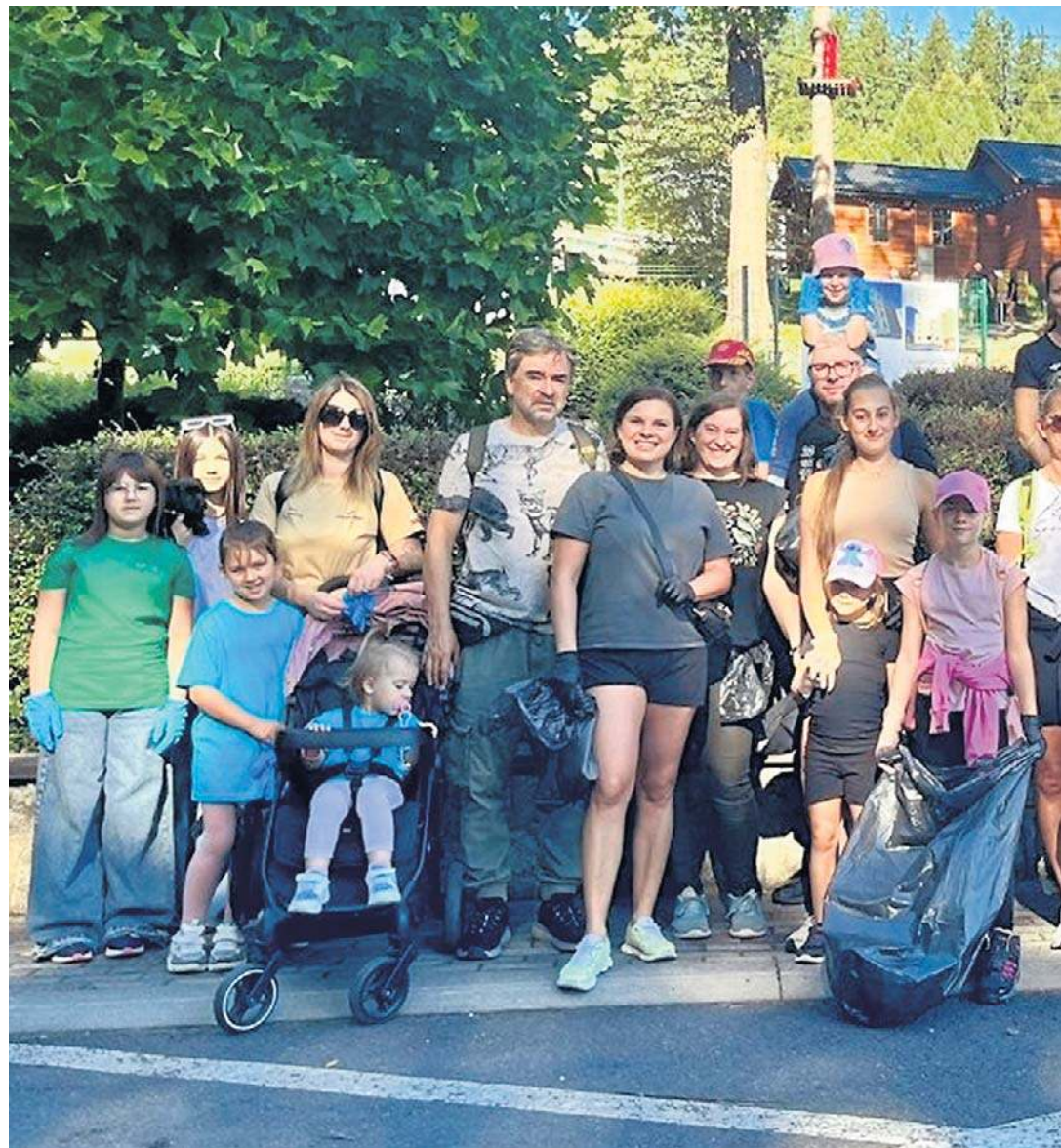
„Sprzątanie Świata” było w Jedlinie-Zdroju bardzo udane. Jego uczestnicy czuli satysfakcję, że