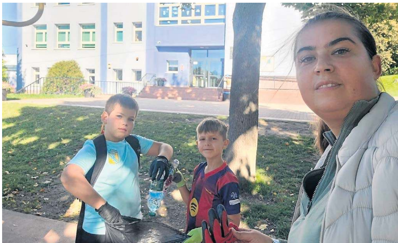
Akcję, mocno wspieraną przez Centrum Kultury w Jedlinie-Zdroju nazwano „Z Naturą w Kulturę”. Trafnie, prawda?