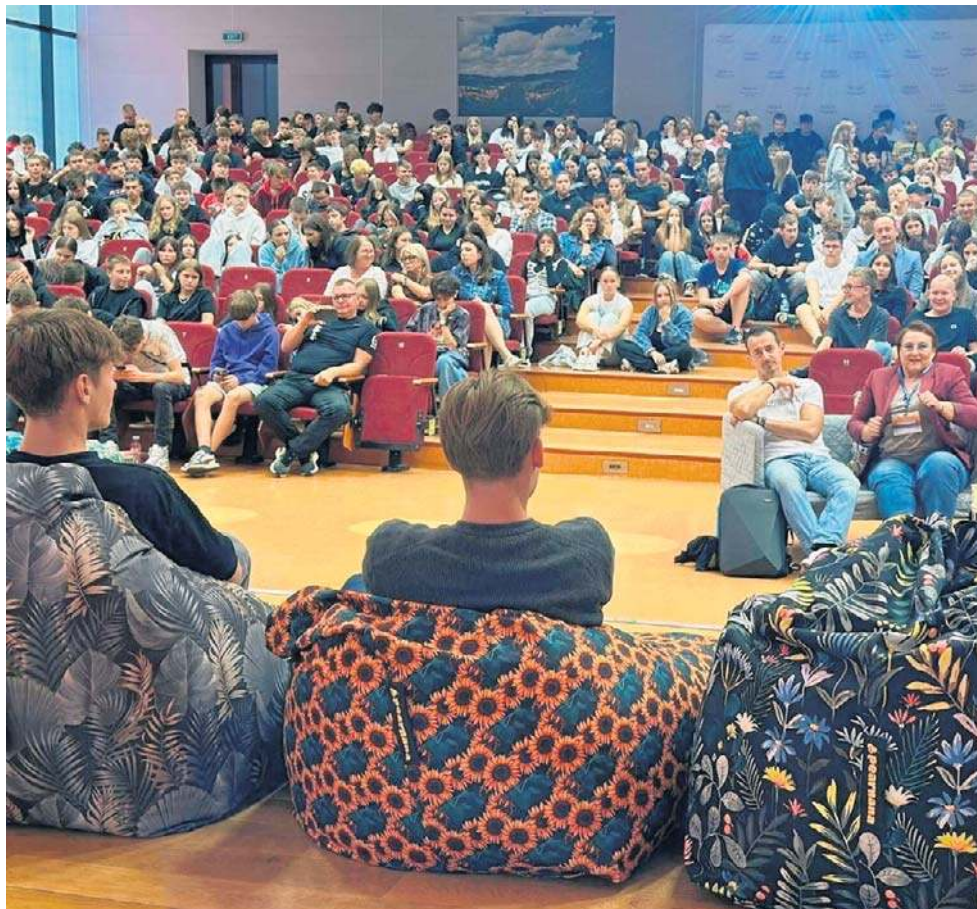
Druga edycja Festiwalu „Uzależnieni od życia” miała świetną frekwencję - 1,2 tys. osób!

Rozmowa pokazała, że młodzi ludzie mogą wszystko. Wystarczy, że odnajdą swą pasję i energię, by dzielić się nią z innymi. Taka była też idea Festiwalu. Miał być impulsem, zara-