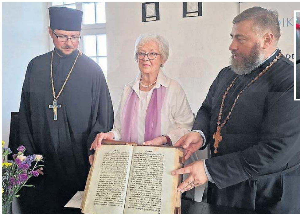
XVIII-wieczna księga wróciła do Supraśla i powiększyła zbiory biblioteki w Akademii Supraskiej.