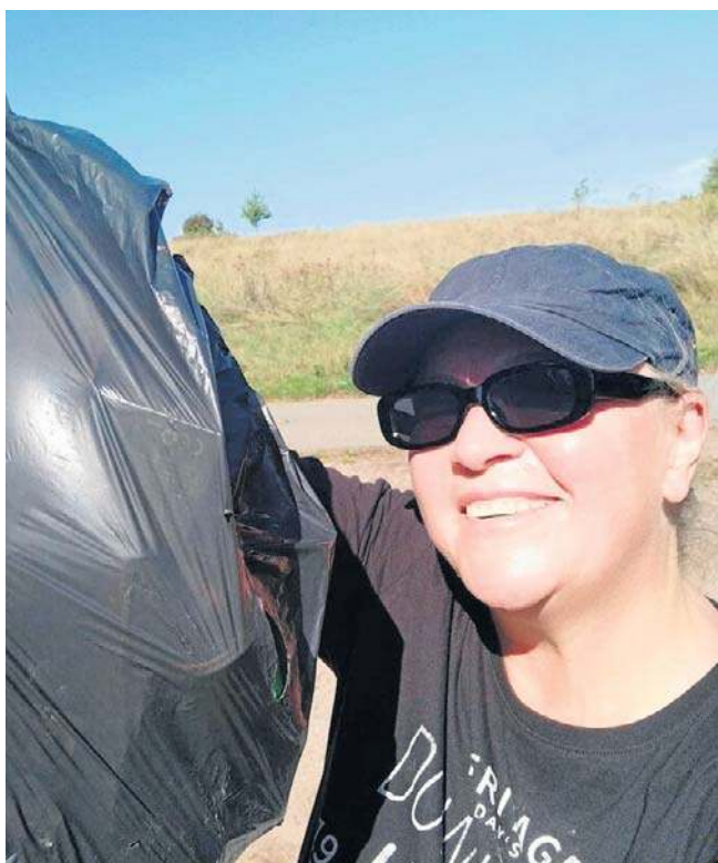
Pogoda dopisała, więc praca na świeżym powietrzu była bardzo przyjemna. No i te „trofea”!