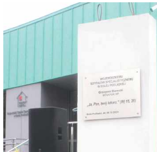
Tablica od senatora Grzegorza Biereckiego

- Genialne. Mówią, że najlepsze pomysły to są te najprostsze, wtedy są rzeczywiście także genialne (cytat za tygodnikiem „Sieci”) - tak lubelski poseł chwalił projekt ustawy przygo-