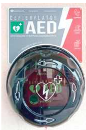
Defibrylator znajduje się przy głównym wejściu do budynku szkoły

Defibrylator to przenośne urządzenie, które automatycznie analizuje rytm serca i w