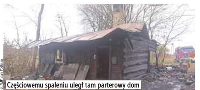
Częściowemu spaleniu uległ tam parterowy dom