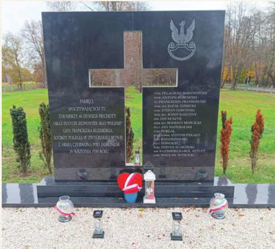
Grob żołnierzy poległych w zwycięskim starciu z Sowietami pod Jabłoniem otoczony jest troską mieszkańców

Jabłoń, podobnie jak wszystkie okoliczne miejscowości, ma bogatą i urozmaiconą historię, przeżywała wiele zmian. Co najmniej od XVI wieku istniała tu parafia prawosławna, potem unicka, pod wezwaniem Świętej Trójcy. W czasie rozbiorów, po powstaniu styczniowym, przekształcono ją, tym razem pod policyjny przymusem,