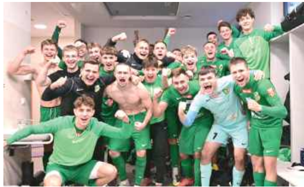
Podlasie punktuje na wyjazdach wyśmienicie!

Podlasie Biała Podlaska kontynuuje swoją znakomitą passę na wyjazdach. Podopieczni trenera Macieja Oleksiuka pokonali 1:0 Stal Kraśnik, pokazując, że drużyna, która miała walczyć o utrzymanie, spokojnie może plasować się w czołówce tabeli III ligi.