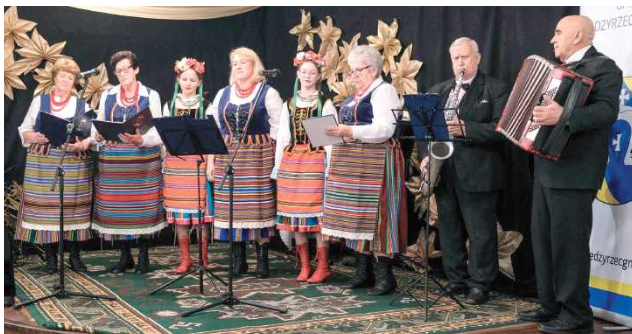
Na scenie zaprezentowało się wiele zespołów z gminy Międzyrzec Podlaski oraz z okolicznych gmin

Nie zabrakło także zaprzyjaźnionych zespołów z sąsiednich miejscowości, które dodały wydarzeniu jeszcze