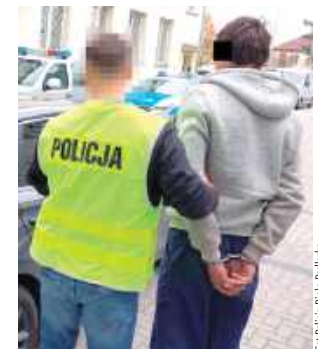
24-latek pod wpływem i bez uprawnień

Białscy policjanci zatrzymali 24-letniego mężczyznę z Ukrainy, który kierował samochodem pod wpływem alkoholu i narkotyków. To nie jego jedyne przewinienia, a więc lada moment może zostać wydany z naszego kraju.