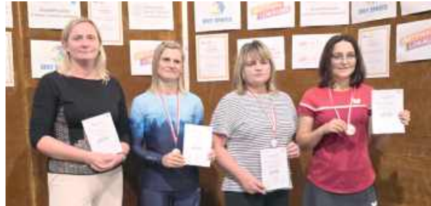
Uczestnicy rywalizowali w czterech kategoriach wiekowych, podzielonych na dziewczęta/kobiety oraz chłopcy/mężczyźni