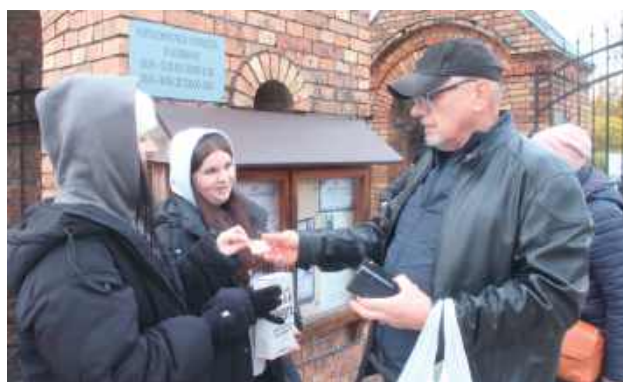
Pan Wojciech uważa wspieranie kwesty za obowiązkowe

W Białej Podlaskiej już kolejny rok kwesta zaczęła się w przeddzień Wszystkich Świętych. Organizujące zbiórkę datków na rzecz renowacji nagrobków na cmentarzach Białej Podlaskiej Koło Białczan zachęca do udziału w akcji jak największej liczby uczniów z białskich szkół.