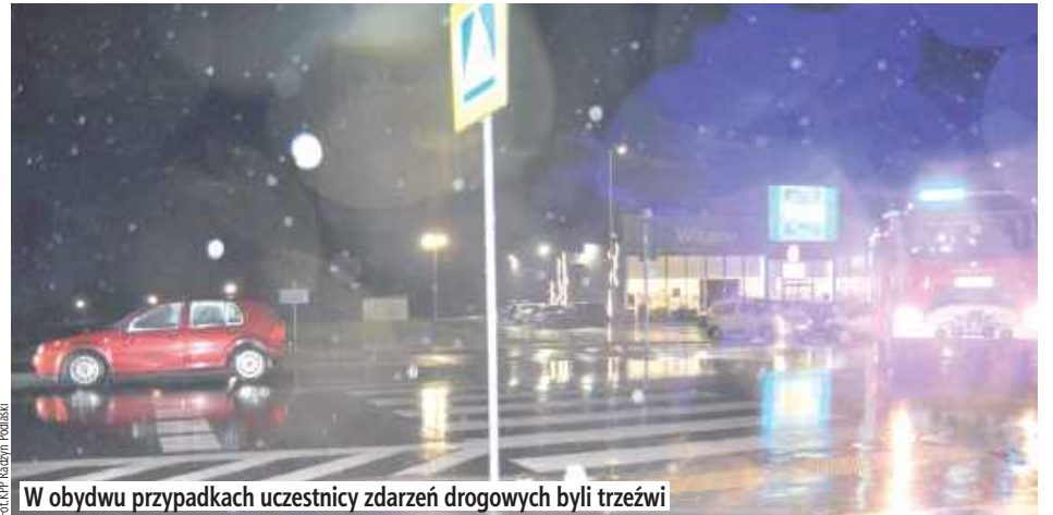
W obydwu przypadkach uczestnicy zdarzeń drogowych byli trzeźwi

- Ze wstępnych ustaleń policjantów radzyńskiej drogówki wynika, że kierujący samochodem osobowym marki Audi A3 37-letni mieszkaniec gminy Radzyń Podlaski potrącił pieszą, która przechodziła przez jezdnię na przejściu dla pieszych - informuje komisarz