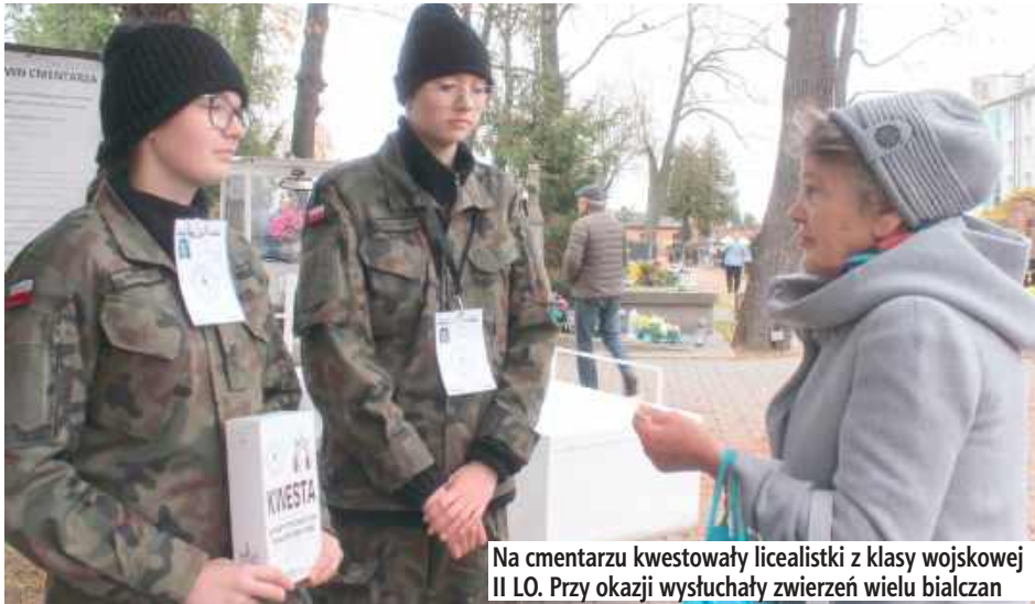
Na cmentarzu kwestowały licealistki z klasy wojskowej II LO. Przy okazji wysłuchały zwierzeń wielu białczan

W Białej Podlaskiej już kolejny rok kwesta zaczęła się w przeddzień Wszystkich Świętych. Organizujące zbiórkę datków na rzecz renowacji nagrobków na cmentarzach Białej Podlaskiej Koło Białczan zachęca do udziału w akcji jak największej liczby uczniów z białskich szkół.