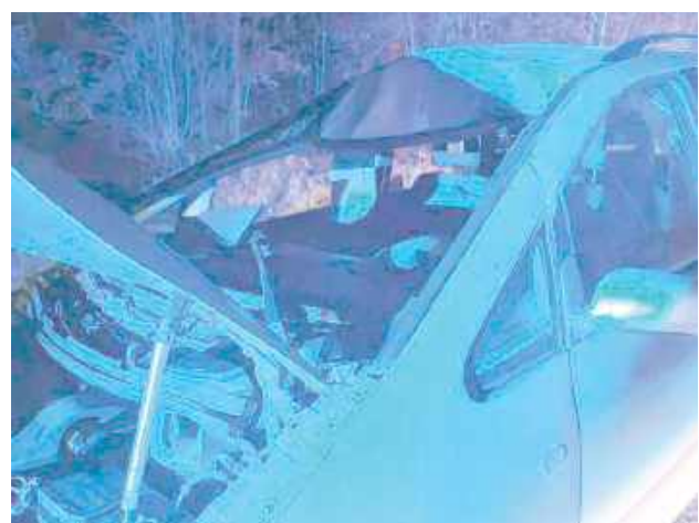
Samochód zderzył się z łosiem

Ochotnicza Straż Pożarna w Czemiernikach poinformowała, że zdarzenie miało miejsce w piątek przed godziną 17. Kierujący samochodem marki Volkswagen zderzył się z łosiem na drodze wylotowej na Radzyń Podlaski. Kierowca doznał lek-