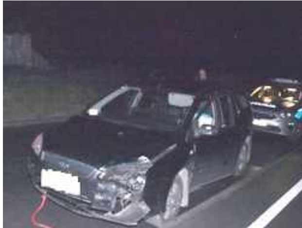
Za kierownicą siedział mężczyzna, który na widok policjantów wysiadł z pojazdu. Jak się okazało, był pod wyraźnym wpływem alkoholu

POWIAT OPOLSKI: Policjanci z opolskiej drogówki zatrzymali 31-letniego mieszkańca powiatu opolskiego podejrzanego o kierowanie pojazdem w stanie nietrzeźwości oraz posiadanie narkotyków.