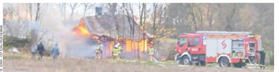
W piątek (31 października) rano doszło do pożaru drewnianego, parterowego domu w miejscowości Ossówka w gm. Leśna Podlaska. Interweniowała m.in. OSP KSRG Hrud

Policjanci z janowskiego komisariatu pod nadzorem proku-