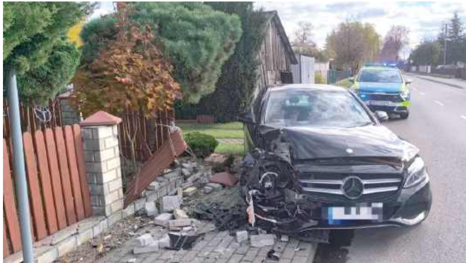
Kierowca podróżował nowym Mercedesem

Prowadzone na miejscu czynności oraz informacje od świadków zdarzenia pozwoli-