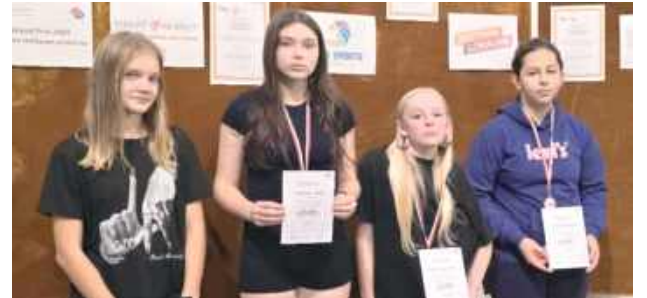
Pierwszych trzech zawodników i zawodniczek w każdej kategorii otrzymało medale, a najlepsza czwórka pamiątkowe dyplomy

Pod honorowym patronatem prezydenta Białej Podlaskiej odbył się IV Turniej Grand Prix w tenisie stołowym amatorów. Organizatorami wydarzenia była Mobilna Akademia Krzewienia Kultury Fizycznej „Respect”.