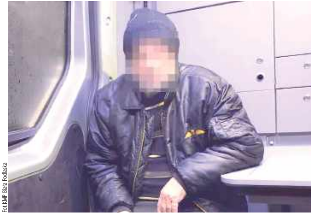
Mężczyzna nie wymagał pomocy medycznej, więc przekazany został poszukującym go funkcjonariuszom

Biała Podlaska: Policjanci, pełniąc służbę na DK-2 w miejscowości Sycyna, zwrócili uwagę na nieoświetlonego cyklistę. Mundurowi ustalili, że mężczyzna to zaginiony 69-latek.