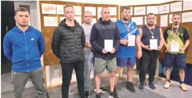
W turnieju wzięło udział łącznie 95 uczestników