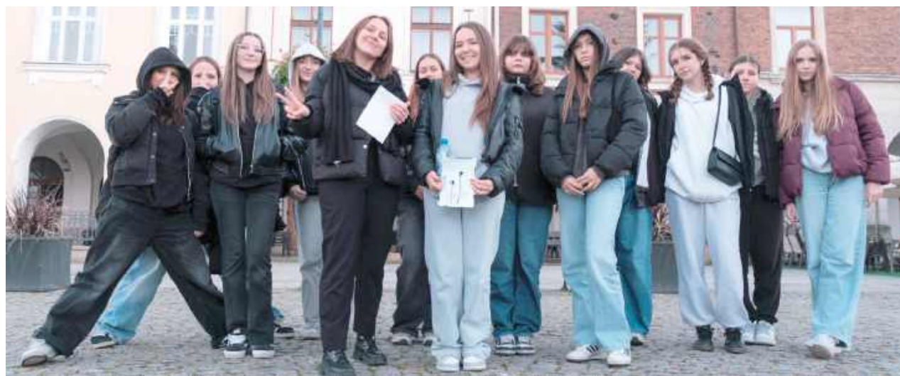
Wyjazd okazał się pełen pozytywnej energii, nowych znajomości i inspiracji. Uczestniczki wróciły z ogromną dawką motywacji do dalszego działania i realizowania nowych inicjatyw w swojej społeczności

Podczas dwudniowego pobytu uczestniczki miały okazję zobaczyć, jak funkcjonują różne formy wolontariatu i aktywności młodzieżowej w innych miejscach, wymienić doświadczenia oraz poznać inspirujących ludzi,