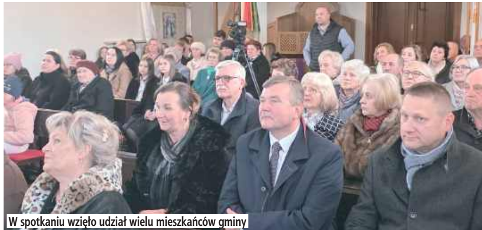
W spotkaniu wzięło udział wielu mieszkańców gminy

W kościele parafialnym pw. Niepokalanego Poczęcia Najświętszej Maryi Panny w Kożuszkach, 19 października odbyła się IX wieczornica poświęcona osobie św. Jana Pawła II. Tegoroczne spotkanie, zorganizowane pod hasłem „Święty Jan Paweł II. Prorok nadziei”, zgromadziło licznie mieszkańców Kożuszek i okolicznych miejscowości.