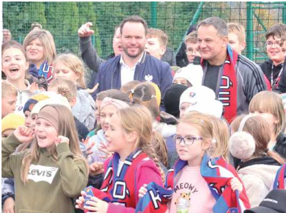
Objekt będzie ogólnodostępny i bezpłatny. Mieszkańcy będą mogli z niego korzystać także w godzinach wieczornych

Kompleks obejmuje boisko do piłki nożnej o wymiarach 34x68 m (płyta 30x62 m) ze sztuczną trawą, boisko wielofunkcyjne do siatkówki, koszykówki, piłki ręcznej i tenisa o powierzchni 23x36 m (płyta 19x32 m) z nawierzchnią poliuretanową, zaplecze sanitarno-szatniowe z dwiema szatniami, pomieszczeniem trenera, magazynem