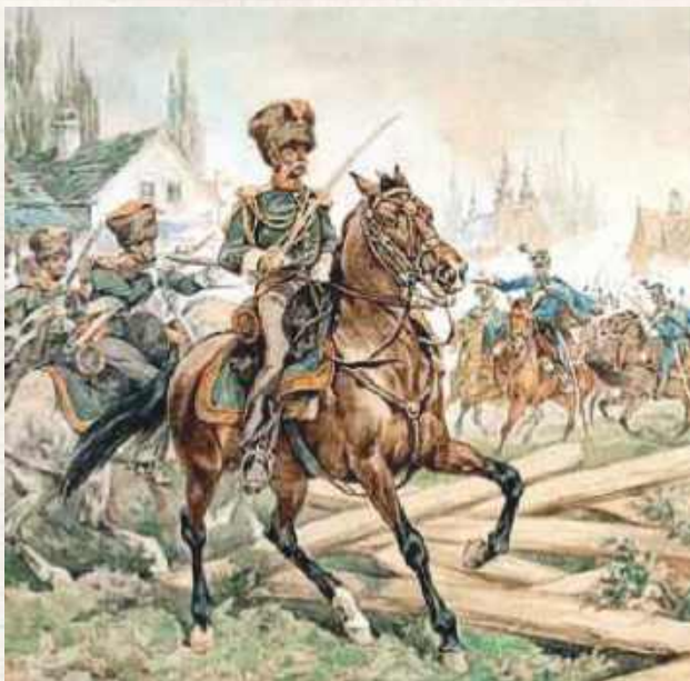
Berek Joselewicz pod Kockiem - fragment obrazu Juliusza Kossaka

Kiedy wybucha powstanie, początkowo angażuje się w służ-