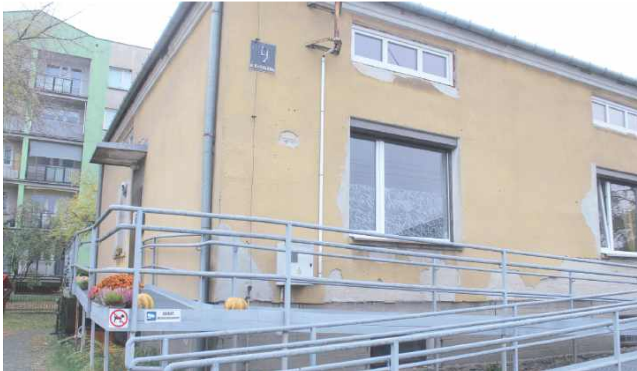
Izabela Kunicka poszukuje osoby lub grupy osób, które chciałyby przejąć i prowadzić białską kociarnię z kotostradą w budynku należącym do Zakładu Gospodarki Lokalowej

- O godz. 6 rano policja dzwoni do mnie, że jest wypadek z kotem. A o godz. 19 poprzedniego dnia musiałam zareagować na podobny sygnał. Trudno to udźwignąć - mówi prezes.