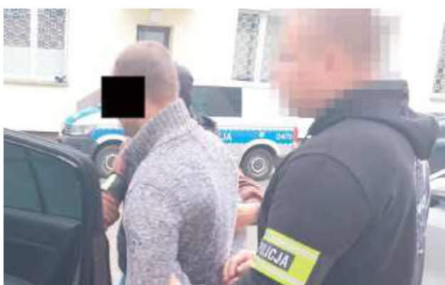
Po zmianie miejsca zamieszkania pokrzywdzonej mężczyzna nie zaprzestał kontaktu z nią oraz dzieckiem

W ubiegłym tygodniu policjanci zatrzymali 33-latkę podejrzanego o fizyczne i psychiczne znęcanie się nad nią, którą już partnerką.