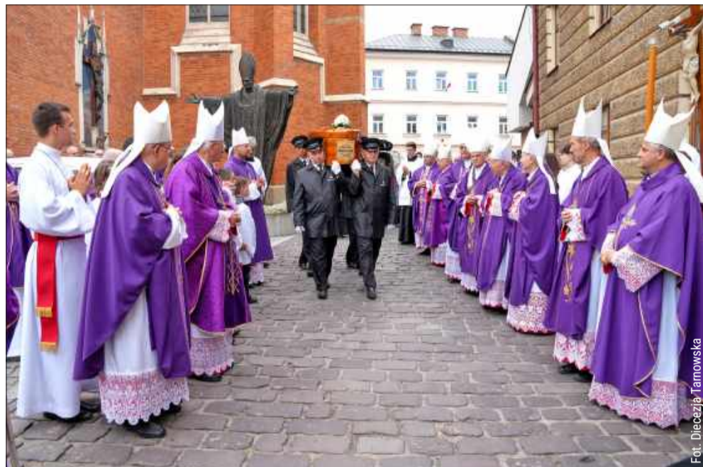
W uroczystościach pogrzebowych wzięły udział setki wiernych.