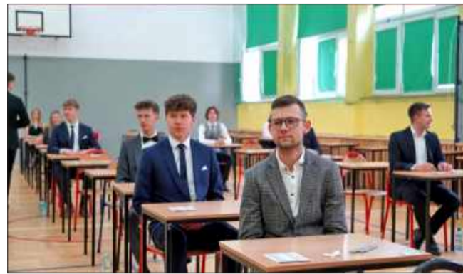
Tak zdali maturę 2025 w Mielcu!

Zespół Szkół Technicznych w Mielcu osiągnął najlepszy wynik w tej kategorii – 88,76% zdawalności . Na 178 absolwentów technikum, aż 158 uzyskało pozytywny wynik z matury.