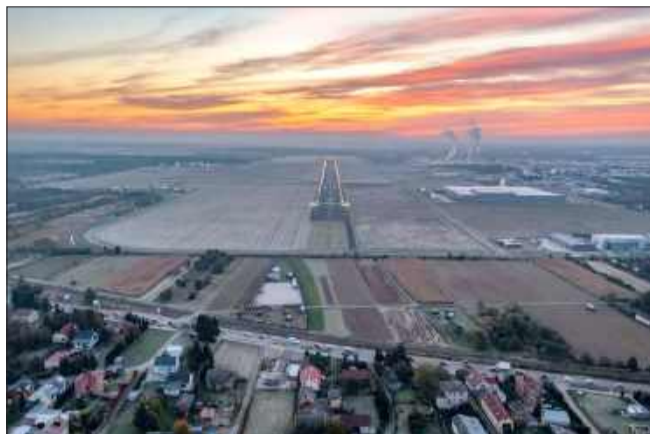
Wzrost zainteresowania Mielcem jest związany z trwającą budową nowych hangarów.

- Lotnisko Mielec było gospodarzem pierwszej w Polsce prezentacji samolotu Cirrus SR22T G7+ z unikatowym systemem Autoland, którego premiera odbyła się 6 maja 2025 roku w USA. Przedstawiciele Cirrus Aircraft sprawdzili również możliwości logistyczne i infrastrukturę hangarową naszego lotniska. Wszystko to