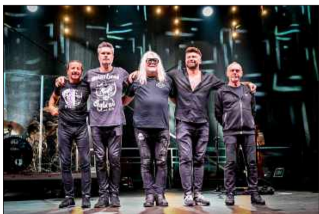
Gwiazda wieczoru - legendarna grupa Ira.