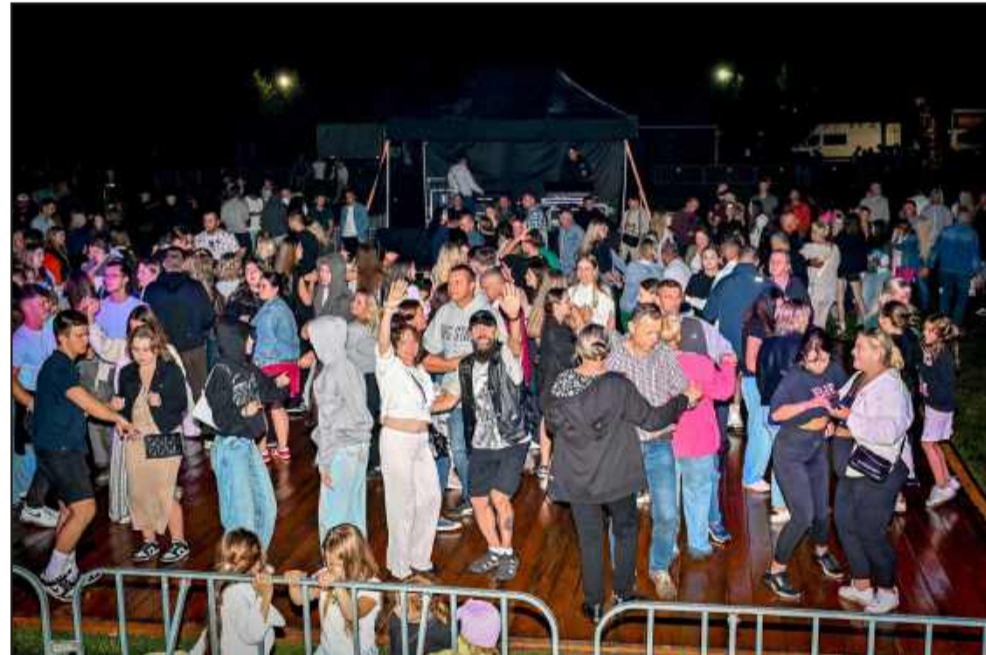
Na podłodze zabawa była przednia.