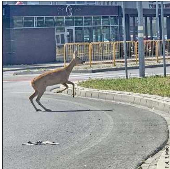
Nietypowy gość w Strefie.

To przypomnienie, że mimo miejskiego charakteru okolicy,