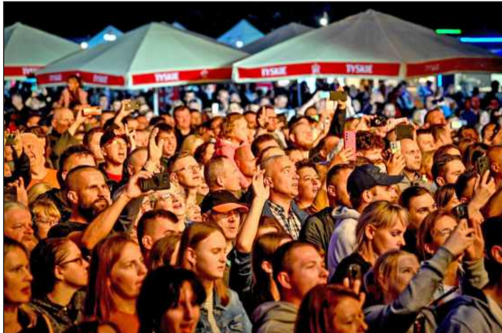
Podczas koncertu zespołu Ira.