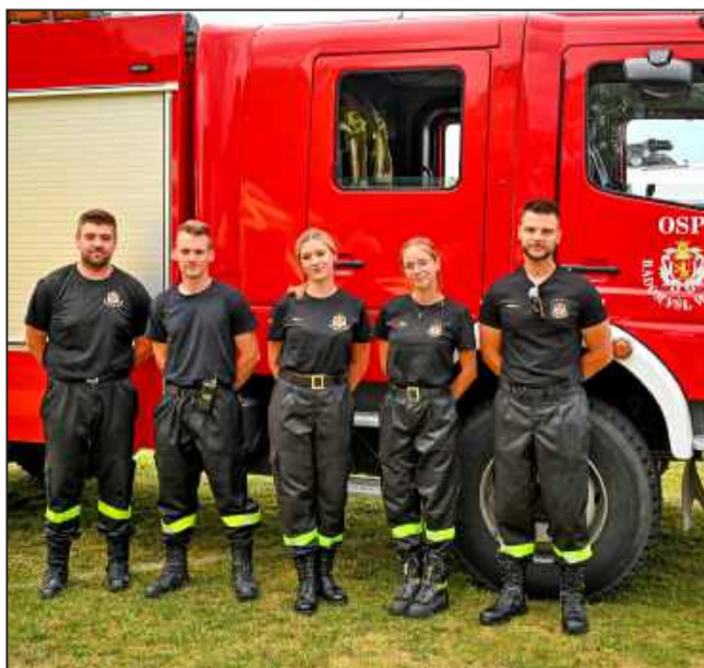
Strażacy jak zawsze w pełnej gotowości.