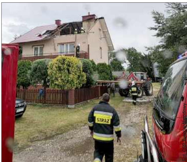
Wichura uszkodziła część dachu na budynku mieszkalnym.

7 lipca jednostka OSP Książnica została zadysponowana przez Stanowisko Kierowania Komendanta Powiatowego PSP w Mielcu do usunięcia drzewa powalonego przez nawałnicę na drodze gminnej w miejscowości