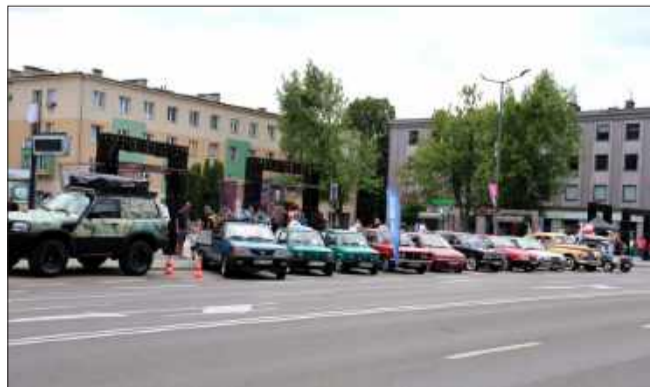
To było prawdziwe święto motoryzacji.

Trzydzieści załóg, które stanęły na starcie miało do przejechania sześć przejazdów w próbach sprawnościowych na trasie wyznaczonej na wiadukcie ze startem i metą na Alei Niepodległości.