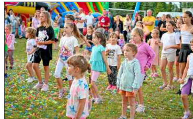
Nie zabrakło atrakcji dla najmłodszych.