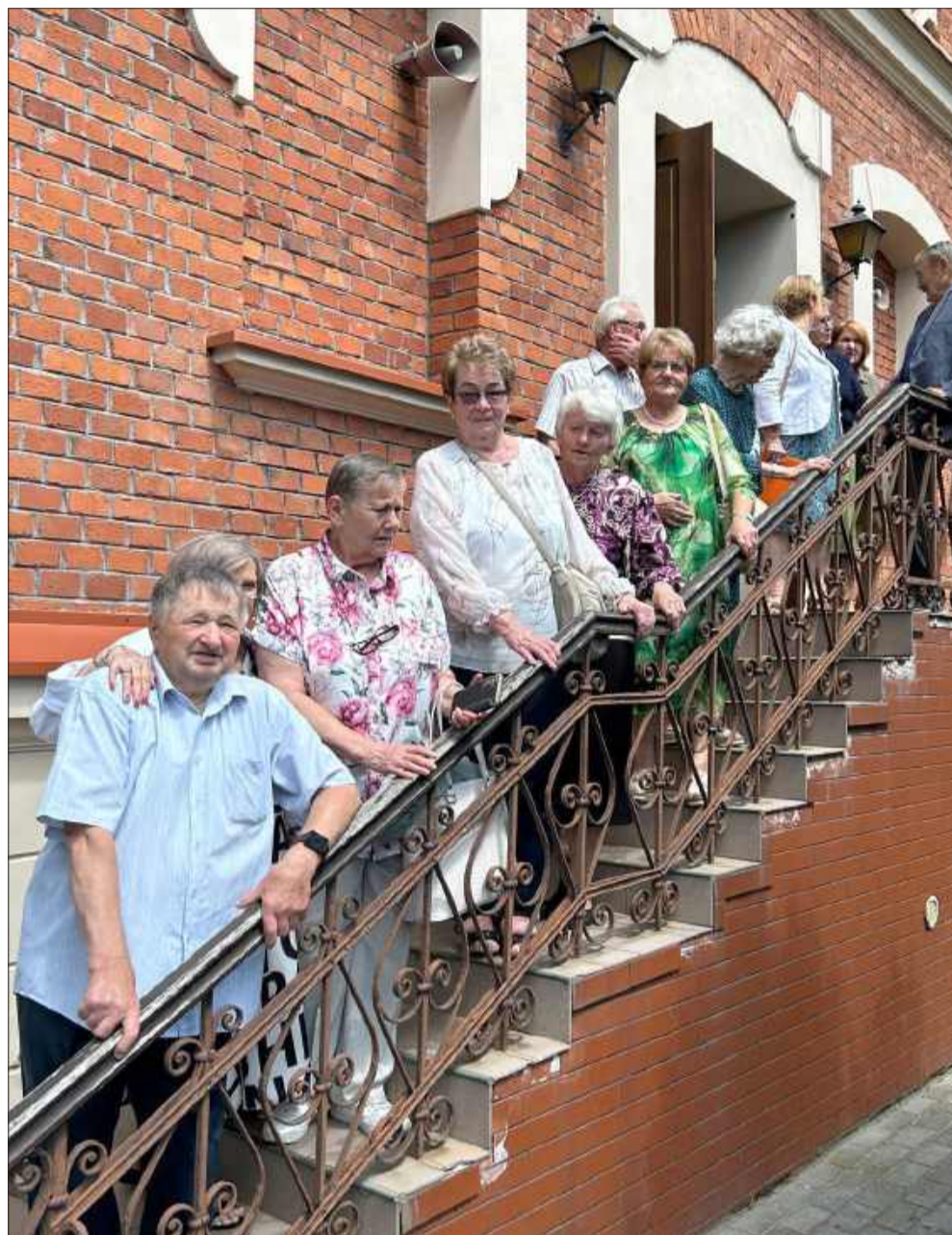
To tutaj wszystko się zaczęło...

Każde spotkanie emanuje ciepłą, rodzinną atmosferą. Wiemy z własnych doświadczeń, że te spotkania są dla nas takim życiodajnym impulsem, do dalszej aktywności. Kryją w sobie wielką siłę, tak, bezsprzecznie - są dla nas źródłem energii.