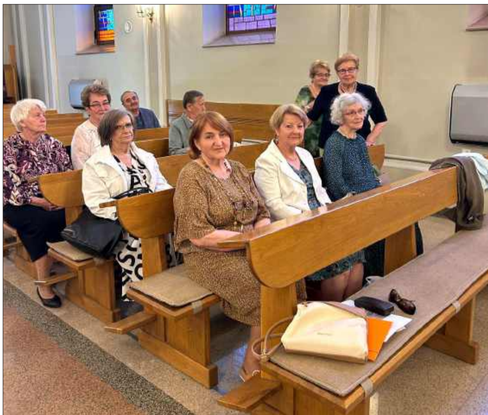
Klasa VB z Liceum Pedagogicznego w Mielcu. Ich przyjaźń przetrwała 60 lat!

25 czerwca absolwenci klasy VB Liceum Pedagogicznego w Mielcu spotkali się, by wspólnie uczcić jubileusz 60-lecia matury. Okrągła rocznica nadała tegorocznemu wydarzeniu szczególny, uroczysty wymiar. Była to nie tylko okazja do wspomnień, wzruszeń i rozmów, ale przede wszystkim – święto przyjaźni, która nie słabnie mimo upływu czasu. Uczestnicy zjechali się z różnych zakątków Polski, by ponownie spotkać się w Mielcu – miejscu, które nigdy nie było ich domem i które do dziś zajmuje szczególne miejsce w sercach. Oddajmy głos jednej z uczestniczek spotkania.