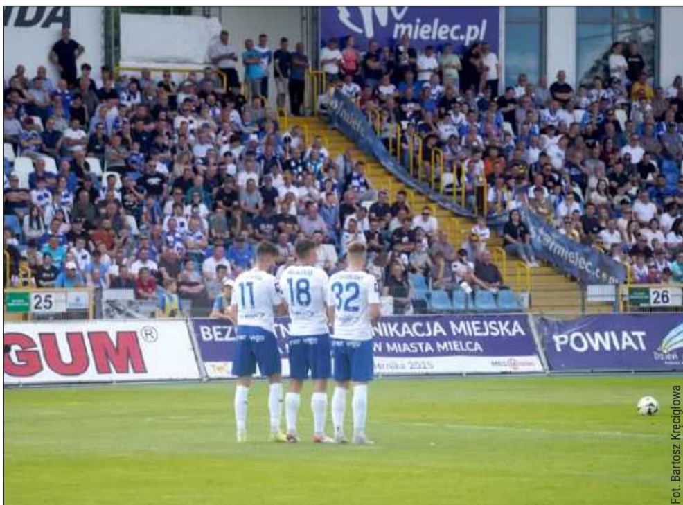
Już wkrótce Stal zacznie rozgrywki w 1 lidze.