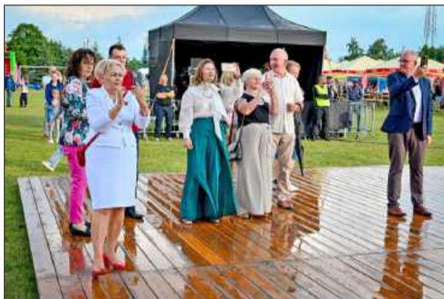
Takie chwile warto uwiecznić!