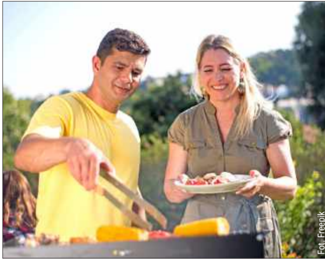
To był najlepszy urlop. Podobno.

– Częstoście się pierniczka-mi – powiedziała wieczorem, wyciągając puszkę.