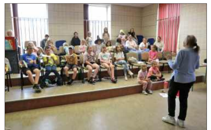
Dom Kultury w Mielcu zaprasza dzieci na bezpłatne warsztaty wakacyjne.

Warto podkreślić, że wszystkie warsztaty są bezpłatne, a ich program został przygotowany