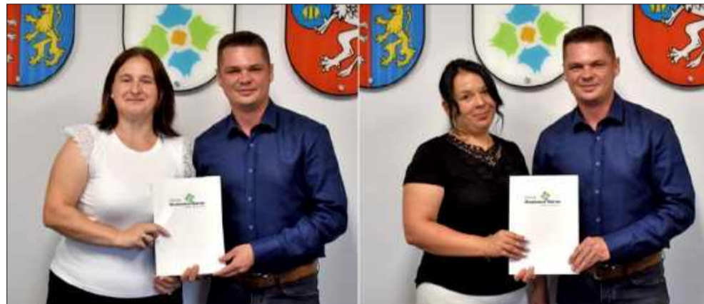
Dwie nauczycielki z Gminy Wadowice Górne awansowały na stopień nauczyciela mianowanego.

To nie tylko formalność – stopień nauczyciela mianowanego to wyraz uznania dla wieloletniej pracy, rozwijanych kompetencji oraz codziennego zaangażowania w edukację młodych mieszkańców naszej gminy.