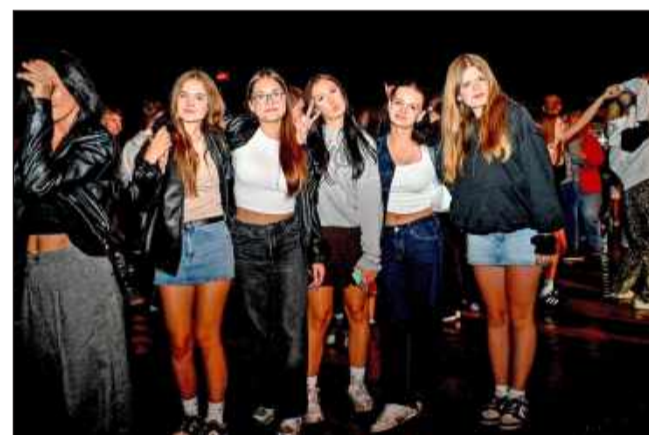
Może i było błotniście, ale za to atmosfera gorąca!