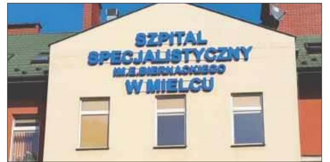
Mielecki szpital pod lupą radnych.

– Może trzeba zrobić promocję na Facebooku, opłacić post sponsorowany z informacją, że każdy ma prawo napisać skargę. Będzie więcej pracy dla nas jako komisji, pewnie i dla dyrektora szpitala też. Tylko po co? Wystarczy przecież zadbać o dwie rzeczy: pediatrę i nocną opiekę świąteczną. No i może SOR poprawić. Przecież są wzory, gdzie to działa – trzeba tylko chcieć podpatrzyć – podkreślał.