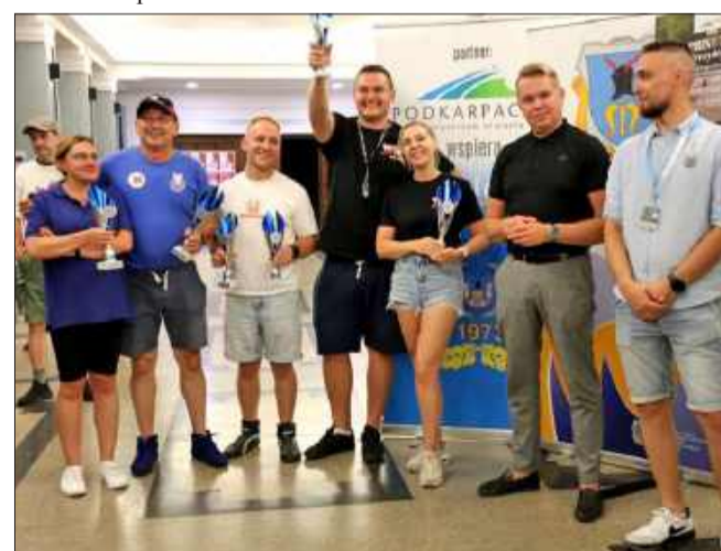
Klasyfikację generalną zdominowały załogi Automobilklubu Stomil Dębica.