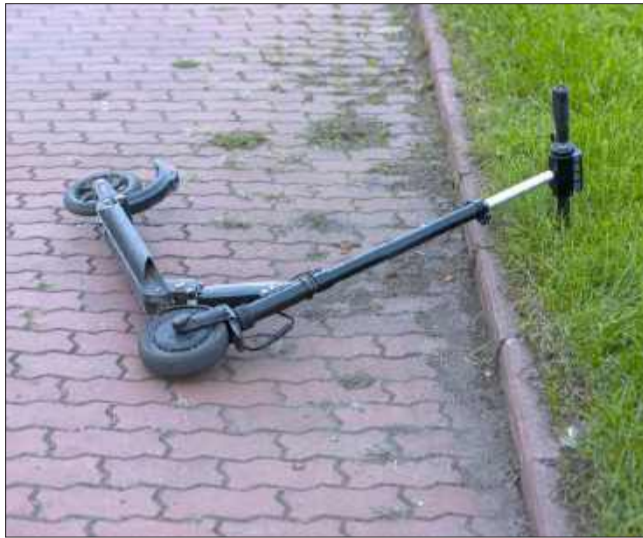
Czytelnik zwraca uwagę na problem hulajnóg elektrycznych.

Te obawy potwierdzają również lekarze i służby. Z danych