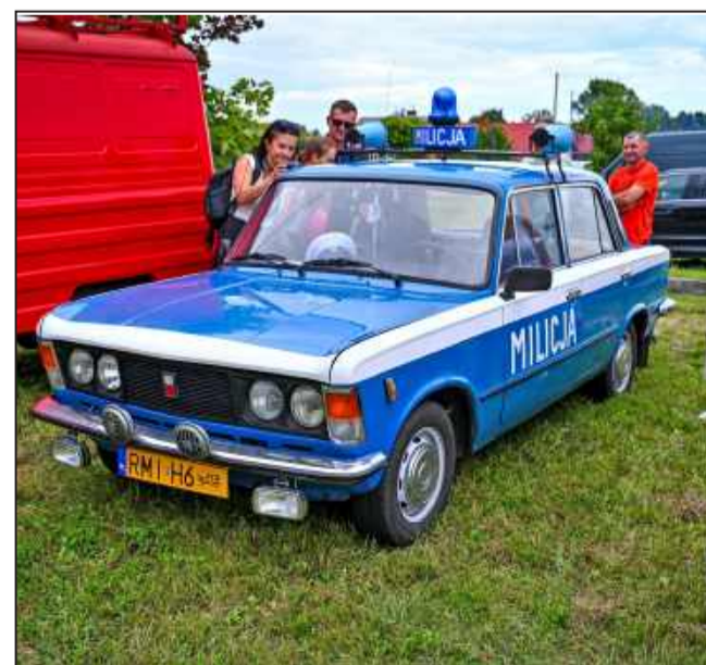
Stare samochody mają wielu fanów.