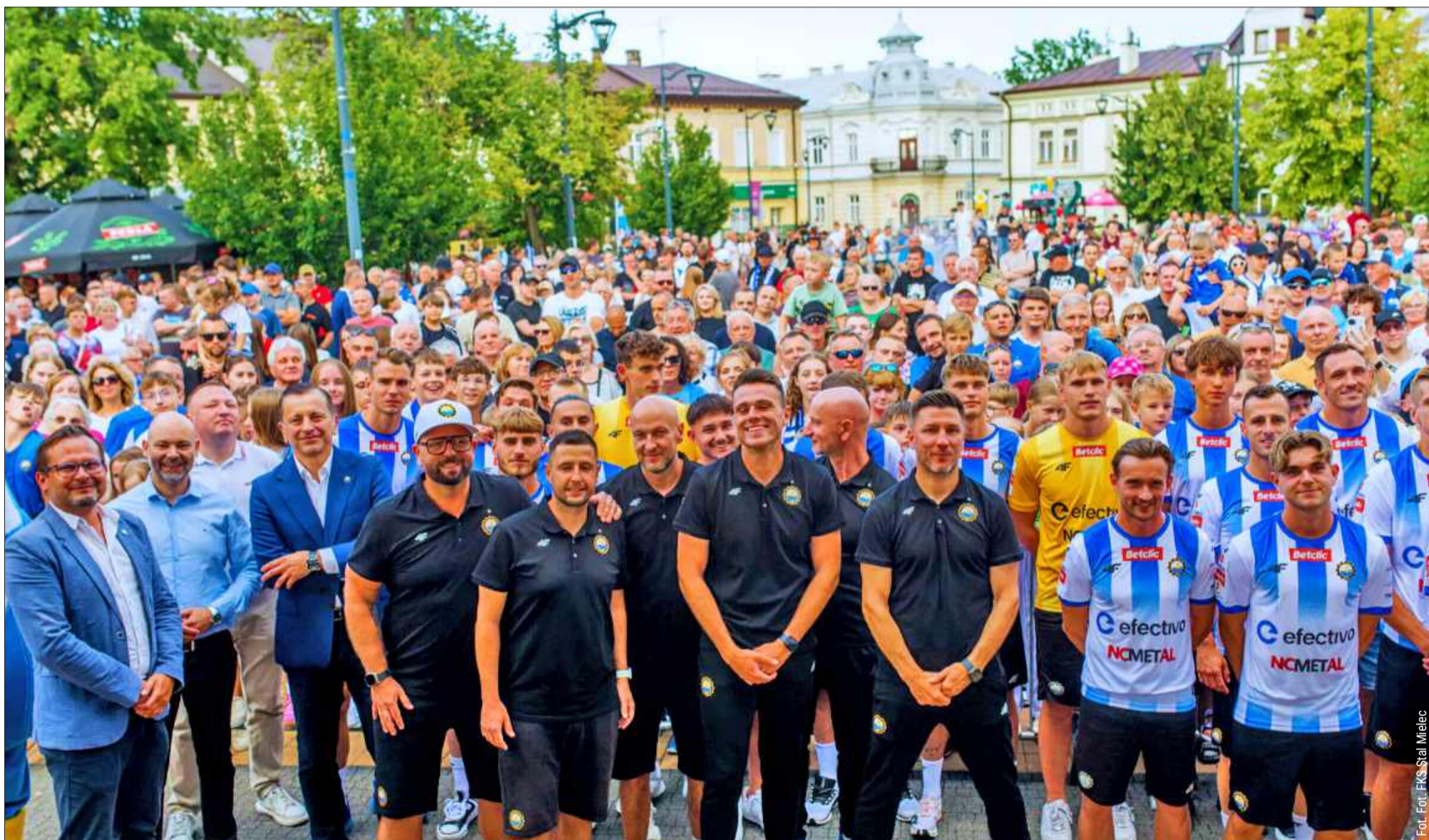
Oto nowa drużyna Stali Mielec.