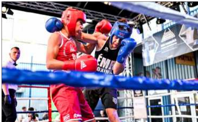
Wszystko wskazuje na to, że „Błaszak” jeszcze nieraz stanie się miejscem walk.

W sobotni wieczór mielecki „Błaszak” po raz kolejny stał się areną sportowych emocji na najwyższym poziomie. W ramach gali „Bitwa o Dziedziniec” odbyło się aż 20 widowiskowych pojedynków, w których rękawice skrzyżowali zawodnicy z Polski oraz z zagranicy.