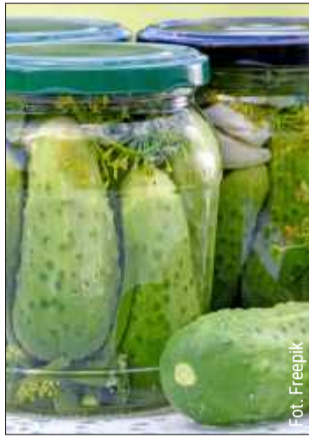
Najlepszy przepis na ogórki kiszane – wyjdą idealnie jędrne i kwaśne.

Zbyt duże ogórki – mają duże pestki i często robią się puste. Nieumyte lub uszkodzone liście – mogą wprowadzić pleśń. Za mało soli – kiszanka nie ukisi się, tylko spleśnieje. Zbyt wysoka temperatura przechowywania – ogórki fermentują za mocno i „puchną”. Zakrętki z uszkodzo-