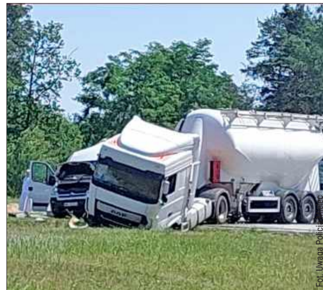
Zderzenie busego z cysterną.

Do groźnie wyglądającego zdarzenia drogowego doszło w poniedziałek na obwodnicy Mielca, w rejonie skrzyżowania prowadzącego w kierunku miejscowości Szydłowice. W zdarzeniu brały udział bus oraz pojazd ciężarowy. Droga była całkowicie zablokowana.