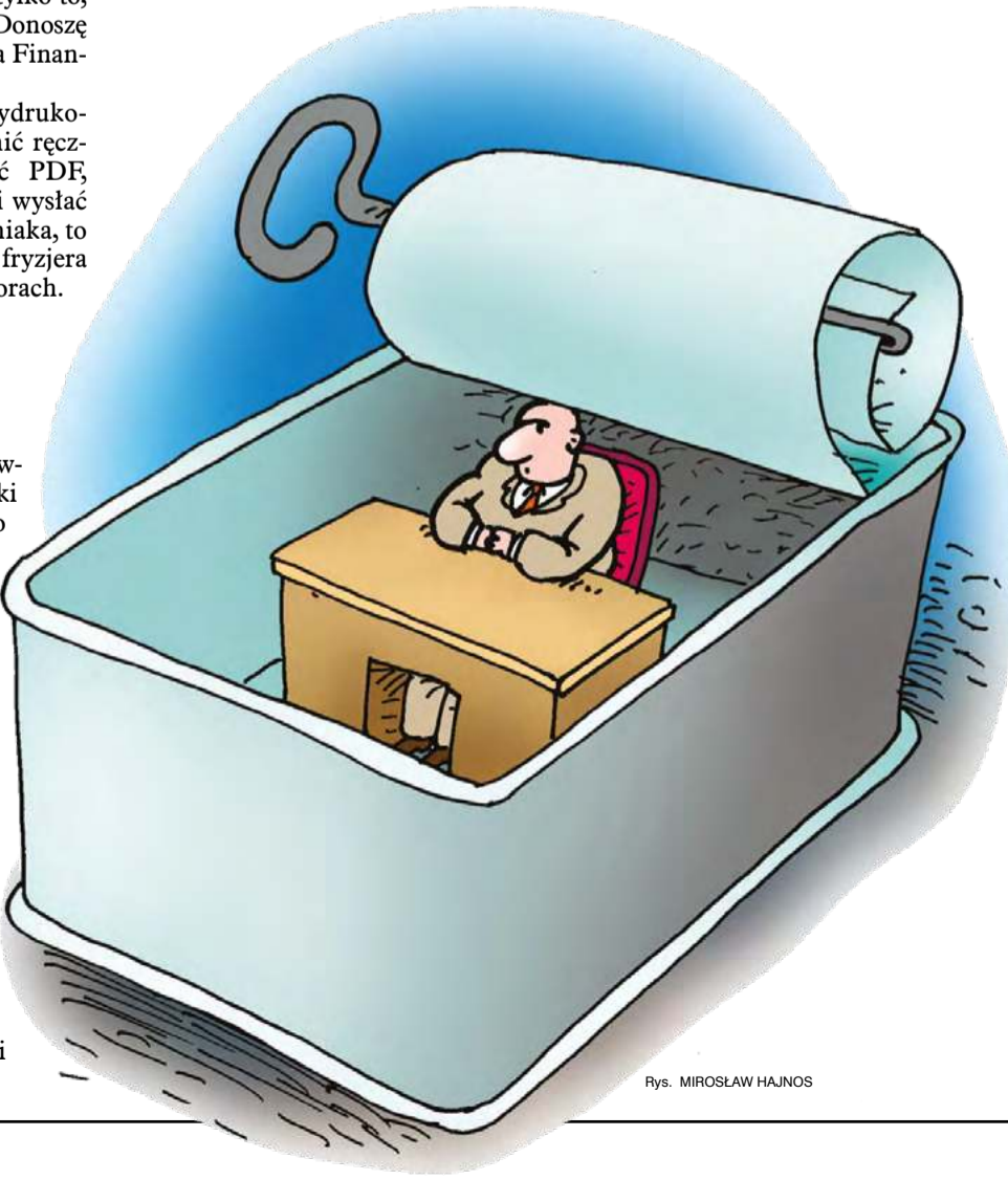
Rys. MIROSŁAW HAJNOS