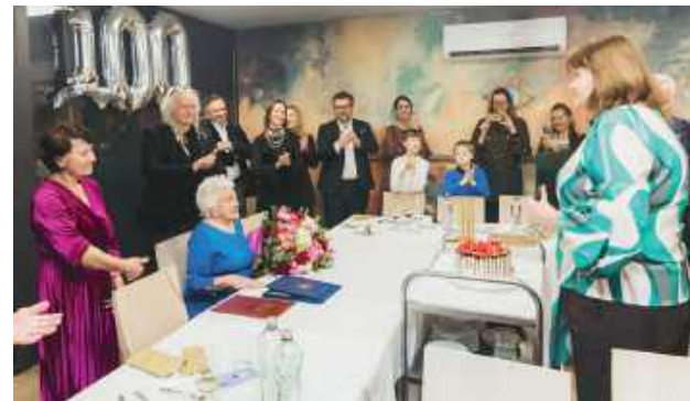
Dostojna jubilatka w otoczeniu najbliższych