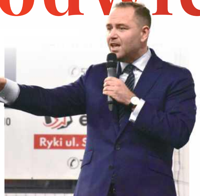
Bohater wydarzenia - Karol Nawrocki