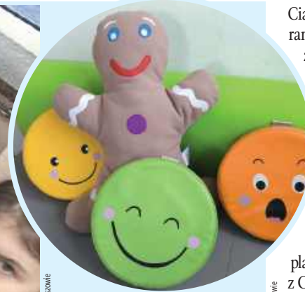
Pożeracz Smutków - Ciastek został wylicytowany za 162 zł

kcji na rzecz Wielkiej Orkiestry Świątecznej Pomocy.