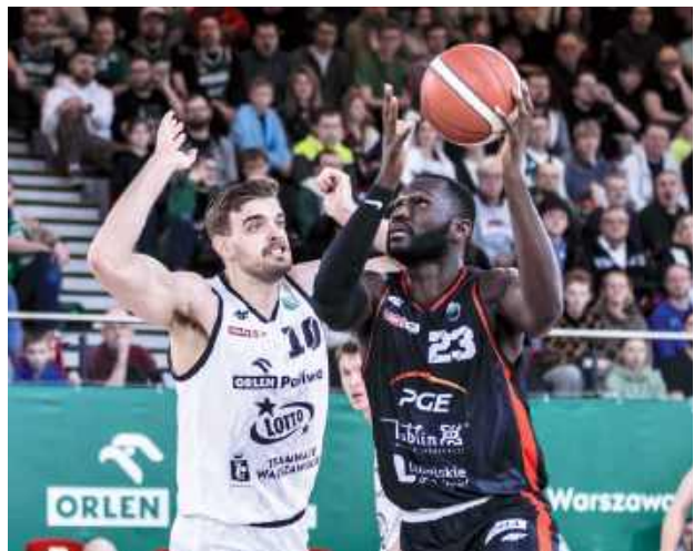
Lublinianie wygrali jedenasty mecz w tym sezonie

Przed tygodniem koszykarze Startu Lublin wygrali z Arriva Polskim Cukrem Toruń przed własną publicznością, dzięki czemu zajmowali trzecie miejsce w ligowej tabeli. W trakcie trwającej kolejki spadli z tej lokaty