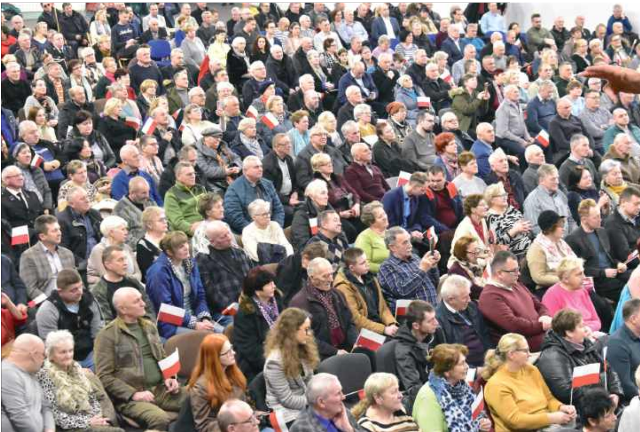
Hala w Rykach wypełniła się po brzegi. Blisko tysięcy osób przybyło na spotkanie