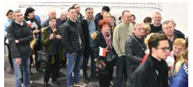
Kolejka osób, które chciały mieć zdjęcia z kandydatem na prezydenta naszego kraju