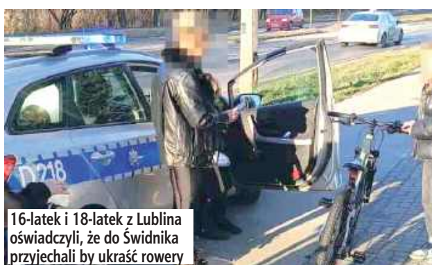
16-latek i 18-latek z Lublina oświadczyli, że do Świdnika przyjechali by ukraść rowery

- Na telefon alarmowy zadzwoniła 10-letnia dziewczynka, która zgłosiła że podeszło do niej dwóch nastolatków, w tym