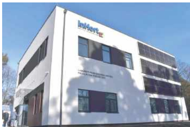
Budowa tego nowoczesnego laboratorium pochłonęła ponad 13 mln zł. Instytut Ogrodnictwa pozyskał na ten cel środki z Krajowego Programu Odbudowy

Kosztowało ponad 13 mln zł i jest jednym z dwóch obiektów wchodzących w Kompleks tzw. Zielonych Laboratoriów. Połowa tej kwoty to koszt zakupu aparatury, m.in. chromatografów. W ubiegłym tygodniu w Zakładzie Pszczelnictwa Instytutu Ogrodnictwa w Puławach otwarto nowoczesne laboratorium badań produktów pszczelich.