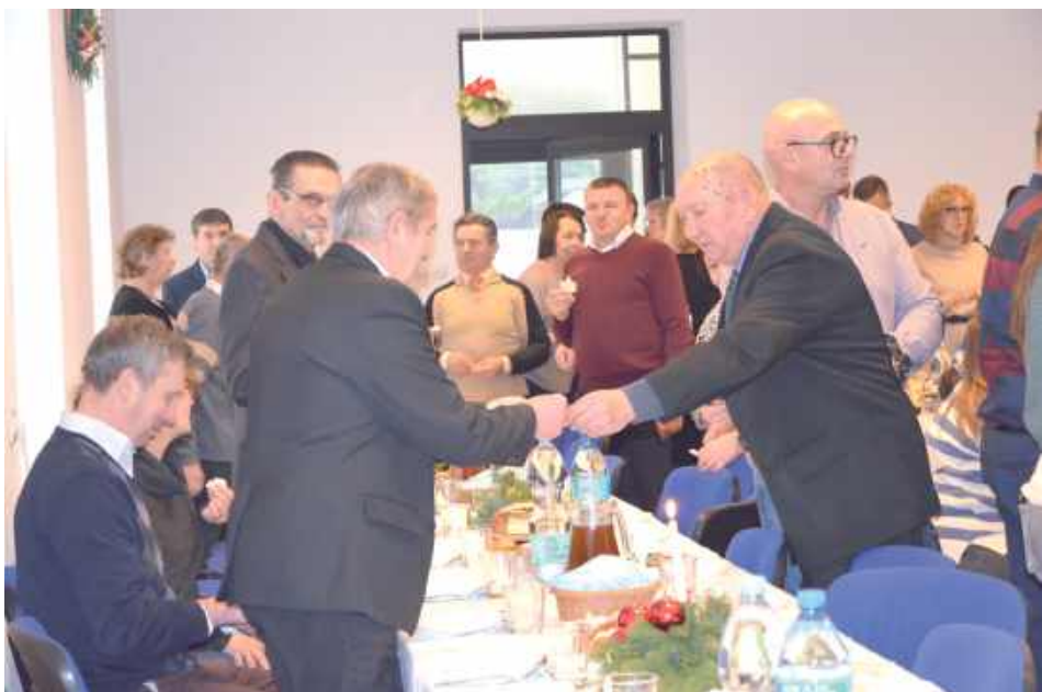
Parafianie dzieli się opłatkiem, składając sobie najserdeczniejsze życzenia