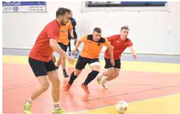
Roztentegowywacze zmniejszyli straty do lidera. W lidze będzie bardzo ciekawie