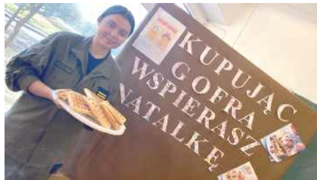
Zespół Szkół w Sobieszynie