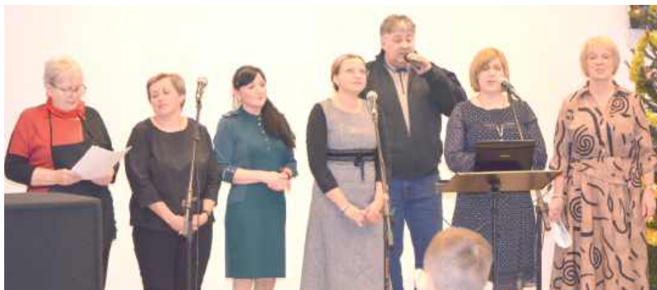
Śpiewu koled nie było końca. Na zdjęciu KGW „Kalina”