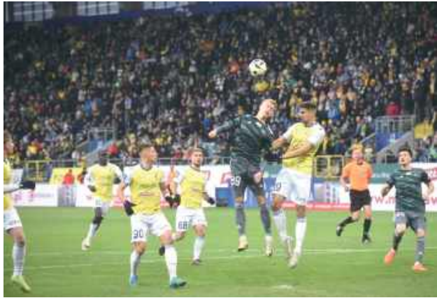
Motor zanotował w sobotę piąty remis w obecnym sezonie