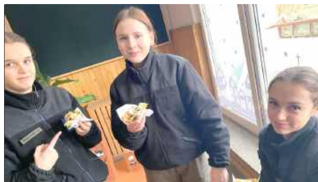
Zespół Szkół w Sobieszynie