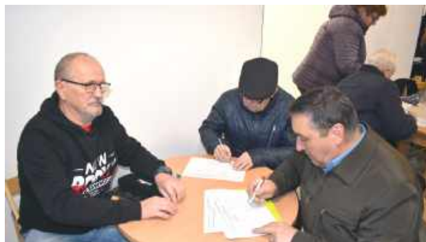
Przy wejściu można było złożyć podpis na Karola Nawrockiego

mował wiele gratulacji, życzeń, zapewnień od zgromadzonych. Nikomu nie odmówił wspólnej fotki. A gdy skończył swoją misję wsiadł w auto i ruszył do Łukowa, gdzie czekali jego zwolennicy.