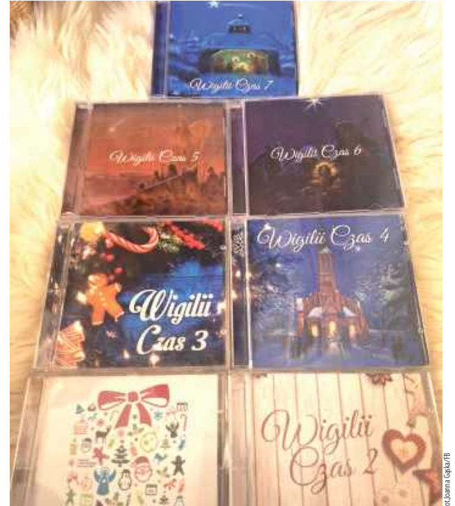
Każda z powstałych dotąd płyt, poza wymiarem charytatywnym ma również wartość edukacyjną, jak podkreślają muzycy. Po pierwsze utwory nagrywane są w rozszerzonych wersjach, artyści bowiem utrwalają więcej niż przysłowiowe „dwie zwrotki” bardzo znanych kolęd

W minioną niedzielę zakończył się okres tradycyjnego kołędowania. Pośród dźwięków tych niezwykłych pieśni, jak co roku, rodziło się w naszym powiecie wiele nietuzinkowych i szlachetnych inicjatyw.