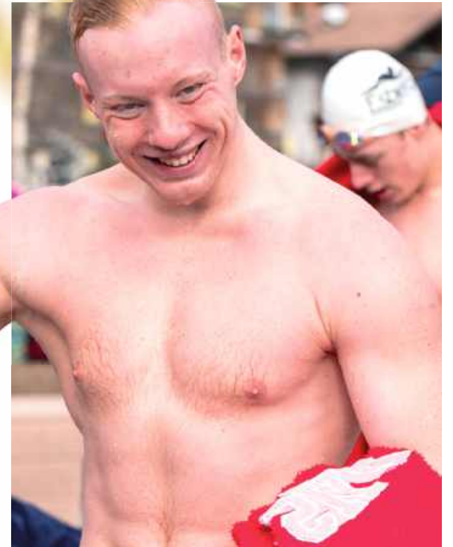
Ciężka praca została wynagrodzona na samym początku 2025 roku pięknymi widokami i przede wszystkim srebrnym medalem Mistrzostw Świata!