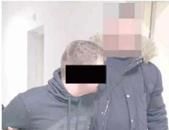
Uznano, że nie ma w tej sprawie podstaw do podważenia decyzji sądu o zastosowaniu aresztowania. Oskarowi K. zarzucono zbrodnię zagrożoną karą pozbawienia wolności na co najmniej dziesięć lat

Dęblin: Pokrzywdzony 34-latek przeżył tylko dlatego, że szybko otrzymał pomoc medyczną. Mężczyznę spotkał prawdziwy horror - zdaniem śledczych jego oprawca najpierw go potrafił autem, a później dwa razy przejechał. Podejrzany Oskar K. nie przyznał się do usiłowania zabójstwa i chciał wyjść z aresztu.