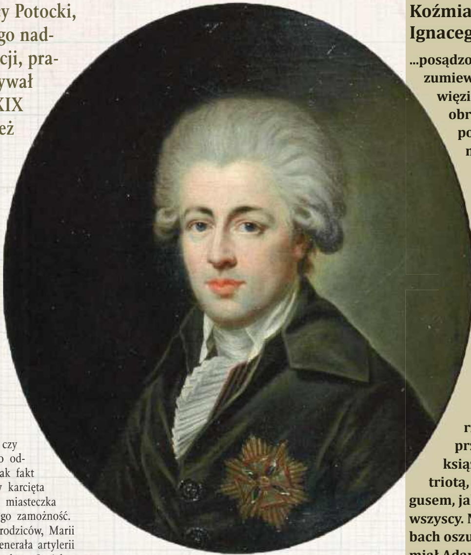
Ignacy Potocki uważany był za jeden z największych politycznych umysłów epoki, jednym z twórców Konstytucji 3 Maja. W zarządzaniu swoimi sprawami prywatnymi łączył nieudolność z lekkomyślnością

Pytanie, czy Potocki mocno odczuł stratę i jak fakt przetrzymania w karcie niewielkiego miasteczka wpłynął na jego zamożność. Związek jego rodziców, Marii z Kąskich i generała artylerii litewskiej Eustachego Sapiehy, stworzył jedną z największych w ówczesnej Rzeczypospolitej fortun, przynoszącą według szacunków 460 392 złp 22 gr rocznego dochodu. Widzialnym jej symbolem była przede wszystkim rokokowa rezydencja w Radzynie Podlaskim. Po śmierci małżonków w 1768 r. włości podzielono między dzieci mniej-więcej po równo: spadkobiercy podzielili dobra na pięć równych części, po czym rozpoczęto wybór sched, zaczynając od najmłodszego sukcesora. Ignacy wybrał sobie m.in. klucz kurowski (miasto Kurów w dzisiejszym powiecie puławskim, wsie Abrahamów, Brzozowa, Gać, Glinnik, Os, Paluchów, Płonki, Szumów, Wolica I, Wolica II „połowa”, folwarki Dembiany, Jenopol, Klimontowice, Wielki Las, Wielkie Zabuzę). Łącznie jedno miasto, 28 wsi całych, jedną część wsi, siedem folwarków, jurydyka miejska. Dobra te przynosiły 107 581 złp 5 gr gotowizny. Na tej liście nie ma Michowa, bo ten trafił w ręce Ignacego zupełnie innym sposobem. Miasteczko zostało niegdyś przekazane lubelskim jezuitom, którzy doprowadzili do przywrócenia statusu miasta. Po skasowaniu Towarzy-