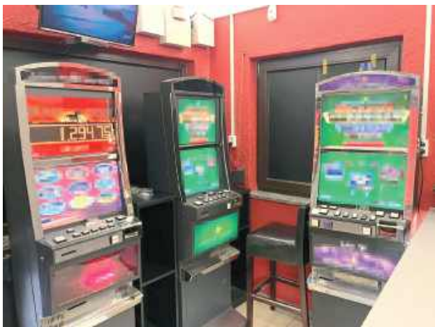
Podczas przeszukania funkcjonariusze zabezpieczyli pięć automatów służących do prowadzenia nielegalnych gier hazardowych

- Podczas przeszukania funkcjonariusze zabezpieczyli pięć automatów służących do prowadzenia nielegalnych gier hazardowych. Na miejscu znajdo-