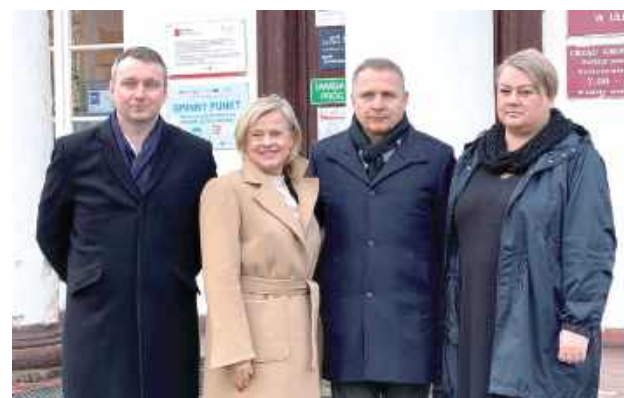
Delegacja rządowa w gm. Uleż

W Urzędzie Gminy Uleż odbyło się spotkanie z ważnymi gośćmi, podczas którego poruszono istotne kwestie dotyczące przyszłości lokalnej infrastruktury i dziedzictwa kulturowego.