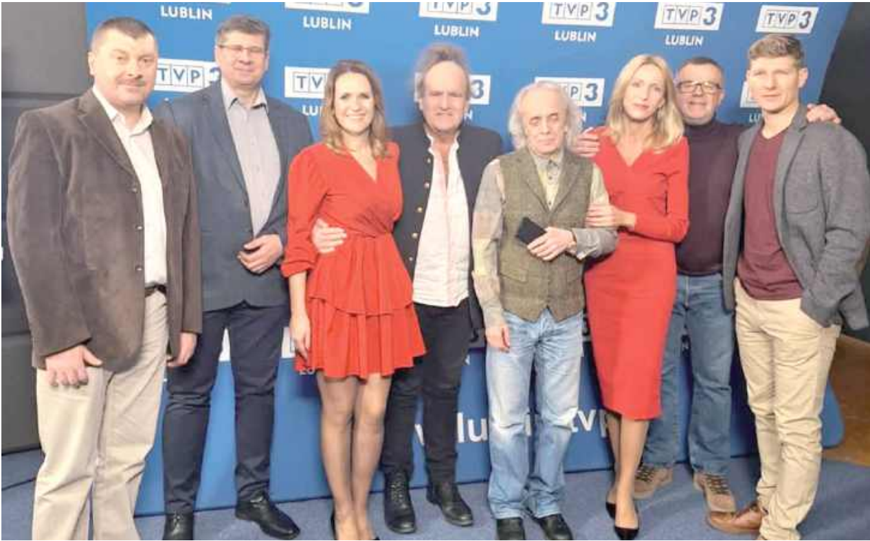
Zespół, dzień przed Wigilią, gościł także w TVP3 Lublin, w programie „Miłego Popołudnia”, opowiadając o swojej działalności szerszemu gronu odbiorców, prezentował również swój dorobek artystyczny podczas ogólnopolskiego konkursu kolęd w Puławach i Lublinie