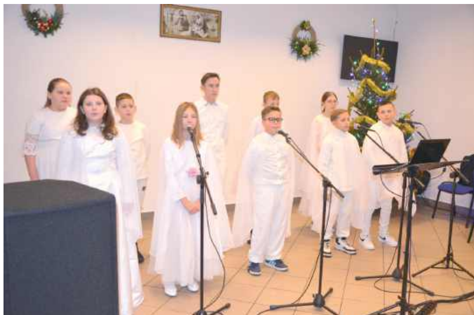
Śpiewająco i tanecznie zaprezentowali się uczniowie szkoły podstawowej w Pawłowicach, którzy wystąpili podczas spotkania opłatkowego

W niedzielę, 2 lutego w budynku OSP Pawłowice odbyło się spotkanie opłatkowe parafian z parafii pw. Świętego Jakuba Apostoła w Piotrowicach.