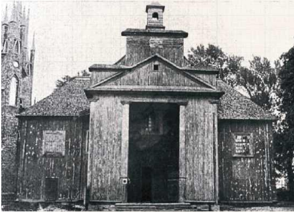
W czasach prześladowania unii cerkiew unicką zamieniono na prawosławną. Rzymscy katolicy modlili się w stareńkim kościółku pw. św. Jana, który dopiero na początku XX wieku został zastąpiony przez znaną nam dziś Bazylikę (na zdjęciu widać fragment z lewej strony)