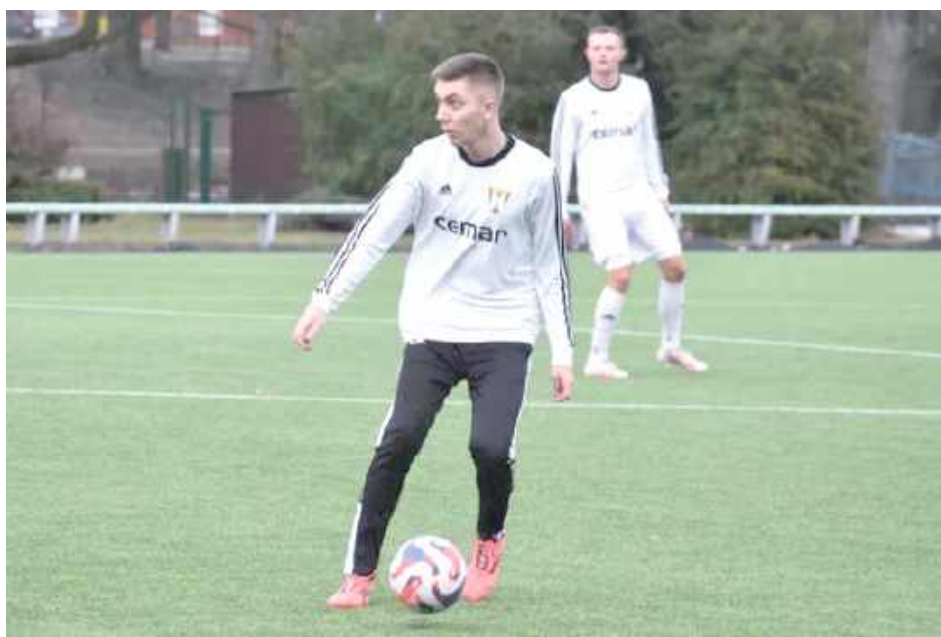
Gracze Ruchu zaliczyli pierwsze zwycięstwo w okresie przygotowawczy. W Gończycach nie dali szans Orłętom Łuków

Obrońca Ruchu doznał kontuzji mięśnia czworogłowego uda. Jego pauza ma potrwać dwa, a może trzy tygodnie.