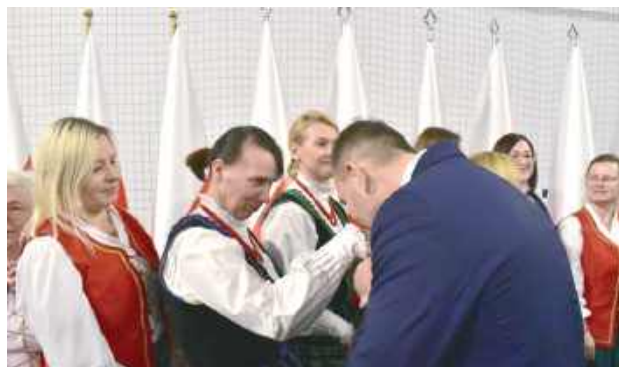
Każda kobieta została ucałowana w dłoń

A później był moment na wspólne zdjęcie. Osoby podawały swoje telefony, a odpowiedzialni panowie robili fotki. Jeszcze przed przybyciem Nawrockiego do hali prowadząca podkreślała, by pochwalić się zdjęciem wśród znajomych oraz w swoich mediach społecznościowych. Karol Nawrocki przy-