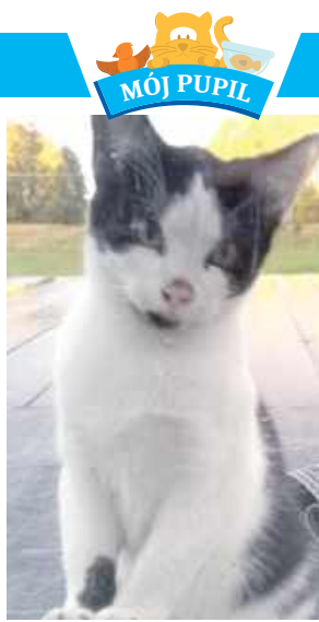
Bella, właścicielka: Zuzia, Przypisówka