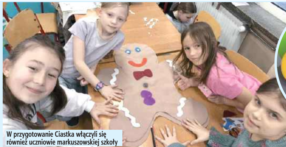
W przygotowanie Ciastka włączyli się również uczniowie markuszczyńskiej szkoły