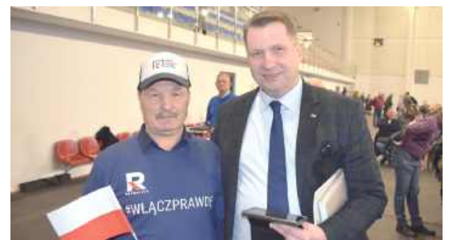
Wiele osób chciało mieć zdjęcie z Przemysławem Czarnkiem