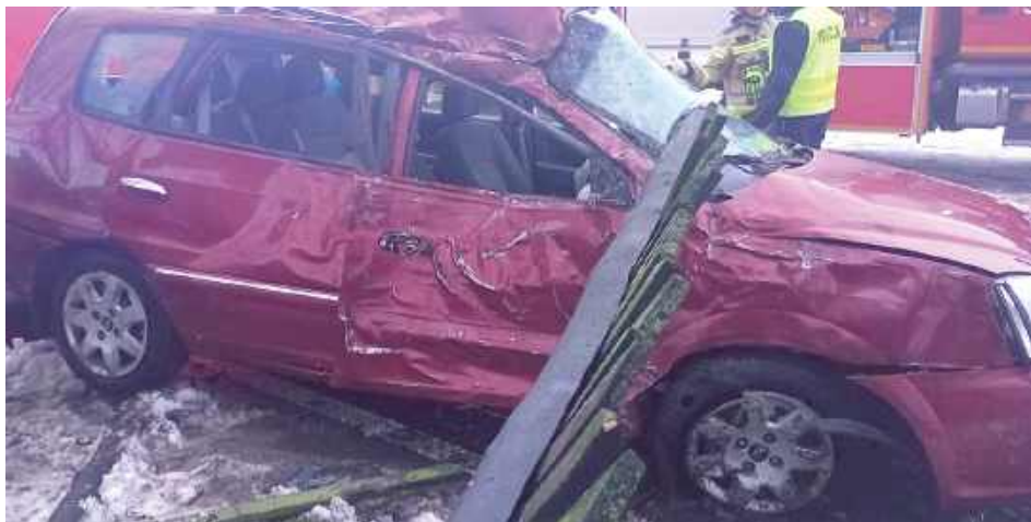
Siedzący na miejscu pasażera 19-latek nie przeżył wypadku. Jego starszy znajomy prowadził auto, mając w organizmie prawie promil alkoholu

Za kierownicą jadącego w kierunku Leopoldowa auta marki KIA siedział 27-letni mieszkaniec powiatu ryckiego. Kierowca stracił panowanie nad pojazdem. Policjanci wskazują, że kierowca najprawdopodob-