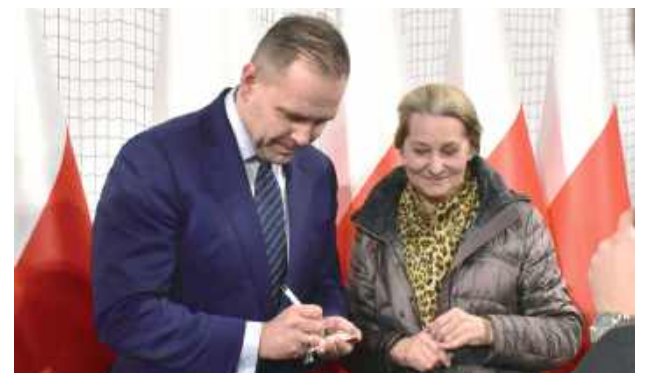
Jedna z pań oprócz wspólnego zdjęcia poprosiła o autograf na... obrazku związanym z motywem religijnym