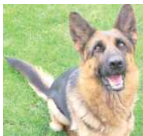
Mela, właściciel: Cezary Grzywacz, Sobole