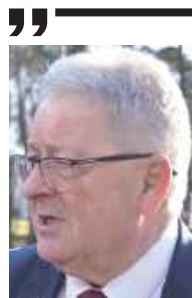
Czesław Siekierski, minister rolnictwa i rozwoju wsi

Wszystko dzięki budowie nowoczesnego laboratorium, którego otwarcie miało miejsce w Puławach w ubiegłym tygodniu. Uroczystość, zgromadziła wielu znamienitych gości, naukowców z różnych kręgów. Do Puław zawiązał także sam Minister Rolnictwa i Rozwoju Wsi. - Pszczoły są ważne dla utrzymania całego procesu produkcji rolniczej. Co prawda technika tak poszła do przodu, że próbuje się zastępować je różnymi urządzeniami mechanicznymi, ale nic nie zastąpi pszczoł w takiej skali. Cieszę się, bo niedawno otworzyliśmy jedno laboratorium poświęcone badaniami jakości żywności w Instytucie w Skierniewicach. Teraz tutaj w Puławach otwieramy drugie - mówił Czesław Siekierski i dodawał: - Puławy mają kilka instytutów naukowych, podległych resortowi rolnictwa. Bardzo cieszę się, że w końcówce