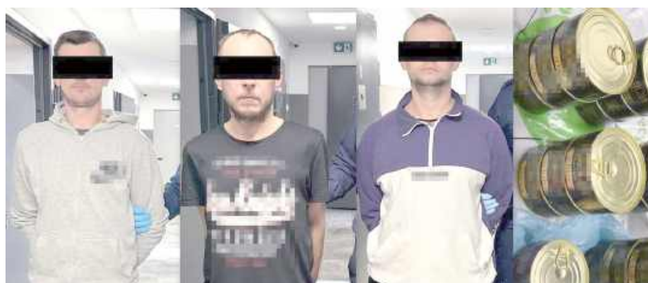
W czwartek Sąd Rejonowy w Opolu Lubelskim, na wniosek prokuratury, aresztował całą trójkę na trzy miesiące

Mężczyźni mieli używać wobec niego siły fizycznej,