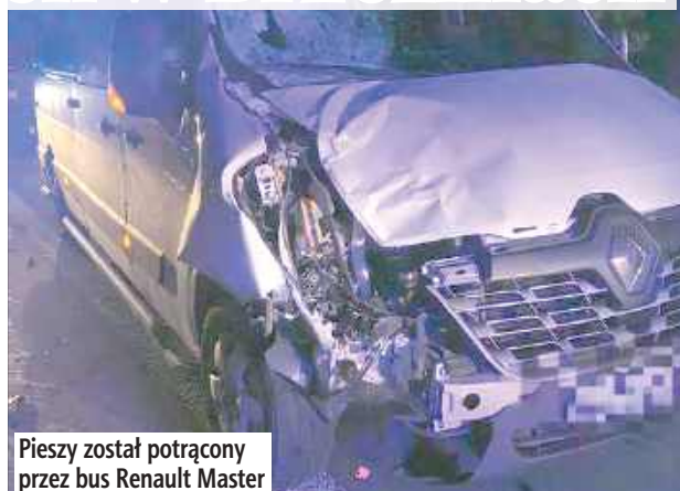
Piesz został potrącony przez bus Renault Master