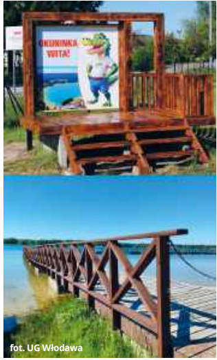
fol. UG Włodawa

sezonowych poprawek jest powrót kultowej, drewnianej maskotki jeziora. Słynny krokodyl, stojący tuż przy jednym z lokalnych ośrodków, przeszedł grun-