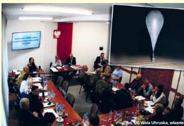
fol. UG Wola Uhruska, własne

Zjawiskiem, z którym najczęściej spotykają się obecnie pogranicznicy na rzece Bug, są próby nielegalnego przekroczenia granicy przez obywateli Ukrainy, uciekających przed poborem do wojska. Uciekinie-