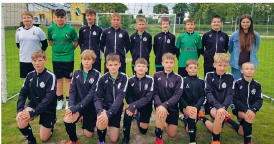
Młodzi zawodnicy są prawdziwą chlubą swojej społeczności.

Sukcesy drużyny seniorów w klasie B, dynamiczny rozwój szkolenia młodzieży oraz ogrom pracy wykonywanej społecznie przez działaczy i członków klubu - tak można podsumować działalność GKS Pławanice Kamień w 2025 roku. Podczas ostatniej sesji rady gminy zaprezentowano szczegółowe sprawozdanie z działalności klubu, które stało się również okazją do rozmowy o przyszłości lokalnego sportu.