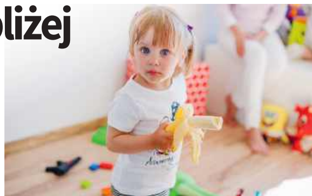
W czasie ostatniej sesji ustalono szczegóły dotyczące funkcjonowania nowego żłobka, którego budowa trwa właśnie w Żółtańcach-Kolonii.

Przedstawiciele gminy argumentowali jednak, że ustalona stawka stanowi górny limit