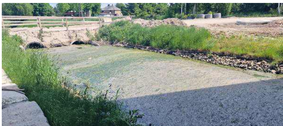
Mieszkaniec gminy Chełm, który przyglądał się Uherce w pobliżu Stańkowa, zwrócił uwagę na gruby kożuch zielonego osadu.

Niepokojące zjawiska, jakie miały miejsce w lipcu ubiegłego roku, wystrzyły u mieszkańców gminy zmysł obserwacji i teraz ze szczególną uwagą przyglądają się temu, co dzieje się na odcinku rzeki Uherka w pobliżu zbiornika Stańków. Kolejne niepokojące sygnały z tamtych okolic napłynęły do nas kilka dni temu. I naprawdę trudno się dziwić, że znów pojawiły się obawy o poważne zanieczyszczenie wód zbiornika niepożądanymi substancjami.