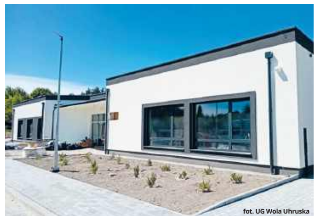
fol. UG Wola Uhruska

Kwestia opłat kulinarnych wywołała jednak drobną wątpliwość wśród uczestników sesji.