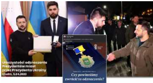
Uroczystości odznaczenia Prezydentów miast przez Prezydenta Ukrainy Chełm, 5.04.2023