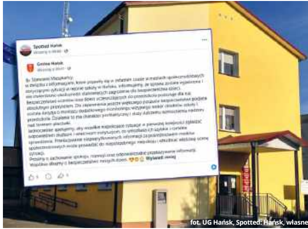
fol. UG Hańsk, Spotted: Hańsk, własne

Szybko narastający popłoch i spekulacje zmusiły do reakcji Urząd Gminy Hańsk. Przedstawiciele samorządu podjęli natychmiastowe kroki w celu zwer-