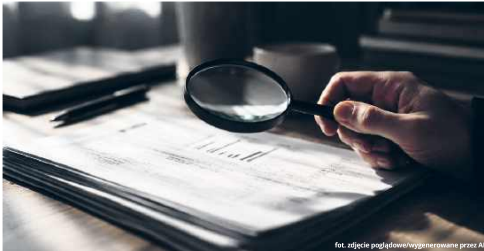
fot. zdjęcie poglądowe/wygenerowane przez AI