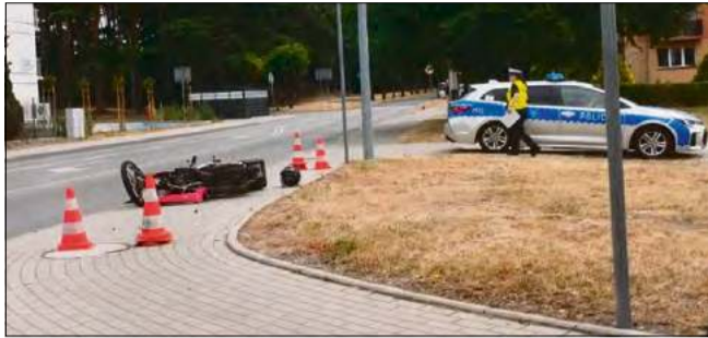
W wyniku zderzenia motorowerzysta wjechał na chodnik i przewrócił się.