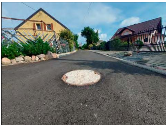
Budowa kolejnych odcinków kanalizacji sanitarnej w Kórniccy dobiegła końca, mieszkańcy mogą przystępować do wykonywania przyłączy do nowej sieci.

Całkowita wartość inwestycji wyniosła 6 940 430,37 zł brutto (5 642 626,32 zł netto). Zadanie zostało zrealizowane przy znaczącym wsparciu środków z Krajowego Planu Odbudowy. Dofinansowanie wyniosło 4 691 473,90