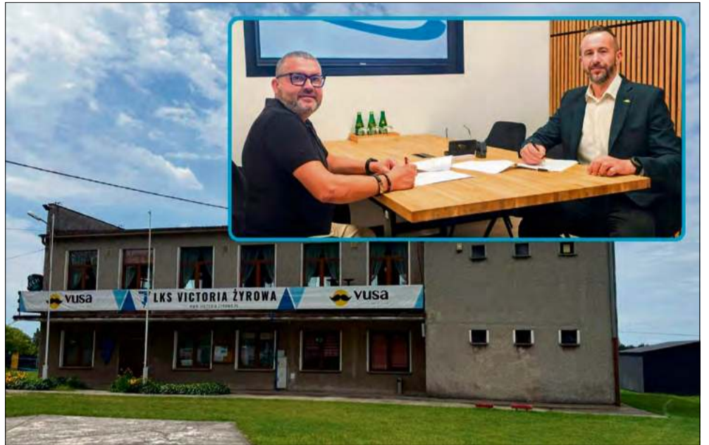
Podpisanie umowy z wykonawcą zadania inwestycyjnego dotyczącego obiektu sportowego w Żyrowej.

Gmina Zdzieszowice zleciła wykonanie prac termomodernizacyjnych w budynku LKS Victoria Żyrowa. Umowę o wartości 1,37 mln zł podpisano 26 czerwca, a zakończenie robót przewidziano na ostatni dzień września tego samego roku.