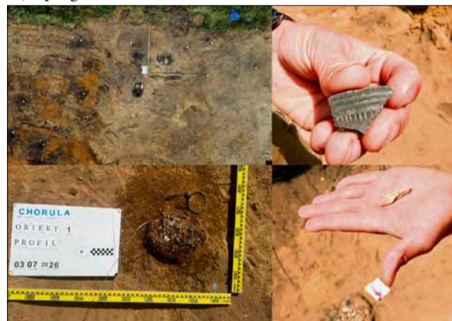
Wydobyte z ziemi naczynia i fragmenty wyposażenia grobowego dokumentowane są i zabezpieczane przez archeologów podczas prac wykopaliskowych.

Jak wyjaśnia Opolski Wojewódzki Konserwator Zabytków, właśnie dlatego „nie można precyzyjnie określić przebadanego ówczesnie obszaru stanowiska”. Innymi słowy – archeolodzy wiedzieli, że pod ziemią może kryć się jeszcze wiele,