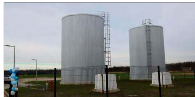
Dzięki oddanej do użytku nowej Stacji Uzdatniania Wody w Dziedzicach gmina była w stanie zabezpieczyć potrzeby wszystkich mieszkańców.

Nowoczesna stacja znacząco zwiększyła możliwości zaopatrzenia w wodę, co w obliczu rekordowych upałów okazało się kluczowe. To