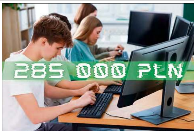
Środki zostaną przeznaczone m.in. na rozwijanie umiejętności cyfrowych dzieci i młodzieży.

Środki zostaną skierowane do przedszkoli oraz szkół podstawowych w trzech miejscowościach: Zdzieszowicach, Żyrowej i Januszkowicach. Przeznaczenie funduszy obejmuje rozwijanie umiejętności cyfrowych dzieci i młodzieży oraz doposażenie placówek