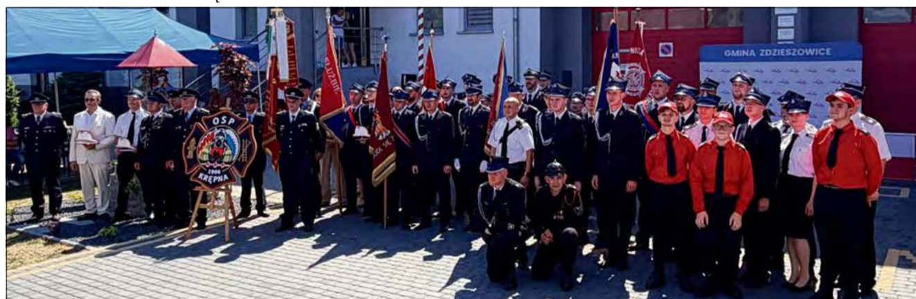
Z okazji 120 lat OSP Krępna wykonano pamiątkowe zdjęcie.