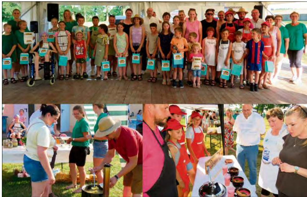
Organizatorzy zadbali o to, by nikt nie wyszedł z imprezy głodny.

Punktualnie o godz. 16 rozpoczęło się gotowanie. W kotłach powstawały m.in. zupa pomidorowa, ogórkowa, zacieraną oraz chłodnik. Liczyły się nie tylko smak i aromat, ale również współ-