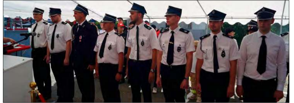
Podczas uroczystości strażakom przyznano odznaczenia.

W ramach corocznych wyróżnień za działalność na rzecz ochrony przeciwpożarowej, Prezydium Zarządu