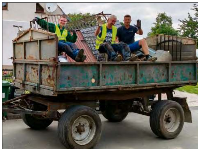
Mieszkańcy Oleszki zebrali złom na szczytny cel.

Organizatorzy podkreślili, że zaangażowanie przerosło ich oczekiwania. Środki uzyskane ze sprzedaży zebranego złomu oraz zgromadzone datki zostały