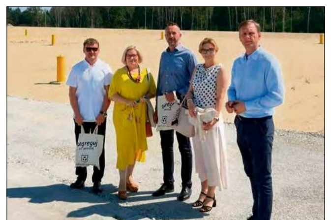
Uroczyste otwarcie nowej kwatery składowiska odpadów komunalnych.

Inwestycja zwiększa możliwości magazynowania odpadów w regionie i stabilizuje system gospodarki odpadami dla wszystkich gmin należących do Związku. Czas, przez który składowisko pozostanie wystarczające, zależy od ilości odpadów tam trafiających..