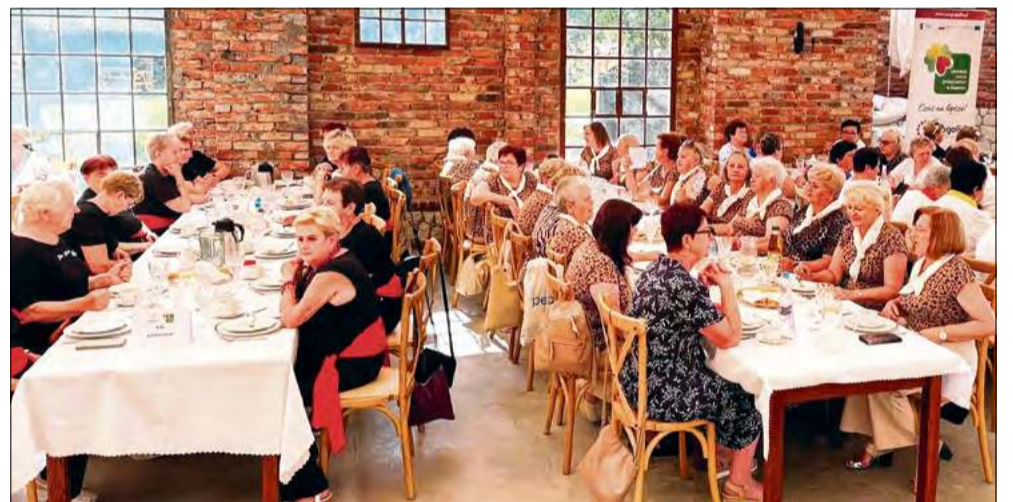
Wszystko zakończyło się wspólną zabawą nad Jeziorem Srebrnym w Januskowicach.

W czwartek 2 lipca odbył się Piknik Klubów Aktywności, który zgromadził mieszkańców gminy Gogolin oraz gości z partnerskiej gminy Łodygowice. To był czas integracji, ale i wspólnej zabawy.