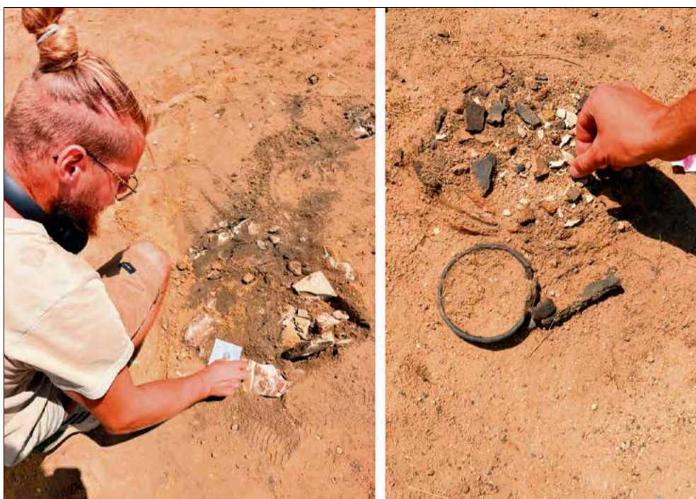
Prace archeologiczne prowadzone na terenie inwestycji obejmują dokładne odsłanianie, opisywanie i inwentaryzację kolejnych znalezisk odkrywanych w warstwach ziemi.

– Paradoksalnie to mogło uratować te zabytki. Gdyby była tu uprawa rolna,