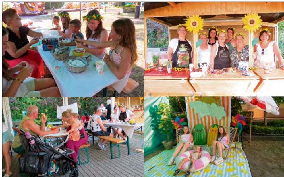
Organizatorzy zadbałi o to, aby każdy znalazł coś dla siebie.

W sobotę 27 czerwca przy Centrum Aktywizacji Wiejskiej w Choruli odbył się rodzinny piknik pod chmurką. Wydarzenie zgromadziło licznych mieszkańców, którzy skorzystali z przygotowanych atrakcji.