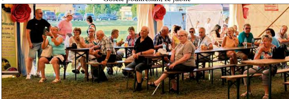
Po części oficjalnej świętowano na festynie rodzinnym.

Wyjątkowym momentem było również wręczenie jednostce medalu Śląskiej