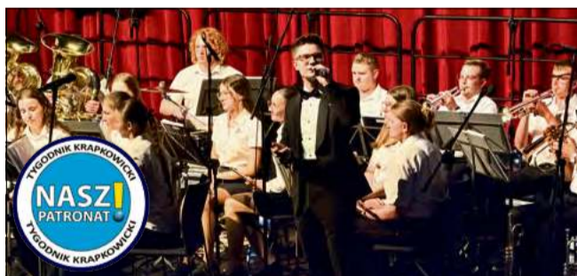
Muzyka stała się językiem porozumienia – koncert połączył tradycję, kulturę i artystów z całego regionu.

– Niemcy są naszymi przyjaciółmi. Trzeba to mówić szczególnie dziś, kiedy świat staje się coraz bardziej podzielony. Nie ma bezpiecznej Polski bez bezpiecznych Niemiec i nie ma bezpiecznych Niemiec bez bezpiecznej Polski – mówił marszałek Sejmu.