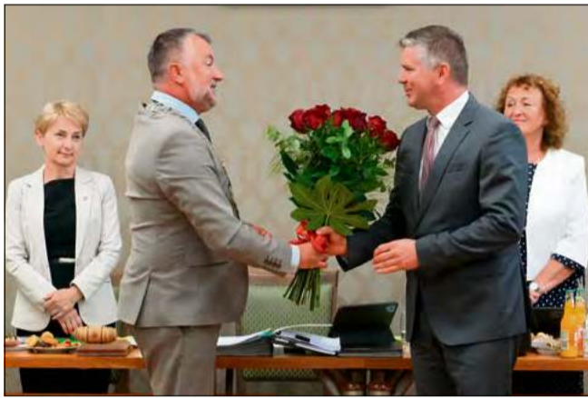
Nie zabrakło kwiatów i gratulacji.

Miniony rok był dla gminy czasem wytężonej pracy – zarówno pod względem dużych inwestycji, jak i mniejszych zadań, które stanowiły odpowiedź na konkretne potrzeby i oczekiwania lokalnej społeczności. W tym czasie zrealizowano szereg kluczowych przedsięwzięć infrastrukturalnych. Wśród nich znalazły się m.in. przebudowa rowu melioracyjnego A-3 w Gogolinie, przebudowa Alei Przyjaciół Dübendorf oraz rozbudowa ulicy Kościelnej w Gogolinie. Powstała tak-