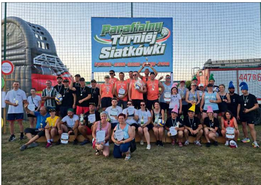
Zawodnicy pokazali ogromne zaangażowanie, sportową rywalizację i ducha fair play.