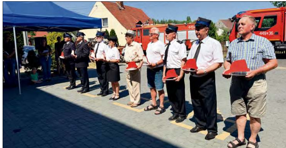
Jubileusz był także okazją do uhonorowania druhów.