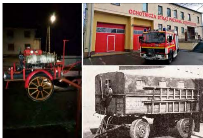
W miejsce sikawki konnej dostarczone do OSP wózek do przewozu sprzętu, który został odrestaurowany w 2016 roku przez grupę strażaków z OSP Ściborowice. Wózek służył strażakom do połowy lat 70-tych XX w. Następnie w obiekcie była garażowana przyczepa ciągnikowa służąca do przewozu sprzętu i ludzi.