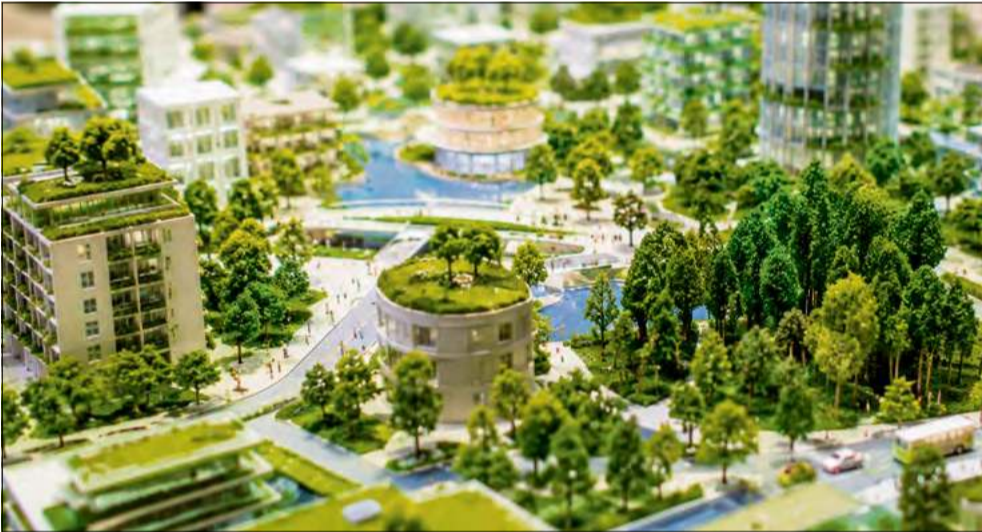
Zaniedbany skrawek terenu w każdej miejscowości może zamienić się w tętniący życiem mikrolas – to idea lasów Miyawaki.

(zwykle 3–4 drzewa na m 2 ) rośliny konkurują o światło, co wymusza ich szybki wzrost ku górze. Z ekologicznego punktu widzenia lasy te wykonują tzw. usługi ekosystemowe, pomagając chronić otoczenie przed skutkami powodzi i suszy. Wykazują wysoką zdolność retencji wody, co jest szczególnie ważne podczas ulewnych deszczy, a w okresach upałów skutecznie łagodzą zjawisko miejskich wysp ciepła. Badania przeprowadzone w Europie wykazały, że temperatura gleby wewnątrz lasu kieszonkowego może być niższa nawet o 20°C w porównaniu z pobliskim asfaltem. Dodatkowo takie mikrolasy działają jak naturalne filtry powietrza, redukując ilość pyłów i hałas.