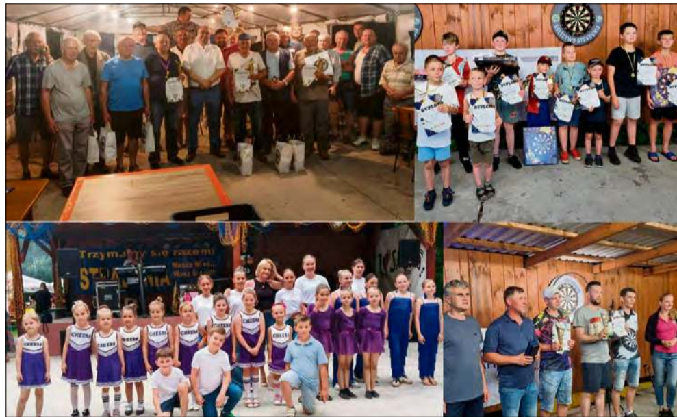
Dni Straduni stały się świętem integrującym lokalną społeczność i pokazały, że w Straduni nie brakuje energii do wspólnego spędzania czasu.

(laba), fot. Stowarzyszenie Rozwoju Wsi Stradunia