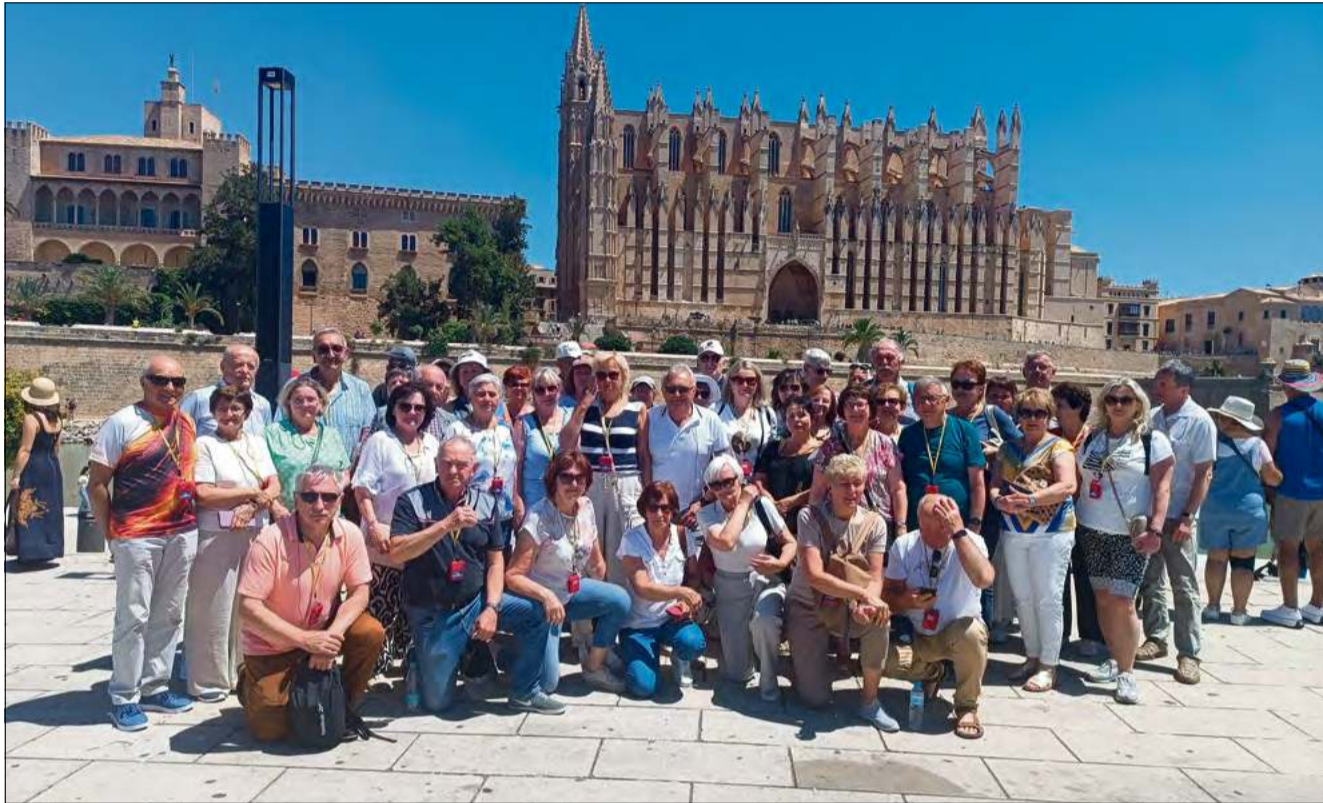
Po udanej pielgrzymce na Majorkę grupa już snuje plany na kolejne wycieczki w przyszłym roku.

Za cel peregrynacji obrano tym razem prześliczną wyspę na hiszpańskich Balearach na Morzu Śródziemnym – Majorkę. Licznie zgromadzeni pielgrzymi, na początek odbyli bezpieczny lot z Portu Lotniczego we Wrocławiu do Palma de Mallorca – stolicy wyspy. Zakwaterowani zostali w dobrym hotelu, niedaleko sielskiej plaży w dzielnicy Arenal. Przez cały tydzień pielgrzymi mogli odbywać całodniowe wycieczki do majorkańskich sanktuariów, na czele ze słynnym kompleksem Maryjnym w Lluç, gdzie modlono się przy cudownej figurze Czarnej Madonny. Nie zabrakło też wizyt w innych lokalnych kościołach i sanktuariach, np. w Arta, Klasztorze Kartuzów w Valdemossa, związanego m.in. z pobytem w tym miejscu Fryderyka Chopina, w Bazylice w Soler, Domu św. Katarzyny Thomas czy Sanktuarium w Pollença oraz w Alcudii. Uczestnicy pielgrzymki mo-