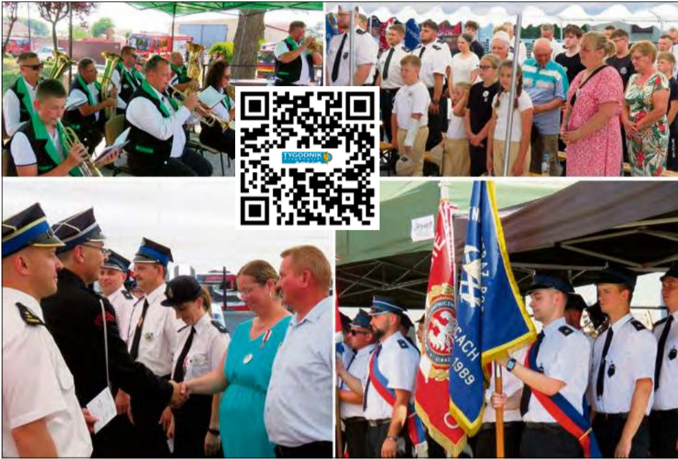
90-lecie OSP Ściborowice było świętem strażaków i lokalnej społeczności.

27 czerwca jednostka Ochotniczej Straży Pożarnej w Ściborowicach obchodziła jubileusz 90-lecia istnienia. Uroczystości odbyły się na terenie przy remizie, a ich program obejmował mszę świętą, przemarsz pododdziałów, apel oraz część rozrywkową z koncertem i atrakcjami dla dzieci.