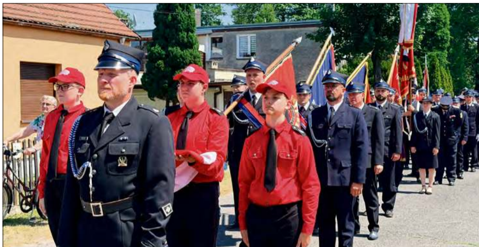
Po nabożeństwie uczestnicy przemaszerowali przed remizę.

Były wzruszenia, strażacki ceremoniał i symbole, które łączą pokolenia. Od poświęcenia odrestaurowanej zabytkowej sikawki konnej i figury św. Floriana, przez wyróżnienia dla zasłużonych druhów, aż po spotkanie z partnerami z Niemiec i rodzinny festyn. Ochotnicza Straż Pożarna w Krępnej świętowała 120-lecie swojej działalności, przypominając, że historia tej jednostki to przede wszystkim historia ludzi od pokoleń gotowych nieść pomoc.