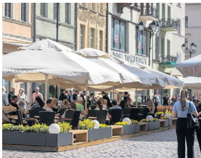
Wiele lokali na toruńskiej starówce oferuje skorzystanie ze swojej toalety bezpłatnie

Darmowe WC oferują m.in.: Kuranty, ul. Rynek Staromiejski 29, Grande Coffee, ul. Rynek Staromiejski 19, Pub Jadwiga, Rynek Staromiejski 26/27, Pijalnia Czekolady E. Wedel, ul. Szeroka 40, Pierogarnia Stary Toruń, ul. Most Pauliński 2/10, Pierogarnia Stary Młyn, ul. Łazienna 28, Kawiarnia Lenkiewicz, ul. Wielkie Garbary 12-16, Metropolis, ul. Łazienna 26, Bistrotapas, ul. Rynek Staromiejski 25, Chleb i Wino, ul. Rynek Staromiejski 21/22, Restauracja Smaki Indii, ul. Rynek Staromiejski 24, Restauracja Bangkok, ul. Szeroka 32b, Pub Mienzen, ul. Rynek Staromiejski 36-38, Pijalnia Wódki i Piwa, ul. Rynek Staromiejski 26. ©