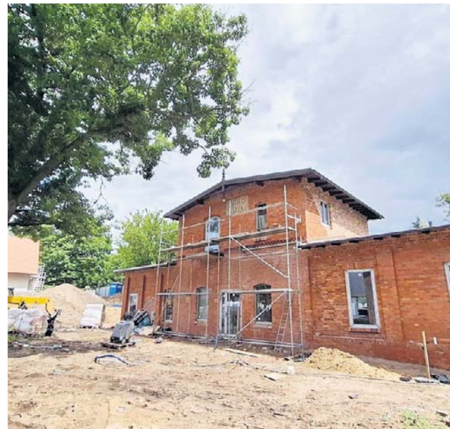
Całość powinna zostać oddana do użytku po kompleksowym remoncie jeszcze w tym roku