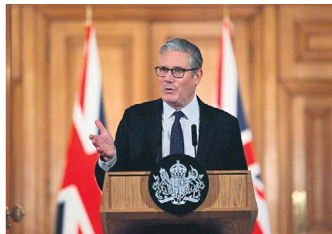
Jak powiedział Starmer, regulacje mają wejść w życie na początku przyszłego roku, prawdopodobnie wiosną

Ofcom, brytyjski regulator ds. mediów, ma teraz przeprowadzić badania na temat najbardziej efektywnego sposobu weryfikacji wieku użytkowników.