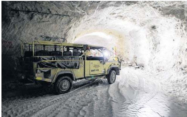
Mamy ogromne złoża soli kamiennej. Mimo to przegrywamy z zagranicznymi podmiotami, które oferują znacznie niższe ceny

– Możliwości produkcyjne kopalń w krajach UE są niewykorzystane, dlatego rynek polski narażony jest na napływ taniego produktu. Z powodu niskiego poziomu cen następuje również wypieranie polskiego „eksportu” soli do takich krajów, jak: Niemcy, Czechy, Słowacja, Węgry oraz kraje nadbałtyckie. Producenci niemieccy, K+S, SUD Salz, stanowią po-