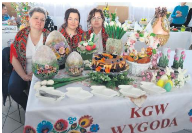
KGW Wygoda I miejsce

A oto pełne wyniki konkursu: Narody główne I KGW Wygoda – „Sernik psychotka” (nagroda 700 zł) II KGW Wola Krzysztoporska – „Wielkanocne rozetki”