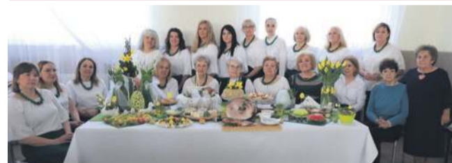
KGW Gomulin II miejsce