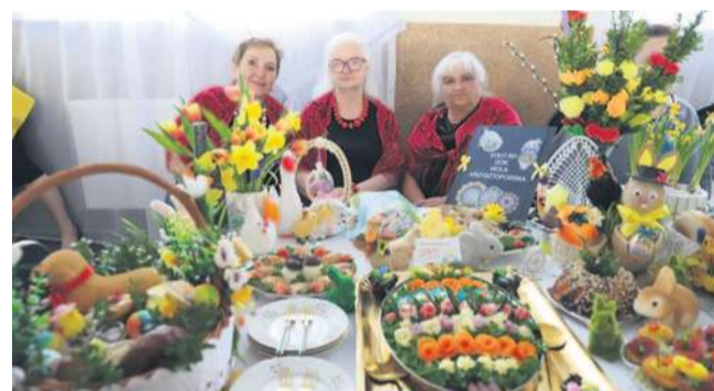
Koło 50+ III miejsce