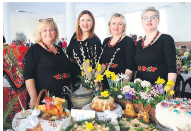
KGW Wola Krzysztoporska II miejsce