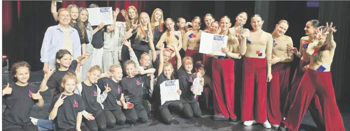
3 miejsce Małej Rewii III i wyróżnienia dla grupy II i IV na Ogólnopolskich Spotkaniach z Tańcem w Lublinie