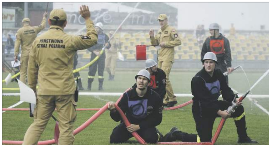
Nad sprawiedliwą oceną uczestników czuwali sędziowie, powołani przez komendanta powiatowego PSP w Rykach, mł. bryg. Łukasza Tomaszewskiego

Bazanów (43,6 s.). W klasyfikacji generalnej zwyciężyła OSP Budki Kruków przed OSP Stary Bazanów i OSP Ryki. Te trzy drużyny będą reprezentować gminę Ryki na zawodach powiatowych.