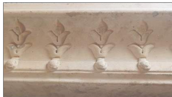
Kafle z fabryki „Leopoldów” były nie tylko użyteczne, ale i stanowiły ozdobę

tecznych robotników; to też w ostatnich czasach wielu z nich zostało zdumnami i kaflarzami, znajdując korzystne zarobki przy wyrobie kafli i ustawianiu pieców”, czytamy w tekście nieznanego autora. Ożywienie gospodarcze Rososzy spowodowało też wzrost liczby ludności. Zauważyła to sama gazeta, która wręcz zasugerowała konieczność za-