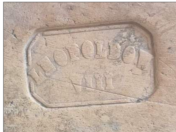
Każdy kafel wytworzony w Rososzy miał na odwrocie odciśniętą pieczęć z nazwą zakładu „Leopoldów”