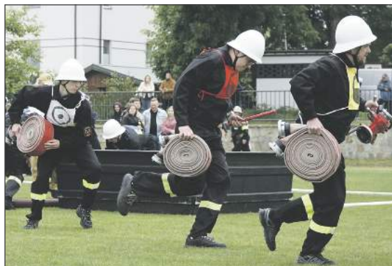
Druhowie z Ryk dali z siebie wszystko, żeby zostać mistrzem gminy. Musieli jednak zadowolić się miejscem na najniższym stopniu podium.

Wśród kobiet triumfowała drużyna z Bazanowa, wyprzedzając koleżanki z Ryk. Zwycięska drużyna będzie reprezentować powiat rycki