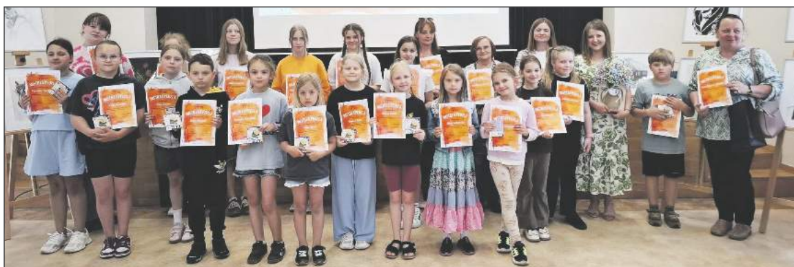
Na spotkanie przybyli rodzice z dziećmi oraz dorośli uczestnicy zajęć. Wspólnie podsumowali osiem miesięcy zajęć, podczas których każdy z uczestników rozwijał swoje umiejętności plastyczne

Na spotkaniu zjawili się zarówno rodziny z dziećmi, jak i dorośli uczestnicy zajęć. Efekty ośmiomiesięcznej pracy można było zobaczyć na wystawie prac przygotowanej przez uczestników. Dyplomy i upominki