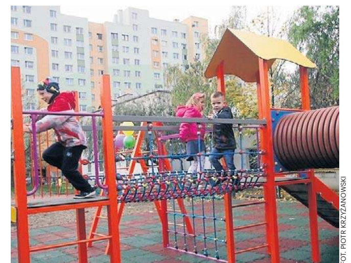
Plac zabaw przy Przedszkolu nr 18 powstał w ramach LBO w 2017 roku

Jednocześnie informuję, iż strony mogą się zapoznać z wnioskiem oraz z materiałami dotyczącymi przedmiotowej sprawy w Urzędzie Miasta Legnicy, plac Słowiański 8 (biuro obsługi klienta na parterze) w godzinach pracy Urzędu, oraz składać ewentualne uwagi i wnioski w terminie 7 dni od daty doręczenia niniejszego obwieszczenia.