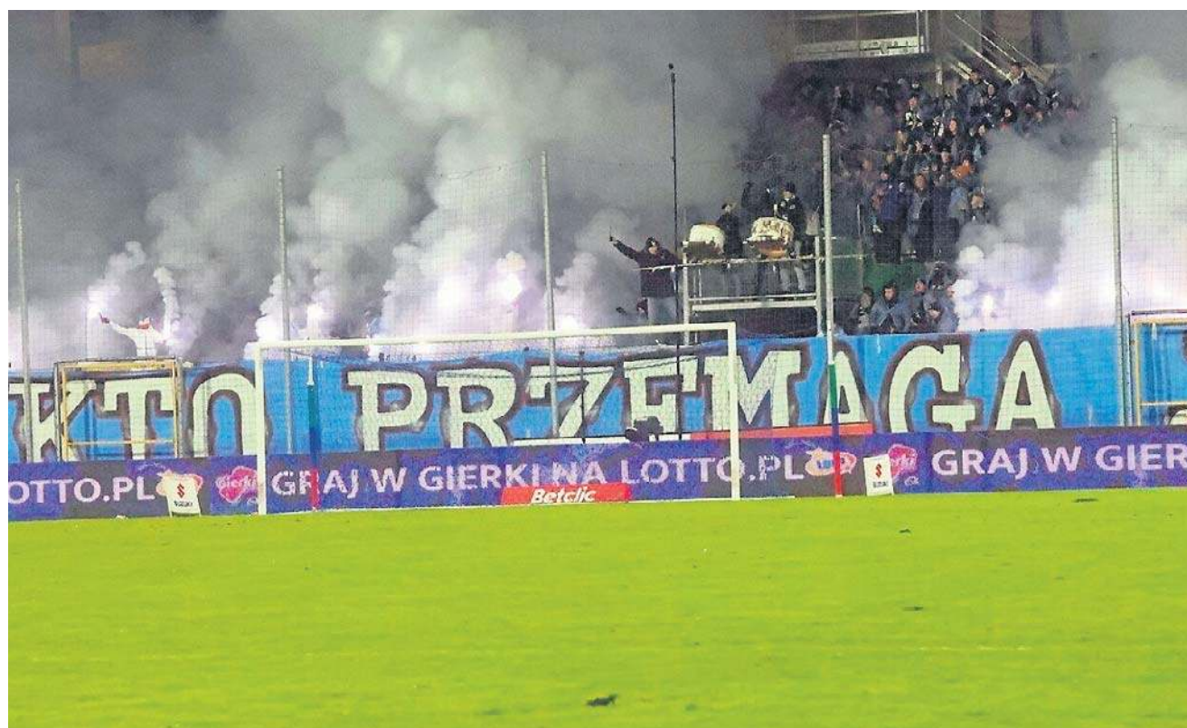
Na stadionie znów zapłonęły race. Jak będzie tym razem kara za te wybryki?