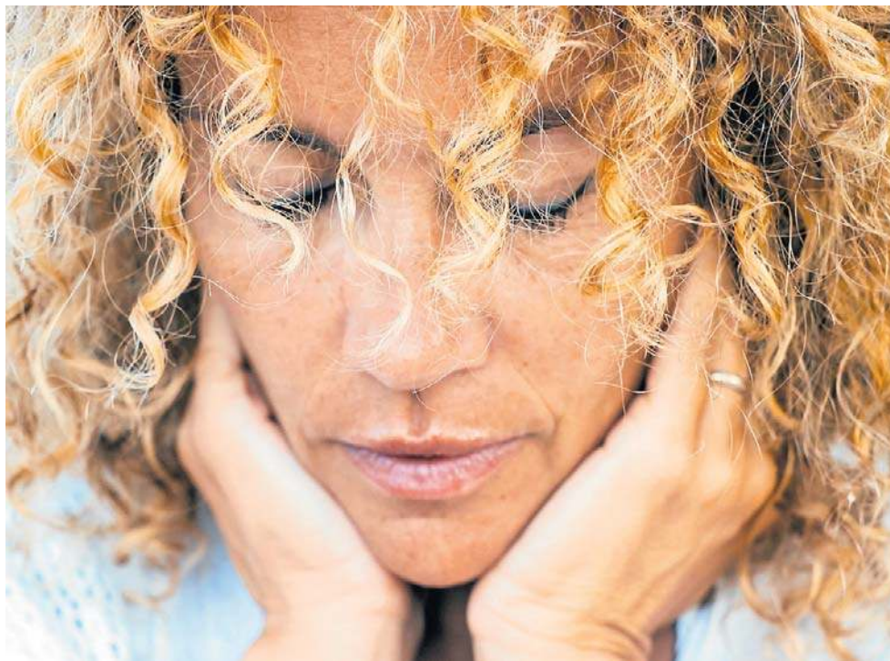
Już wcześniej łączono menopauzę z pogorszeniem funkcji poznawczych

Oprócz wypełniania ankiet odnoszących się do przebiegu