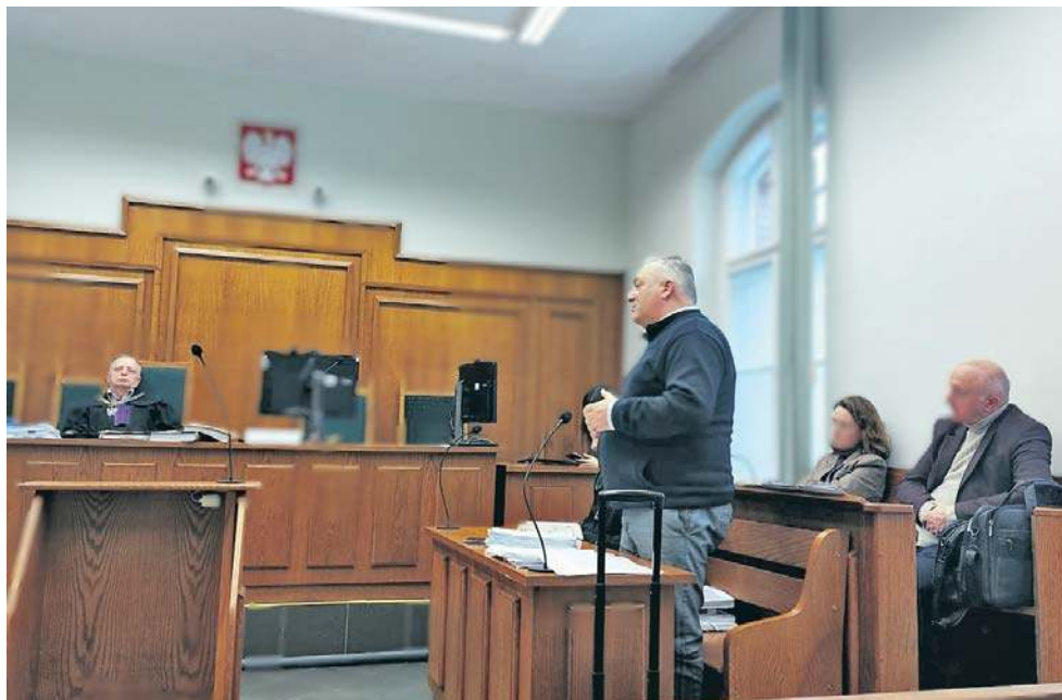
Mecenas oskarżony jest przywłaszczenie 1,8 mln zł na szkodę 163 osób