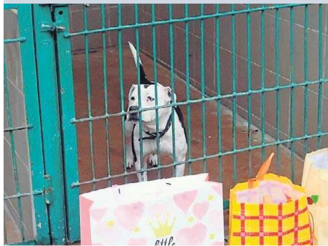
„Walentynki z Bezdomiakiem” w legnickim Schronisku dla Bezdomych Zwierząt