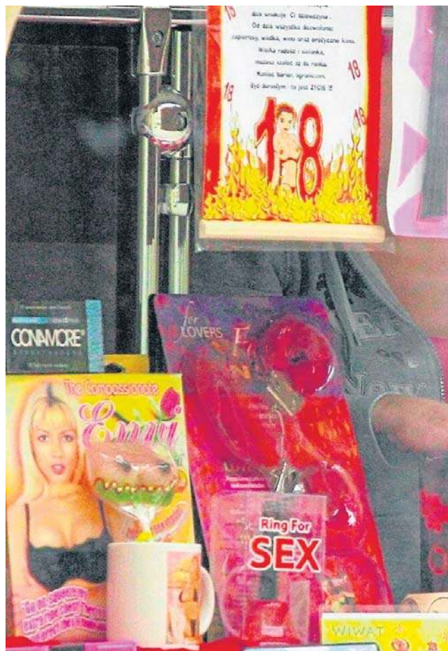
W latach 90. nikt nie zasłaniał witryn

- Przed jedną z ustawionych tam budek, przypominających wóz Drzymały, stała długa kolejka złożona z samych mężczyzn - wspomina. - Zaciekało mnie, co tam się dzieje. Okazało się, że był to rodzaj peep shopu. W budce było małe okienko