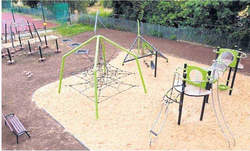
W ramach LBO latem 2025 roku otwarto na Zosinku park linowy

Nabór projektów do Legnickiego Budżetu Obywatelskiego 2027 rozpoczyna się 16 lutego. Mieszkańcy Legnicy będą mogli