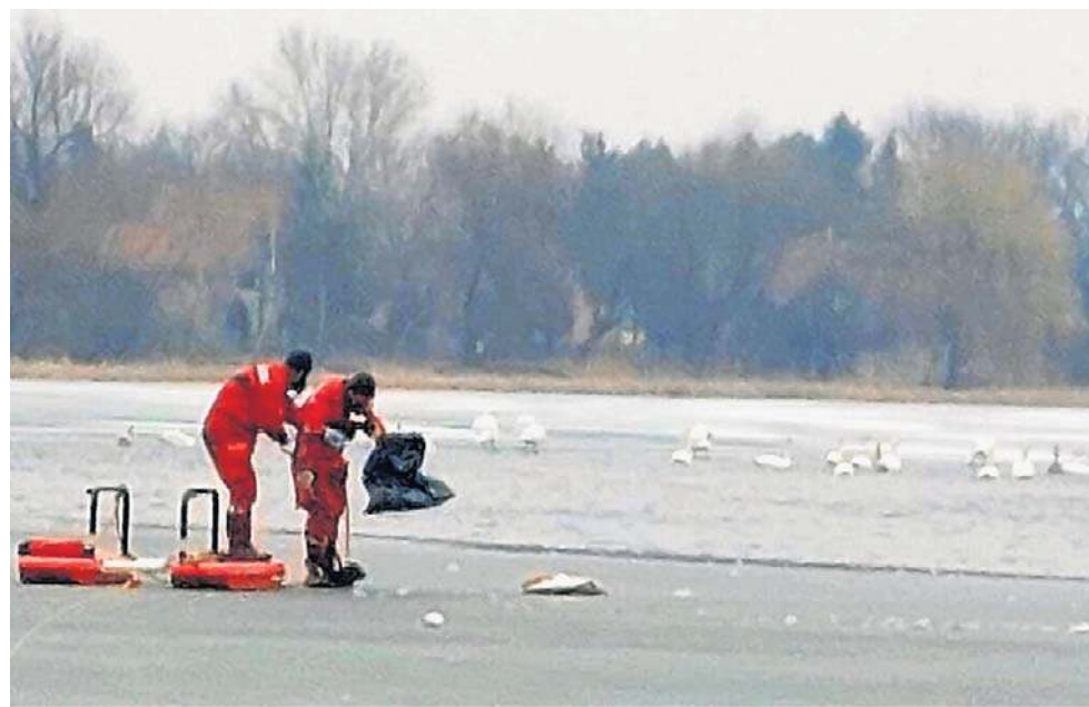
Strażacy zbierali na zamrożonych akwenach padłe łabędzie i gęsi

Telefon 76 855 05 41 legnica@wroc.wiw.gov.pl