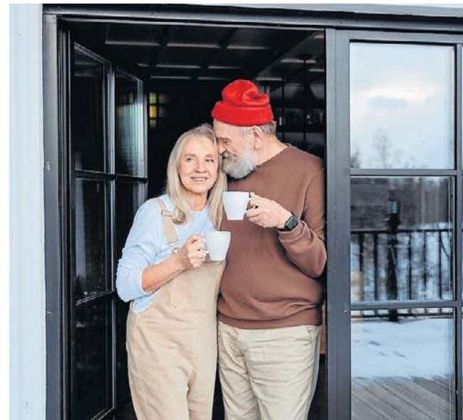
Bliskość drugiej osoby wpływa zarówno na nasze samopoczucie psychiczne, jak i na stan zdrowia