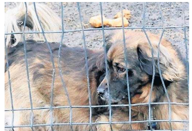
Akcja skierowana była do osób, które chciały spędzić walentynkowy czas w spokojnej, życzliwej atmosferze