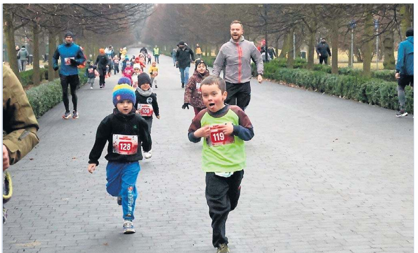
Swoją miłość do sportu okazali też najmłodszy Legniczanie