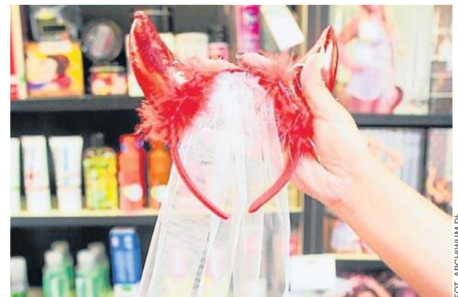
Sklepy oferowały kuszącą bieliznę

tycznego tygodnika i postanowili wspólnie zapoznać. Tygodnik z ich zdjęciami trafił do kiosków w Błazkach. Para została natychmiast rozpoznana. Młodzi ludzie wstydzi się wyjść na ulicę. Tłumaczyli potem, że nie zarobili dużo, starczyło na spłacenie długu w sklepie.