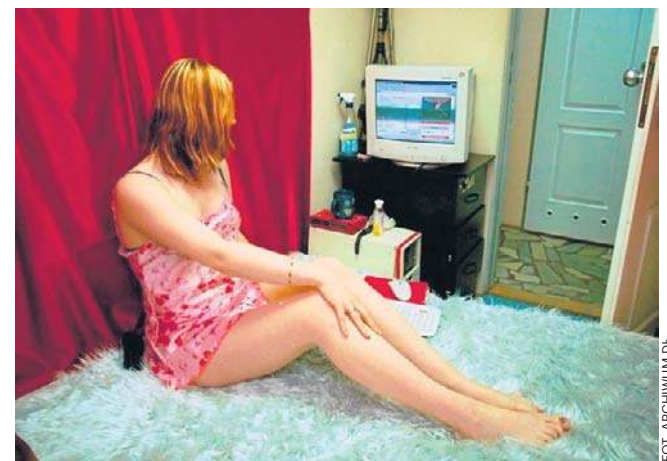
Nastąpiła eksplozja seksualnych usług

Rewolucja seksualna zawiątała też do kiosków „Ruchu”. Z ich witryn „krzyczały” erotyczne pisma. Z jednym z takich kolorowych tygodników wiąże się smutna historia. W Błazkach, w województwie łódzkim, mieszkało młode małżeństwo. Nie wiodło się im dobrze, nie mieli stałej pracy, a na utrzymaniu dzieci. Zdesperowani zgłosili się do ero-