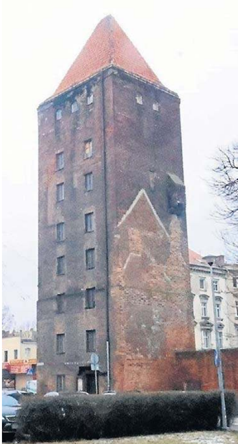
Brama Chojnowska - współcześnie i przed II wojną światową

W ramach zadania przewidziano m.in. rozbiórkę części komina wentylacyjnego na najwyższych kondygnacjach obiektu oraz demontaż wybranych elementów wyposażenia