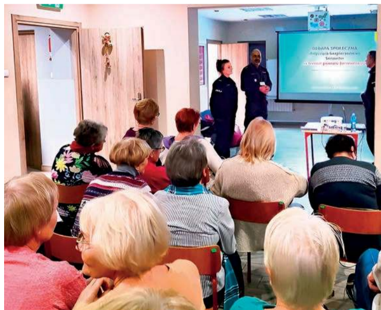
Debata policjantów i seniorów