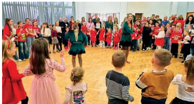
Mikołajki w gminie Opinogóra