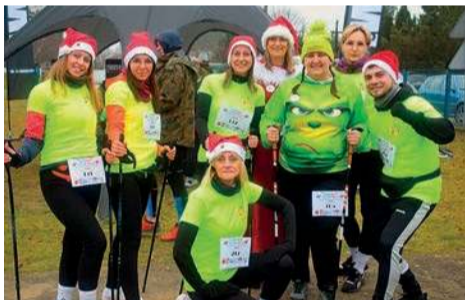
A tu zawodnicy sochocińskiego Guzika - Luzika

https://www.siepomaga.pl/bartek-loniewski KO