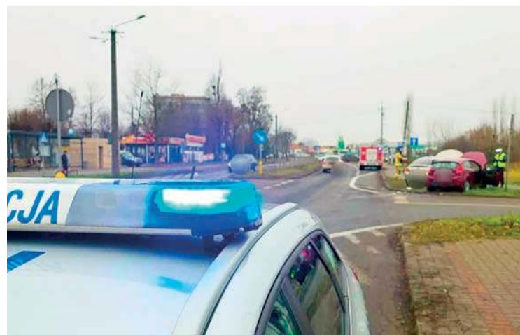
Zderzenie na skrzyżowaniu w Makowie

22 - letni kierujący został zatrzymany do kontroli drogowej. Mężczyzna został ukarany mandatem w wysokości 2500 zł., a na jego konto trafiło 15 punktów karnych.