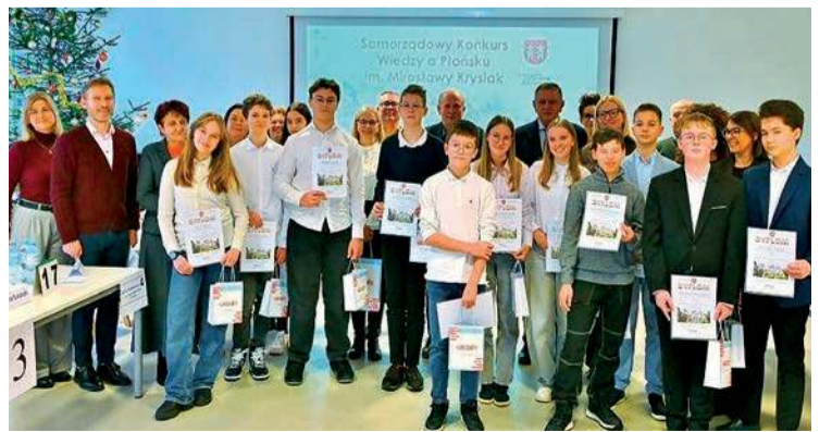
Wszyscy uczestnicy finału otrzymali pamiątkowe dyplomy i upominki. KO