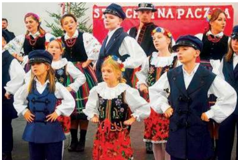
Tegoroczny finał uświetnił występ zespołu Swada

Szlachetną Paczkę wspierają osoby prywatne, firmy i instytucje, koła gospodyń, a także strażacy - w tym