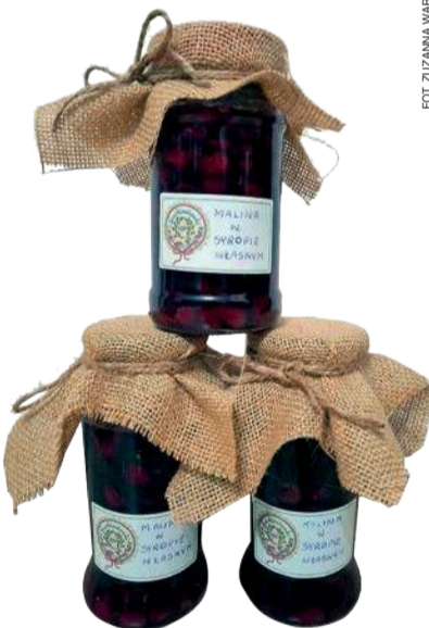
Malina w syropie własnym