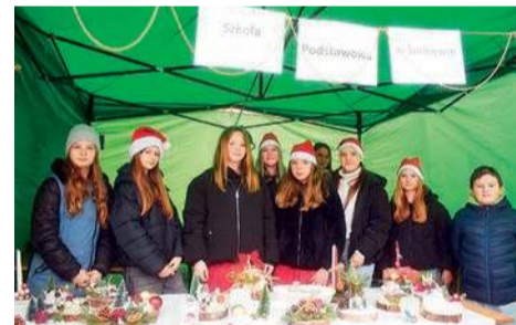
Na stoiskach można było kupić świąteczne ozdoby. Takie cudneka przygotowała szkoła w Sarbiewie