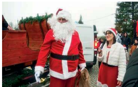
Na baboszewski jarmark przyjechał również św. Mikołaj

Jarmark zorganizowała gmina Baboszewo, a partnerem wydarzenia był powiat płoński. KO