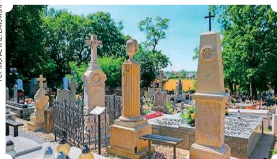
Nagrobki poddane konserwacji w latach 2022 – 2023