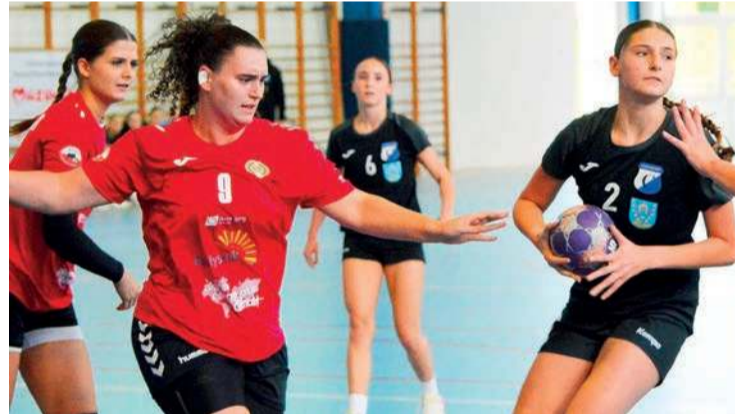
Regiminianki przewożą w tabeli