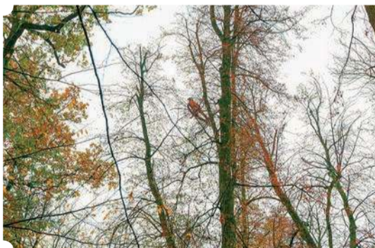
Drzewostan w trakcie prowadzonych prac pielęgnacyjnych

parkowego w Opinogórze pochodzą z przełomu XVII i XVIII wieku i są obecnie pomnikami przyrody nazwanymi „Zygmunt” i „Eliza” świadcząc jednocześnie o początkach opinogórskiego założenia ogrodowego. Choć drzewa w okresie jesiennym stanowią jeden z najwyrazistszych symboli przemijania to jednak ich wartość i znaczenie dla funkcjonowania środowiska przyrodniczego i dziedzictwa kulturowego są na tyle znaczące, że będąc w wieku sędziwym wymagają szczególnej troski i opieki, aby to przemijanie w miarę możliwości jak najbardziej spowalniać dla