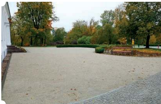
Alejki po wykonanym remoncie