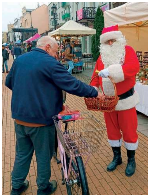
Po jarmarku przechadzał się Święty Mikołaj