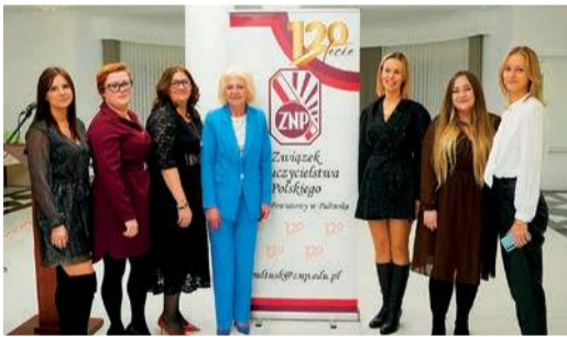
Czas na pamiątkowe zdjęcia środowiska, które dba o przyszłość edukacji