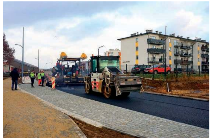
Ulica Karola Szwanke w Ciechanowie

W najbliższym czasie roboty przeniosą się na kolejny fragment ulicy – od Miejskiego Przedszkola nr 2 w kierunku ul. Płońskiej. Jak informuje inwestor, tempo prac zależy od warunków atmosferycznych.