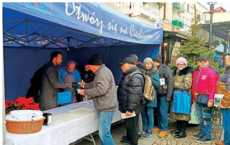
Prezydent serwował wigilijne potrawy