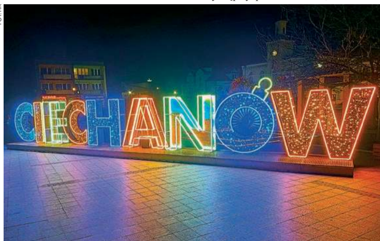
Miasto rozświetliło świątecznymi iluminacjami

W18, gdzie również w oba weekendowe dni odbywały się bezpłatne bożonarodzeniowe warsztaty. Mieszkańcy zjawili się tłumnie, zabrakło jedynie śniegu, ale do tego zdążyliśmy się już wszyscy przyzwyczaić.