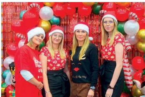
W tym roku w płońskim rejonie Szlachetnej Paczki pracuje 31 wolontariuszy

roku były to PSP Płońsk, oraz jednostki OSP: Dzierżążnia, Krępicca, Żukowo, Siedlin, Strachowo a także Stowarzyszenie Idziemy na Spacer.