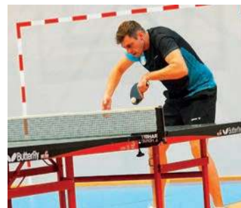
Zawodnicy z Ciechanowa pokonali rywali z Radzymina

Pirania I Radzymin 8:4, KS Sokół Serock - WKS Sochaczew 2:8, MUKS II Gąbin - ŁTKS PROFILETER Łochów 6:8, UKS Olimpia Krasnosielc - Tęcza II Budki Piaseckie 3:8