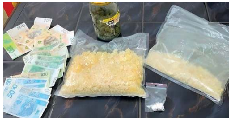
Policja znalazła to w domu ciechanowianina