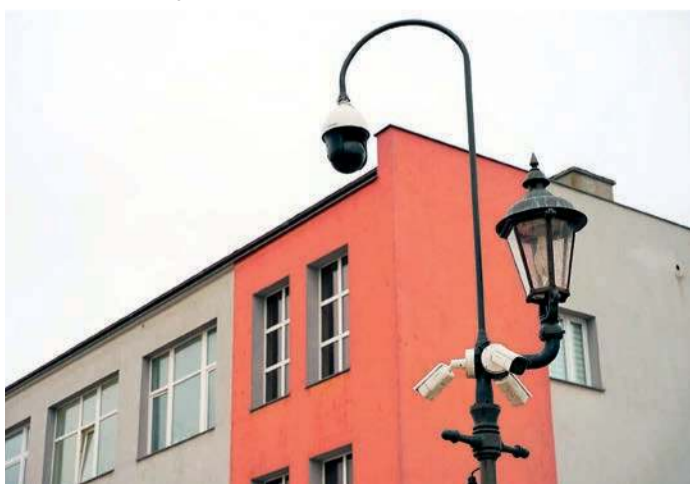
Mieszkańcy są pod stałą obserwacją

Wśród nowych lokalizacji monitoringu znalazły się również: plac Jana Pawła II (kamera przy budynku nr 3) oraz ul. Warszawska w rejonie pasażu