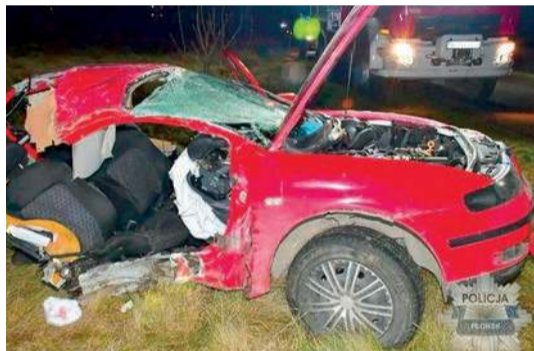
Siła uderzenia była tak duża, że auto rozpadło się na dwie części. Młody kierowca, który był pod wpływem alkoholu i narkotyków, stanie teraz przed sądem

- Prokurator nadzorujący śledztwo uzyskał aż 8 pisemnych opinii biegłych różnych specjalności. Bezspornie ustalono, że w takich warunkach drogowych, jakie miały miejsce przed uderzeniem samochodu w drzewo: prosty odcinek drogi, brak ruchu, niezbyt wysoka prędkość, trzeźwy kierowca nie doprowadziłby do tego wypadku i byłby w stanie