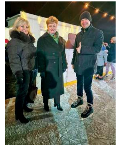
Otwarcia lodowiska dokonali m.in. wójtowie Pułtuska wraz z wicedyrektor PSP nr 4

Sezon na pułtuskim lodowisku potrwa do 1 lutego 2026 r., czyli do zakończenia ferii zimowych. Obiekt dostępny jest dla użytkowników od poniedziałku do piątku w godzinach 15.00–20.30, natomiast w soboty i niedziele od 9.00 do 14.00 oraz od 15.00 do 20.30, z przerwą techniczną od 14.00 do 15.00. W ferie zimowe lodowisko będzie czynne od godz. 9.00 do godz. 14.00 i od godz. 15.00 do godz. 20.30.