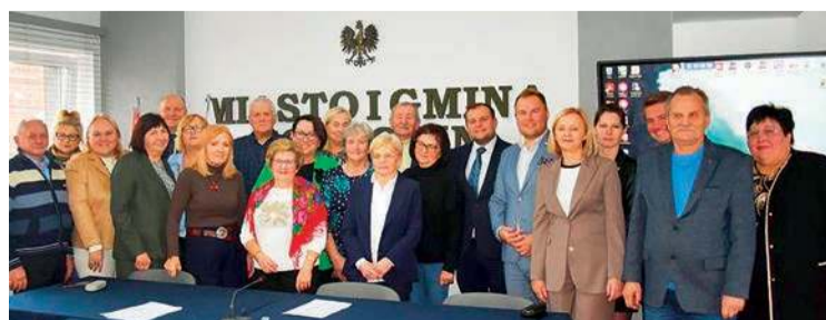
W Sochocinie powstała rada seniorów

W Miejskim Centrum Kultury w Płońsku odbył się finał miejski 24. edycji Samorządowego Konkursu Wiedzy o Płońsku im. Mirosławy Krysiak. Zwyciężyła drużyna płońskiej dwójki.