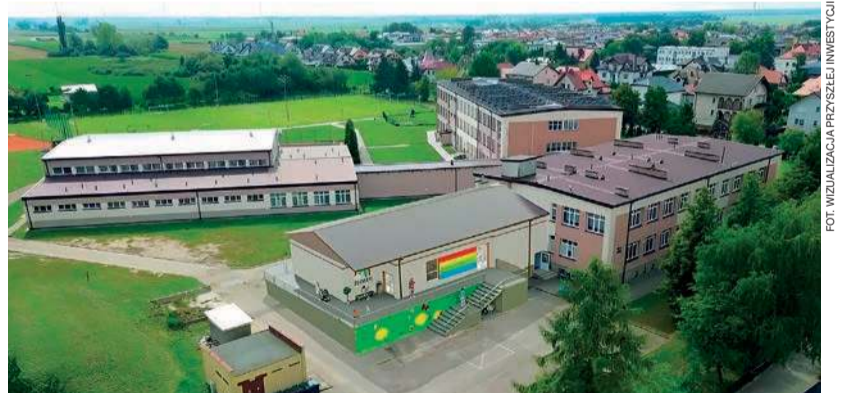
FOT. WIZUALIZACJA PRZYSZŁEJ INWESTYCJI