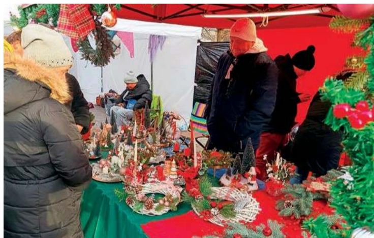
Na jarmarku królowały świąteczny asortyment