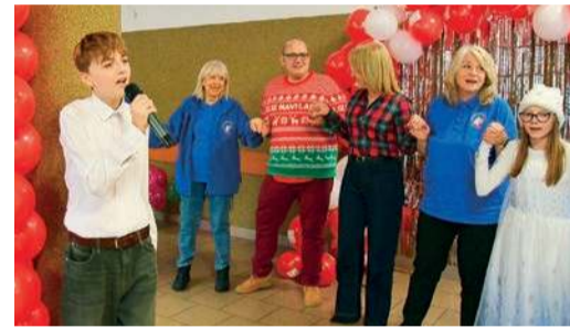
Wspólne śpiewanie świątecznych utworów zintegrowało darczyńców i wolontariuszy

Uroczystość uświetnili uczniowie Publicznej Szkoły Podstawowej nr 3 w Pułtusku, prezentując wzruszający program słowno-muzyczny.