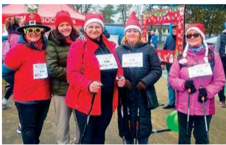
Bieg Zimowy odbył się w Sochocinie