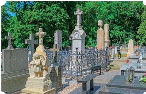
Nagrobki poddane konserwacji w latach 2022 – 2023

Przy realizacji celu Muzeum Romantyzmu w Opinogórze, jakim jest przywracanie do dawnej świetności obiektów, które