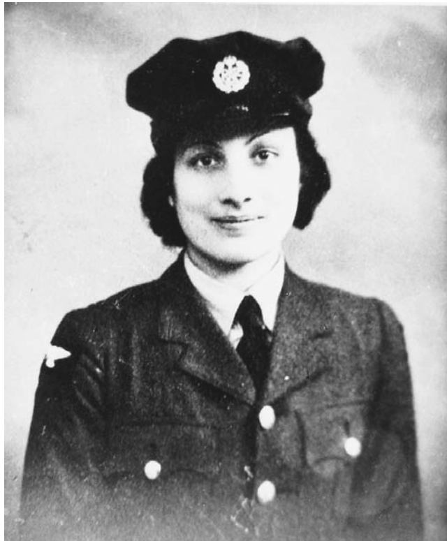
Noor Inayat Khan