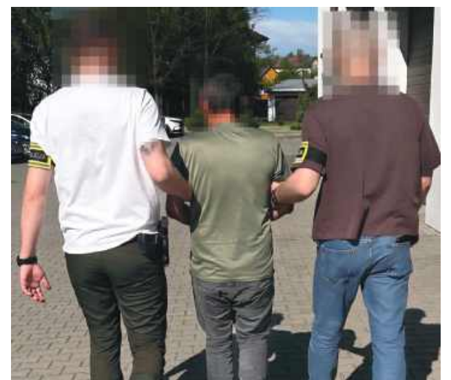
Wszyscy zatrzymani trafili za kratki.

Dodaje, że w ostatnim czasie tomaszowscy kryminalni prowadzili wzmoczone działania ukierunkowane na zatrzymanie osób poszukiwanych,