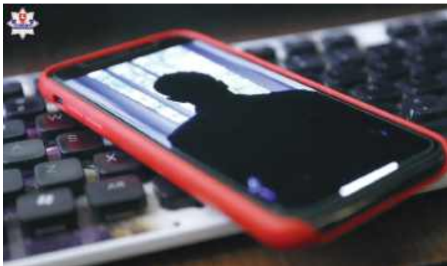
45-latek zaufał nieznajomemu i kliknął w otrzymany od niego link, w efekcie z jego konta bankowego wyparowało 6 tys. zł.

45-latek z powiatu biłgorajskiego wystawił na