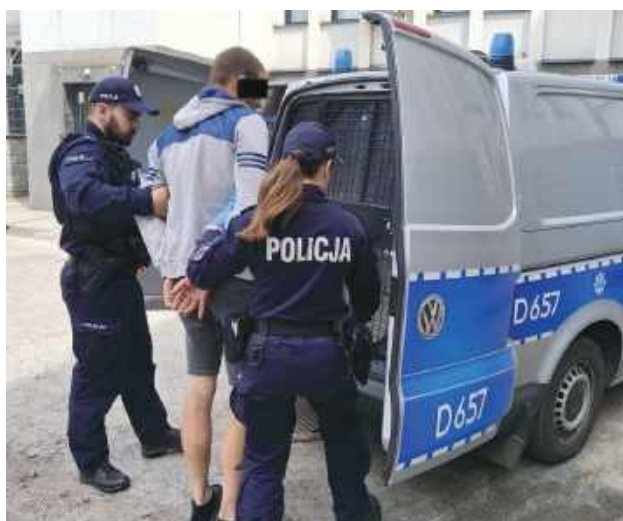
38-latek za kratkami spędzi najbliższych 6 lat i 2 miesiące.

Twierdziła, że 38-latka nie ma w mieszkaniu. Policjanci