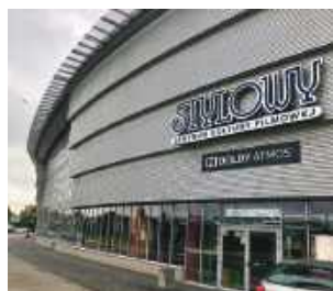
To kolejny rok, w którym zamojskie kino otrzymuje wsparcie z Polskiego Instytutu Sztuki Filmowej na rozwój infrastruktury i działalności filmowej.

ZAMOŚĆ Centrum Kultury Filmowej „Stylowy” w Zamościu po raz kolejny otrzymało wsparcie z Polskiego Instytutu Sztuki Filmowej. Dzięki dotacji w wysokości 235 tys. 705 zł zamojskie kino zrealizuje sześć projektów związanych z modernizacją obiektu, poprawą dostępności oraz organizacją wydarzeń filmowych.