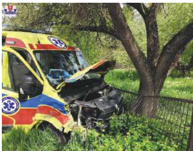
Po zderzeniu pojazdów kierujący karetką przejechał przez pobocze, chodnik i uderzył w ogrodzenie posesji.

ZAMOŚĆ Do groźnie wyglądającego zdarzenia doszło w poniedziałek 11 maja na ulicy Lipskiej w Zamościu. Karetka pogotowia jadąca na sygnałach zderzyła się z osobowym renault wykonującym manewr skrętu w lewo. W wyniku wypadku do szpitala trafiły cztery osoby, w tym kierująca autem osobowym.