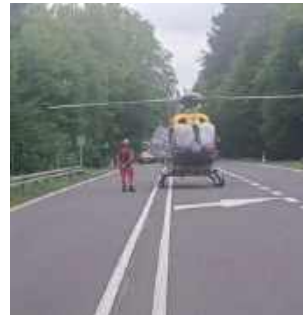
Obrażenia były na tyle poważne, że na miejsce wezwano śmigłowiec LPR, który przetransportował ranego 24-latkę do szpitala w Lublinie.

szczególnej ostrożności i rozsądek. Quad to potężna maszyna, która w trudnym terenie lub przy nadmiernej prędkości staje się śmiertelnym zagrożeniem – podkreśla podkom. Kamil Karbowniczek z lubelskiej policji.