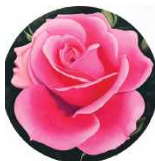
Wystawa „W moim ogrodzie” odsłania świat pełen symboli i ukrytych znaczeń.

z nowoczesnych technologii czy cyfrowych narzędzi. Pozostaje wierny tradycyjnemu warsztatowi malarskiemu, opierając się na in-