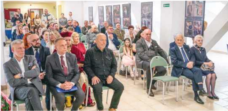
Uroczystość odbyła się w głównej siedzibie zamojskiej biblioteki przy ul. Kamiennej 20.