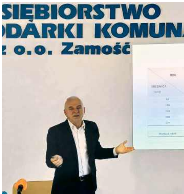
PGK otrzymała właśnie dotację w kwocie 700 tys. zł, która zostanie przeznaczona na nową dokumentację i systemy chroniące ujęcia wody oraz studnie przed ingerencją w ich sterowanie.

ZAMOŚĆ W obliczu współczesnych zagrożeń hybrydowych bezpieczeństwo strategicznej infrastruktury Zamościa przenosi się z poziomu fizycznych ogrodzeń do przestrzeni cyfrowej. Przedsiębiorstwo Gospodarki Komunalnej pozyskało 700 tys. zł dotacji na wzmocnienie cyberbezpieczeństwa. Według prezesa spółki, to właśnie ataki w sieci, a nie próba skażenia wody, stanowią dziś realne zagrożenie dla ciągłości dostaw.