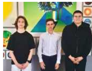
Biłgorajski „ONZ-et” to marka, z którą trzeba się liczyć.

z kilkudziesięciu krajów. Tutaj podręcznikowe schematy to za mało. Liczy się nieszablonowe myślenie, błyskawiczne kojarze-