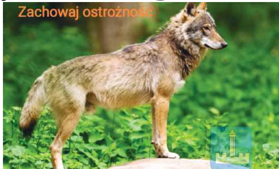
W ostatnim czasie napłynęły niepokojące doniesienia o obecności wilka w bezpośrednim sąsiedztwie gospodarstw w Rogalinie

N otkę o wilku widywanym w Rogalinie opublikowano na internetowej stronie Gminy Horodło. Autorzy apelują do mieszkańców tej miejscowości oraz okolic, aby zachowali czujność. Choć wilk jest pod ścisłą ochroną i zazwyczaj unika kontaktu z ludźmi, jego pojawienie się przy zabudowaniach to sygnał ostrzegawczy, którego nie wolno bagatelizować. Drapieżnik w pobliżu domostw to