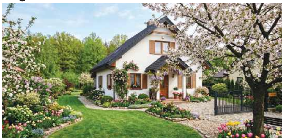
Maj to idealny miesiąc na odświeżenie posesji

W maju każdy mankament otoczenia staje się widoczny jak na dłoni, ponieważ wiosenne słońce bezlitośnie obnaża wszelkie niedociągnięcia. Warto zacząć od gruntownego wyczyszczenia