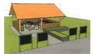
Tak ma wyglądać nowa sala lekcyjna na terenie „Dwójki”. Wizualizacja UM Zamość

ZAMOŚĆ Kolejna placówka oświatowa zyska miejsce do prowadzenia lekcji na świeżym powietrzu. Miasto ogłosiło właśnie przetarg na budowę plenerowej sali dydaktycznej przy Szkole Podstawowej nr 2 im. Henryka Sienkiewicza w Zamościu. Inwestycja zostanie zrealizowana w ramach budżetu obywatelskiego.