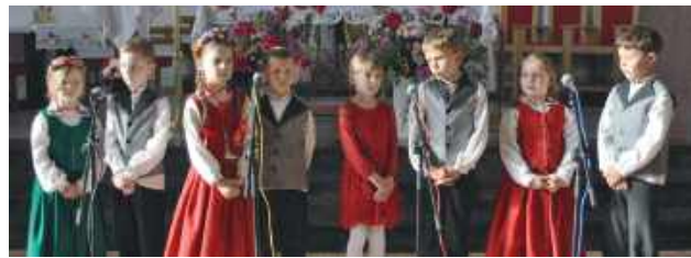
Udział w Gminno-Parafialnym Przeglądzie Pieśni Maryjnej i Matczyńskich w Lubyczy brali nie tylko dorośli, ale też dzieci i młodzież.