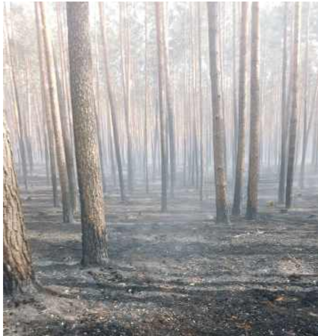
Leśnemu arealowi potrzeba sanitarnej wycinki, wiąże się z tym usunięcie drzew zagrażających zdrowym częściom lasu.

Czarny bilans wielkiego pożaru: ogień przetrwał aż 1157 hektarów lasów. Żywioł najmocniej uderzył w tereny Lasów Państwowych, gdzie