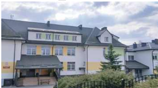
Szkoła Podstawowa im. Żołnierzy Armii Kraków w Łosińcu zakupi defibrylator AED.

„Każdemu z nas, niezależnie od stanu zdrowia, może pojawić się problem z sercem, oddechem czy utratą przytomności. W takich sytuacjach bardzo ważna jest szybka reakcja