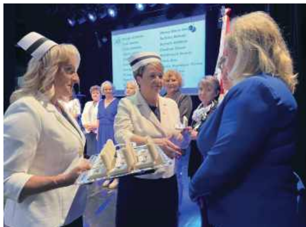
Najważniejszym punktem uroczystości było wręczenie „Złotych Czepeków”.

Organizatorem wydarzenia była Okręgowa Izba Pielęgniarek i Położnych w Zamościu. W uroczystości uczestniczyli