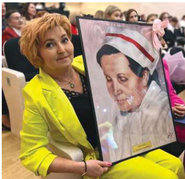
Od 2006 r. szkoła nosi imię Stanisławy Leszczyńskiej.

Jubileusz stał się okazją do wspomnień i podsumowania wieloletniej działalności szkoły,