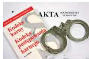
Policjanci z Hrubieszowa wszczęli dochodzenie w sprawie narażenia dwójki dzieci na bezpośrednie niebezpieczeństwo utraty życia lub ciężkiego uszczerbku na zdrowiu.

się prosto do półek z żywnością. Nie szukał zabawek – prosił o jedzenie, skarżąc się na głód. Pracownicy sklepu zareagowali błyskawicznie, otaczając dziecko