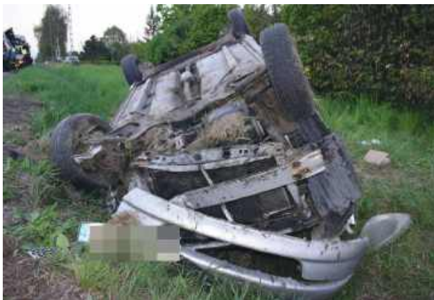
Kierujący toyotą dachował. Świadcami wypadku byli policjanci, pierwsi ruszyli na ratunek.

W środę, 13 maja, około godziny 16 na drodze krajowej numer 17 w Chomęciskach Małych doszło do dachowania osobowej toyoty. Bezpośrednimi świadkami zdarzenia byli poli-