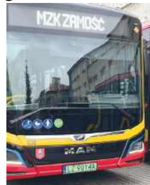
Nowe autobusy to 12-metrowe pojazdy nowej generacji wyposażone w silniki elektryczne o mocy 160 kW.