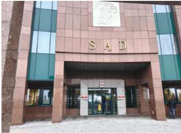
Sprawa znajduje się na etapie postępowania pojednawczego.

O tym, że prezydent Rafał Zwolak ma „jakaś sprawę w sądzie”, mówi się w Zamościu od dłuższego czasu. Postanowiliśmy to sprawdzić. Okazuje się, że trzy lata temu mieszkanka Zamościa poczuła się pomówiona w mediach społecznościowych przez Rafała Zwolaka i kilka innych osób. Chodziło o pomoc dla jej bratanka, który półtora roku