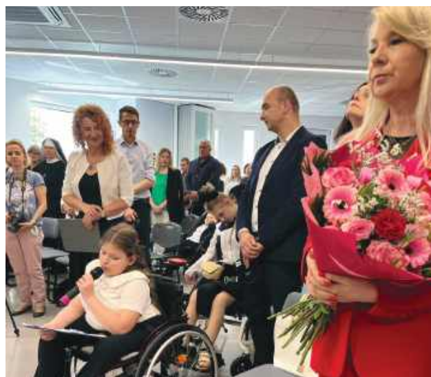
Jednym z najbardziej poruszających momentów uroczystości była część artystyczna przygotowana przez uczniów Niepublicznej Szkoły Podstawowej „Krok za krokiem” w Zamościu.

Jednym z najbardziej poruszających momentów uroczystości była część artystyczna przygotowana przez uczniów Niepublicznej Szkoły Podstawowej „Krok za krokiem” w Zamościu. Występ