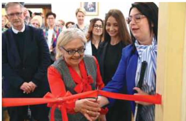
Uroczyste otwarcie nowej placówki miało miejsce 12 maja.

Uroczyste otwarcie tyfoplacówki, czyli specja-