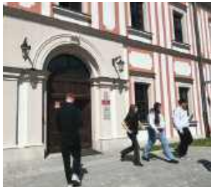
Uroczystości jubileuszowe zaplanowano na 29 maja.

Rozpoczyna się mszą św. w Katedrze Zamojskiej o godz. 9.30. Później pod pomnikiem Hetmana Jana Zamojskiego, założyciela miasta i patrona szkoły, zostaną złożone kwiaty. Następnie uczestnicy rocznicowych obchodów wezmą udział w gali (godz. 11) zorganizowanej na dziedzińcu