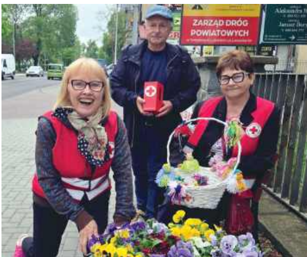
Klub Seniora PCK Tomaszów Lubelski dołączył do świętowania 107. rocznicy powstania Polskiego Czerwonego Krzyża i Półksiężycy.

Członkowie Klubu Seniora PCK w Tomaszowie Lubelskim uczcili 107. rocznicę powstania Polskiego Czerwonego Krzyża i Czerwonego Półksiężycy. Obchody były okazją do przypomnienia o idei bezinteresownej pomocy, solidarności i codziennej pracy tysięcy wolontariuszy wspierających potrzebujących w Polsce i na świecie.