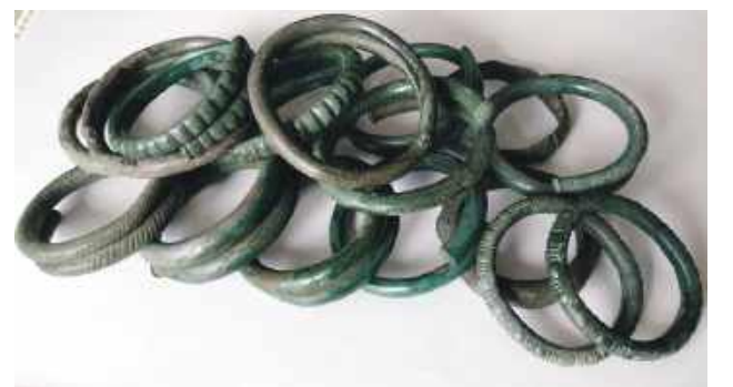
Skarb składa się z 18 brązowych ozdób o łącznej wadze 3,6 kilograma. Fot. LWKZ

Skarb składa się z 18 brązowych ozdób o łącznej wa-