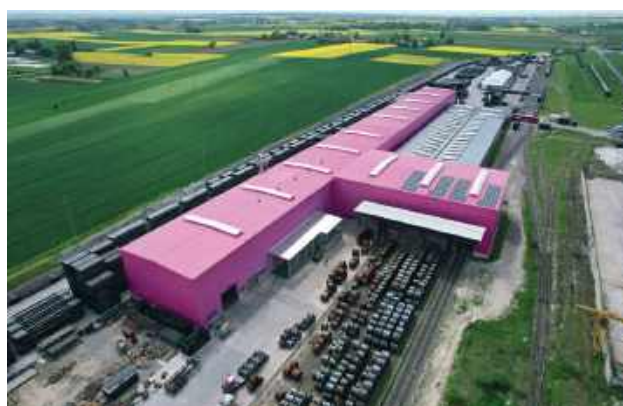
Terminal należący do Laude Smart Intermodal ma zdolności przeładunkowe sięgające 15 tys. kontenerów TEU rocznie.

Po 12 miesiącach intensywnych prac inwestycyjnych nowy budynek został oficjalnie oddany do użytku. To