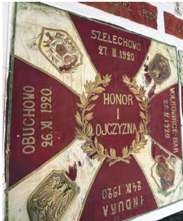
Lubelski Wojewódzki Konserwator Zabytków formalnie przekazał sztandar 4. Pułku Strzelców Podhalańskich i proporzec na własność Muzeum Regionalnemu w Tomaszowie Lubelskim. Gdy przejdą pomyślnie cały proces zabezpieczenia i konserwacji, będzie można je tam oglądać.