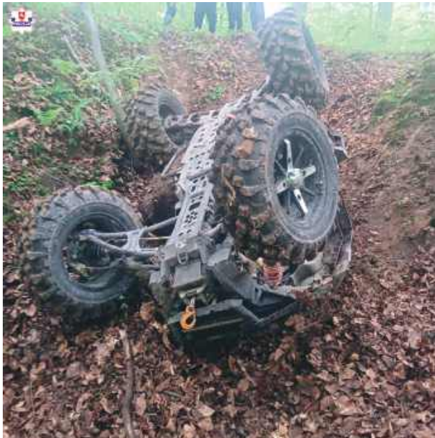
Maszyna nie podołała podjazdowi. Podczas ataku na szczyt quad wyrzucił się, przygniatając młodego mężczyznę.

Do mrozącego krew w żyłach zdarzenia doszło 8 maja przed południem w kompleksie leśnym w okolicach miejscowości Olszanka (gmina Turobin). 24-letni mieszkaniec Lublina podczas jazdy czterokołowcem postanowił zmierzyć się ze stromym wzniesieniem, niestety, maszyna nie podolała podjazdowi. Podczas ataku na szczyt quad wyrzucił się, przygniatając