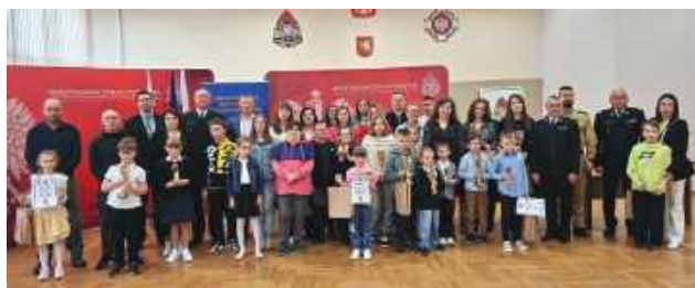
W Tomaszowie podsumowano powiatowy etap strażackiego konkursu plastycznego.

Konkurs strażacki od lat cieszy się dużym zainteresowaniem dzieci, młodzieży i dorosłych, a jego celem jest popularyzowanie wiedzy z zakresu ochrony przeciwpożarowej, działalności straży pożarnej oraz kształtowanie świadomości