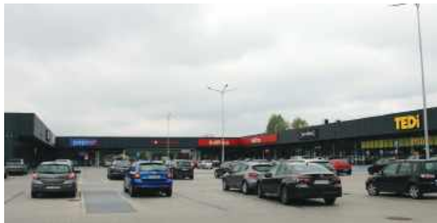
Główny Inspektor Nadzoru Budowlanego stanął po stronie inwestora i Starostwa Powiatowego w Tomaszowie Lubelskim w sporze o kompleks handlowo-usługowy przy ul. Sikorskiego. Decyzja oznacza, że legalność inwestycji nie jest zagrożona.

Głównym punktem zapalnym była liczba miejsc parkingowych.