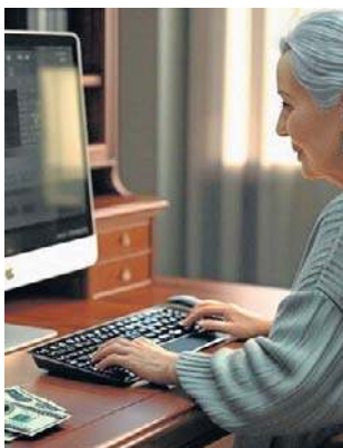
Oszust wyłudził od kobiety 50 tys. zł

często podają się za osoby mieszkające lub pracujące za granicą. Twierdzą, że mają wysokie stanowisko, ale z powodu wyjątkowej sytuacji nie mogą wypłacić swoich pieniędzy. Proszą o pomoc finansową „tylko na chwilę”, obiecując szybki zwrot. Wysyłają zdjęcia i dokumenty znalezione w internecie, które mają uwiarygodnić ich historię. Starają się wywołać poczucie winy, presję czasu lub litość. Bardzo prosimy o zachowanie ostrożności w internetowych kontaktach - mówi Anna Tersa.