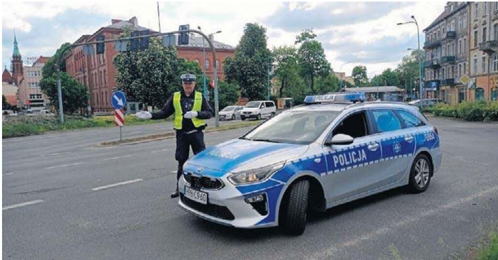
W ostatnich tygodniach policja zatrzymuje setki nietrzeźwych kierowców

W miniony poniedziałek (11 sierpnia) dzielnicowy z Komisarzatu Policji w Bolkowie, patrolując teren miejscowości Nowe Rochowice, zatrzymał do kontroli osobowego citrena. Podczas rozmowy z kie-