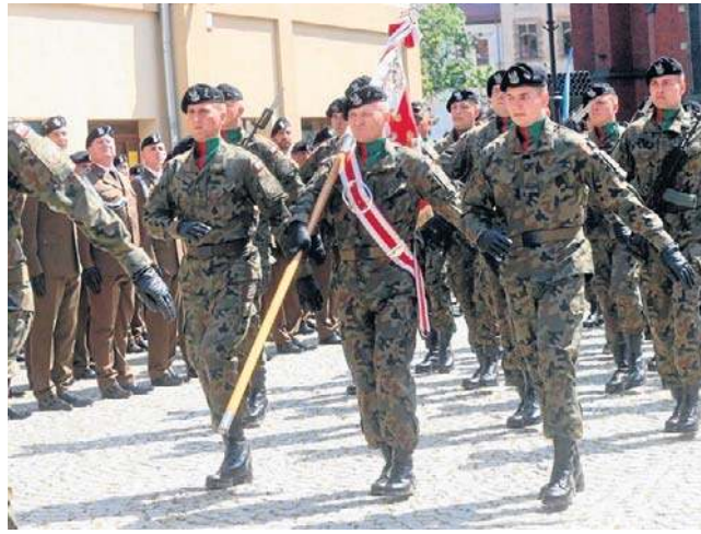
Był uroczysty apel, ale też warsztaty, koncerty, śpiewy patriotyczne i prelekcje na temat bezpieczeństwa