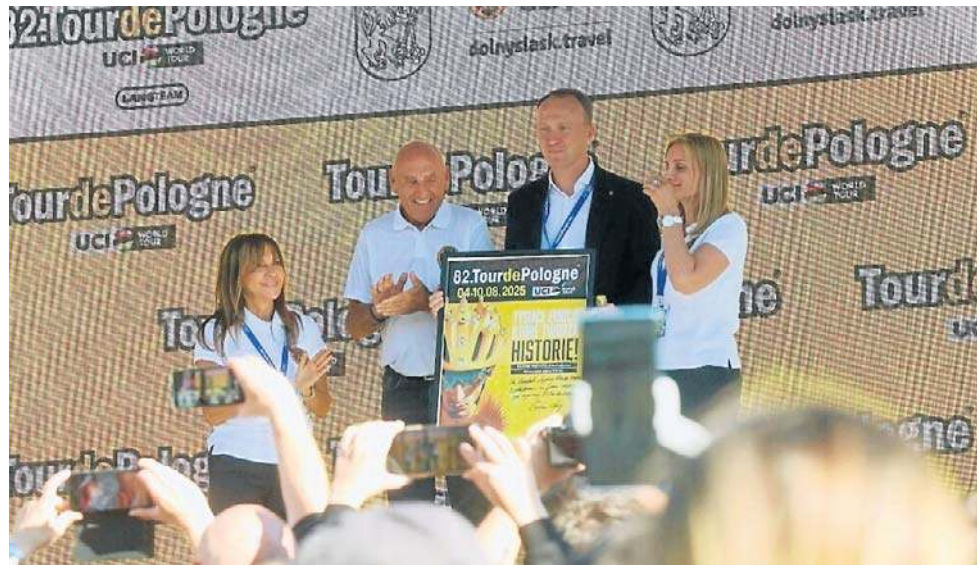
Prezydent Maciej Kupaj podczas uroczystości zakończenia I etapu wyścigu

Ponadto zapytaliśmy o szczegóły związane z zyskami promocyjnymi, wizerunkowymi i turystycznymi w związku z organizacją mety 1. etapu Tour de Pologne w Legnicy. Okazuje się, że urzędnicy nie mieli sporządzonego dokumentu, który wskazywałby, ile miasto może zyskać na imprezie. Dopiero po naszym pytaniu miasto zapewniło, że taki dokument powstanie i zostanie wyceniony ekwiwalentem reklamowy za czas emisji, w którym mówiono o mieście i pokazywano miasto. Takie dane mają być gotowe we wrześniu.