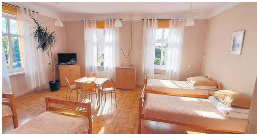
Schronisko ma 50 miejsc noclegowych

Schronisko zostało zaliczone do I kategorii w zakresie standardu wyposażenia i świadczonych usług. Pracuje w nim 7 osób