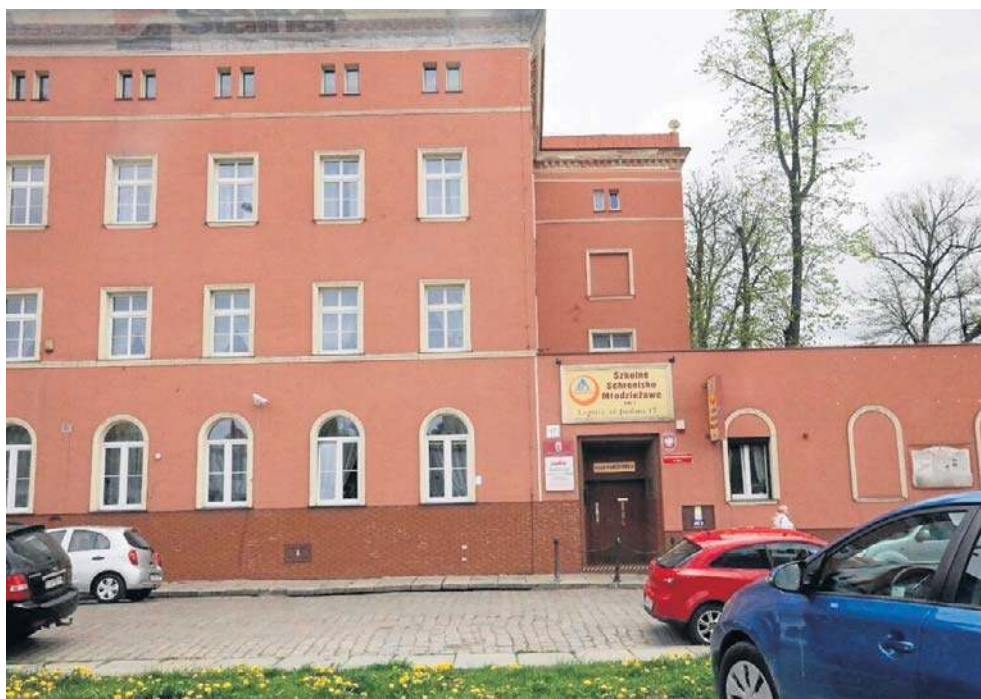
Władze miasta mówią, że schronisko przyjmuje mało grup młodzieżowych

sko zostało zaliczone do I kategorii w zakresie standardu wyposażenia i świadczonych usług. W placówce zatrudnionych jest 7 pracowników administracji i obsługi.