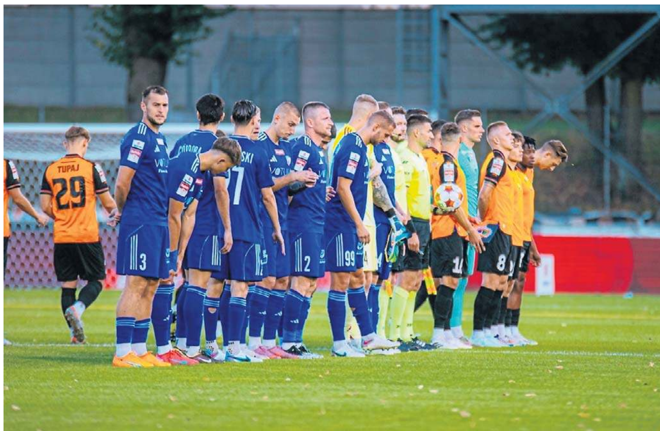
Po remisowym meczu w Głogowie, Miedź Legnica 19 sierpnia przyjmie u siebie ŁKS Łódź (g. 16)