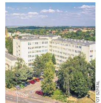
Szpital otrzyma sprzęt w październiku

Na czas dostawy urządzenia oraz adaptacji pomieszczeń Pracowni Tomografii Komputerowej, badania wykonywane są nieprzerwanie w mobilnej pracowni, która znajduje się przy szpitalu, co pozwoli zachować ciągłość świadczeń dla pacjentów.