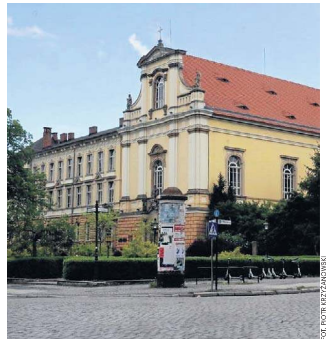
Trwają zapisy na wielki jubileusz I LO. Ogólniak na pl. Klasztornym był pierwszym LO po 1945 roku w Legnicy

Szkoła ma niezwykle korzenie, znajduje się w barokowym budynku, który pierwotnie pełnił funkcję klasztoru sióstr benedyktynek. Budynek wzniesiono między 1700 a 1723 rokiem. W 1886 roku zaadaptowano go na potrzeby niemieckiej szkoły realnej, a później,