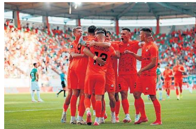
Kibice lubińskiej drużyny już dawno nie mieli takiej okazji do radości

Lechia: Weirauch - Jaunzems (73. Kałahur), Żelizko, Diaczk, Vojtko - Mena, Kapić (C), Neugebauer (73. Wójtowicz), Sezonienko (46. Alla) - Wjunnyk (46. Głogowski), Kurminowski (46. Bobček).