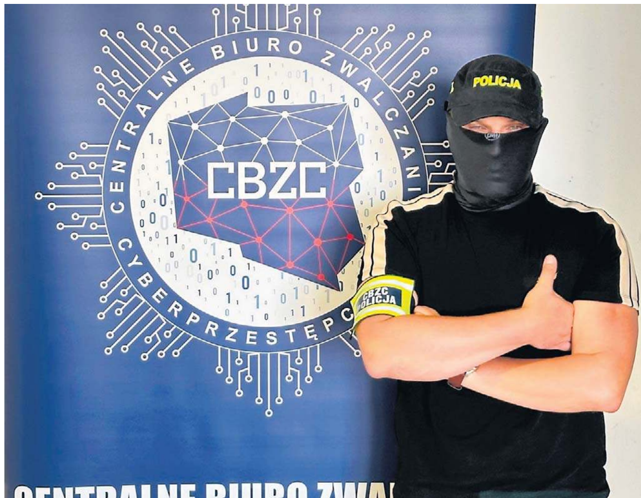
Przestępcy potrafią tak poprowadzić rozmowę, że ofiara sama przekazuje im wszystkie potrzebne dane – mówi policjant

Oszustwa inwestycyjne nie znikają. Zmieniają się tylko historie, które mają nas przekonać, że to dobry interes. To nie kliknięcie w reklamę jest błędem – błędem jest zaufanie komuś, kto chce zainwestować nasze pieniądze przez zdalny dostęp.