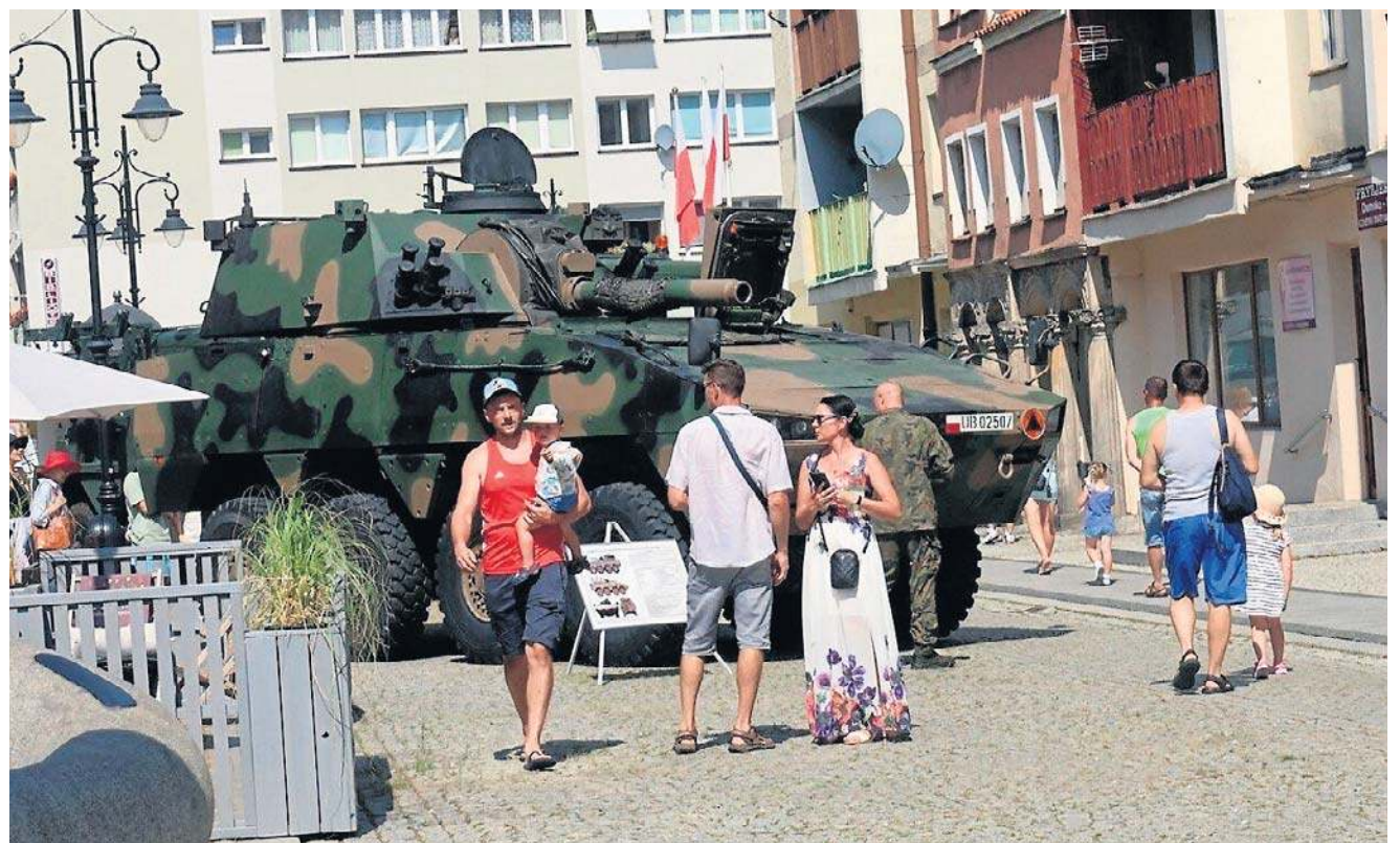
Na Rynku stanęły ciężkie wojskowe maszyny, można je było dosłownie dotknąć