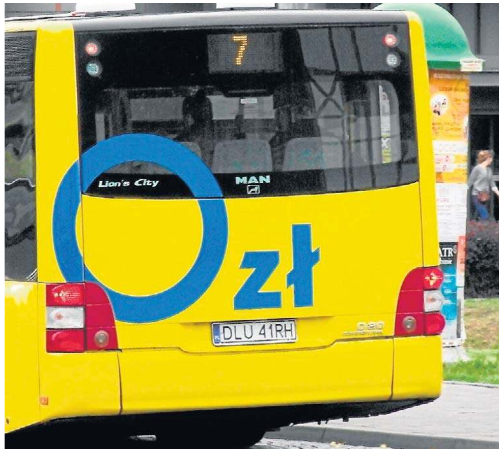
W Lubinie bezpłatna komunikacja działa od 2014 roku

PKS Lubin zdecydował się ponownie wystąpić na drogę sądową, domagając się ponad 32 milionów złotych refundacji oraz odsetek za opóźnienia. W marcu 2024 roku sąd I instancji przyznał rację spółce. Teraz, po decyzji Sądu Apelacyjnego