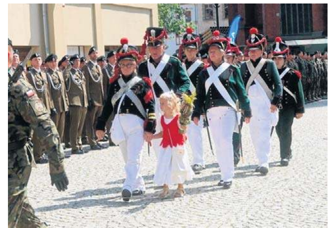
Wraz z żołnierzami na Rynku maszerowała grupa rekonstrukcyjna Księstwa Warszawskiego z Krotoszyc