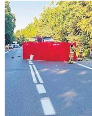
Do śmiertelnego wypadku doszło na drodze W333 Lubin - Chróstnik

- Apelujemy do kierowców o rozwagę i czujność! Obecna aura sprzyja jednoślodom i na drogach pojawiać się będzie więcej motocykli. Czas wakacyjny dodatkowo niesie za sobą wzmożony ruch. Niech słońce nie oslepi nas do tego stopnia, żebyśmy nie upewniali się, że manewr który zamierzamy wykonać nie będzie zagrożeniem dla innych. Lepiej upewnić się dwa razy niż doprowadzić do tragedii! - apelują lubińscy policjanci.