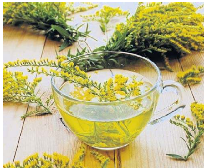
Nawłoc pospolita to powszechnie występująca roślina. Napar z jej suszu ma wiele prozdrowotnych właściwości

Kolejnym przeciwwskazaniem są obrzęki spowodowane niewydolnością serca.