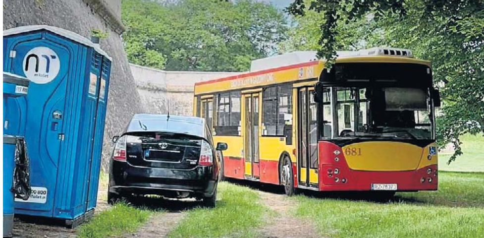
Grafika Strefy Miejskich Działań po tegorocznym Podkarpackim Festiwalu Sportowym, gdy do zamkowej fosy wjechał autobus

- Ten sam temat pojawił się w roku 2025. Podczas tego samego festiwalu do fosy wjechały samochody osobowe i półciężarowe. Akurat wtedy czas wydarzenia zbiegł się z opadami deszczu. To rozjeżdżanie fosy było widoczne kilkanaście dni po wydarzeniu. Proces dewastacji fosy został udokumentowany fotograficznie na stronie Strefy Działań Miejskich - mówi aktywista.