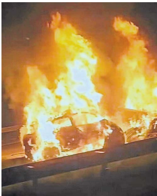
Efekt nocnego czołowego zderzenia na autostradzie A1

Co jednak zrobić, gdy przez nieuwagę znajdziemy się na przeciwnym pasie ruchu? GDDKiA radzi, by zatrzymać się w bezpiecznym miejscu, najlepiej na pasie awaryjnym i włączyć światła awaryjne. Potem trzeba opuścić pojazd z zachowaniem szczególnej ostrożności, jeśli to możliwe schronić się za barierą ochronną, a następnie powiadomić służby drogowe lub policję.