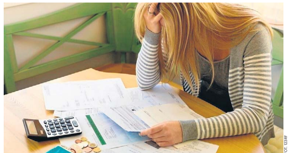
Z problemami nieterminowego regulowania zobowiązań zmagają się blisko 2,4 mln zł osób, zaś ofiarami opóźnień w pierwszej kolejności padają najbliżsi

Statystyczny Polak ma obecnie do spłaty średnio 34 tys. zł. Przy wyraźnym ograniczonym popycie na pracę i niskiej dostępności nowych miejsc zatrudnienia jest to kwota, która dla wielu gospodarstw domowych staje się