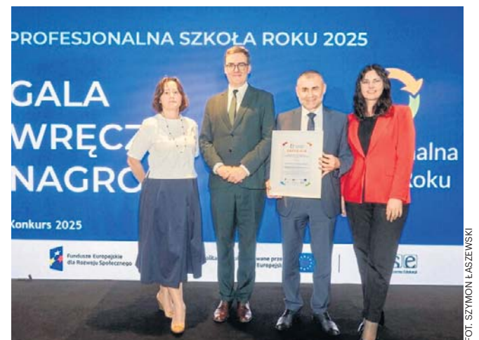
Wyróżnienie dla Technikum nr 2 im. Stefana Banacha - uroczystość w Warszawie

Sukces jarosławskiego technikum jest efektem pracy