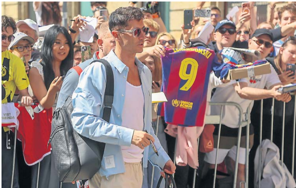
Robert Lewandowski, gdzie się nie pokaże, wzbudza zainteresowanie kibiców

„Strażacy” oferują Polakowi zawrotne jak na MLS warunki.