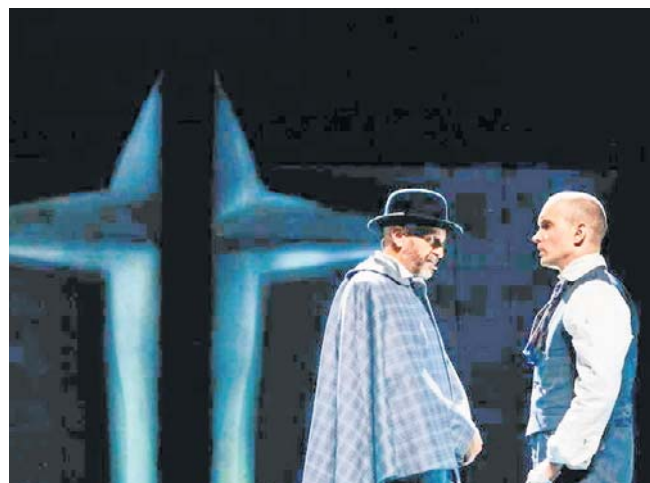
„Inferno” będzie można zobaczyć jeszcze 16 i 17 czerwca. Później okazja będzie dopiero po wakacjach.