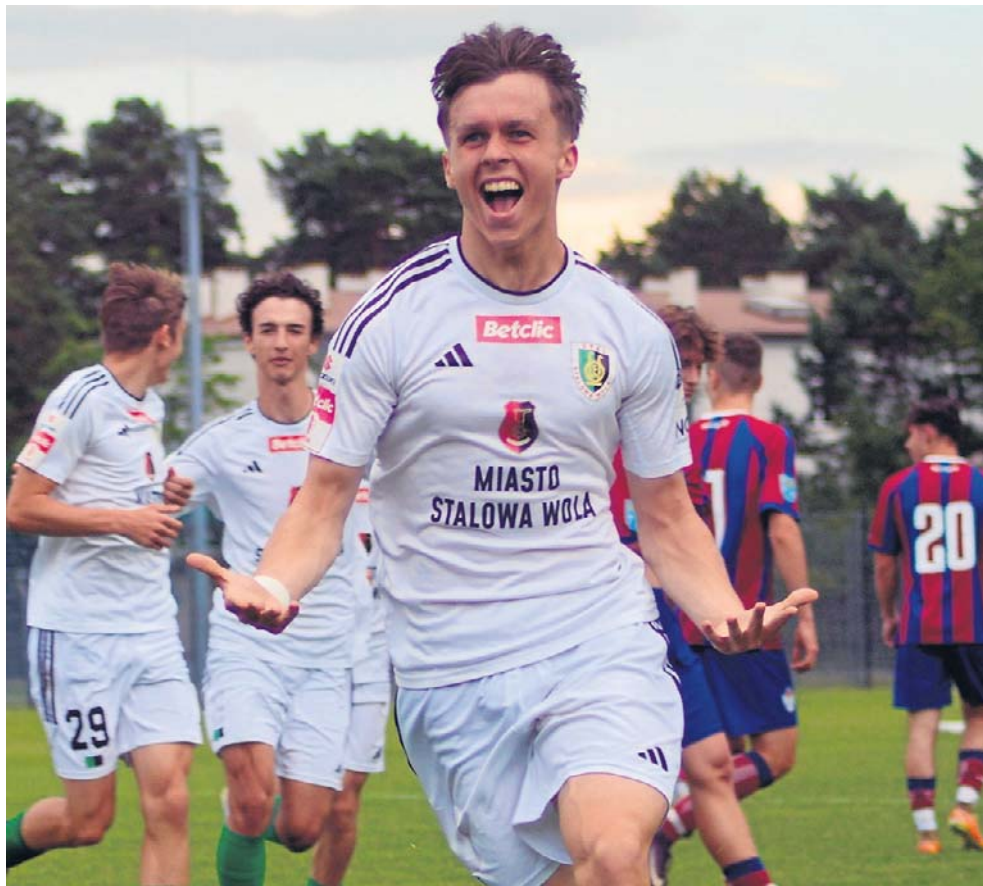
Rezerwy Stali Stalowa Wola (na biało) krótko cieszyły się z prowadzenia w meczu ze Spartą Jeżowe. Młody zespół ze Stalowej Woli kończy sezon na 3. miejscu

POZOSTAŁE WYNIKI: Kolbuszowianka - Czermin 6:0 (4:0) Chrzęszcz 20, 47, M.