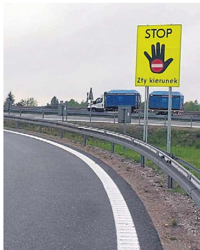
Nie wszyscy kierowcy reagują na takie znaki