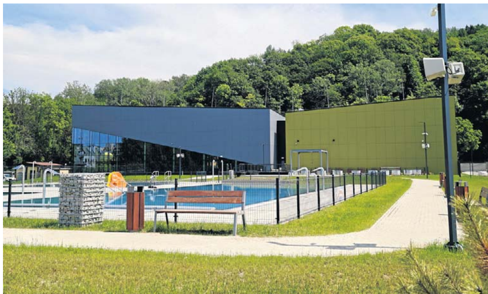
Kompleks basenów w Przemyślu został zaprojektowany tak, aby łączyć funkcje sportowe, rekreacyjne oraz rehabilitacyjne.

Mocnym atutem przemyskiego obiektu jest również jego