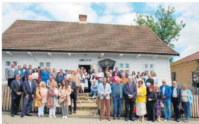
Oficjalne otwarcie, uratowanego z ruiny, dawnego domu dla ubogich w Dębowcu

Prace konserwatorskie, restauratorskie oraz roboty budowlane kosztowały ponad 996 tysięcy złotych, z czego 970 200 zł stanowiło dofinansowanie w ramach Rządowego Programu Odbudowy Zabytków.