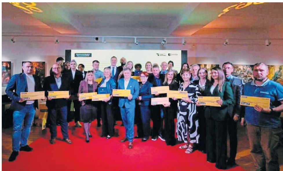
Wyniki 14. edycji Rzeszowskiego Budżetu Obywatelskiego ogłoszono podczas uroczystej gali w Biurze Wystaw Artystycznych w Rzeszowie.

- Budżet Obywatelski to przykład skutecznej współpracy miasta z mieszkańcami. To dzięki Państwu zaangażowaniu wspólnie zmieniamy Rzeszów i decydujemy, jak bę-