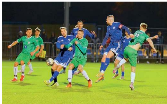
MKS Ciechanów przegrał u siebie z Wichrem Kobylka