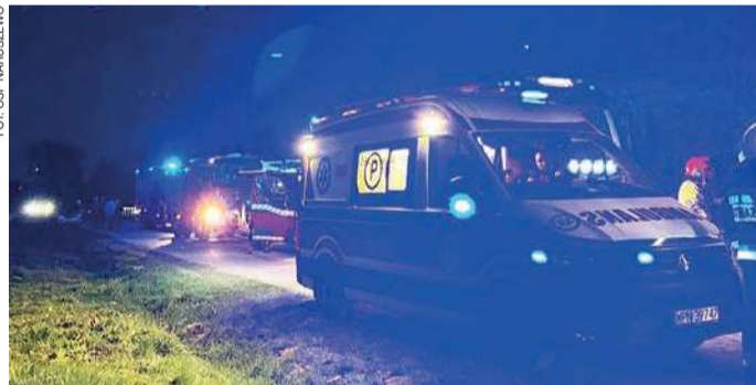
W Sosenkowie doszło do tragicznego w skutkach pożaru.

- Na miejscu zdarzenia grupa dochodzeniowo-śledcza wykonała czynności. Wyjaśniane są dokładne okoliczności oraz przyczyna tego zdarzenia – przekazuje sierż. Eliza Koźlicka z płońskiej KPP. KO