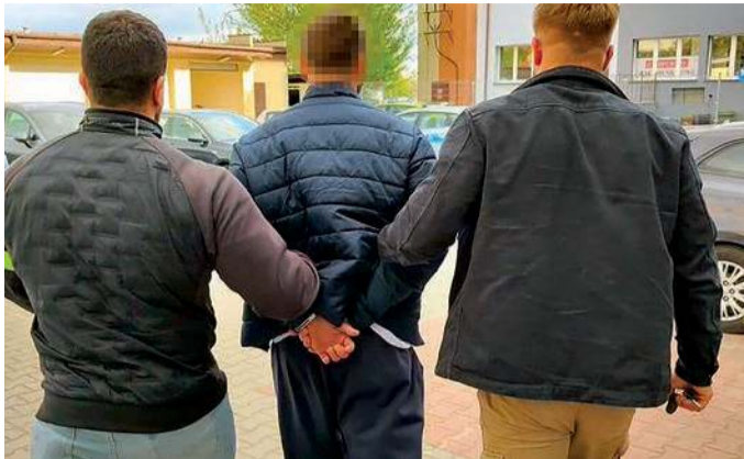
Płoński policjanci zatrzymali mężczyznę podejrzanego o udział w próbie wyłudzenia pieniędzy od seniorki

Do próby wyłudzenia pieniędzy doszło pod koniec marca na terenie gminy Raciąż. Seniorka odebrała telefon od kobiety, która, będąc wyraźnie zdenerwowana, twierdziła, że spowodowała poważny wypadek i potrzebuje pilnej pomo-