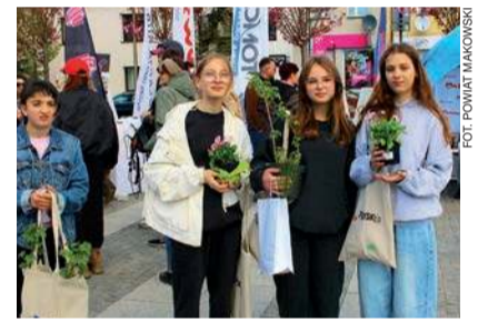
Uczestnicy pikniku z roślinami otrzymanymi w zamian za surowce wtórne

Strażacy opowiadali zaś o zawodzie i edukowali na temat czujek dymu i czadu oraz o zagrożeniach związanych z wypalaniem traw.