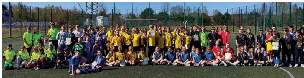
Chorzelski Puchar Tymbark uczestnicy turnieju