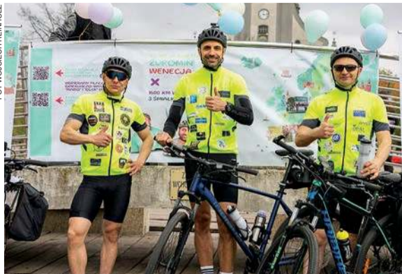
Wyjechali z Żuromina w sobotę, 25 kwietnia

Wyprawę do Wenecji możecie śledzić na bieżąco w mediach społecznościowych, m.in. na facebookowym profilu: „Rowerem po uśmiech dzieci”, gdzie prowadzone są również charytatywne licytacje.