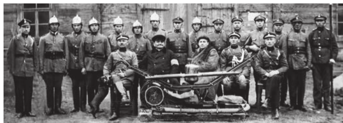
Z archiwum 100-letniej OSP w Baboszewie

W mioniony, majowy weekend trzy jednostki OSP z terenu powiatu płońskiego świętowały jubileusz stulecia: OSP Królowo w gm. Joniec,