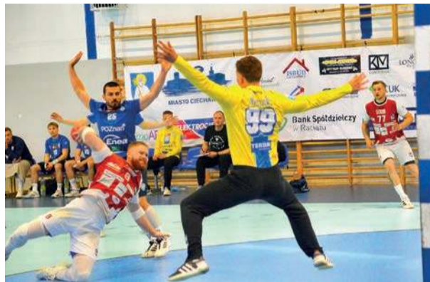
Ostatni mecz Ciechanowianie rozegrają we Wrocławiu