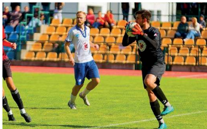
Pułtuszczenie spadają w tabeli na 3. miejsce (niepremiowane awansem)