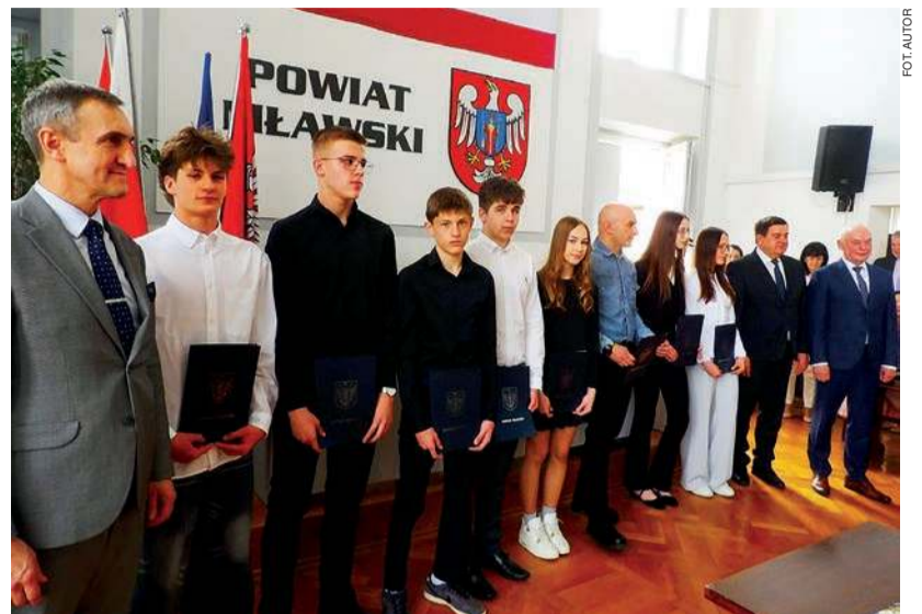
Grupa nagrodzonych sportowców z władzami powiatowymi

W okresie sprawozdawczym PSM zorganizował ponad 60 zawodów sportowych (nie licząc tych o szerszym zasięgu) w 13 dyscyplinach, w których uczestniczyli reprezen-