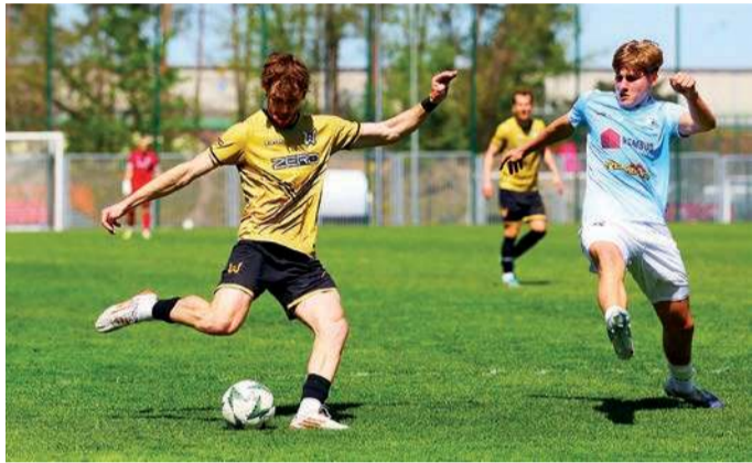
KTS Wesoło rozbiło w Warszawie MKS Przasnysz