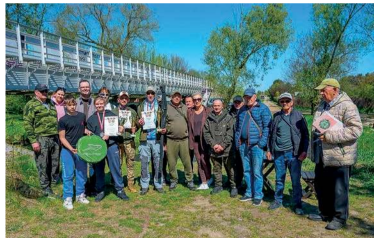
Tegoroczne wędkarskie zawody o puchar burmistrza odbyły się nad Płonką