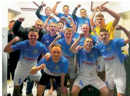
Radość w zespole Korony Szydłowo po wygranej