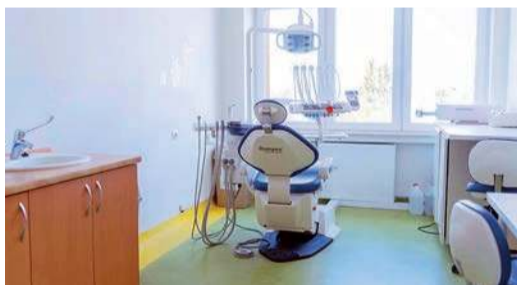
Gabinety dentystyczne pojawią się w dwóch szkołach podstawowych