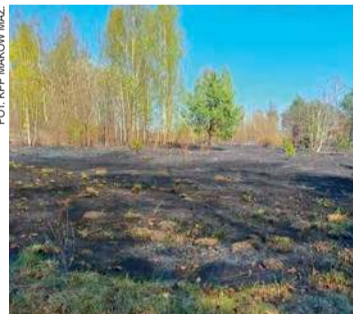
Pożar w m. Dzbądz

- Jak ustalili interweniujący policjanci, 72-letni mężczyzna podczas porządków na swojej posesji podpalił suchą trawę. Z uwagi na panujące