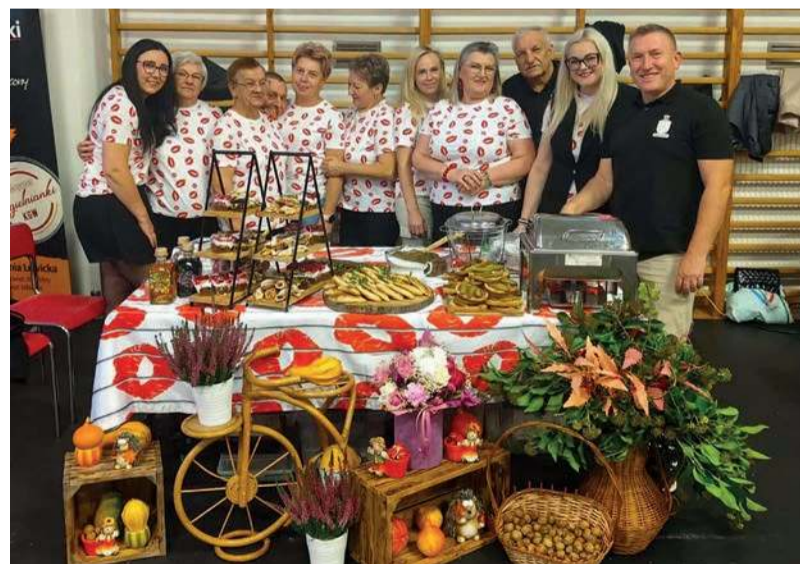
KGW Kęczewo Malinowe Usta

Duszenie: Podsmażone zrazy dusimy pod przykryciem, aż mięso będzie miękkie, a sos zgęstnieje.