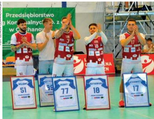
Podziękowania dla zawodników Juranda, którzy kończą przygodę z zespołem

25. kolejka (1-3 maja): Pogoń Szczecin - Śląsk Wrocław 33:25 (15:12), Padwa Zamość - AZS UW Warszawa 39:30 (19:17), Anilana Łódź - SMS Kielce 31:42 (18:20), Gwardia Koszalin - AZS AGH Kraków 25:28 (10:12), Miedź Legnica - Nielba Wągrowiec 26:25 (13:12), Stal Gorzów - AZS AWF Biła Podlaska 27:28 (15:12), Jurand Ciechanów - Grunwald Poznań 36:33 (17:15).