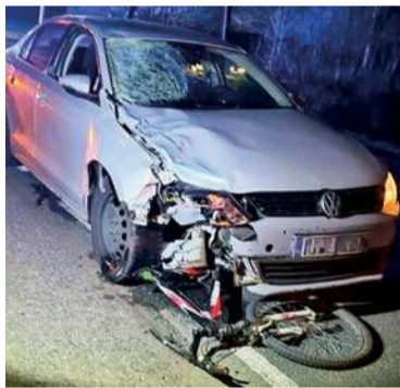
W poniedziałkowym wypadku zginął nastolatek, który jechał rowerem

Przasnyscy policjanci pod nadzorem prokuratury wyjaśniają okoliczności tragicznego w skutkach wypadku, do którego doszło w miejscowości Czaplice Furmany. Zginął 17-letni rowerzysta, potrącony przez osobowe auto.