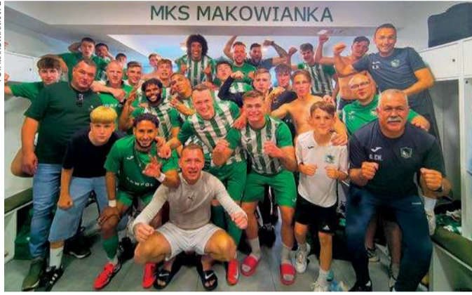
Radość w obozie Makowianki Maków Maz.