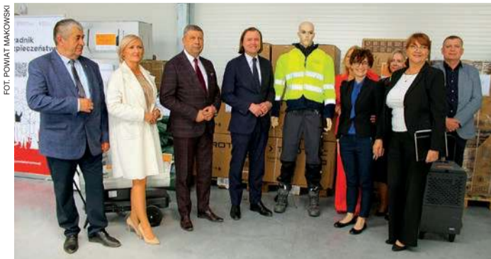
Wizyta w magazynie zarządzania kryzysowego