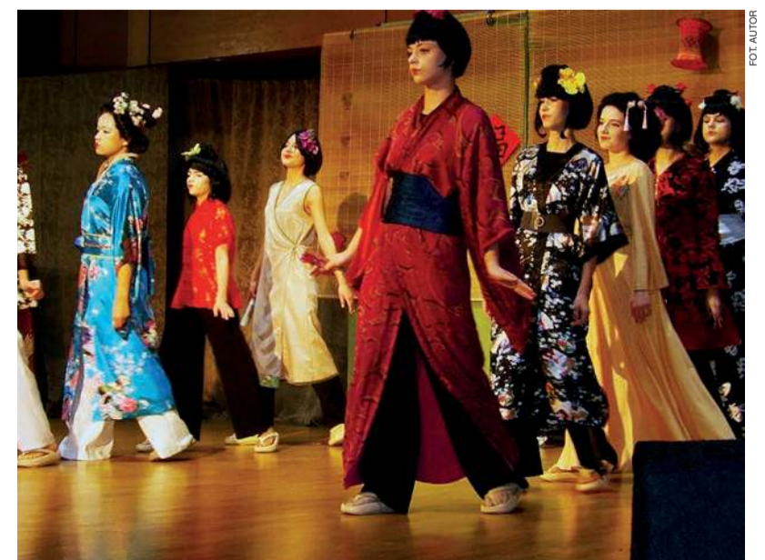
Scena z „Gejszy”, operetki Sydney'a Jonesa, wystawionej w ubiegłym roku przez PSM w Mławie

Uczniowie i nauczyciele PSM w Mławie, która niedawno obchodziła 50-lecie swego istnienia, corocznie prezentują wybraną przez siebie operetkę. Przygotowania rozpoczynają się już na początku roku szkolnego, by efekty pracy można było zobaczyć na scenie w wiosennych miesiącach. Za każdym razem sala przeważnie jest wypełniona po brzegi. (kj)