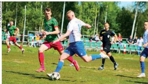
Słozewianie wciąż pewnie przewodzą w tabeli ligi okręgowej

25. kolejka (9-10 maja): Sona - Oldaki, Wkra R. - Ostrovia, Rzekunianka - Konopianka, Korona - Mławianka II, Kryształ - Narew II, Opia - Gladiator, Wkra Z. - Strzegowo, Kurpik - Wkra B.