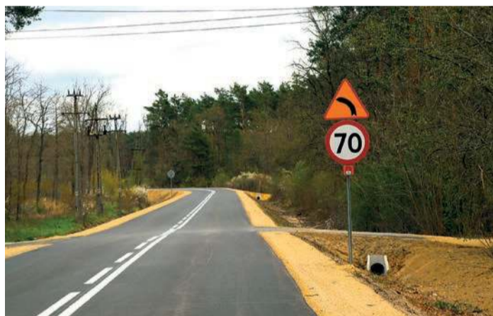
Jedna z najważniejszych inwestycji drogowych w regionie