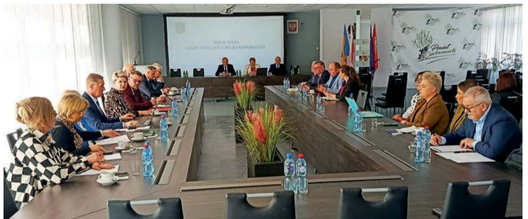
Rada zagłosowała jednogłośnie

Radna wyraziła także żal z powodu odstąpienia od budowy hali sportowej przy ZS nr 1 i zwróciła uwagę na potrzebę bardziej długofalowego planowania inwestycji i równoległe budowanie większej elastyczności finansowej. Nie mniej zapowiedziała,