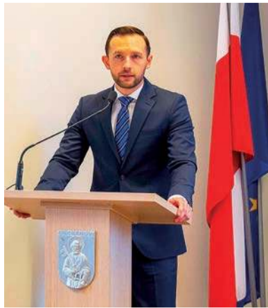
Prezydent Kosiński powiedział, że budżet zamknięto nadwyżką ponad 9 mln złotych

Jak poinformowano w trakcie sesji, dochody miasta w ubiegłym roku wyniosły ponad 415,7 mln