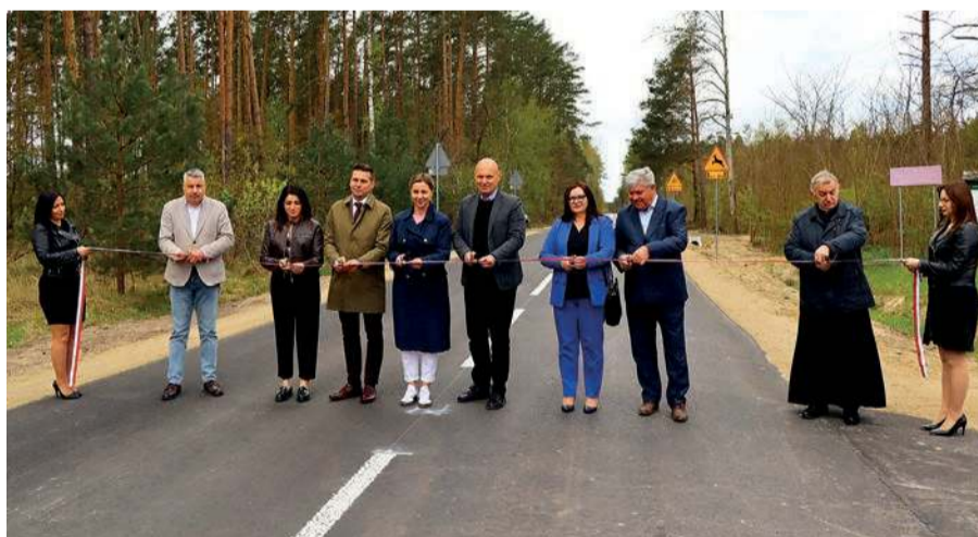
Nowa droga została uroczystie otwarta 28 kwietnia br.