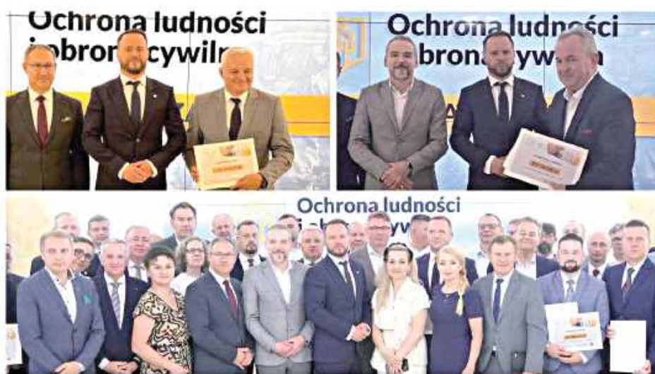
Łącznie samorzady z terenu powiatu ryckiego otrzymały ponad 3,4 mln zł na działania związane z zabezpieczeniem logistycznym oraz zapewnieniem ciągłości dostaw w ramach systemu ochrony ludności i obrony cywilnej

tkania, środki stanowią kolejny etap wdrażania Ustawy o Ochronie Ludności i Obronie Cywilnej. W 2026 roku w dyspozycji województwa znajduje się łącznie około 300 mln zł, z czego już zakontraktowano blisko 160 mln zł.