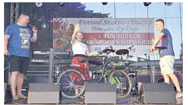
Nagrodą główną w loterii był rower!

Wyścigi na hulajnodze I miejsce – Helena Bredsznajder