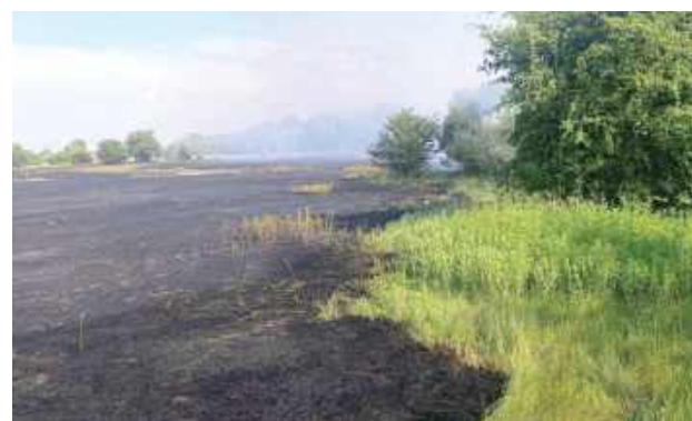
Ogień objął teren o powierzchni około jednego hektara

29 czerwca strażacy interweniowali w miejscowości Prażmów, gdzie doszło do pożaru suchej trawy i zarośli. Ogień objął teren o powierzchni około jednego hektara.