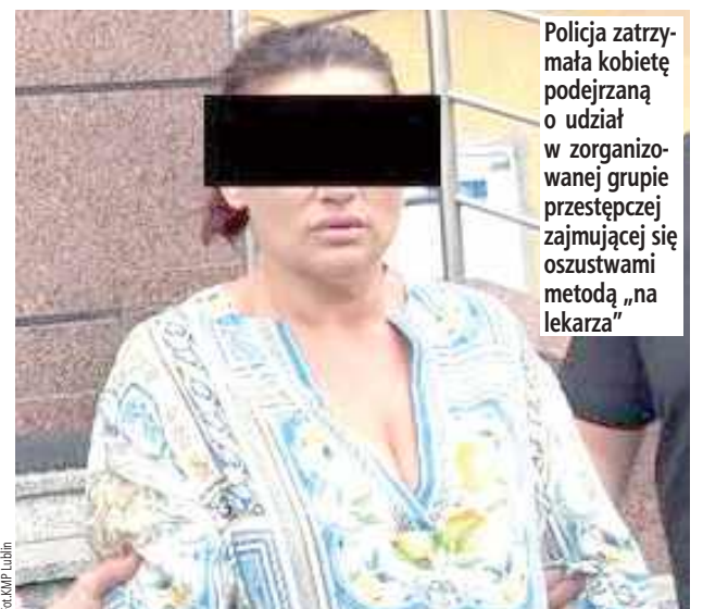
Policja zatrzymała kobietę podejrzaną o udział w zorganizowanej grupie przestępczej zajmującej się oszustwami metodą „na lekarza”