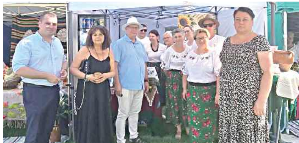
Koło Gospodyń Wiejskich z Lenda Ruskiego wygrało rywalizację w konkursie kulinarnym. Zwycięstwo przyniosła im autorska potrawa pod nazwą „Kłapak nadziany grulami z gryki i grzybami z malinową juchą”

Koło Gospodyń Wiejskich z Lenda Ruskiego nie zwalnia tempa. Panie odniosły kolejny sukces, zdobywając pierwsze miejsce podczas V Turnieju Kół Gospodyń Wiejskich w Rososzy. W rywalizacji wzięło udział aż 21 kół z regionu.