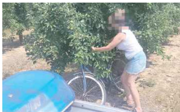
Najwięcej alkoholu w organizmie miała 51-letnia mieszkanka gminy Wilków, która jechała rowerem przez Szczuciska, mając ponad dwa promile alkoholu

Całodniowe działania miały na celu wyeliminowanie z ruchu kierowców i rowerzystów, którzy swoim zachowaniem