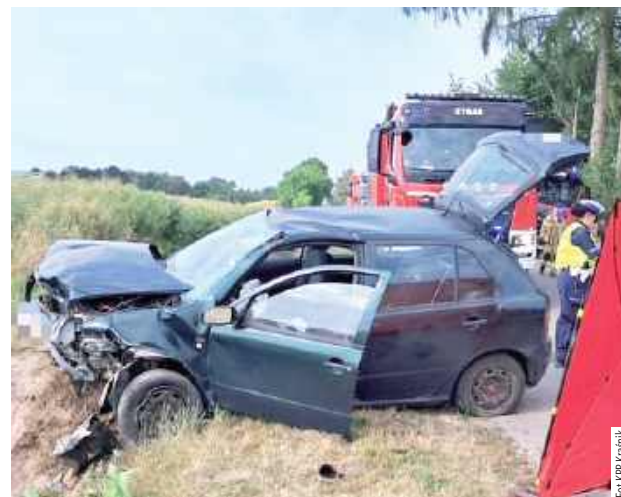
Pomimo prowadzonej reanimacji w wyniku zdarzenia kierująca poniosła śmierć na miejscu