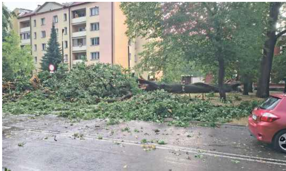
Żywioł nie oszczędził sędziwego drzewa przy ul. Podchorążych. Silne podmuchy wyrwały je z korzeniami!

Bilans działań straży pożarnej obejmuje 14 interwencji związanych z wypompowywaniem wody z zalanych piwnic, garaży, posesji oraz lokalnych podtopień dróg. Strażacy dziewięciokrotnie usuwali drzewa powalone na jezdnię, dwukrotnie interweniowali przy drzewach, które uszkodziły samochody, a kolejne dwa zgłoszenia dotyczyły drzew przewróconych na linie energetyczne, powodujących uszkodzenia infrastruktury i przerwy w dostawie energii elektrycznej. Odnotowano również dwa przypadki zerwania poszycia dachów oraz jedną interwencję dotyczącą spłoszonego zwierzęcia.