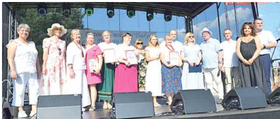
Dużym zainteresowaniem cieszył się również konkurs rękodzielniczy „Kogucik i kurka - słomiane cudeńka z podwórka”. Wygrała reprezentacja KGW w Nowym Bazanowie

Rososz ponownie stała się centrum regionalnej kultury, kulinariów i wspólnego świętowania.