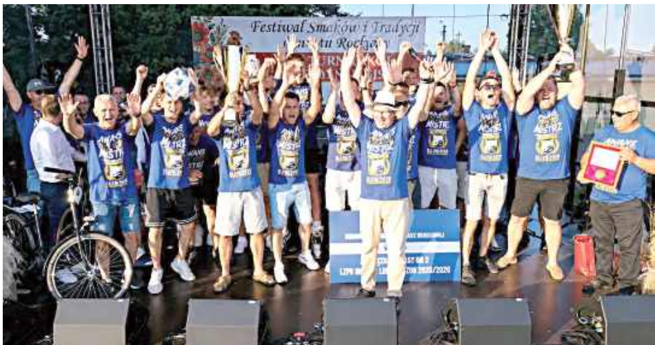
Podczas wydarzenia prezes Lubelskiego Związku Piłki Nożnej wręczył ekipie Amatora puchar za zwycięstwo w Klasie A