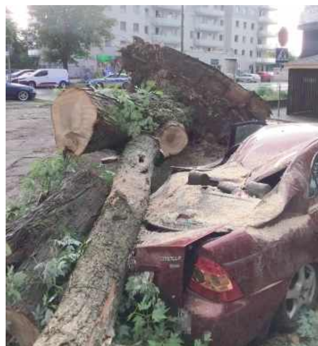
Na ulicy Rogowskiego przewrócone drzewo spadło na zaparkowaną Toyotę, powodując znaczne uszkodzenia pojazdu. Uszkodzona została również elewacja pobliskiego budynku mieszkalnego