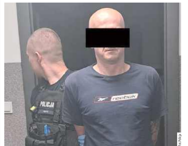
44-latek w czwartek (2 lipca) został zatrzymany i doprowadzony do prokuratury, gdzie usłyszał zarzut posiadania znacznej ilości środków odurzających

Powiat opolski: Opolscy kryminalni zatrzymali 44-latka, który posiadał marihuanę w ilości pozwalającej na przygotowanie blisko 400 dilerkich porcji.