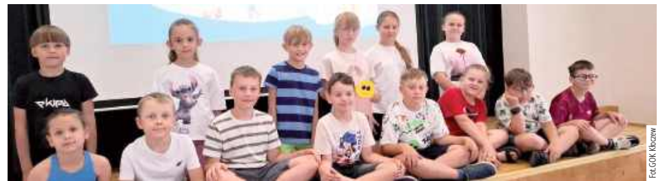
Dzieci wykonywały rysunki kredą, tworzyły bańki mydlane oraz uczestniczyły w zajęciach plastycznych, podczas których powstały trójwymiarowe żółwie z papieru i włóczki

Gminny Ośrodek Kultury w Kłoczewie zorganizował pierwszy dzień wakacyjnych zajęć dla dzieci, inaugurując letni cykl spotkań edukacyjno-animacyjnych. Wydarzenie odbyło się na placu przed ośrodkiem i połączyło elementy profilaktyki, kreatywnej zabawy oraz integracji uczestników.