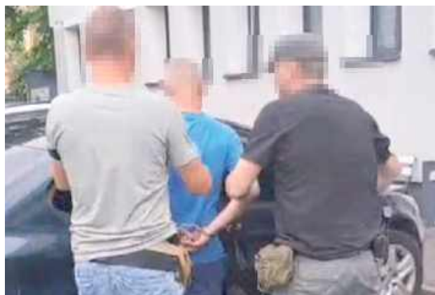
Mężczyzna został doprowadzony do Prokuratury Rejonowej w Opolu Lubelskim, gdzie usłyszał aż 15 zarzutów

W minioną środę (1 lipca) do opolskiej komendy zgłosiła się pokrzywdzona, która złożyła zawiadomienie dotyczące włamania się do domu, skąd zostały skradzione m.in. pieniądze oraz karta płatnicza. Jako sprawcę zgłaszająca wskazała swojego męża. Z relacji kobiety wynikało, że jej mąż naruszył