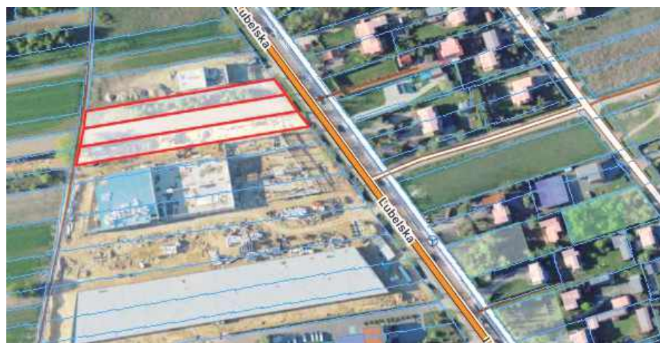
McDonald`s ma zostać zlokalizowany na działce przy ul. Lubelskiej (oznaczonej kolorem czerwonym)

Poza budynkiem restauracji inwestor wnioskuje o pozwolenie m.in. na postawienie trzech masztów flagowych o wysoko-