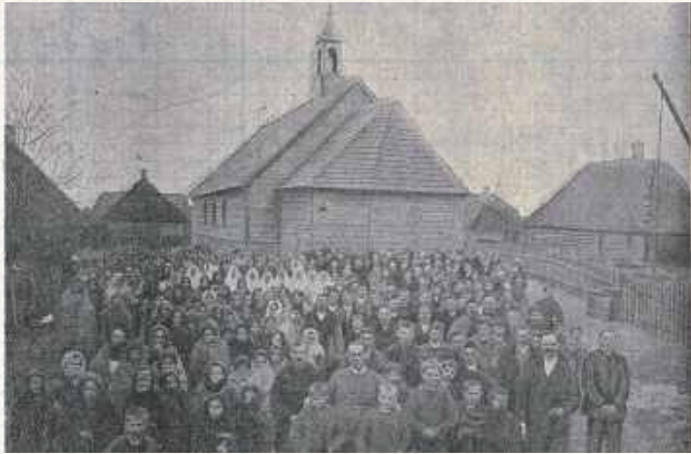
Zbudowany w 1907 roku kościół mariawicki pw. Matki Boskiej Nieustającej Pomocy w Grabowie Szlacheckim (gm. Nowodwór) oraz wierni. Dzisiaj można zobaczyć tam tylko relikty cmentarza, położone za murowanym kościołem katolickim. Wspólnota przestała definitywnie istnieć po II wojnie światowej

Budowa i urządzenie kosztowały 4000 rubli. Jeżeli prawdą jest to, co napisano w 1909 roku