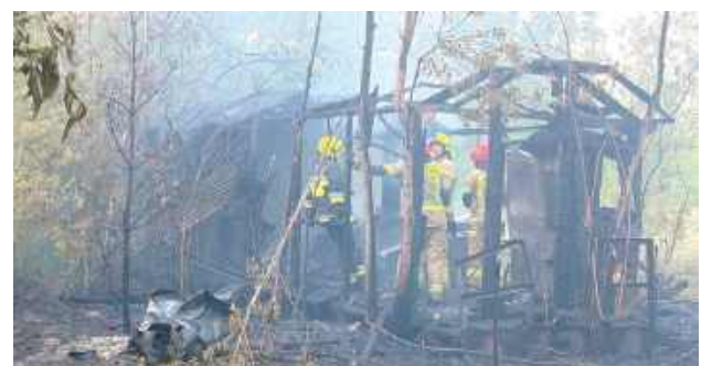
Dzięki sprawnie przeprowadzonym działaniom ogień został szybko opanowany, a następnie całkowicie ugaszony

W ostatnią niedzielę czerwca strażacy interweniowali przy pożarze nieużytków oraz starego drewnianego wagonu kolejowego przy ul. Towarowej w Dęblinie.