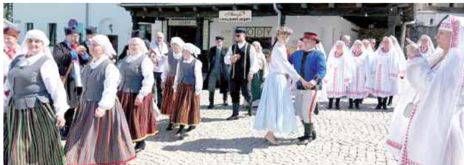
Na kilka dni Kazimierz Dolny stał się stolicą polskiego folkloru

Za nami 60. Ogólnopolski Festiwal Kapel i Śpiewaków Ludowych w Kazimierzu Dolnym - jedno z najważniejszych wydarzeń poświęconych tradycyjnej kulturze ludowej w Polsce. Przez trzy dni, od 25 do 27 czerwca, na festiwalowych scenach zaprezentowało się blisko 600 artystów z całego kraju.