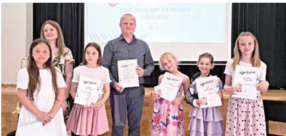
Gminny Ośrodek Kultury w Kłoczewie wyraził wdzięczność wszystkim uczestnikom za ich pracę, wytrwałość i piękne muzyczne chwile

Gminny Ośrodek Kultury w Kłoczewie wyraził wdzięczność wszystkim uczestnikom za ich pracę,