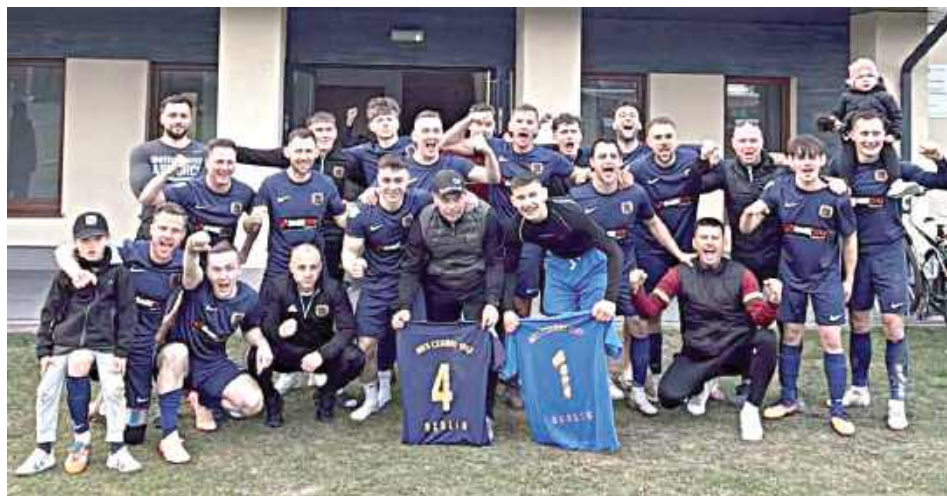
Czarni Dęblin zostali w Klasie A. Czy w nowym sezonie udanie powalczą o „Okręgówkę”?

Dęblińska drużyna zakończyła miniony sezon na trzecim miejscu w tabeli, będąc bardzo blisko awansu do Klasy Okręgowej. W decydującym meczu u siebie z Orłami Kazimierz Czarni prowadzili 1:0 do przerwy, jednak ostatecznie przegrali spotkanie, tracąc szansę na historyczny awans. Sytuację wykorzystał Amator Leopoldów-Rososz, który po efektownym zwycięstwie 5:1 nad Garbarnią