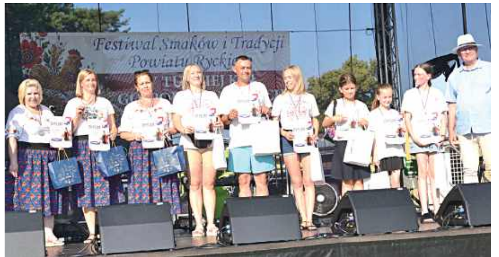
Najlepsze ekipy w konkurencji współpracy zespołowej

Boisko Klubu Sportowego Amator Leopoldów-Rososz w Rososzy stało się areną sportowej rywalizacji, rodzinnej integracji i wspólnej zabawy podczas festynu „Aktywna Wieś - sport i rekreacja dla każdego”.