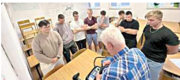
30 uczniów Zespołu Szkół Zawodowych nr 1 w Dęblinie uczestniczyło w szkoleniu z zakresu eksploatacji urządzeń, instalacji i sieci elektroenergetycznych Grupy 1

zweryfikowane podczas egzaminu kwalifikacyjnego. Uzyskanie uprawnień elektrycznych G1 w zakresie eksploatacji stanowi