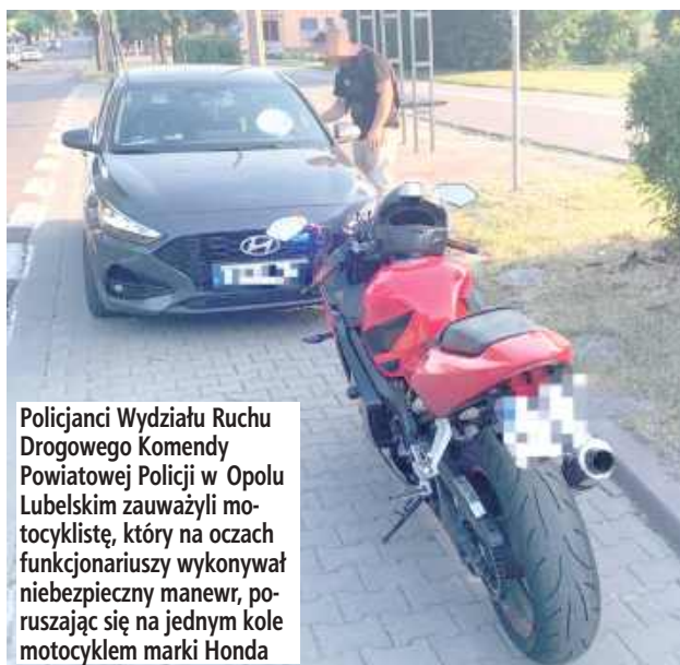
Policjanci Wydziału Ruchu Drogowego Komendy Powiatowej Policji w Opolu Lubelskim zauważyli motocyklistę, który na oczach funkcjonariuszy wykonywał niebezpieczny manewr, poruszając się na jednym kole motocyklem marki Honda

Do zdarzenia doszło w niedzielę, 28 czerwca. Policjanci Wydziału Ruchu Drogowego Komendy Powiatowej Policji w Opolu Lubelskim zauważyli motocyklistę, który na oczach funkcjonariuszy wykonywał niebezpieczny ma-