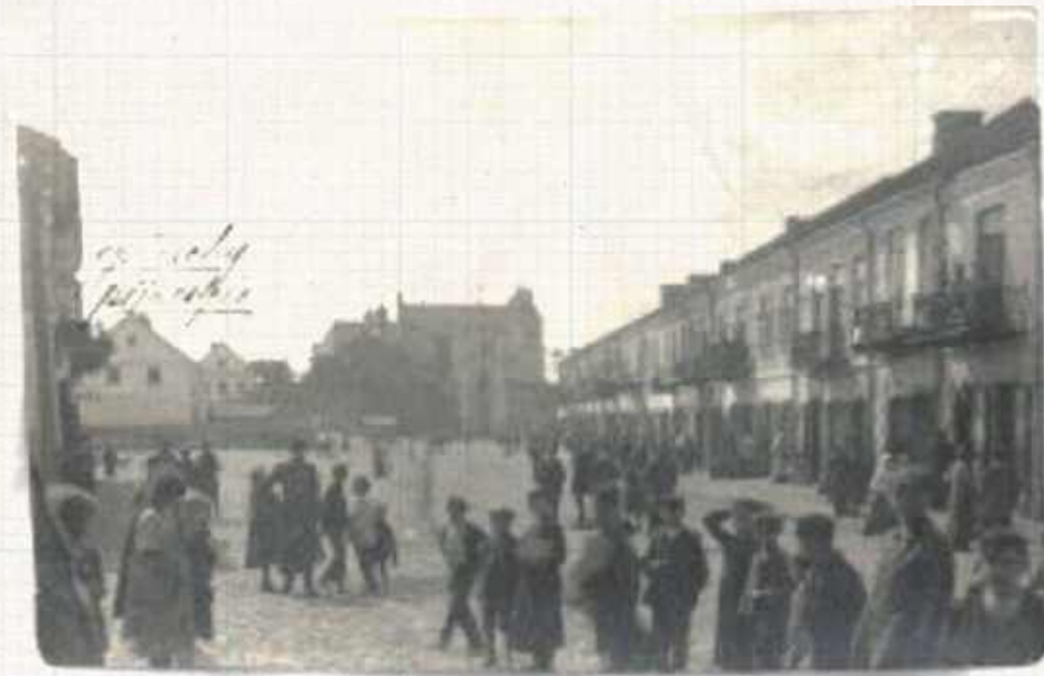
Widok ulicy Lubelskiej w Opolu około 1912 roku.

Zapadła cisza i nie było słychać strzałów. Nasi polscy sąsiedzi wy-