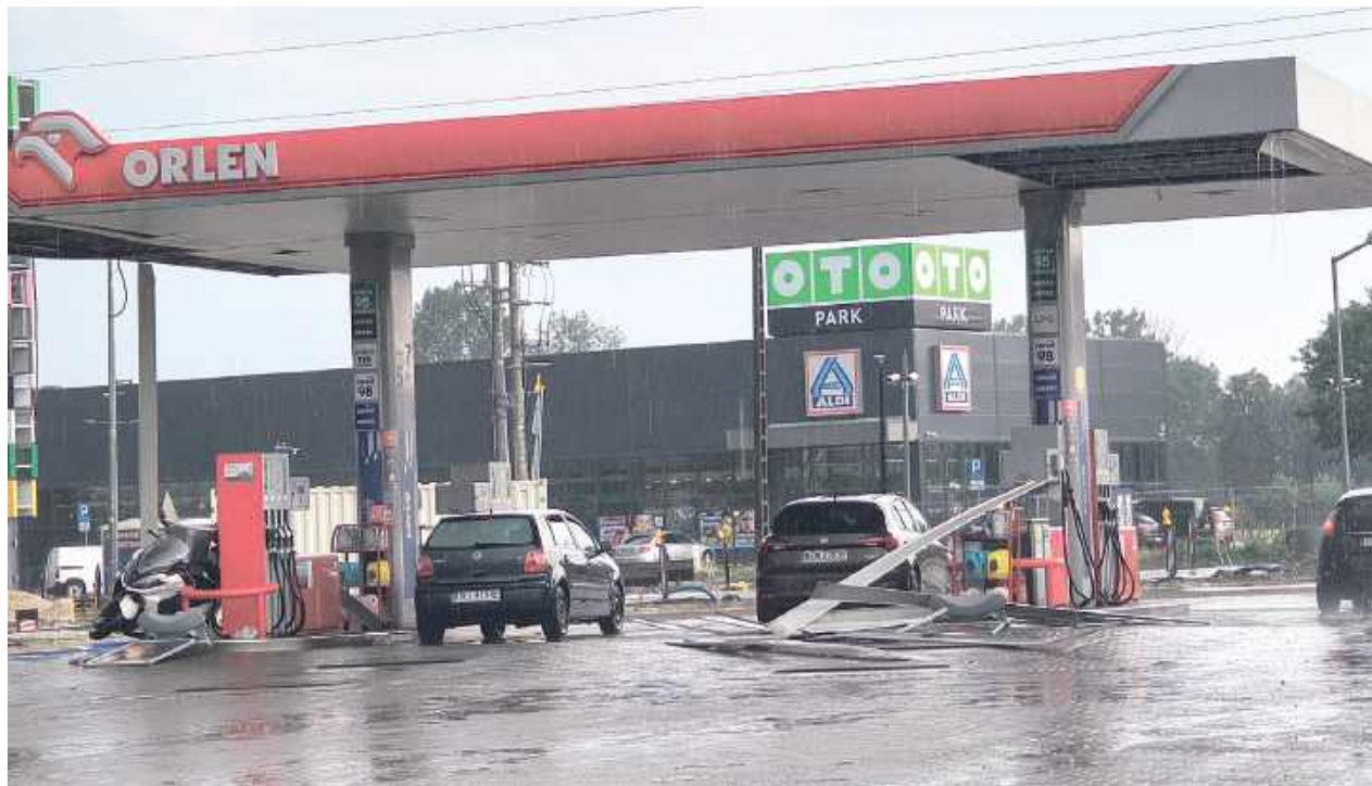
Jedno z najpoważniejszych zdarzeń miało miejsce na terenie jednej ze stacji paliw. Silny podmuch wiatru uszkodził wiatę, z której oderwane elementy konstrukcji spadły na znajdujące się w pobliżu pojazdy. W wyniku tego zdarzenia uszkodzone zostały cztery samochody osobowe oraz motorower (z lewej), który niemal wbił się w konstrukcję stacji

Policjanci z Komisariatu Policji w Dęblinie oraz Komendy Powiatowej Policji w Rykach wspólnie ze strażakami prowadzili działania polegające na zabezpieczaniu miejsc zdarzeń, usuwaniu zagrożeń, udzielaniu pomocy mieszkańcom oraz dokumentowaniu skutków nawałnicy. Apelujemy do mieszkańców o zachowanie szczególnej ostrożności po przejściu gwałtownych zjawisk atmosferycznych i stosowanie się do poleceń