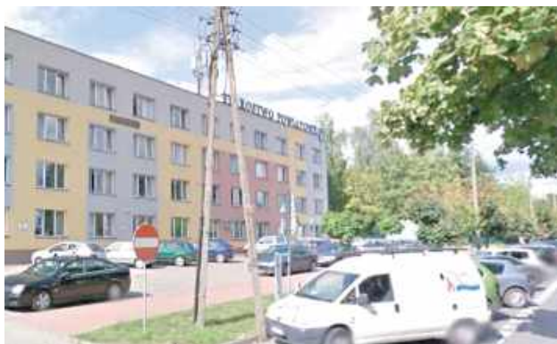
To był wyjątkowo niespokojny początek lipca w Starostwie Powiatowym w Rykach. W ciągu zaledwie kilku dni służby dwukrotnie interweniowały w budynku urzędu

Strażacy zabezpieczyli teren akcji i odłączyli dopływ energii elektrycznej do budynku za pomocą przeciwpożarowego wyłącznika prądu. Następnie ratownicy wy-