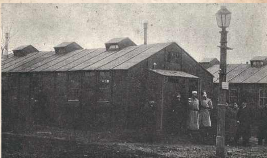
LUKOW — Militärbaraken.

Fotografia około 1916 roku użyta została jako pocztówka. Co ciekawe jednak (zwrócili na to uwagę użytkownicy por-