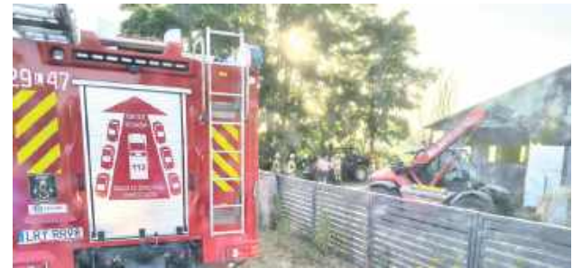
Do pożaru ładowarki teleskopowej doszło 27 czerwca w miejscowości Drażgów w gminie Ułęż

Do pożaru ładowarki teleskopowej doszło 27 czerwca w miejscowości Drażgów w gminie Ułęż. Dzięki sprawnej akcji strażaków ogień został szybko ugaszony i nie dopuścił do dalszego rozprzestrzenienia się pożaru.