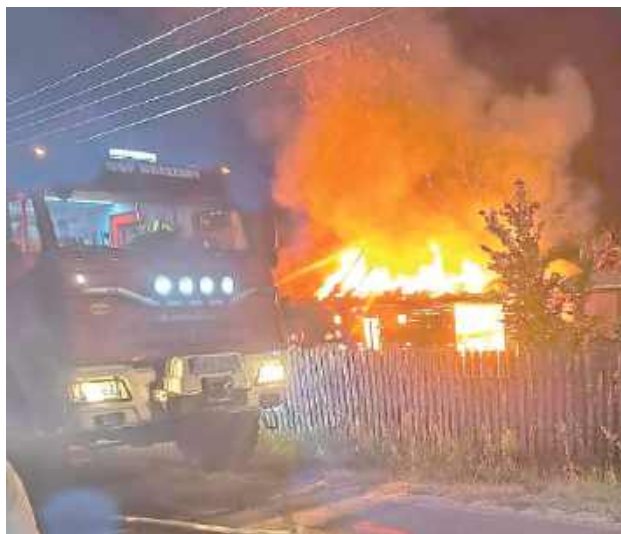
Blisko cztery godziny trwała nocna akcja gaśnicza w Brzezinach w powiecie ryckim. Strażacy walczyli z pożarem drewnianego budynku gospodarczego, który błyskawicznie objął całą konstrukcję i stwarzał zagrożenie dla pobliskich zabudowań

Blisko cztery godziny trwała nocna akcja gaśnicza w Brzezinach w powiecie ryckim. Strażacy walczyli z pożarem drewnianego budynku gospodarczego, który błyskawicznie objął całą konstrukcję i stwarzał zagrożenie dla pobliskich zabudowań.