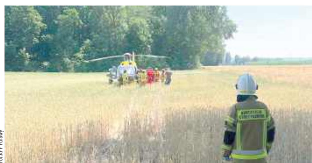
Ze względu na stan chłopca załoga karetki zdecydowała o zadysponowaniu śmigłowca Lotniczego Pogotowia Ratunkowego

Do niebezpiecznego zdarzenia doszło we wtorek przed południem na terenie Parku Czartoryskich. Jak ustalili policjanci, chłopiec, zjeżdżając ze schodów Świątyni Sybilli, stracił równowagę, przewrócił się i uderzył głową o podłoże. Na miejsce natychmiast wezwano służby ratunkowe i policję. Ze względu na stan mieszkańca Puław przybyły zespół ratownictwa medycznego zdecydował o zadysponowaniu śmigłowca Lotniczego Pogotowia Ratunkowego, których przetransportował nastolatka do