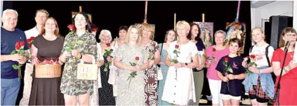
Integralną częścią jubileuszowych obchodów było rozstrzygnięcie VIII Dęblińskiego Konkursu Artystycznego dla Dorosłych „Popiół i Diament”, organizowanego przez Miejski Dom Kultury w Dęblinie pod patronatem Burmistrza Miasta Dęblin.

Obchody Jubileuszu 50-lecia Miejskiego Domu Kultury w Dęblinie były nie tylko okazją do wspomnień i podsumowania pięciu dekad działalności placówki, ale także świętem lokalnej kultury, sztuki i twórczości mieszkańców.