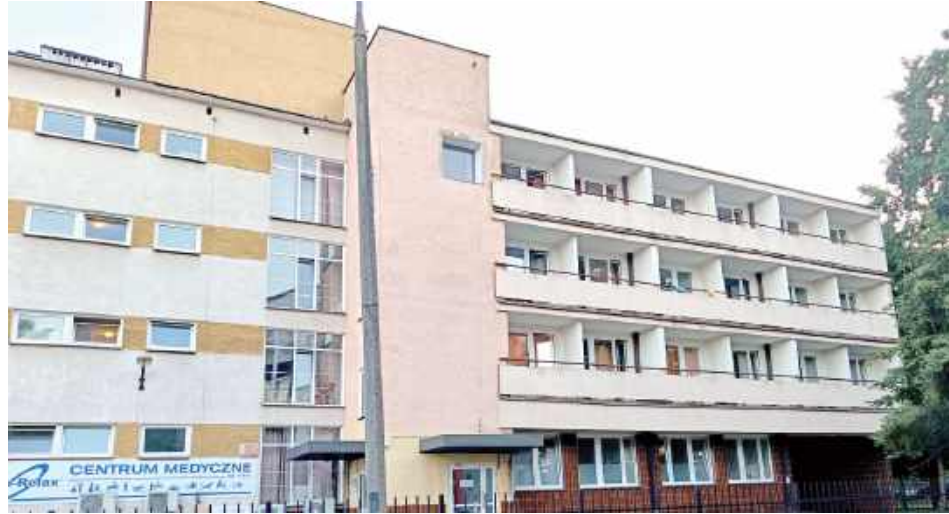
Widać, że w budynku hotelu przebywają jakieś osoby. Świadczy o tym palące się w pokojach światło, otwarte okna i rzeczy wywieszane na balkonach

Skontaktowaliśmy się także z jednym z zakładów mięsnych w okolicy, na który wskazywali mieszkańcy. Jak poinformował nas przedstawiciel firmy, przedsiębiorstwo nie podpisało żadnej umowy dzierżawy z IUNG-iem. Przyznał jednak, że zakład współpracuje z kilkoma firmami outsourcingowymi i być może któraś z nich wydzierżawiła obiekt właśnie na potrzeby zakwaterowania pracowników.