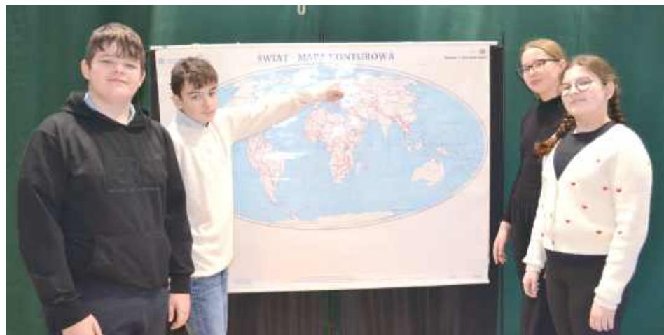
Uczniowie mogli wcielić się w postaci z baśni pochodzących z różnych zakątków świata

Grupa I – Mołdawia i baśń „Bajeczny Skarb” Grupa II – Francja i opowieść „Ośla skórka” Grupa III – Dania i „Nowe szaty cesarza” Grupa IV – Peru oraz baśń „Śpiew kolibrów” Grupa V – Niemcy z baśnią „Trzy piórka”