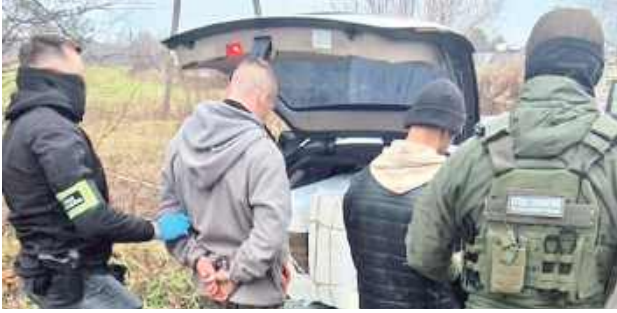
Bagażnik był pełen papierosów przetrzyconych balonem

W okolicach Białej Podlaskiej Straż Graniczna zatrzymała samochód z nielegalnymi papierosami. Jeden z dwóch jadących pojazdem, czyli Białorusin został zobowiązany do powrotu za Bug.