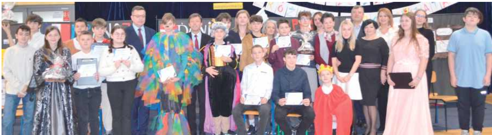
Po prezentacjach nastąpiło uroczyste wręczenie certyfikatów za udział w projekcie

W Publicznej Szkole Podstawowej w Rogoźnicy 28 listopada odbył się uroczysty finał tygodniowego projektu edukacyjnego „Baśnie i bajki z różnych stron świata”. Wydarzenie stało się prawdziwym świętem kreatywności, zaangażowania i szkolnej współpracy, gromadząc uczniów, rodziców, nauczycieli oraz znamienitych gości.