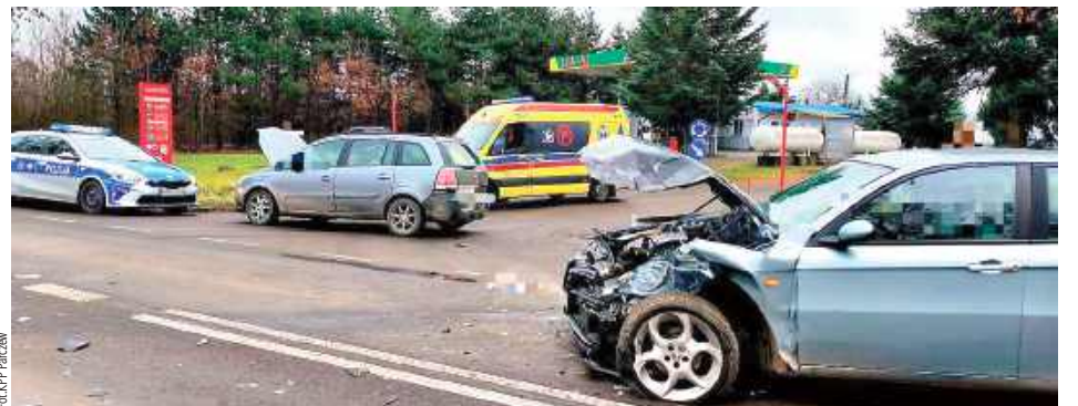
Na drodze wojewódzkiej DW 815 19-latek kierujący pojazdem marki Alfa Romeo nie zachował odpowiedniej odległości i wjechał w tył opla

Jak donosi KPP Parczew, do zdarzenia doszło przed południem w piątek w miejscowości Przewłoka. Na drodze wojewódzkiej DW 815 19-latek kierujący pojazdem marki Alfa Romeo nie zachował odpowiedniej odległości i wjechał w tył opla.