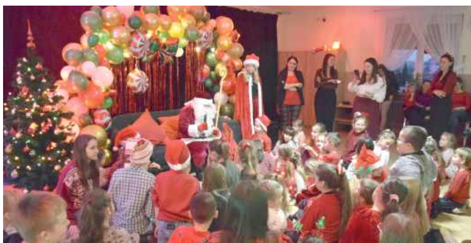
Mikołaj rozdał upominki najmłodszym, towarzyszył dzieciom w zabawie i oklaskiwał występy artystyczne lokalnych chórów i zespołów