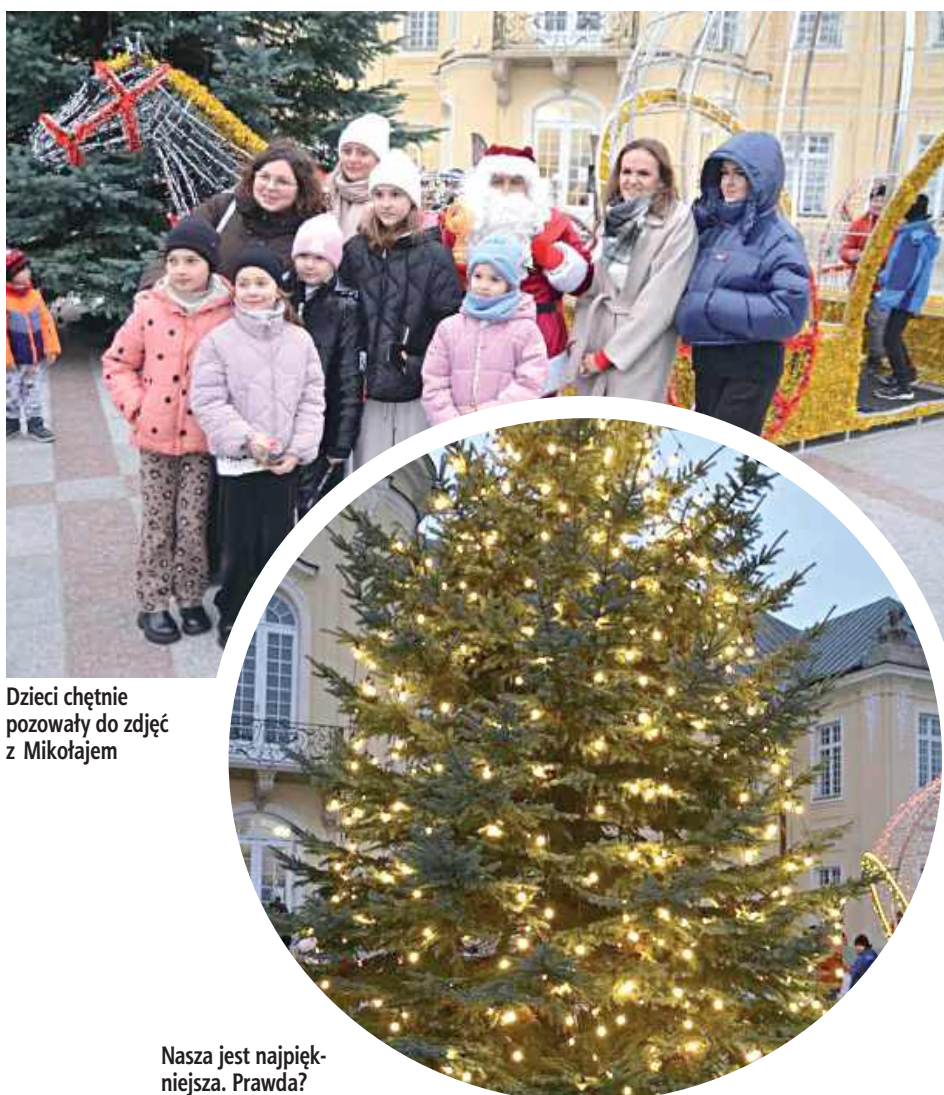
Dzieci chętnie pozowały do zdjęć z Mikołajem