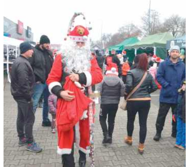
Wydarzenie co roku zachęca do pomagania setki mieszkańców