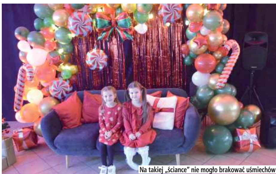
Na takiej „ścianie” nie mogło brakować uśmiechów