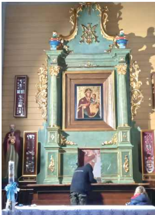
Ołtarz główny i obraz MB po renowacji i konserwacji dzięki wsparciu samorządu gminnego

Ikona Matki Boskiej Kolembrodzkiej przeszła konserwację. To dzięki temu, że samorząd gminy Komarówka Podlaska przekazał na ten cel 10 tys. zł dodatkowo ponad to, co uzyskał Polskiego Ładu.