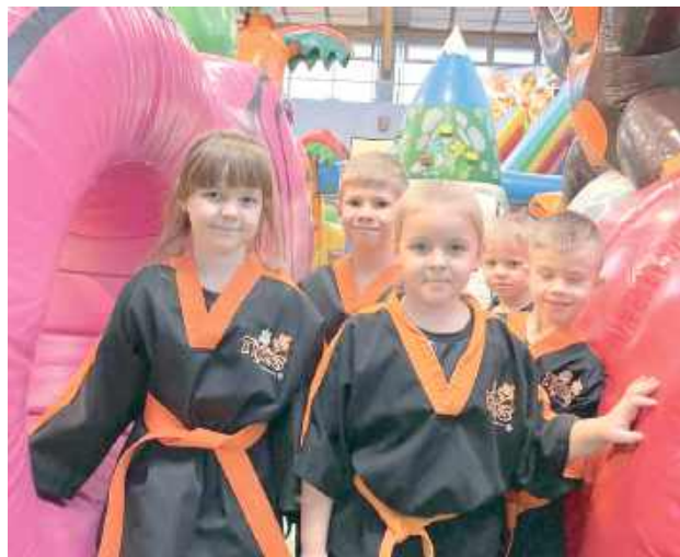
A tacy mali wojownicy, w charakterystycznych czarnych jeszcze kimono, fachowo nazywają się Tygrysi. Tigers. Za parę lat z niektórych wyrosną mistrzowie Polski

Wojownicy z RSCT z różnych imprez medale do Radzyna zwożą workami, nieważne czy to Mistrzostwa Świata, Europy, Polski, jakiś Puchar