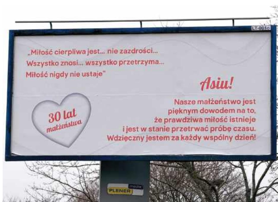
Billboard o miłości przy al. Jana Pawła II

Takiemu publicznemu, a jednocześnie anonimowemu