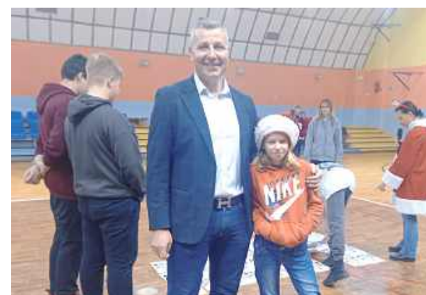
Mikołaj odwiedził dzieci z Komarówki - doroczna zabawa odbyła się w hali sportowej przy Szkole Podstawowej 5 grudnia