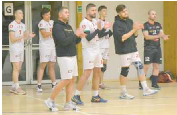
Seniorzy, również po pięciosetówce, wygrali z Akademią Siatkarską Świdnik

Zarówno seniorzy jak i juniorzy Radzyńskiego Klubu Sportowego wygrali w tym tygodniu swoje mecze (oba w tie-breaku!) ale znacznie dłużej zapewne będą pamiętać, że mogli potrenować razem z Krzysztofem Ignaczakiem!