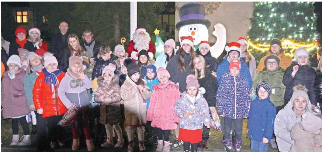
Uroczyste Rozświetlenie gminnej choinki ogłasza oficjalnie nadejście świątecznego czasu i niepowtarzalnej atmosfery świąt Bożego Narodzenia. To magiczna chwila, na którą z niecierpliwością czekają wszyscy – od najmłodszych po seniorów

Mikołaj pojawił się już tego dnia wcześniej, tuż po południu w gminnej bibliotece na zaproszenie organizatorów wydarzenia: GOKiS Borki oraz Gminnej Biblioteki. Od godz. 14 trwała zabawa i spotkanie ze specjalnym gościem z Laponii. A gdy zapadł zmrok, wesóło kompania przemaszerowała na plac urzędu o godzinie 17, głośno śpiewając „Świeć, Gwiazdeczko moja świeć”, gdzie po odliczaniu 3... 2... 1... 0... choinka zabyła setkami światełek.