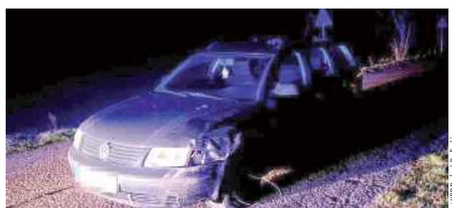
41-latek był nietrzeźwy - w organizmie miał niemal 3 promile alkoholu

- Kierujący samochodem osobowym marki VW Passat zjechał na przeciwległy pas