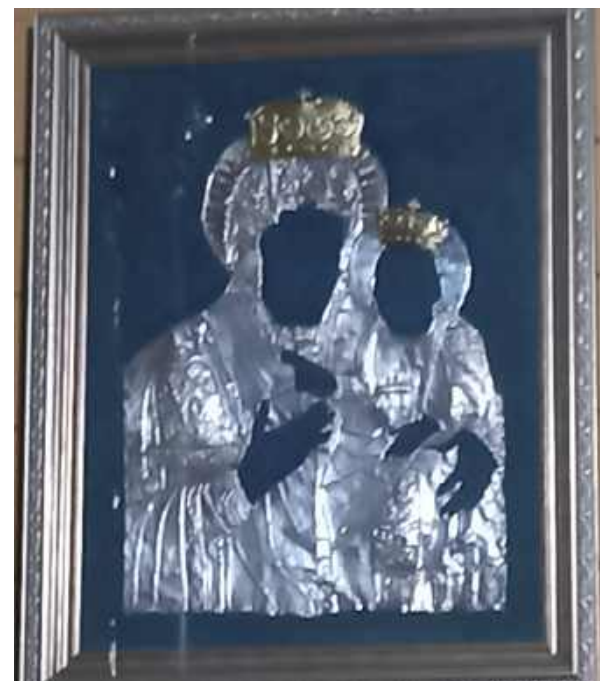
W świątyni znalazły teraz miejsce drogie wota dotąd przechowywane na plebanii - koszulka i korony cudownej ikony. Świadczą one o tym, jak wielkim kultem i czcią darzony jest wizerunek kolembrodzkiej Madonny z Dzieciątkiem