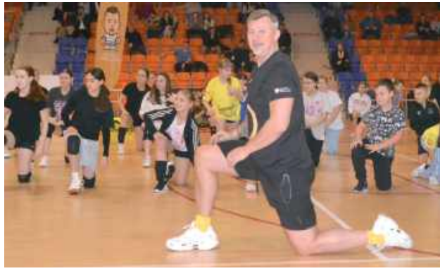
Oczywiście trening z mistrzem natychmiast przełożył się na wynik sportowy: w niedzielę juniorzy przegrali w tie-breaku na swoją stronę szalę zwycięstwa w meczu z Krasnymstawem i zajmują w lidze 4. miejsce na 8 drużyn