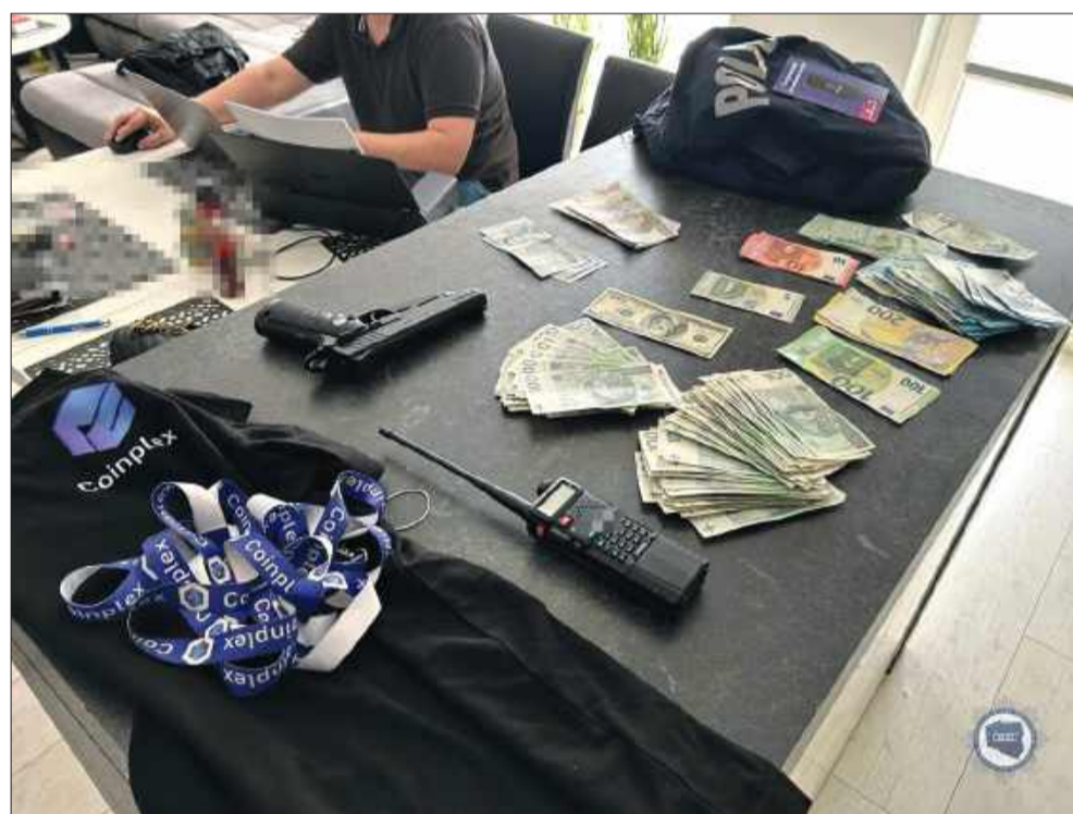
Zatrzymano 9 osób związanych z piramidą „COINPLEX”. Prokuratura: postępowanie jest rozwojowe.