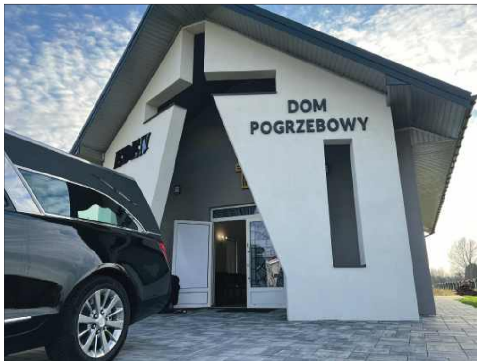
Nowa kaplica Domu Pogrzebowego EDEN przy ul. Rzochowskiej w Mielcu.