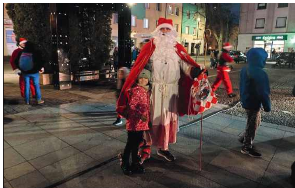
Mikołaja spotkałiśmy także na placu AK (i to nie jednego!)