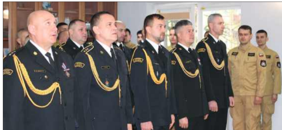
Komendant awansował kilkunastu funkcjonariuszy.