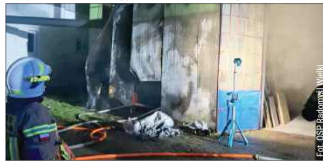
Nocna interwencja służb. Ogień w zakładzie produkcyjnym.

Dzięki szybkiej reakcji strażaków i współpracy wszystkich służb pożar udało się opanować, zapobiegając jego dalszemu rozprzestrzenieniu. W zdarzeniu nikt nie ucierpiał. Marta Warias