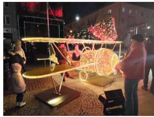
Nawet świąteczne dekoracje w Mielcu nie mogą się obyć bez samolotu

Są rzeczy, które się nie zmieniają. Święty Mikołaj znowu odwiedził Mielec i wyznał, że właśnie tu dzieci są najgrzeczniejsze. Jesteśmy dumni.