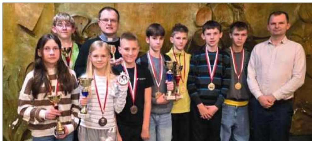
Wielki sukces młodych szachistów z Radomyśla Wielkiego! Mistrzostwo Polski Lektorów i podium Ministrantów na krajowych mistrzostwach.