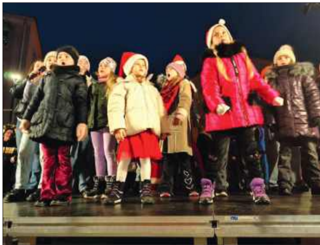
Na scenie zaśpiewał zespół Konwalie