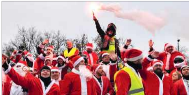
Było ich bardzo wielu!