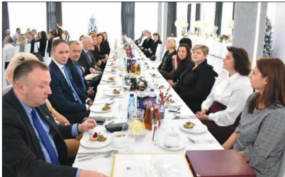
Jubileusz 30-lecia działalności ŚDS w Mielcu stanowi symboliczne podsumowanie dotychczasowych osiągnięć i fundament do dalszej pracy.

To wyróżnienie jest dowodem na to, jak ważne jest lokalne zaangażowanie w szerzenie kultury literackiej oraz promowanie wartościowych tradycji, które integrują mieszkańców i wpływają na rozwój społeczności. GJ