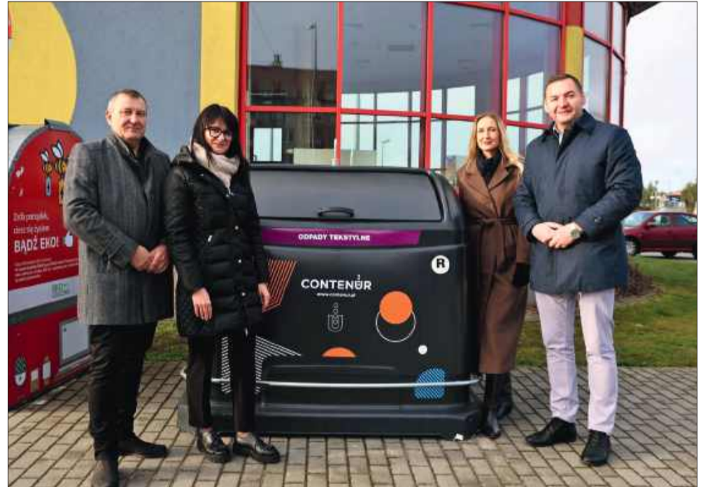
Nowy kontener na tekstylia przy basenie.

Mieszkańcy zachęceni są do regularnego korzystania z pojemnika oraz przekazywania dalej informacji o nowej lokalizacji – by jak najwięcej tekstyliów otrzymało drugie życie. MW