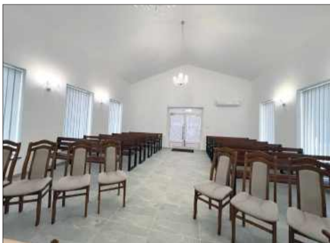
Eleganckie i spokojne wnętrza nowo otwartej kaplicy EDEN.