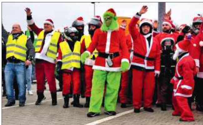
Nikomiu nie udało się zniszczyć tych Mikołajek