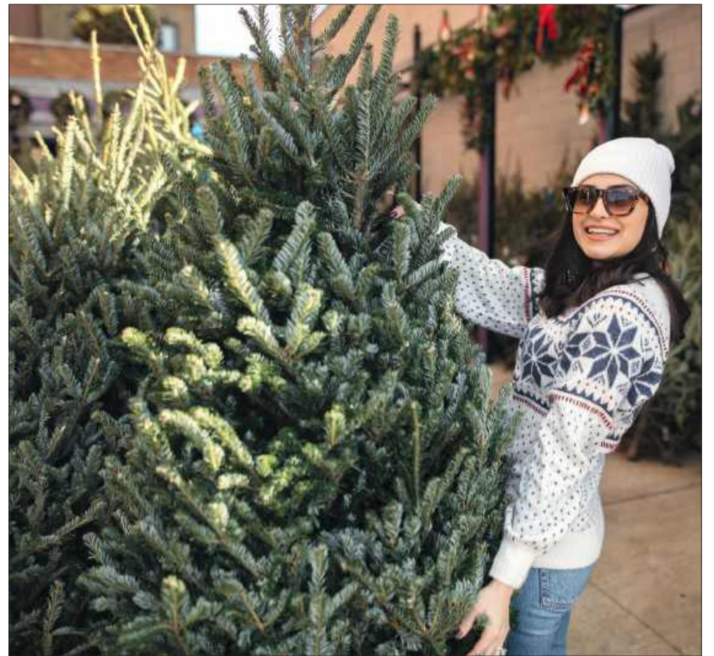
Warto kupować choinki od lokalnych dostawców, w leśnictwach lub punktach z certyfikatem.

Święta to emocje, zapach i klimat - a nie plastik, który trzeba „udawać”, żeby wyglądał naturalnie. Żywa choinka daje prawdziwość, atmosferę