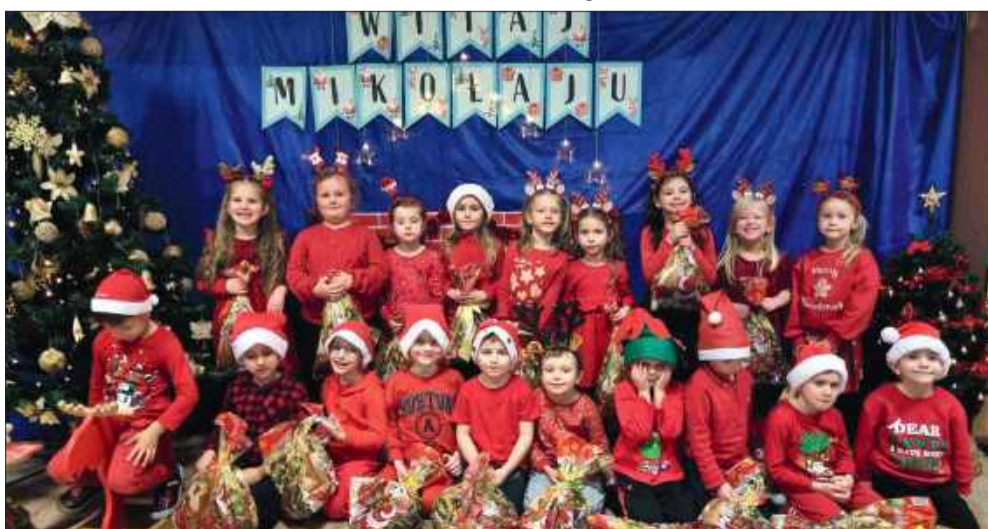
Mikołaj odwiedził Przedszkole Samorządowe w Chorzelowie. Radości i uśmiechów nie było końca.

Spotkanie zakończyło się w wyjątkowo ciepłej, świątecznej atmosferze, która na długo pozostanie w pamięci najmłodszych. MW