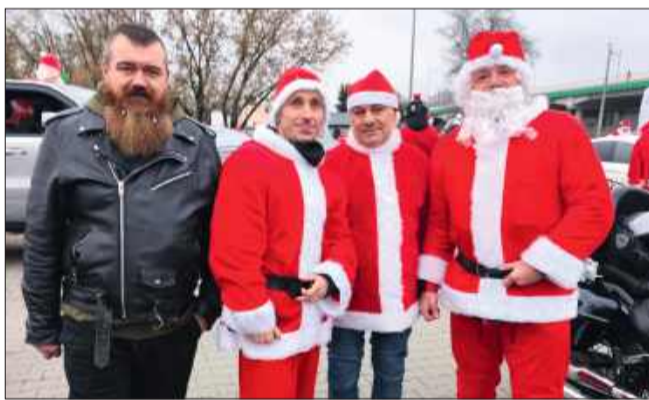
Faceci w czerwieni (i czerni)