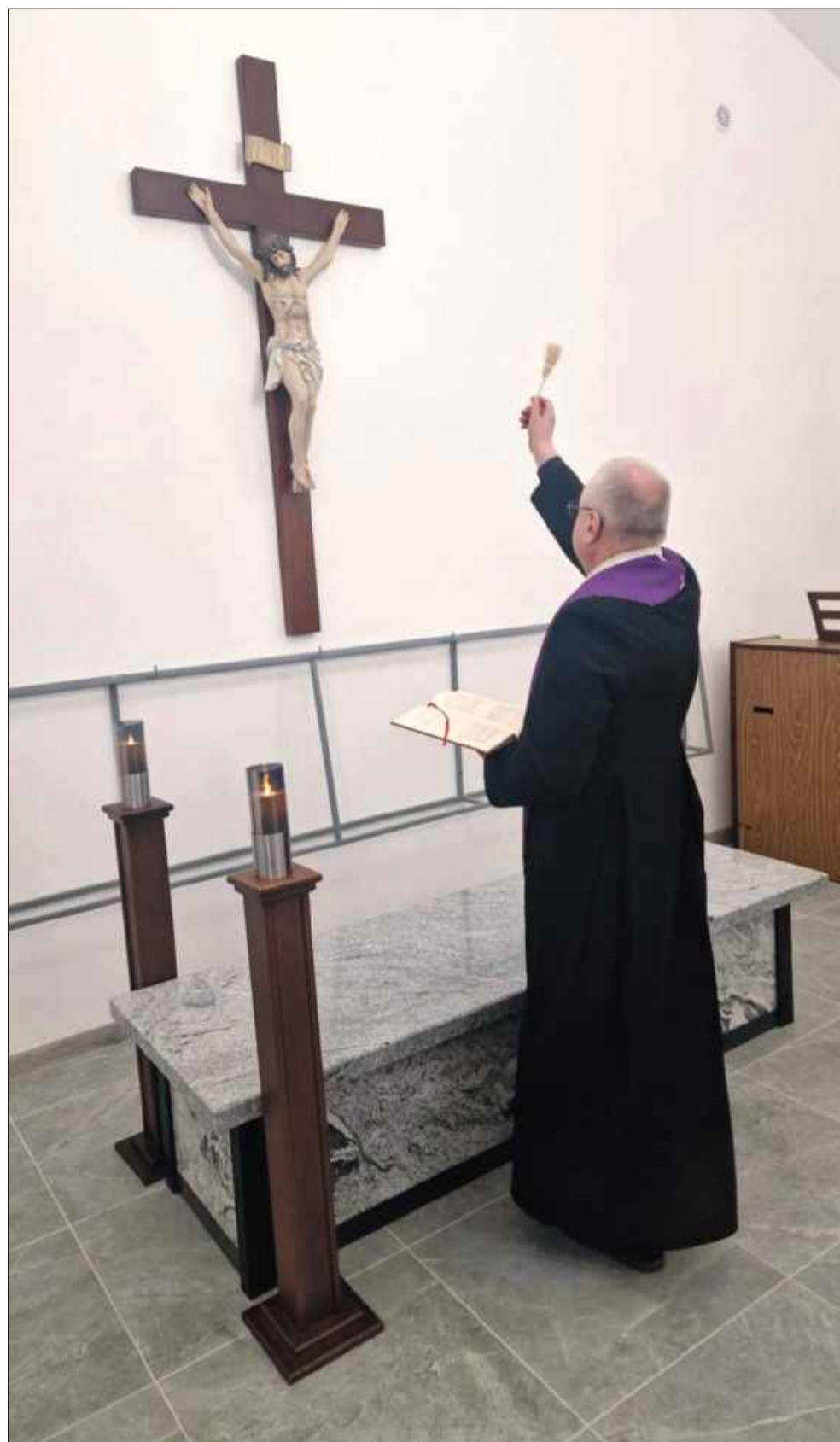
Poświęcenie nowej kaplicy.