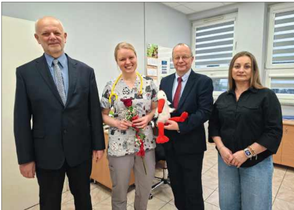
Nowy pediatra w GSP ZOZ w Borowej.