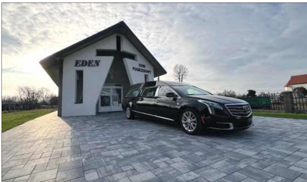
Kaplica zlokalizowana tuż przy cmentarzu przy ul. Rzochowskiej.