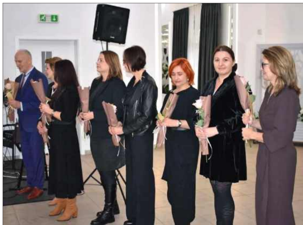
Pracownicy ŚDS odebrali podziękowania za ich codzienną pracę pełną wrażliwości, empatii i troski.