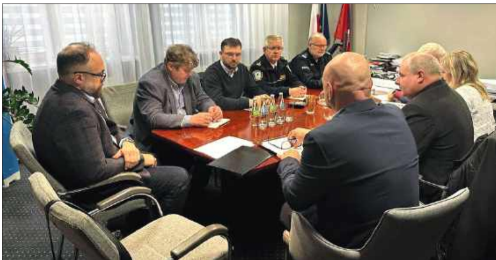
Komisja omówiła palące tematy dotyczące bezpieczeństwa ruchu drogowego.