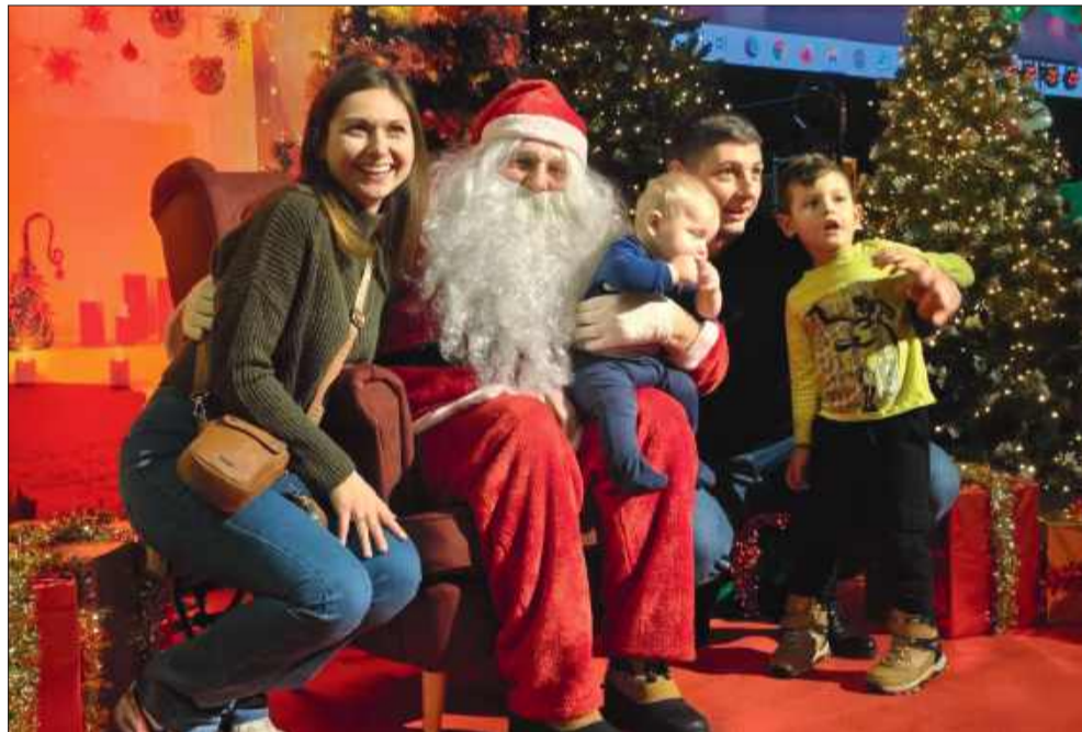
Nie ma to jak spotkanie z poczcwym Mikołajem