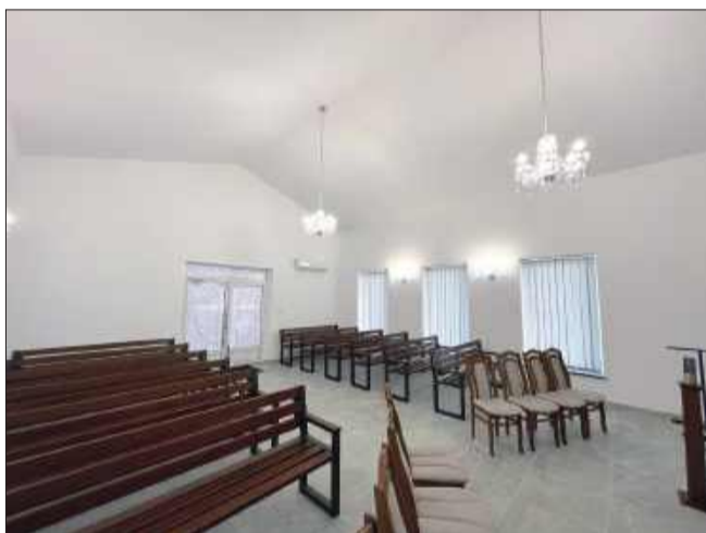
Starannie zaprojektowane wnętrza sprzyjające zadumie i pożegnaniu.