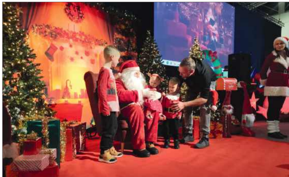
Niektórzy podejrzliwie patrzyli na Mikołaja