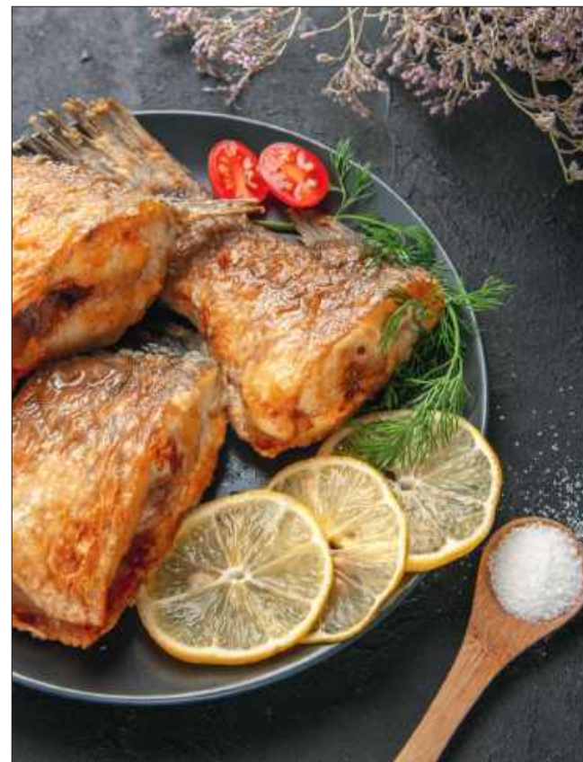
Jeśli karp był długo moczony w mleku i nie jest przesmażony – muł zostaje w przeszłości. Goście tego nie poczują. Ty też nie.

Krok 2: Osusz i przypraw krótko. Wyjmij rybę, dokładnie