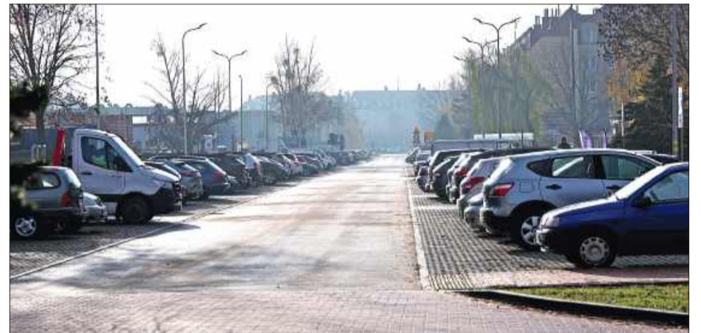
Nowo zmodernizowana ulica Warneńczyka.