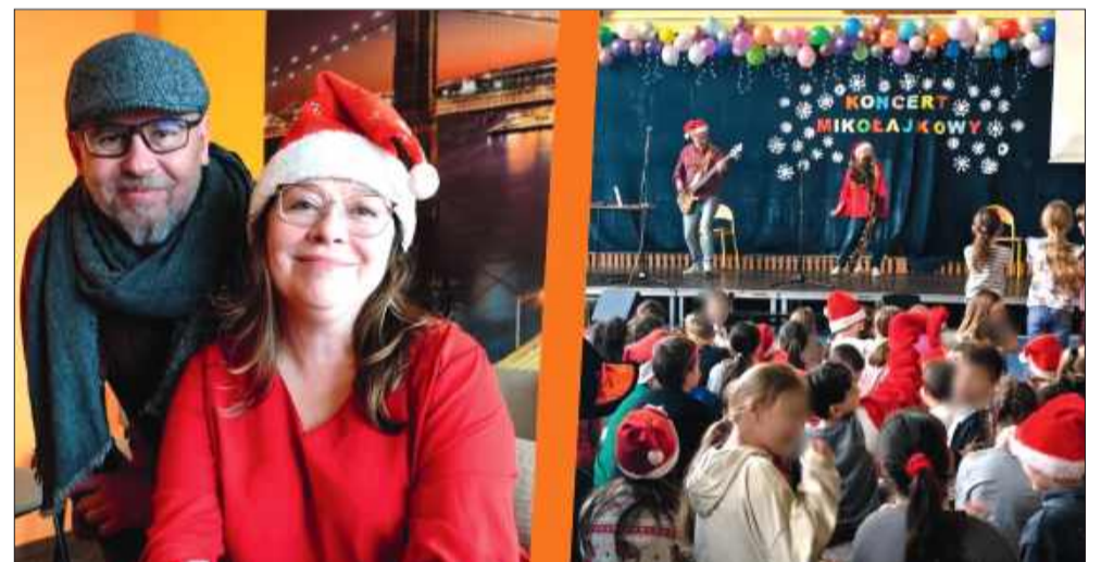
Autorzy niezapomnianego hitu zaśpiewali na żywo w Mielcu.