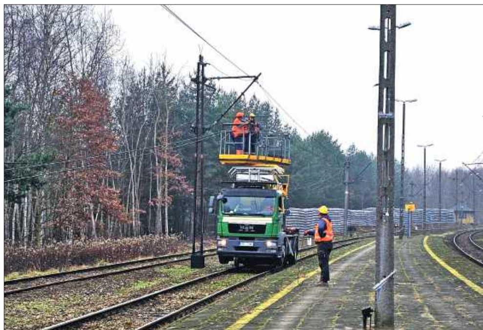
Demontaż sieci trakcyjnej w stacji Sobów.