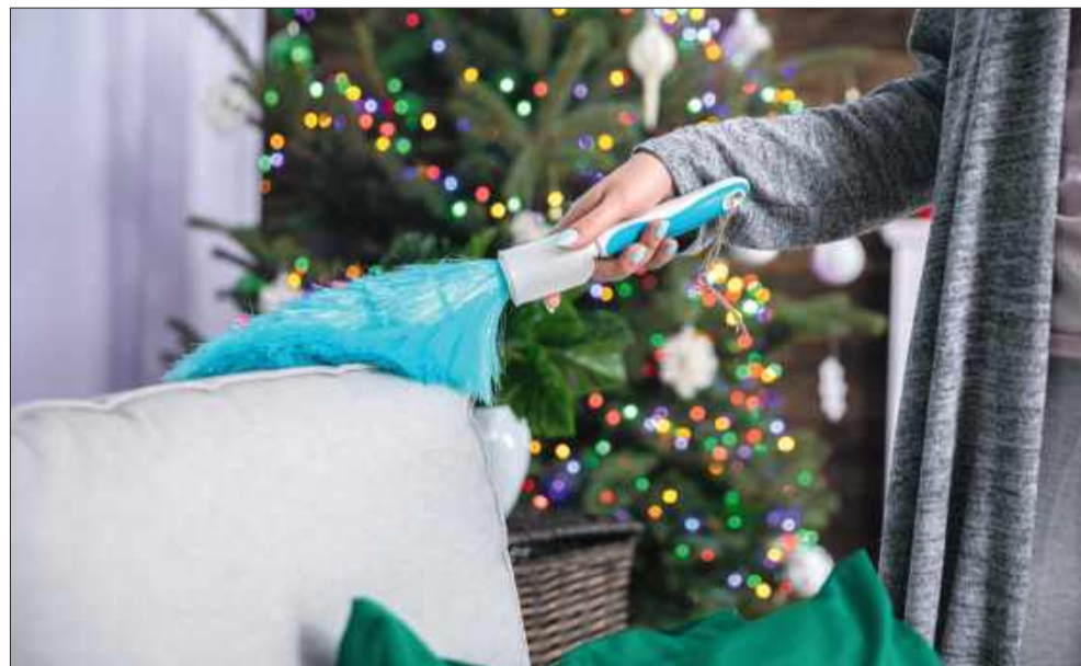
Największe sprzątanie zrób na początku miesiąca.