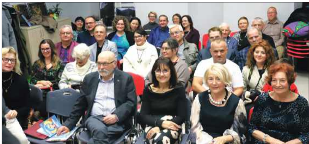
Promocja 9. numeru „Dygresji”. Literackie święto w Mielcu.

W sobotę, 7 grudnia 2025 roku, siedziba Mieleckiego Towarzystwa Literackiego im. Marii Błażków ponownie wypełniła się miłośnikami słowa. Tego dnia odbyła się promocja dziewiątego już numeru „Dygresji” – Mieleckiego Rocznika Literacko-Kulturalnego, wydawanego nieprzerwanie od 2017 roku.