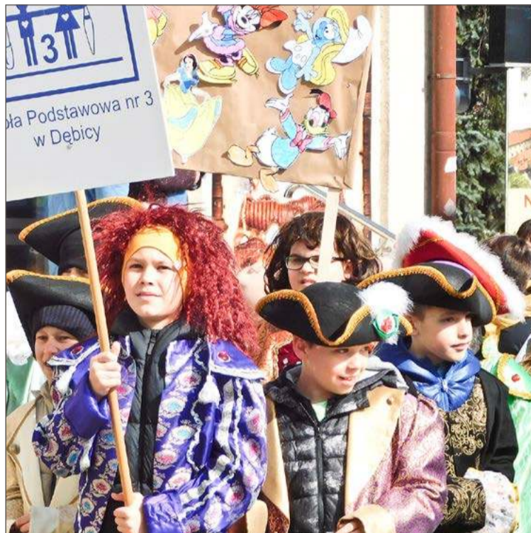
Postacie z filmów i bajek znów przejdą ulicami miasta.

W niedzielę na tej samej scenie wystąpią: grupa Wyindywidualizowani oraz Młodzieżowy Teatr Małych Form ferment.