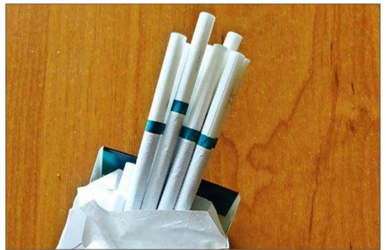
Sprzedawali papierosy i alkohol bez akcyzy.

- Łączna kwota uszczuplenia należnego Skarbowi Państwa podatku akcyzowego w związku z działalnością oskarżonych wyniosła 880 253 zł - przekazuje rzecznik.