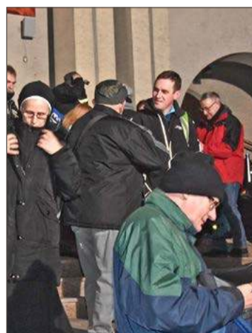
Uczestnicy EDK spotkają się w kościele NSPJ w Dębicy.

Z Pilzna zainteresowani będą mogli wyruszyć na trasę niebieską