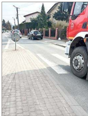
Do zdarzenia doszło na rondzie im. Mickiewicza.

Jak mówi podkom. Jacek Bator, rzecznik prasowy Komendy Powiatowej Policji w Dębicy, potra-