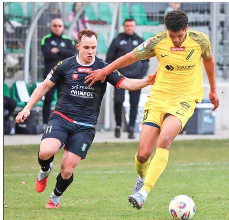
Po dwóch zwycięstwach z rzędu piłkarze Wisłoki (czarne stroje) w trzecim meczu u siebie przegrali z Naprzodem.