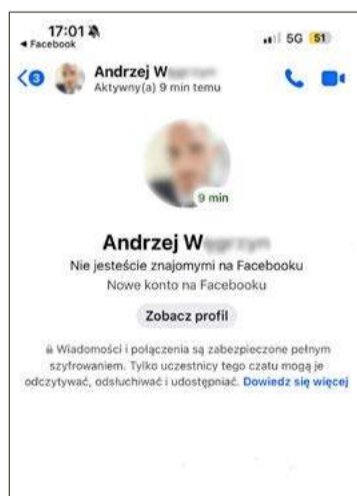
Mężczyzna wykorzystuje zdjęcie aktora filmów dla dorosłych.