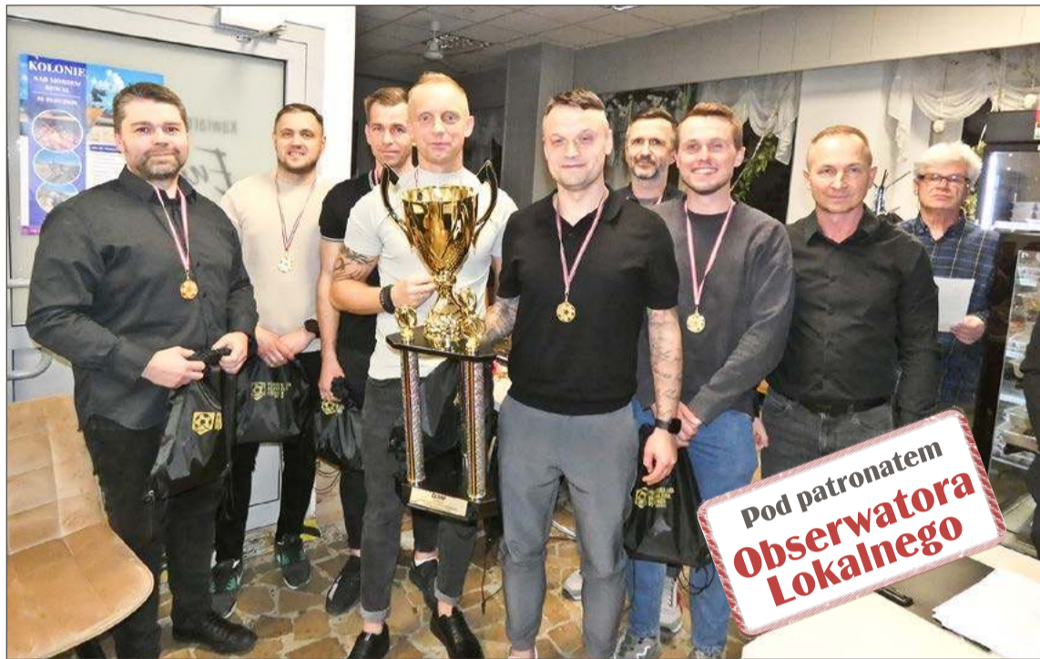
Drużyna Olimpu zdobyła puchar za zwycięstwo w PLHFD po dwóch latach przerwy.