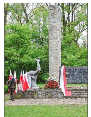
Tutaj znajduje się pomnik upamiętniający ofiary obozu.

Jak zapewniamy władze gminy, zadanie zostanie powierzony tyl-