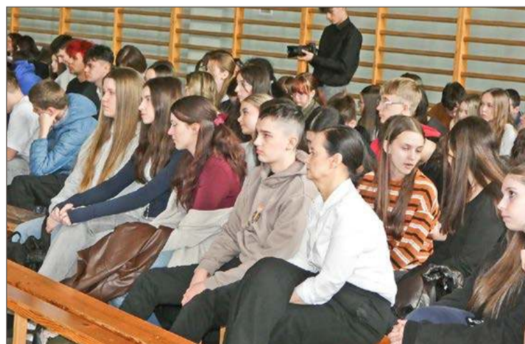
Młodzież o patronie Ekonomika mogła się dowiedzieć bardzo dużo.