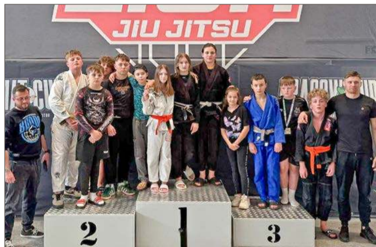
Zawodnicy oraz trenerzy BJJ Gryf Dębica na podium Dexters Cup.