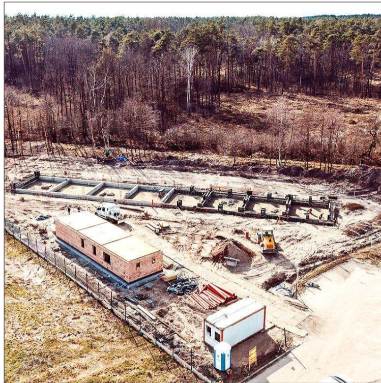
PSZOK znajduje się w strefie gospodarczej w Straszęcinie.