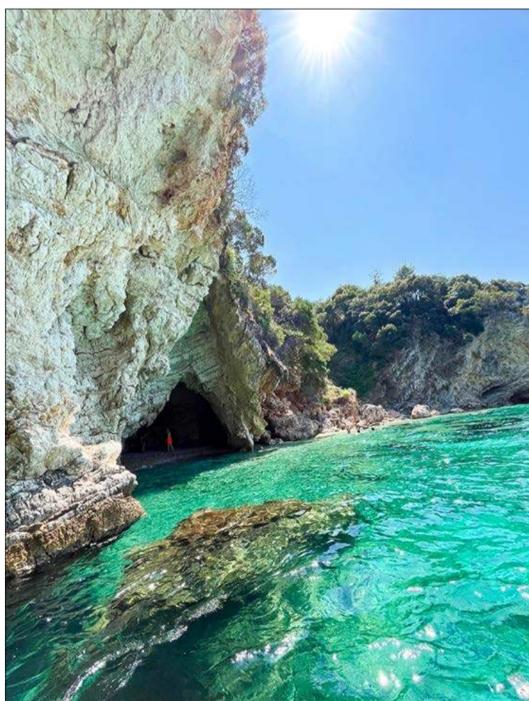
A na wakacje polecam do Grecji.