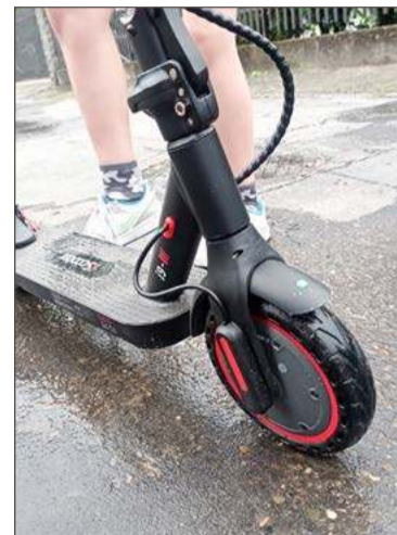
Do 13. roku życia można jeździć tylko po drogach wewnętrznych.

Te elektryczne, którymi według nowych przepisów można poruszać się od 13. roku życia.