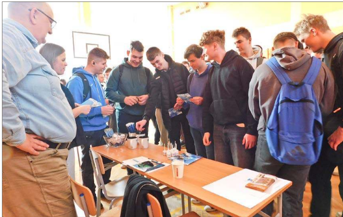
Stoisko firmy Tabor też cieszyło się zainteresowaniem uczniów Zespołu Szkół Zawodowych nr 1.

Po chwili jednak wyjaśnia, że nie do końca tak jest, bo tak naprawdę,