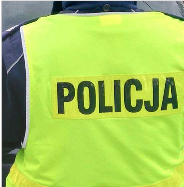
Policjanci pełnili służbę w Kleciach.

Po sprawdzeniu w policyjnej bazie danych okazało się, że siedząca