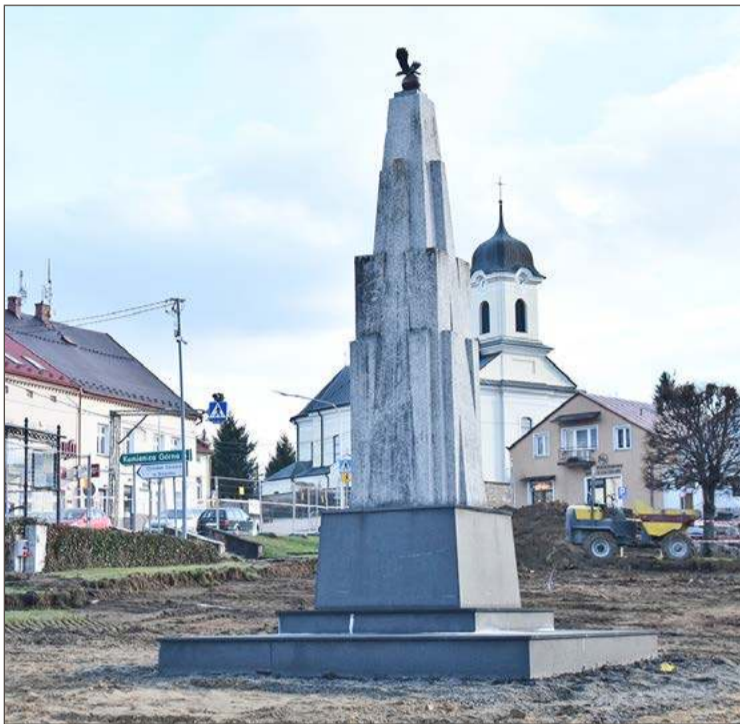
Forma upamiętnienia zamordowanych przez Niemców, którym pomagały oddziały ukraińskie od początku budziła zastrzeżenia.

- I pojawia się pytanie, co zrobić, żeby pasował do nowej szaty rynku - zastanawia się.