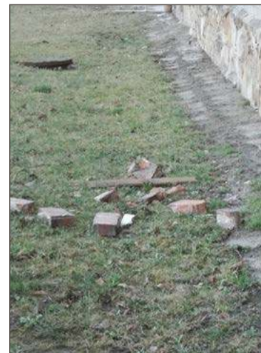
Fragmenty ściany na szczycie spadły na odgradzony teren.

Dyrektor I Liceum Ogólnokształcącego w Dębicy zapowiada przegląd.