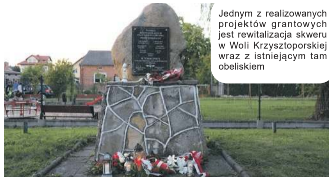
Jednym z realizowanych projektów grantowych jest rewitalizacja skweru w Woli Krzysztoporskiej wraz z istniejącym tam obeliskiem

Wysokość udzielonej dotacji 85,25% w kwocie 12.787 zł z przeznaczeniem na realizację projektu pn. „Wyposażenie altany sołectkiej