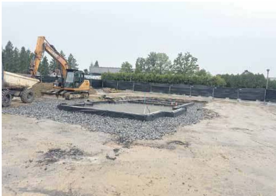
Fundamenty nowej kaplicy cmentarnej na Zaborni.

Budowa nowej kaplicy cmentarzu na Zaborni w Rabce szybko idzie do przodu.