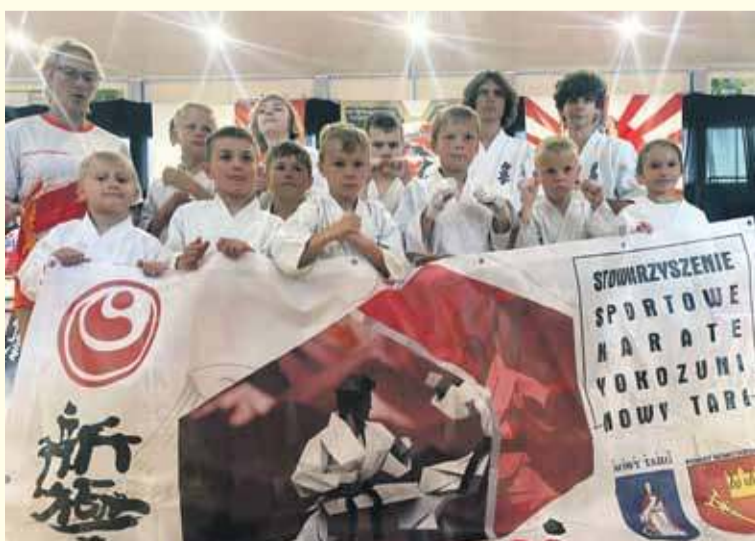
Zawodnicy Yokozuna Nowy Targ