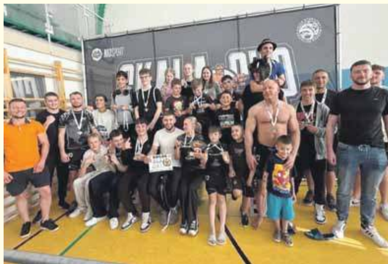
Zawodnicy z Szaflar zdobyli łącznie 34 medale.