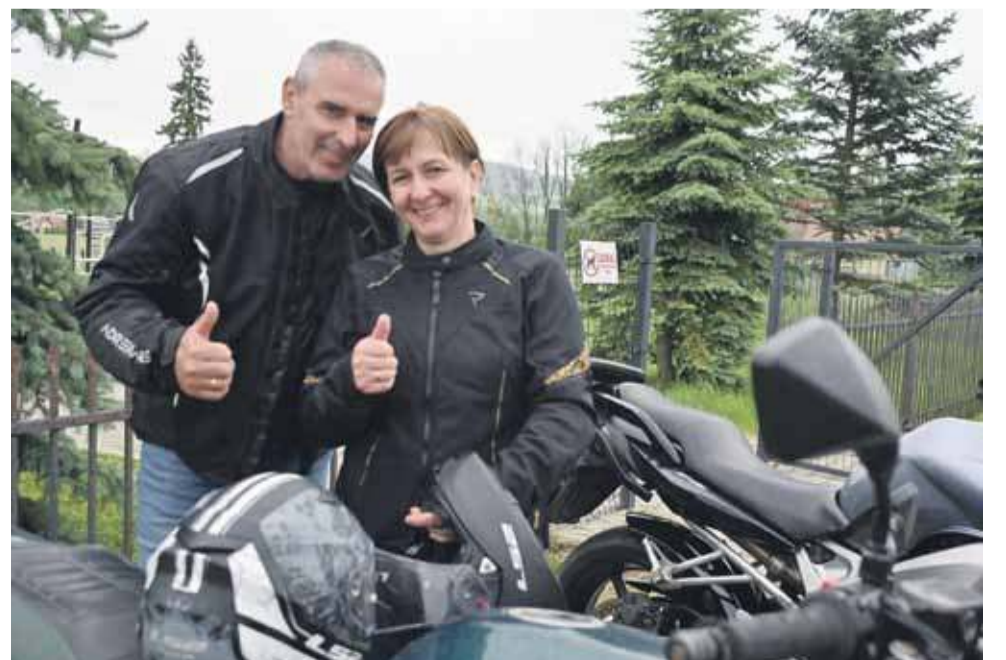
Zakochani nie tylko w sobie, ale i w motorach.