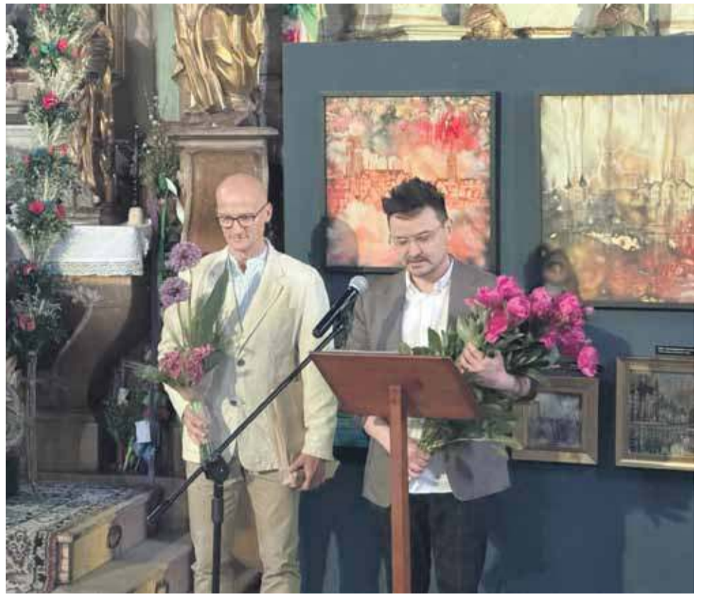
Prace Pawła Jasińskiego można podziwiać w rabczańskim Starym Kościółku.

Paweł Jasiński ukończył studia na Wydziale Sztuki Sakralnej i Muzealnictwa na Uniwersytecie Papieskim w Krakowie. Wiele lat temu wyjechał do Irlandii. Zamieszkał w Dublinie. Tam dzisiaj mieszka, tworzy i osiąga sukcesy. Artysta może się pochwalić wieloma indywidualnymi wystawami w Polsce i w Europie (Łotwa, Anglia, Irlandia). Muzeum The Hunt w Irlandii uznało jedną z prac polskiego artysty za obraz miesiąca. Paweł Jasiński tworzył też malowidła w przestrzeni miejskiej Dublina. Dzieła powstały we współpracy z władzami miasta. Twórca ściśle współpracuje też z Ambasadą Polską w Dublinie, projektując rzemiosło artystyczne promujące Polskę.