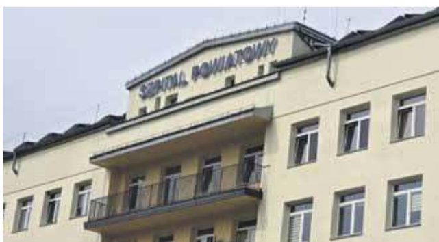
Czy nadszedł czas na zmianę dyrekcji zakopiańskiego szpitala?