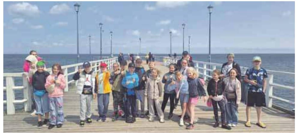
Uczniowie z klasy 3. Szkoły Podstawowej nr 1 im. Bohaterów Westerplatte w Cichem zwiedzają Trójmiasto. Byli m.in. na molo w Sopocie, na Westerplatte i w Europejskim Centrum Solidarności. Podróż tam i z powrotem też odbywała się samolotem.