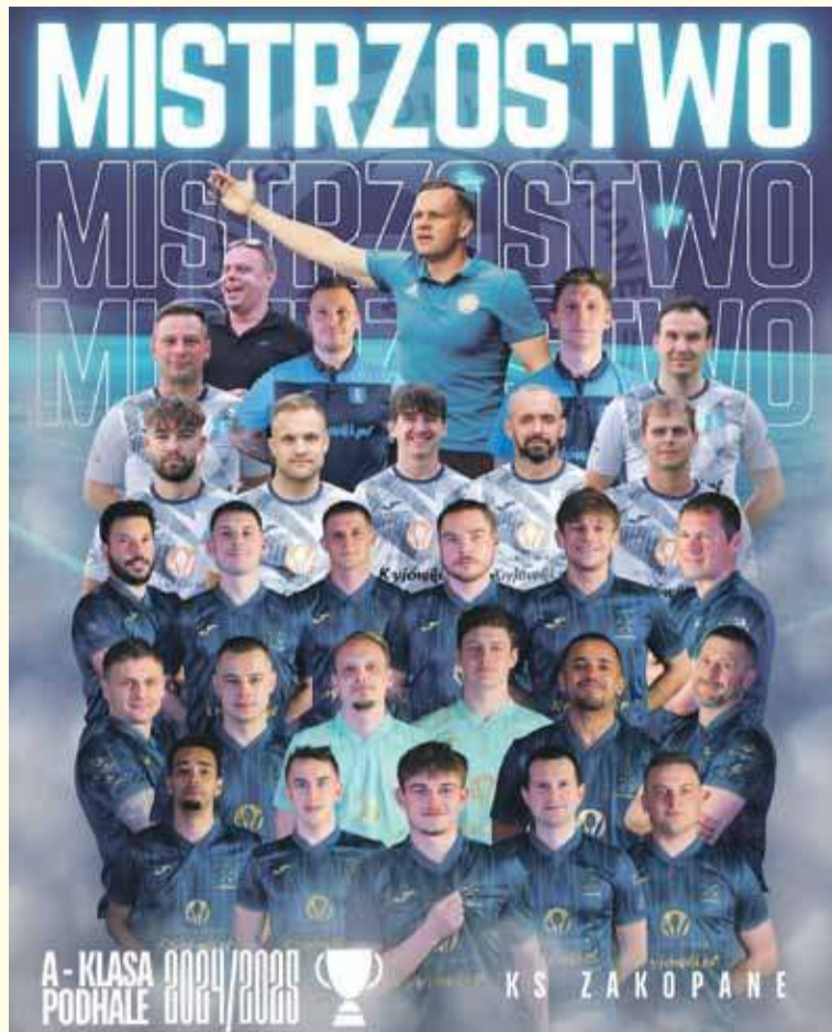
Drużyna KS Zakopane zagra w przyszłym sezonie w Lidze Okręgowej.

Bramki: Żegleń 12, R. Daleki 78 - Janc 45+2 z rzutu karnego.