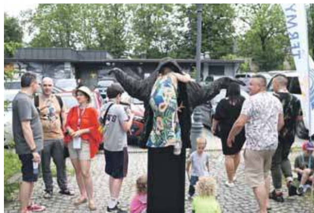
Kiedy dorośli słuchali, dzieciaki zabawiały się przed teatrem.