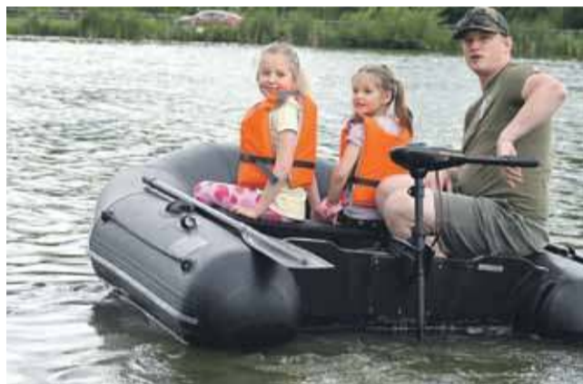
Zanim przyjdzie czas na łowienie, trzeba poznać specyfikę pracy wędkarza.

Z a nami druga odsłona Wędkarskiego Dnia Dziecka. Imprezę przygotował Podhalański Klub Karpioży. - Zależy nam, by zachęcić najmłodszych do pasji węd-