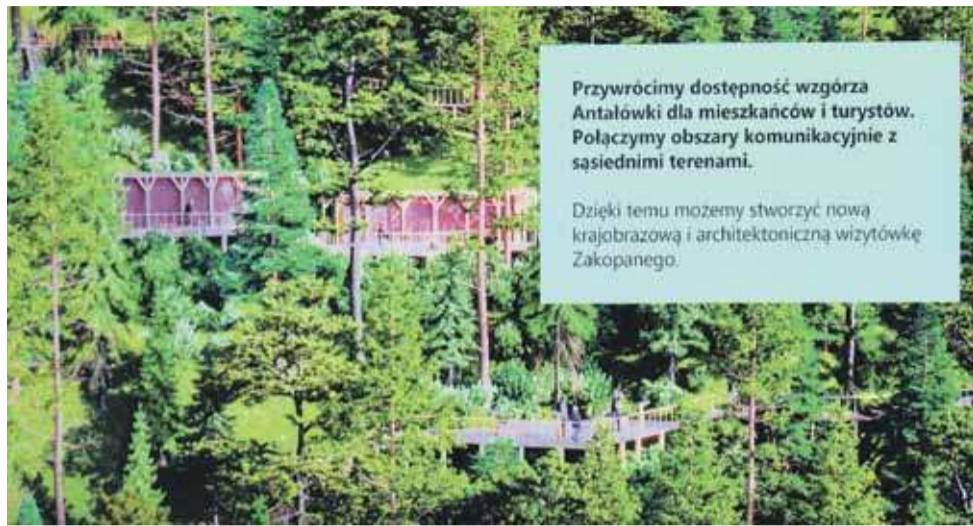
Inwestor chce udostępnić teren Sanato nie tylko dla hotelowych gości, ale też dla mieszkańców i turystów.

- Chcemy otworzyć Sanato i przestrzeń całej góry dla ludzi, rowerzystów, spacerowiczów, stworzyć miejsca przyjazne, takie jak ścieżki spacerowe, punkty widokowe, siłownie plenerowe, miejsca odpoczynku, część