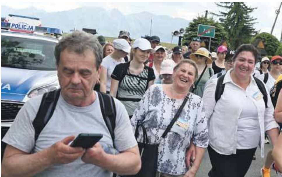
Nowoczesny pielgrzym zaraz „wrzuca” wszystko na portal społecznościowy. Na Drodze Papieskiej nie zabrakło też reprezentantów Ratułowa.

- Dziękuję, że wychodzicie co roku na ten szlak pielgrzymi i w ten właśnie sposób pamięta-