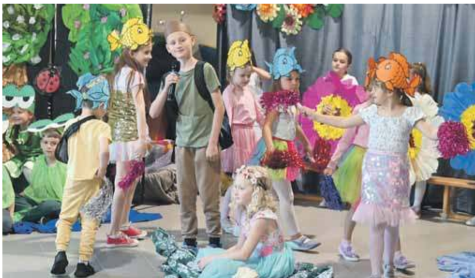
Uczniowie przedstawili m.in. „Calineczkę”.