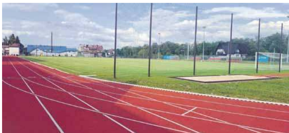
Bieżnia w Czarnym Dunajcu nie spełnia, zdaniem radnego Dziubka i wuefistów, norm wymiarowych. Brakuje 4 metrów.