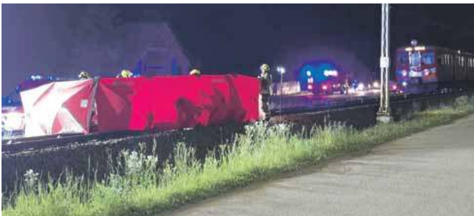
Do tragedii doszło w poniedziałkowy wieczór.