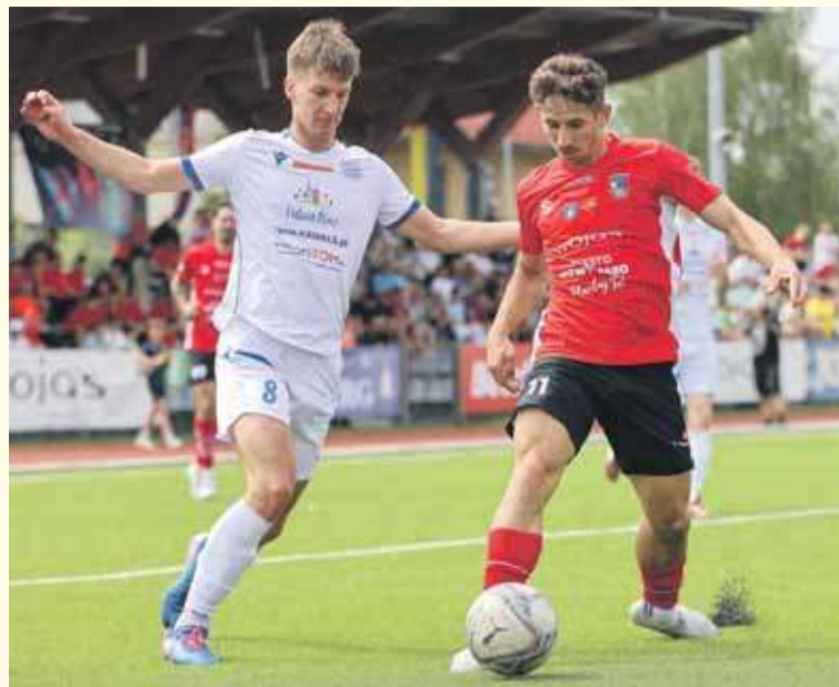
Podhale wysoko pokonało drużynę z Lewartowa.