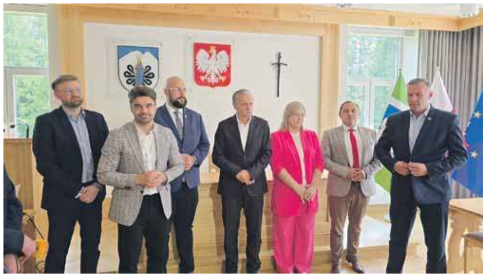
W czasie wtorkowego konwentu starosta, burmistrz i wójtowie rozmawiali o usprawnieniu komunikacji w powiecie tatrzańskim.