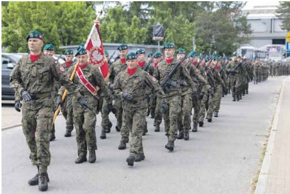
Uroczysty apel zakończył się defiladą wojsk nowotarskimi ulicami.