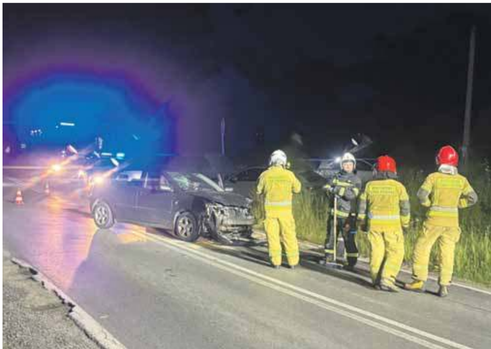
Na szczęście w wypadku nikt nie ucierpiał.