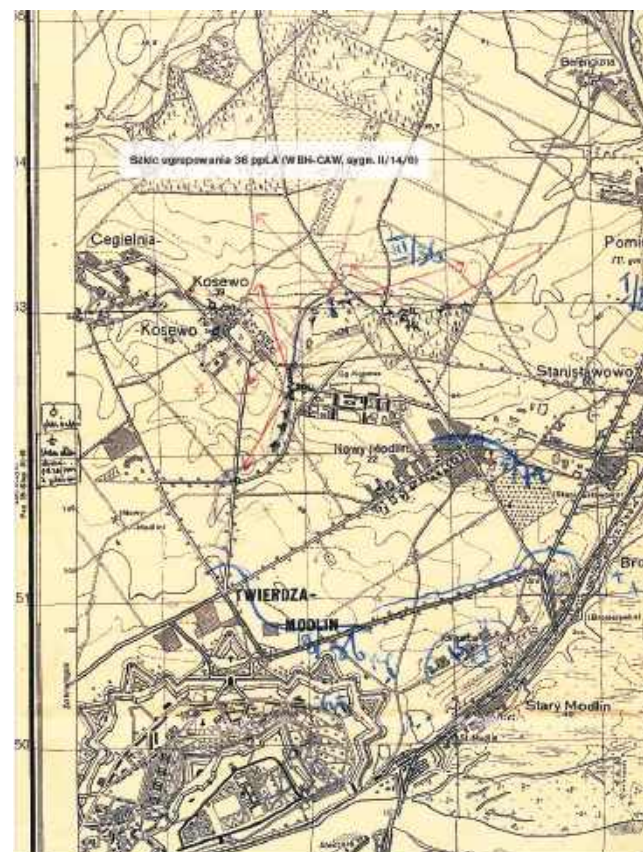
Mapa z książki "Fort III Pomiechówek kartki z kalendarza 1939 r."