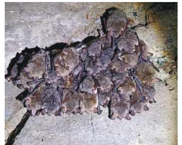
Na zdjęciu nietoperze zimujące w grupie