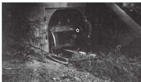
Armata tzw. prawosłonna będąca na wyposażeniu fortu III we wrześniu 1939 r.

Warszawa broni się w dalszym ciągu mimo przewagi wroga. Ze 1000 samolotów polskich, angielskich i francuskich atakuje z powietrza Niemców. To znów inna wieść niesie, że generał Bortnowski w 11 dywizji pod Łodzią napiera na nich. Otucha wstępuje w serca żołnierskie, a to jest dobry omen. [...] Od żołnierzy z innych pułków dowiadujemy się, jak jeden z kaprali z piechoty zabił z karabinu 9 Niemców atakujących na linię naszych okopów 65 .