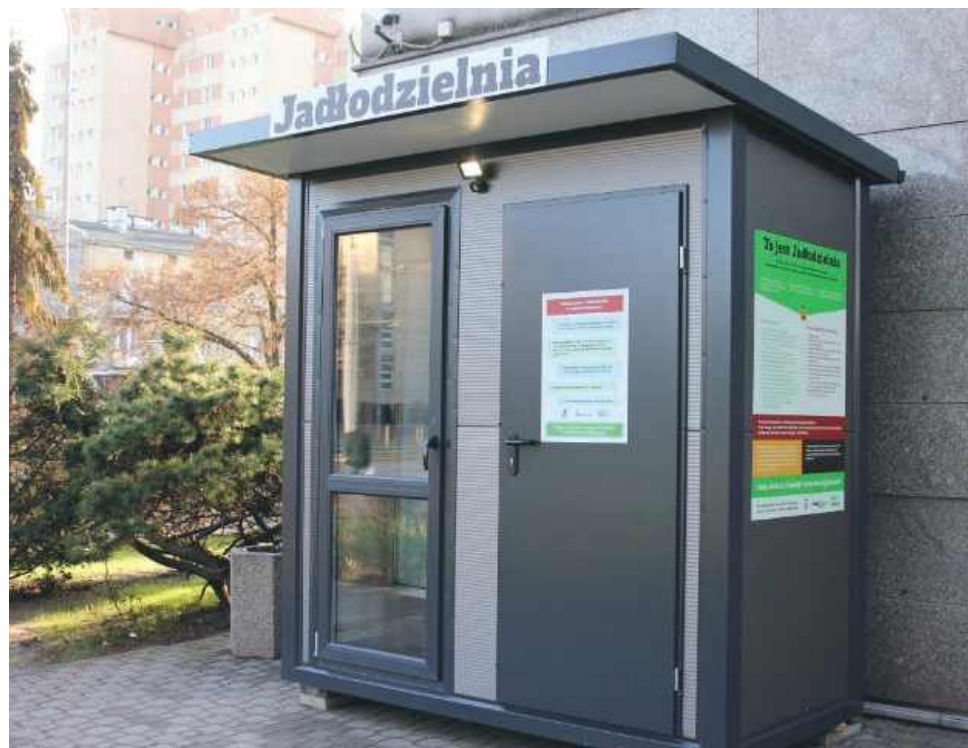
Jadalnielnia w warszawskiej dzielnicy Włochy. Zdjęcie ze strony um.warszawa.pl