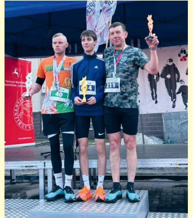
fol. Bieg Tropem Wilczym Chełm