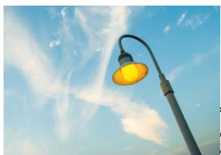
Postulaty, jakie mieszkańcy miejscowości Kanie i kilku okolicznych wsi zawarli w ubiegłorocznej petycji, nie mogą zostać tymczasem uwzględnione.