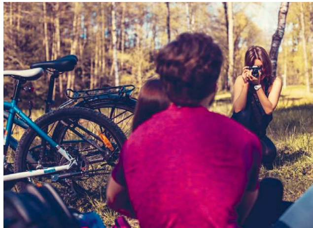
Odwiedzający gminę goście będą mogli skorzystać z nowych rozwiązań infrastruktury turystycznej.

● GM. LEŚNIEWICE Już niebawem władze gminy dowiedzą się, którzy wykonawcy zechcą zrealizować nową inwestycję infrastrukturalną. Tym razem chodzi jednak nie o drogi, a nowe obiekty rekreacyjne. Co dokładnie zaplanowano?