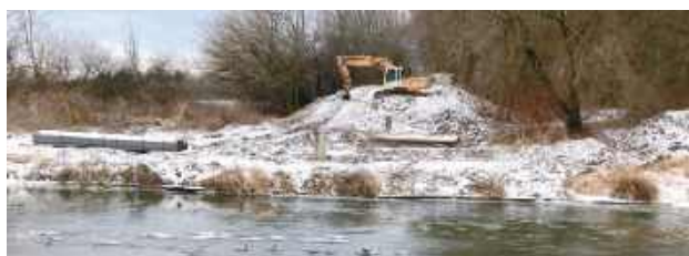
Zielona sieć w Łęcznej

ności mają być także schody terenowe z barierką, które zapewnią dojście do przystani i kładek od strony Starego Miasta.