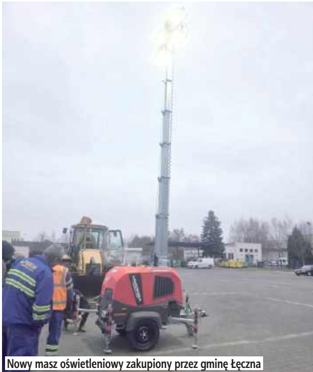
Nowy masz oświetleniowy zakupiony przez gminę Łęczna

Wśród nowego wyposażenia znalazły się radiotelefony - nasobny i stacjonarny - wykorzystywane w łączności podczas akcji i koordynacji działań. Gmina zakupiła również mobilny maszt oświetleniowy, mobilną stację uzdat-