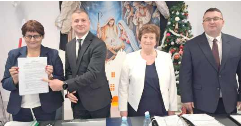
Z budżetu jasno wynika, że 2026 rok w gminie Spiczyn upłynie pod znakiem inwestycji infrastrukturalnych

W piątek, 19 grudnia odbyła się ostatnia w tym roku sesja Rady Gminy Spiczyn. Jej najważniejszym punktem było głosowanie nad budżetem na 2026 rok. Radni jednogłośnie (13 za, przy dwóch osobach nieobecnych) przyjęli uchwałę budżetową, której skala jest największa w historii tego samorządu. Dochody zaplanowano na poziomie 57 538 033,28 zł, natomiast wydatki na 56 538 033,28 zł. Co istotne, aż 35 proc. wydatków stanowią wydatki majątkowe, czyli inwestycje.