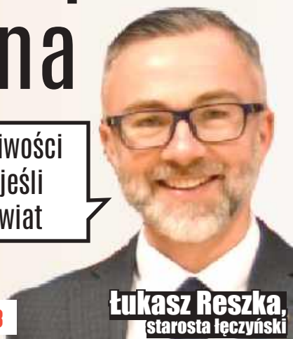
Łukasz Reszka, starosta łęczyński