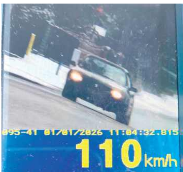
W tym przypadku pomiar wykonany ręcznym miernikiem prędkości nie pozostawiał wątpliwości – kierowca przekroczył dozwoloną prędkość o 60 km/h

Podczas codziennych służb opolscy policjanci systematycznie kontrolują prędkość pojazdów poruszających się po drogach powiatu. W tym przypadku