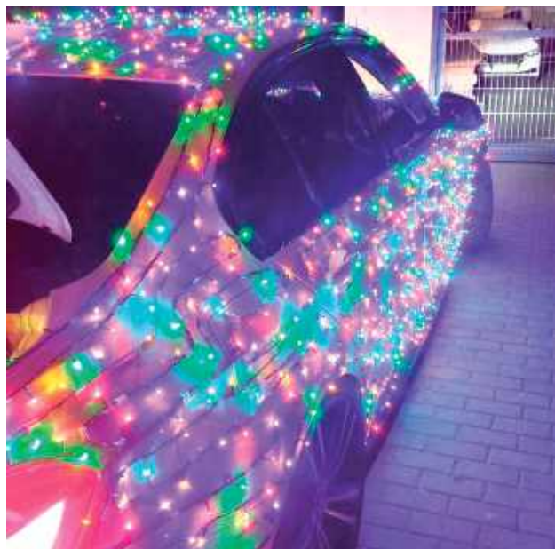
W dalszym ciągu na ulicach miasta pojawiają się kierowcy z niedozwolonymi przeróbkami

Wzmoczone kontrole prowadzone były w Wigilię. W swoich działaniach policjanci z Wydziału Ruchu Drogowego Komendy Miejskiej Policji w Lublinie skupili się przede wszystkim na osobach rażąco naruszających zasady bezpieczeństwa. Prowadzone były kontrole prędkości, sprawdzana