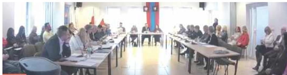
Budżetowa sesja w powiecie łęczyńskim: budżet przyjęto, ale sednem sesji były nie liczby, tylko kierunek: cięcia kosztów stałych, reorganizacja Starostwa i przebudowa sieci szkół

podkreślał, że około 65 proc. wydatków bieżących stanowią wynagrodzenia i pochodne, a od stycznia rośnie płaca minimalna, co automatycznie podbija koszty. Jednocześnie zapowiedział działania mające ograniczać wydatki, wskazując wprost na łączenie szkół oraz restrukturyzację funkcjonowania starostwa i oświaty.