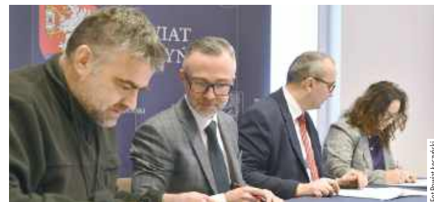
Zakres przedsięwzięcia jest szeroki i obejmuje nie tylko roboty przy samej jezdni, ale również prace formalne i techniczne

Początek roku przyniósł informację, że samorząd Powiatu Łęczyńskiego podpisał umowę na realizację zadania „Przebudowa drogi powiatowej nr 1809L w miejscowości Ostrówek, Szpica, Zawadów”. Prace mają objąć zarówno przygotowanie dokumentacji, jak i właściwe roboty budowlane.