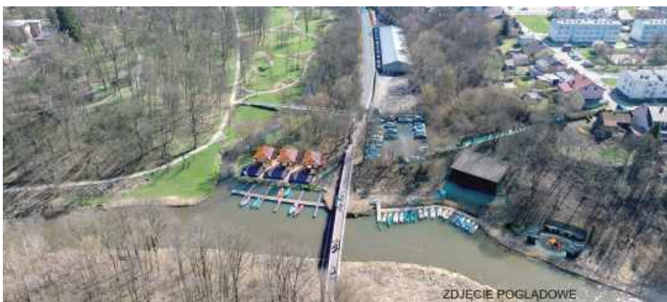
Po zakończeniu prac tak ma wyglądać okolica Parku Podzamcze i ujścia rzeki Świnka do rzeki Wieprz

W Łęcznej trwa realizacja projektu, który ma połączyć nadrzeczne tereny rekreacyjne z obszarami przyrodniczymi i poprawić dostęp do przestrzeni spacerowych. Po 2025 roku widać już wyraźne postępy na placach budowy: zakończono część prac przygotowawczych przy kładkach, rozpoczęto kolejne etapy robót, a równolegle prowadzone są działania na terenach torfowych.