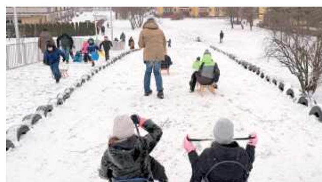
Z górki chętnie korzystają najmłodszy, a zimowa zabawa trwa od rana do popołudnia

Po modernizacji górka została poszerzona i lepiej wyprofilowana, co ułatwia korzystanie ze stoku nawet wtedy, gdy ruch jest duży. Zadbano też o oświet-