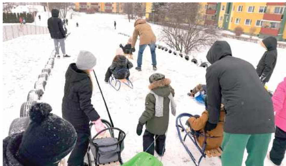
Z górki chętnie korzystają najmłodszy, a zimowa zabawa trwa od rana do popołudnia

Po kilku dniach opadów śniegu odnowiona górka saneczkowa na osiedlu Samsonowicza w Łęcznej zapełniła się dziećmi i rodzinami. To właśnie na taką pogodę czekali po zakończonej modernizacji - teraz, gdy stok wreszcie pokryła biała warstwa, widać, że inwestycja była trafiona.