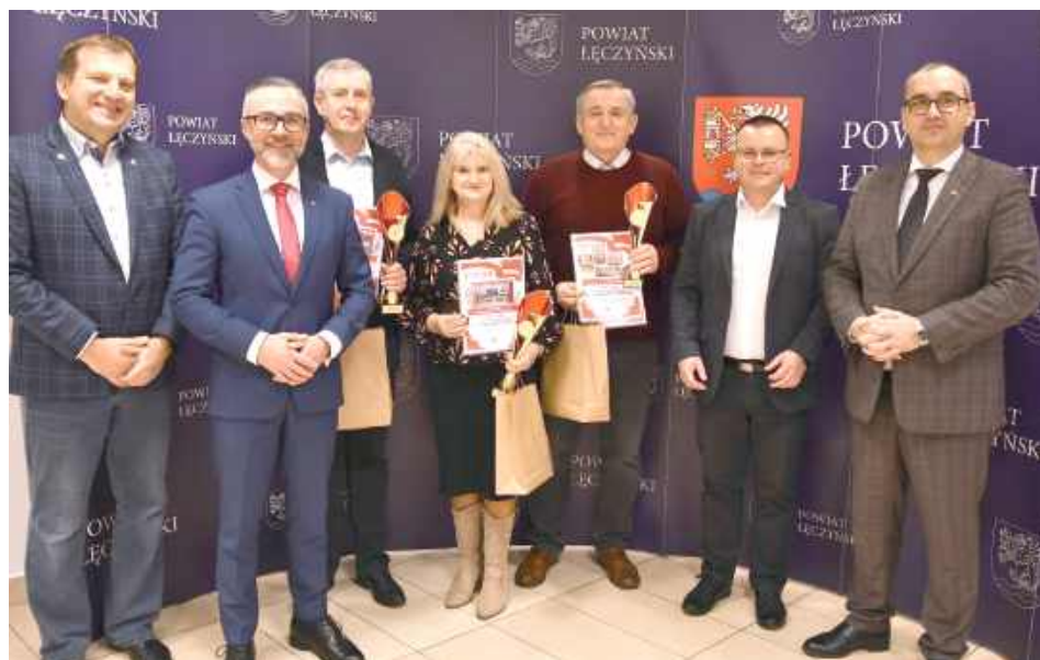
Organizatorzy i dyrektorzy zwyciężskich szkół

W Starostwie Powiatowym w Łęcznej wręczono nagrody laureatom XII Patriotycznego Konkursu „Biel i Czerwień - Barwy Niepodległości”, którego celem było kształtowanie postaw patriotycznych oraz podkreślanie znaczenia symboli narodowych wśród dzieci i młodzieży.