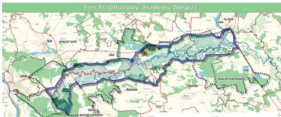
Tak miałyby przebiegać granice nowego Parku Krajobrazowego Pradolina Wieprza

Zespół Lubelskich Parków Krajobrazowych chce na terenie trzech powiatów - puławskiego, ryckiego i lubartowskiego utworzyć nowy park krajobrazowy - Pradolina Wieprza. Przyrodnicy przekonują, że przyciągnąłby do regionu turystów m.in. z okolic, Lublina czy Warszawy.