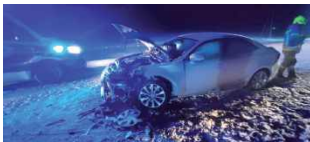
Do zderzenia doszło w sylwestrowy wieczór

Jak informuje OSP KSRG Jeziorzany, do zdarzenia doszło 31 grudnia około godz. 21.48 w Anielówce. Na miejscu zdarzenia w akcji uczestniczyły zastępy OSP KSRG Jeziorzany, OSP KSRG Michów,