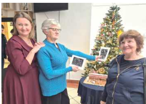
Wspólne śpiewanie, rozmowy i podsumowanie wielu miesięcy działań - tak w GOK w Milejowie zakończył się międzypokoleniowy projekt realizowany w ramach programu Aktywni+

Spotkanie miało charakter podsumowujący, ale nie zabrakło elementów integracyjnych - wspólnego śpiewania, rozmów przy kawie oraz dzielenia się wspomnieniami z realizowanych działań. Gościnnie w wy-