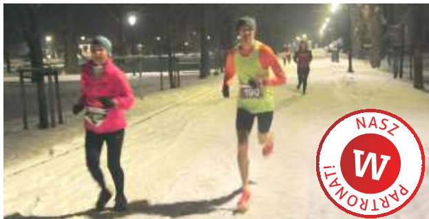
Trasa biegu prowadziła uczestników malowniczymi alejkami Parku Zdrojowego i ulicami Nałęczowa

Na starcie stanęło 150 uczestników (55 kobiet i 95 mężczyzn), którzy rywalizowali na dystansach biegowych, w Nordic Walking oraz w niezwykle barwnym biegu przebierańców. Tradycja