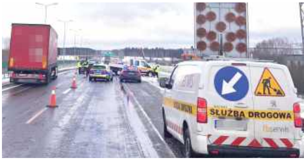
Tego dnia na ekspresowce w miejscu kolizji na drodze było ślisko. Po zdarzeniu policja zaapelowała o skierowanie tam dodatkowych piaskarek

Pracownicy służby drogowej zostali przewiezieni do szpitala. Przez dłuższy czas przez policyjne czynności wykonywane na miej-