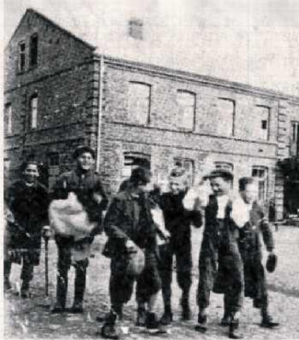
Żydowski chłopcy na tle budynku betha midraszu

Rynek jest duży, otoczony ze wszystkich stron sklepikami, z których Żydzi cały tydzień