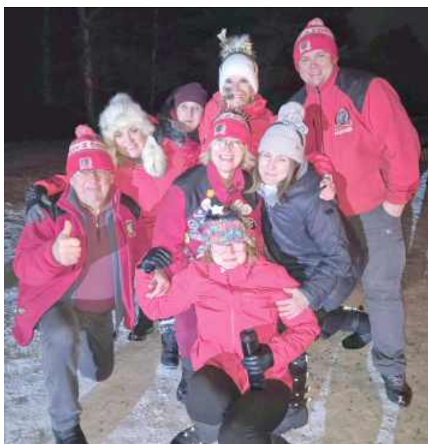
Nowy Rok zaczęli od zimnej wody i to celowo

W krótkim podsumowaniu opublikowanym w mediach społecznościowych grupa przypominała, że jeszcze dzień wcześniej była obecna na okolicznych imprezach sylwestrowych, a już następnego dnia - stęskniona za zimową kąpielą - przywitała Nowy Rok kolejnym morsowaniem. Morsowanie od kilku lat przyciąga coraz więcej osób także w naszej okolicy. Z jednej strony jest to forma aktywności fizycznej i sprawdzianu charakteru, z drugiej - sposób na integrację i wspólne spędzanie czasu poza