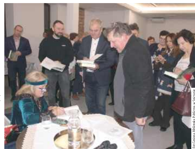
Publikacja dostępna jest do wypożyczenia w Gminnej Bibliotece Publicznej w Spiczynie oraz w jej filiach w Jawidzu i Zawieprzycach

wskich, postacią Atanazego Miączyńskiego, tragicznym pożarem zamku w 1838 roku, a także codziennym życiem