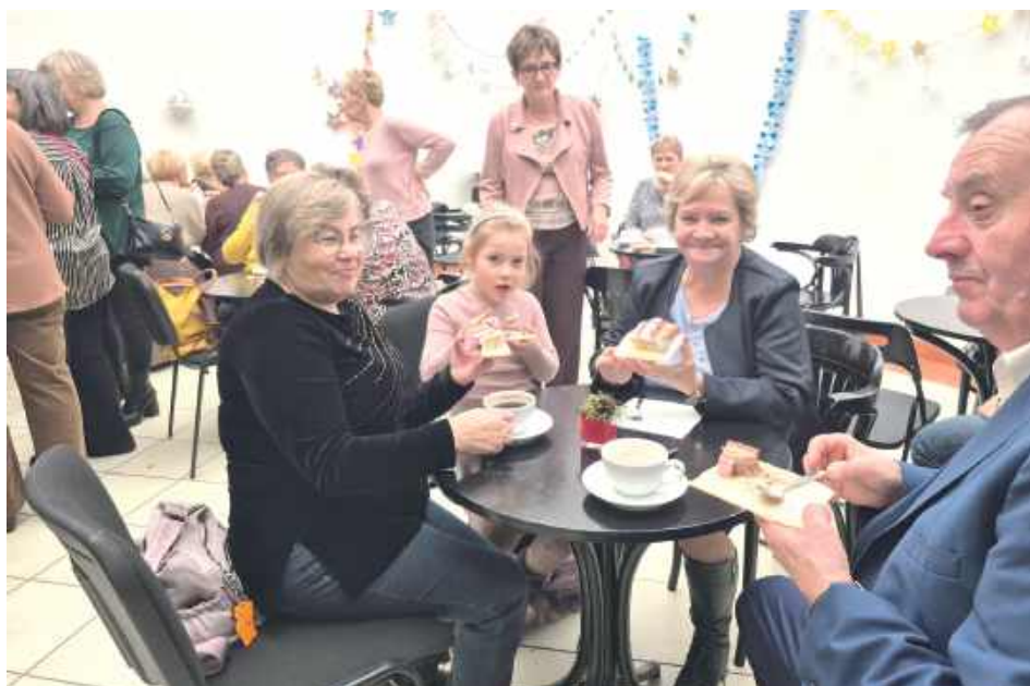
Wspólne śpiewanie, rozmowy i podsumowanie wielu miesięcy działań - tak w GOK w Milejowie zakończył się międzypokoleniowy projekt realizowany w ramach programu Aktywni+

W sobotę, 20 grudnia, w Gminnym Ośrodku Kultury w Milejowie odbyło się finałowe spotkanie integracyjno-edukacyjne kończące projekt „Jak nie MY to Kto?”. W wydarzeniu udział wzięli seniorzy 60+, młodszy uczestnicy, wolontariusze oraz partnerzy projektu.