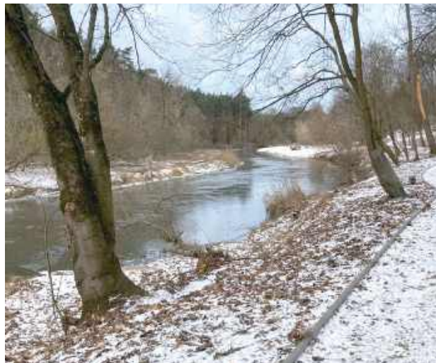
Tereny nadrzeczne nad Wieprzem staną się dostępne dla odwiedzających Park

W rejonie Środowiskowego Domu Samopomocy (ŚDS) uporządkowano tereny nadrzeczne, rozebrano stare, niebezpieczne schody i wykonano nowe zejścia