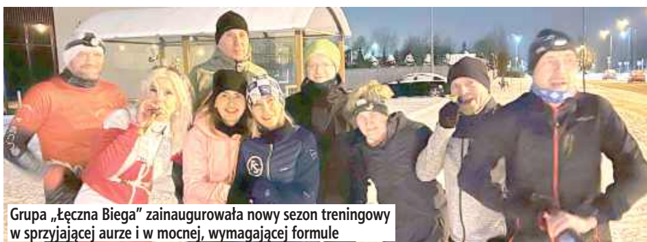
Grupa „Łączna Biega” zainaugurowała nowy sezon treningowy w sprzyjającej aurze i w mocnej, wymagającej formule

wspólnych treningów, które mają mieć nie tylko biegowy, ale i bardziej „dziki” charakter