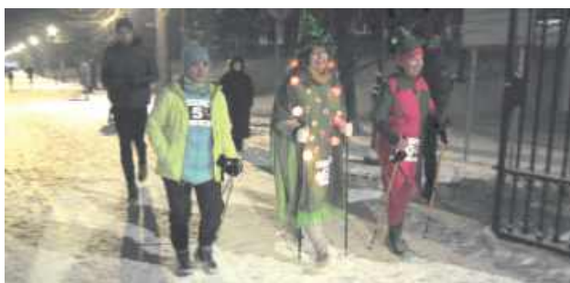
Na starcie stanęło 150 uczestników (55 kobiet i 95 mężczyzn), którzy rywalizowali na dystansach biegowych, w Nordic Walking oraz w niezwykle barwnym biegu przebierańców

cja nawiązuje do najstarszego biegu sylwestrowego świata, zapoczątkowanego w 1924 roku w São Paulo, a Nałęczów jest dziś jednym z nielicznych