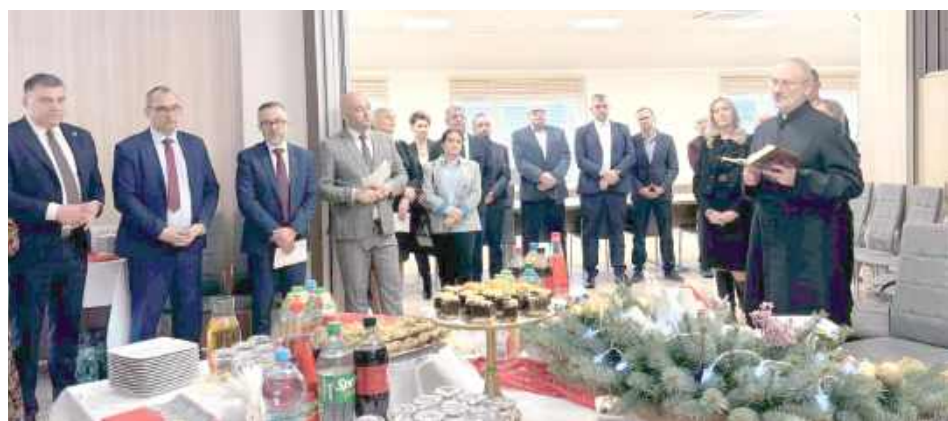
Opłatek w Gminie Ludwin

Wspólne rozmowy, podziękowania i świąteczna atmosfera towarzyszyły spotkaniu opłatkowemu, które odbyło się po zakończeniu sesji Rady Gminy Ludwin. Wydarzenie zgromadziło przedstawicieli samorządu, sołtysów, lokal-