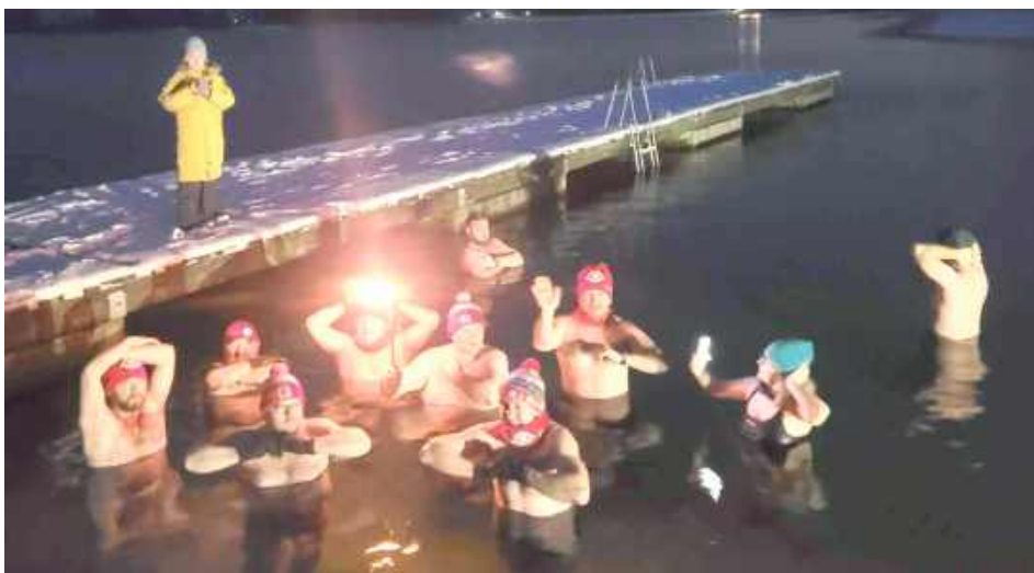
Nowy Rok zaczęli od zimnej wody i to celowo

Jedni zaczynają nowy rok spokojnym spacerem, inni - gorącą herbatą i postanowieniami na kolejne miesiące. Łęczyńska ekipa „Morsy z Corsy” tradycyjnie wybrała wariant dla odważnych: zimną wodę, dobrą energię i wspólne wejście w 2026 rok w morsowym stylu.