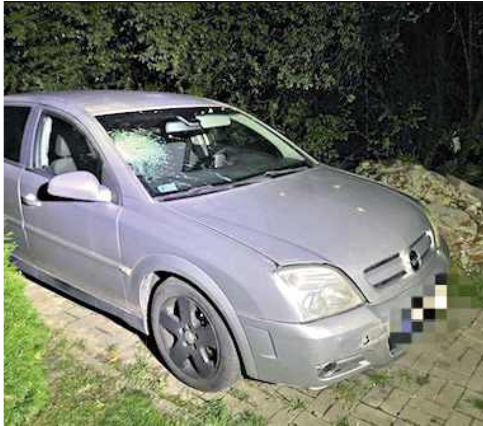
Samochód został odnaleziony w Lublinie 1 października. Miał uszkodzenia typowe dla potrącenia pieszego - pęknięcie przedniej szyby, które powstało po uderzeniu w nią głową przez pokrzywdzonego

Kierowca Opla nie przyznał się do zarzutów. Potwierdził, że jechał z Michowa do Lublina przez Abramów, odwoził do domu członków rodziny, których odebrał z imprezy, w której sam nie brał udziału. Nie spożywał alkoholu. Nie zrozumiał sygnałów, które dawał światłami świadek. Jechał z prędkością 50 km/h. Poczł uderzenie, ale myślał, że potrącił jakieś małe zwierzę.