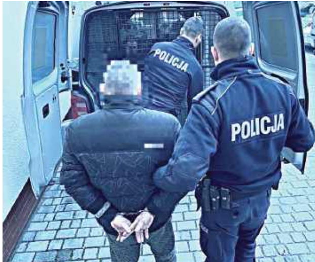
Policjanci zostali wezwani do awantury domowej, podczas której agresywny mężczyzna miał grozić swoim najbliższymi

- Na miejscu funkcjonariusze zastali 46-latkę, który - jak ustalili mundurowi - bez wyraźnego