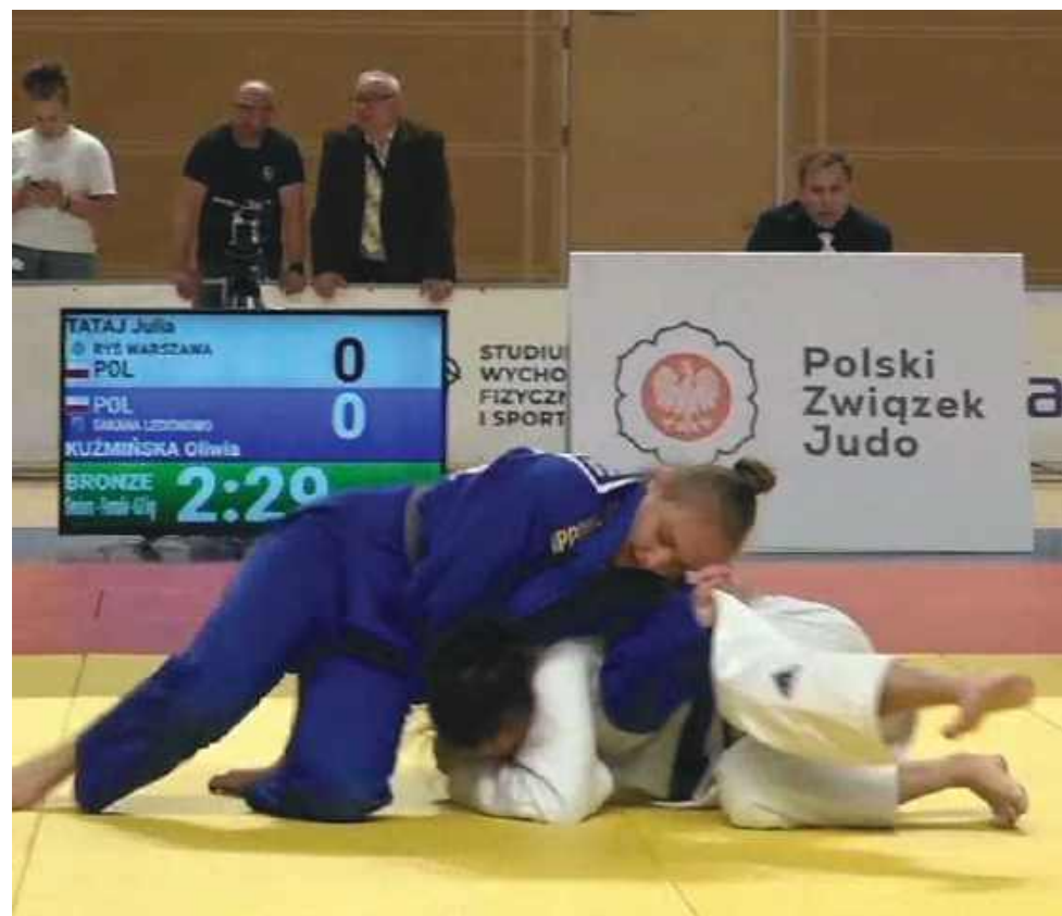
Duszenie w walce o 3 miejsce