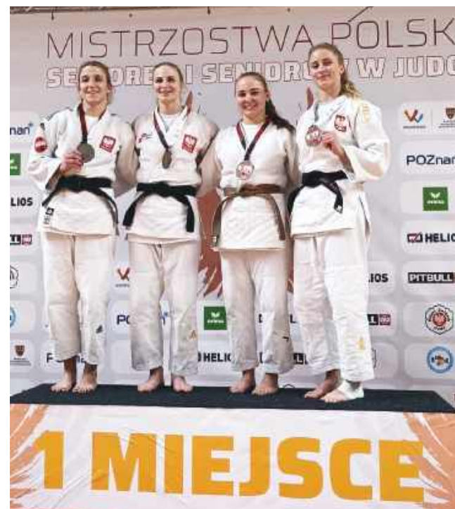
Medalistki kat. - 63kg Mistrzostw Polski 2025

Po raz pierwszy w historii mamy w Legionowie medalistkę