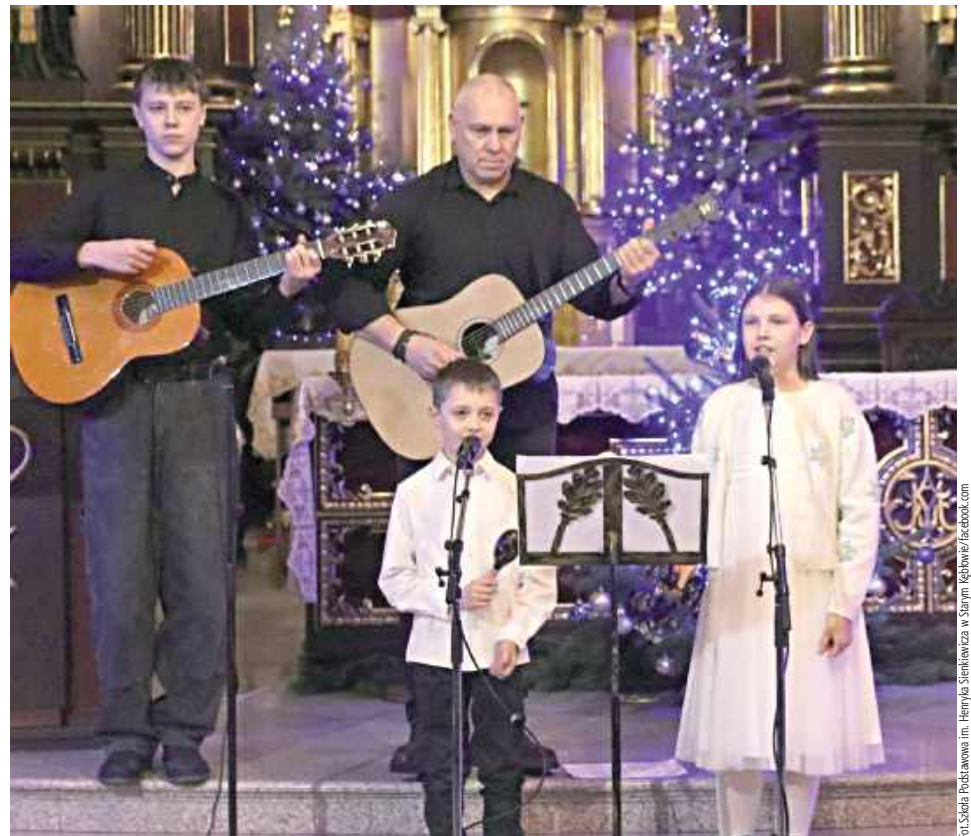
Każdy występ był wyjątkowy i nagradzany gromkimi brawami