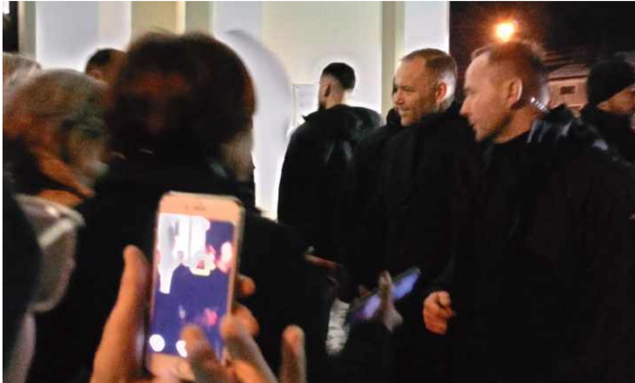
Prezydent zrobił niemałą niespodziankę parafianom z Łaskarzewa

Jak poinformował serwis podlasie.24.pl, prezydent RP Karol Nawrocki połączył pobyt w willi „Promnik” w Rudzie Tarnowskiej z uczestnictwem w niedzielnej, wieczornej mszy świętej w kościele Podwyższenia Krzyża Świętego. Jego obecność wpisuje się w wieloletnią tradycję weekendowych wizyt prezydentów RP w okolicznych miejscowościach, podczas pobytu w rezydencji „Promnik” położonej w Rudzie Tarnowskiej