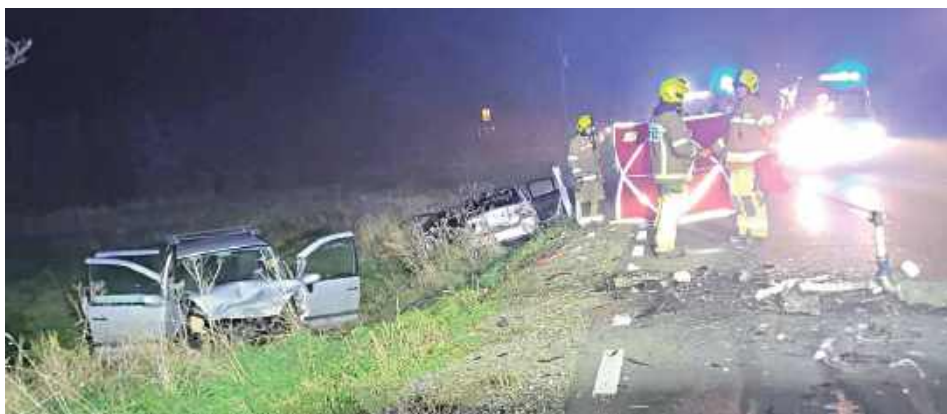
Do tragicznego w skutkach wypadku doszło na drodze krajowej nr 76 w Łopaciance (gm. Borowie). Nie żyje 72-letni mieszkaniec powiatu łukowskiego

Do tragicznego wypadku doszło 7 listopada około godziny 17.30 na odcinku drogi krajowej 76 w miejscowości Łopacianka w powiecie garwolińskim. Z dotychczasowych ustaleń śledczych wynika, że prowadzący pojazd marki BMW 31-letni