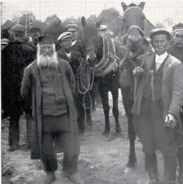
Jeden z wielu obrazków rodzajowych charakteryzujących nasze prowincjonalne miasteczka. Jarmark w Żelechowie w latach 30. XX wieku („Przeгляд Krajoznawczy”, nr 7-9, 1933)

sprawa przedstawia, zechce czytelnik zwrócić uwagę na załączone zdjęcie z ulicy, przypominającej małe Al. Ujazdowskie”.