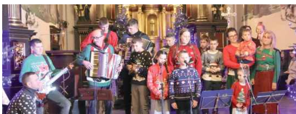
Publiczność mogła usłyszeć zarówno znane i lubiane kolędy