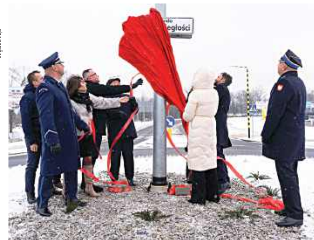
Rada Miasta Garwolina podczas ostatniej sesji podjęła uchwałę nadającą nazwę Rondzie Niepodległości

Ponad 500 tys. zł wydano na doposażenie OSP Garwolin, OSP Leszczyny i OSP Zawady oraz szkolenia strażaków. Zakupiono m.in. agregaty prądotwórcze, specjalistyczny sprzęt ratowniczy, radiotelefony, kamery termowizyjne i defibrylator AED. Dodatkowo, w ramach programu Ochrony Ludności i Obrony Cywilnej, blisko 700 tys. zł przeznaczono na magazyny sprzętu, szkolenia – także dla 750 uczniów