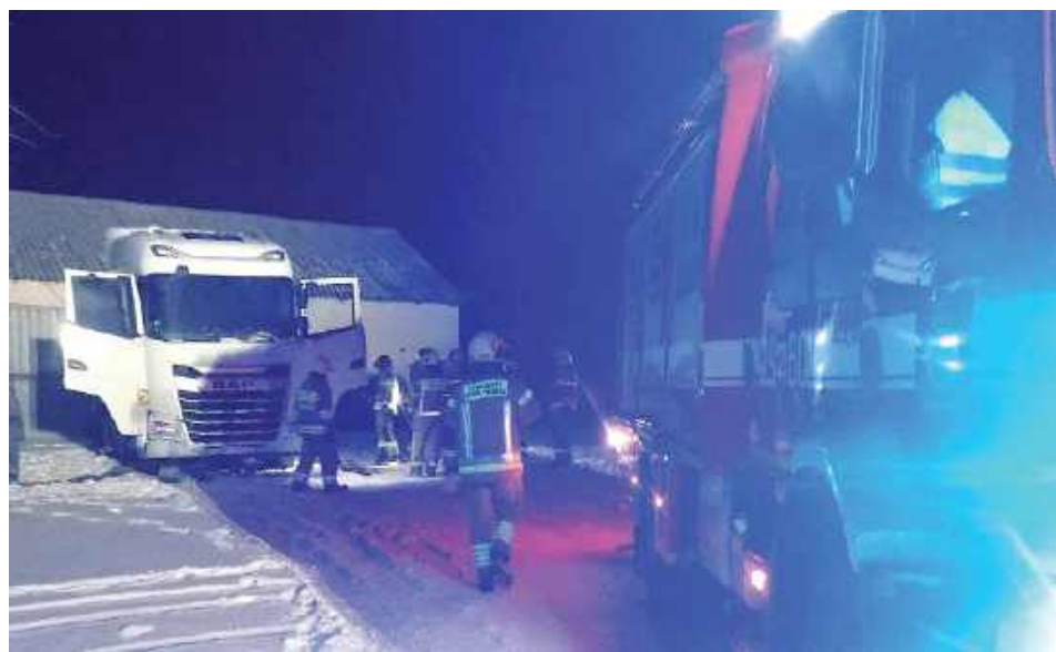
Działania straży pożarnej polegały na zabezpieczeniu, oświetleniu miejsca zdarzenia oraz odłączeniu dopływu prądu

W poniedziałek, 5 stycznia w miejscowości Gościewicz (gm. Borowie), na jednej z posesji zapaliło się auto ciężarowe. Mieszkańcy sami zdołali ugasić pożar.