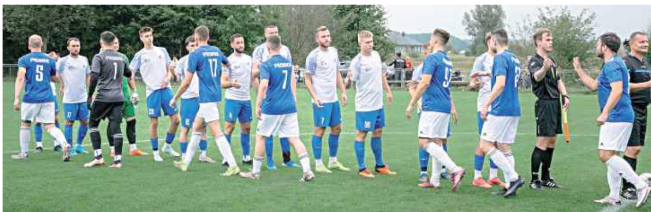
Derbowi rywale odśladali karty. Poznaliśmy plany zimowe Orła Parysów i Promnika Łaskarzew

Derbowi rywale odśladali karty zimowych przygotowań. Zarówno Orzeł Parysów, jak i Promnik Łaskarzew podali, z kim zagrają w przerwie zimowej. Walczący o awans Orzeł na początek zagra z dwoma ekipami z siedleckiej klasy okręgowej. Przygotowania otworzą z Naprzodem Skórzec, a następnie zmierzą się z Zrywem Sobolew. Zmierzą się także z rezerwami MKS-u Piaseczno czy Hutnika Warszawa, czyli drugimi zespołami czwartoligowców, by przygotowania zakończyć