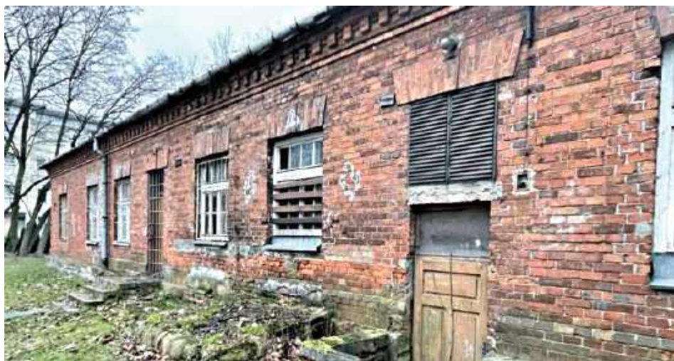
I etap rewitalizacji koszarowego budynku, znanego jako „Stara pralnia”. Najkorzystniejszą ofertę złożyła firma Usługi Budowlane Kacper Bogucki z Wilchty, która zajmie się realizacją prac

Koszt brutto zaplanowanych prac to 1 439 100 zł.