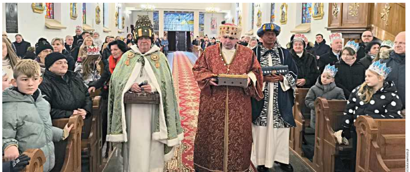
6 stycznia w Kościele Parafialnym w Łaskarzewie obchodzono uroczystość Objawienia Pańskiego