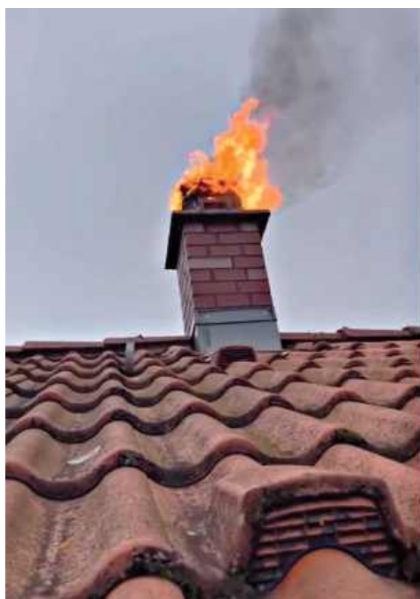
Od 1 października 2025 r. do 6 stycznia br. PSP odnotowała 4299 pożarów sadzy w przewodach kominowych

Problem ma charakter ogólnokrajowy. Od początku sezonu grzewczego, czyli od 1 października 2025 r. do 6 stycznia br.,