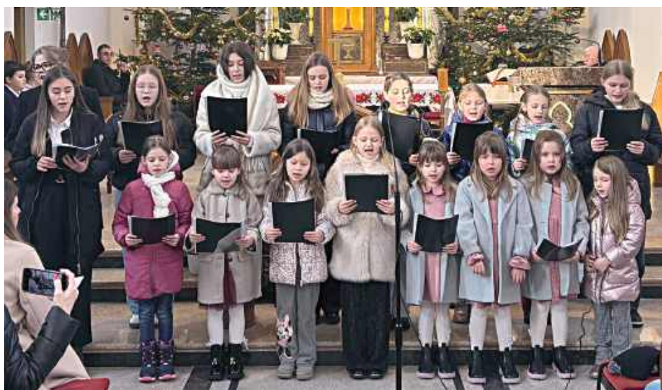
Schola zaprezentowała wspaniałe owoce odbywających się od kilku tygodni prób (Parafia pw. Świętej Jadwigi Śląskiej w Samogoszcy)

6 stycznia, w dzień Objawienia Pańskiego, zwanego Świętem Trzech Króli, w parafii pw. Świętej Jadwigi Śląskiej w Samogoszcy odbył się koncert kołęd i pastorałek.