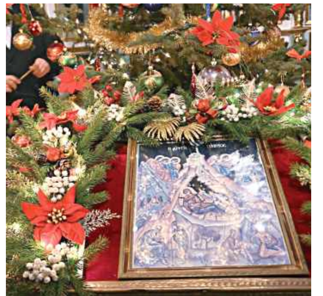
W cerkwi nie ma tradycji ustawiania Szopki, natomiast w tym czasie na środku świątyni wykładana jest ikona Święta Bożego Narodzenia. Podobnie jak inne prawidłowo napisane ikony ma ona głęboką symbolikę. Wśród górzystego krajobrazu (są to symboliczne Synaj, Tabor i... Golgota). Dzieciątko leży w czymś, co mniej przypomina słodki żłóbek, a bardziej grób, co jest symboliką przyszłych wydarzeń. Maryja zwrócona jest w stronę odbiorcy. Na grotę spływają niebiańskie promienienie