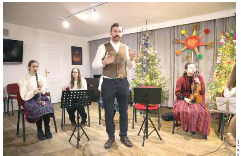
W Centrum Sportu i Kultury po raz trzeci zabrzmiało Mazowieckie Kolędowanie

tej kolędzie kto dziś będzie”, „Jam jest dudka” czy „Stoi nam tu lipeczka”. Dzięki przypomnieniu takich starszych, mniej znanych pieśni kultywowana jest rodzima tradycja. Podczas koncertu, ku ucieście najmłodszej publiczności pomiędzy rzędami przechadzał się turoń – nieodzowna część kolędowania.