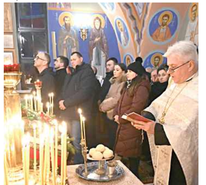
Jednym z elementów nabożeństwa jest poświęcenie pięciu chlebów, wina, oleju i ziarna