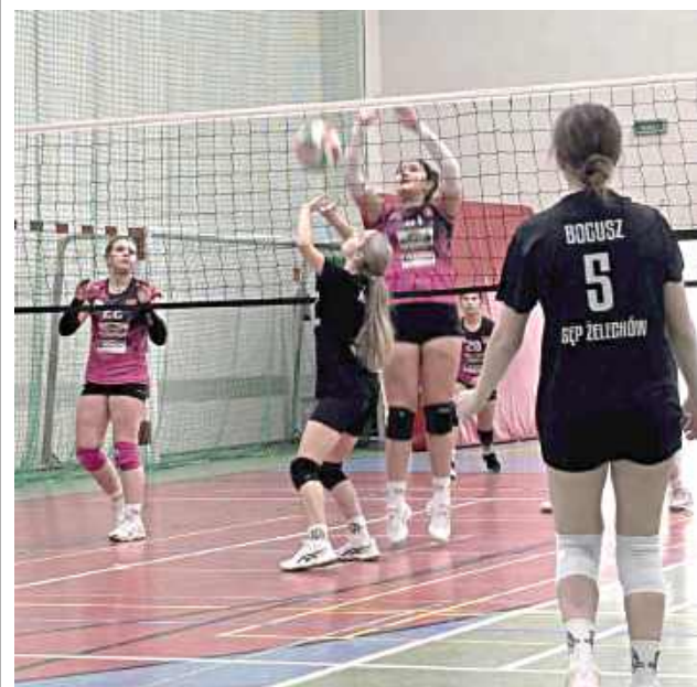
Nie brakowało świetnych akcji jak ta na zdjęciu. W pewnym momencie młodziczki Sępa przegrywały nawet 19:24, by triumfować bez straty seta

Bez straty seta, choć nie bez emocji zakończył się turniej dla młodziczek Sępa. To pozwoliło im awansować do V ligi.