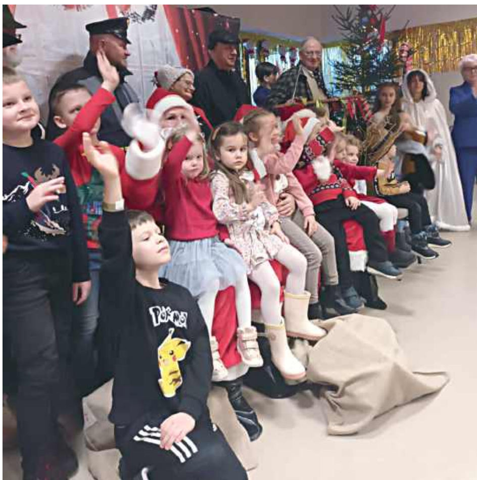
Takie wydarzenia doskonale pokazują, jak ważne są lokalna wspólnota i sąsiedzkie relacje

Ogromną radość najmłodszym sprawiła wizyta Świętego Mikołaja, który nie tylko obdarował dzieci prezentami, ale także rozbawił je zagadkami i wspólną zabawą. Całość dopełniło wspólne śpiewanie kolęd przy słodkim poczęstunku, przygotowanym we współpracy z Kołem Gospo-