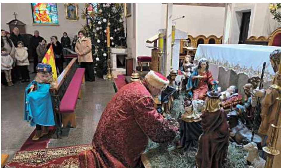
Trzej Mędrcy ze Wschodu przybyli, aby oddać hołd małemu Jezusowi