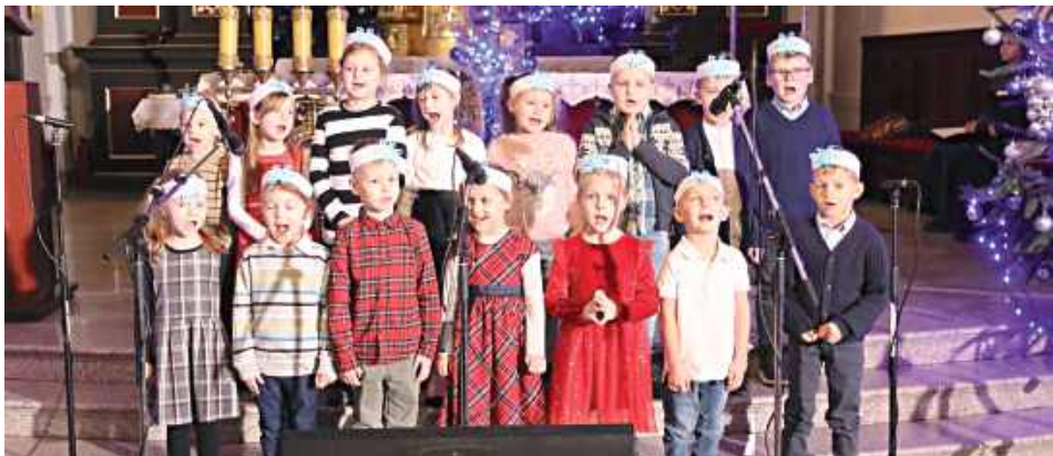
Za nami 19. Koncert Kolęd i Pastoralek – wyjątkowe spotkanie wypełnione muzyką, wzruszeniem i prawdziwie świąteczną atmosferą

Za nami 19. Koncert Kolęd i Pastoralek – wyjątkowe spotkanie wypełnione muzyką, wzruszeniem i prawdziwie świąteczną atmosferą.