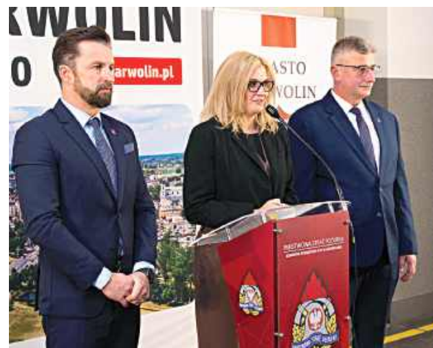
Ponad 500 tys. zł wydano na doposażenie OSP Garwolin, OSP Leszczyny i OSP Zawady oraz szkolenia strażaków

z garwolińskich szkół – oraz doposażenie miasta w niezbędny sprzęt na wypadek sytuacji kryzysowych – między innymi: pięć agregatów prądotwórczych, radiotelefony, megafony, kamizelki kuloodporne, namiot pneumatyczny, stację uzdatniania wody oraz 50 000 worków na piasek.