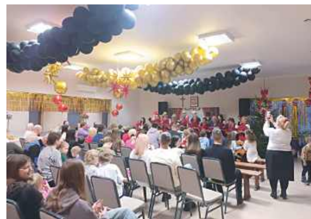
Całość dopełniło wspólne śpiewanie kolęd przy słodkim poczęstunku, przygotowanym we współpracy z Kołem Gospo- dyń i Gospodarzy Wiejskich z Woli Rębkowskiej