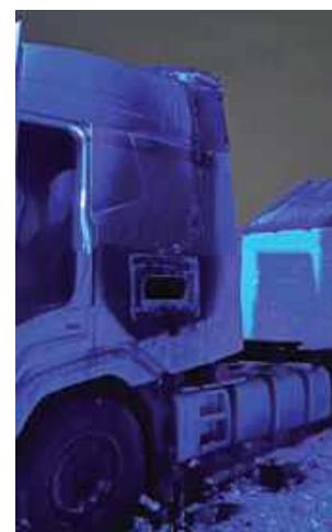
Przed godz. 24 do Stanowiska Kierowania KP PSP w Garwolinie wpłynęło zgłoszenie o pożarze ciągnika siodłowego znajdującego się na posesji w miejscowości Gościewicz

Działania straży pożarnej polegały na zabezpieczeniu, oświetle-