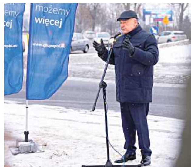
W wydarzeniu wziął udział marszałek województwa mazowieckiego Adam Struzik

9 stycznia odbyło się wydarzenie pn. „Inwestycje, które łączą” będące okazją do zaprezentowania miejskich inwestycji zrealizowanych w 2025 roku