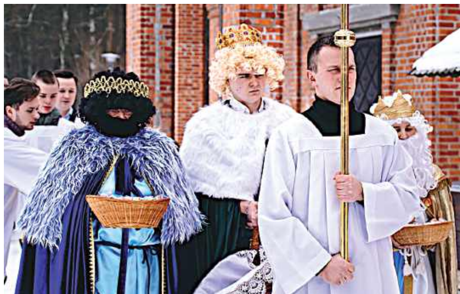
Jak zwykle 6 stycznia do Sanktuarium przybyli Trzej Królowie. Wprawdzie bez wielbłądów, ale z dużymi koszami kadzidła, kredy i złota (miedzianymi grosikami)

6 stycznia, w dzień Objawienia Pańskiego, potocznie zwanym Świętem Trzech Króli, do Sanktuarium Matki Bożej Fatimskiej w Górkach przybyli Trzej Mędrcy ze Wschodu.