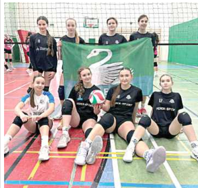
Młodziczki Sępa z awansem. Wszystko dzięki świetnemu turniejowi i kompletowi zwycięstw bez straty seta