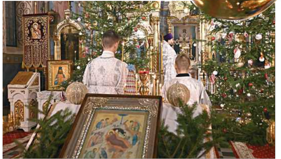
Nabożeństwo, mimo że długie, wcale nie nudzi. Bogactwo obrzędów, gestów liturgicznych, symboli, nadzwyczajna uroda dodatkowo ozdobionej świątyni, piękno śpiewów (chóry szykują się już dużo wcześniej), zapach płonących świec i kadzidła pozwalają zanurzyć się w wielkich tajemnicach i radości z Bożego Narodzenia

Jedną z radości mieszkania na Lubelszczyźnie jest możliwość obchodzenia Bożego Narodzenia dwa razy. Trzynastcie dni po katolikach choinki w domach i świątyniach ubrali prawosławni. Zasiadli do kolacji wigilijnej, złożyli życzenia, kolędy śpiewano w kilku językach. W nocy odprawiono długie, trwające nawet ponad cztery godziny nabożeństwa.