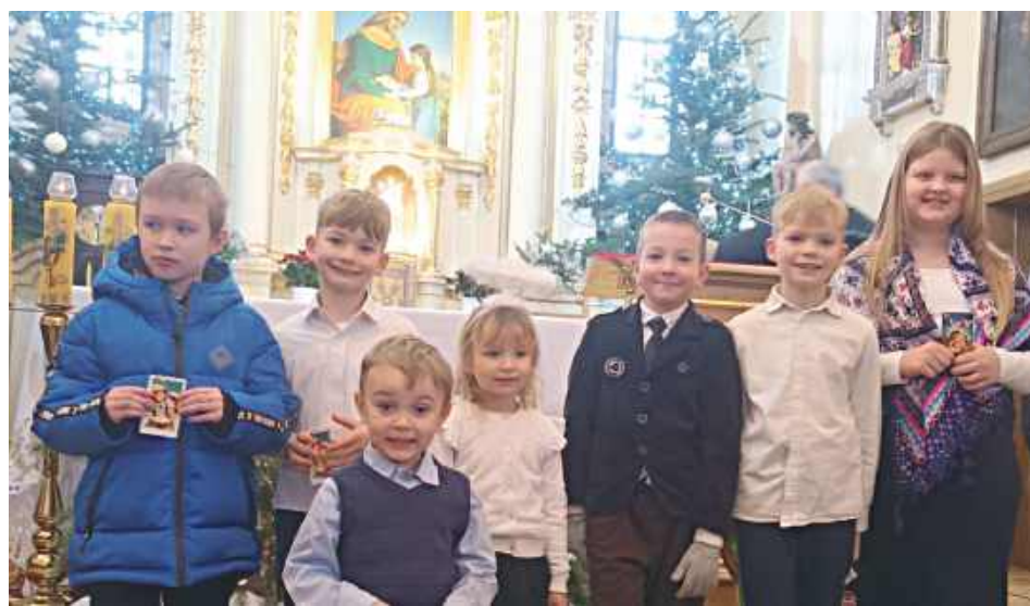
Tradycyjnie święto Trzech Króli w parafii Świętej Anny w Zwoli Poduchownej było czasem wspólnego kołędowania (Parafia pw. Świętej Anny w Zwoli Poduchownej)

6 stycznia, w Dzień Objawienia Pańskiego, w tradycji ludowej zwanym Świętem Trzech Króli, w parafii pw. Świętej Anny w Zwoli Poduchownej odbył się koncert kołęd i pastorałek bożonarodzeniowych.