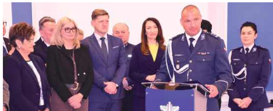
Szczególnym momentem była ceremonia pożegnania i przywitania ze sztandarem Komendy Powiatowej Policji w Garwolinie

Obejmujący obowiązki na stanowisku Komendanta Powiatowej Policji w Garwolinie mł. insp. Michał Sputo służbę w Policji rozpoczął w 2000 roku.