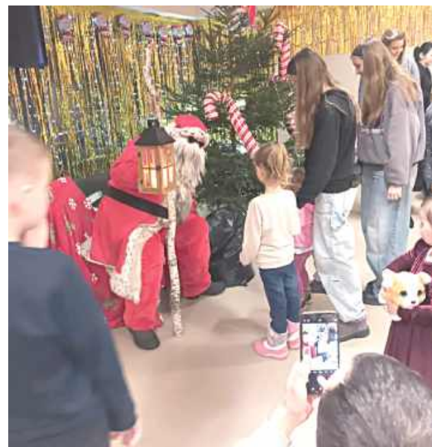
Ogromną radość najmłodszym sprawiła wizyta Świętego Mikołaja