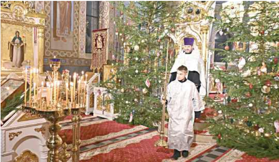
Cerkiew przybrana jest choinkami z bombkami. Nabożeństwo trwa kilka godzin, ponieważ jednym ciągiem odprawiane są wielka wieczerza (uroczysty niespór), jutrznia oraz Boska Liturgia będąca odpowiednikiem katolickiej Mszy Świętej