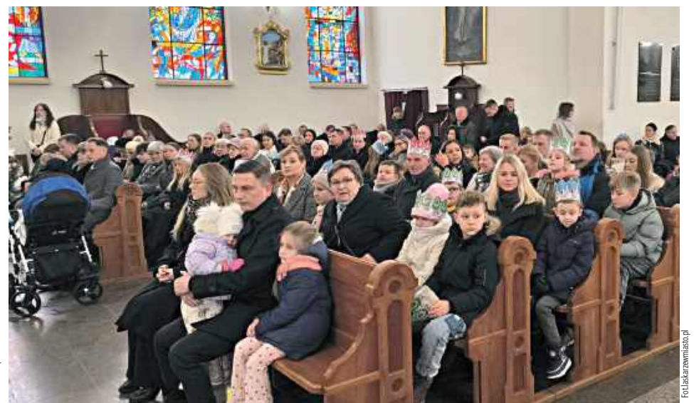
Uroczystość stanowiła ważny element wspólnego przeżywania tajemnicy Bożego Narodzenia