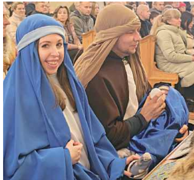
W Orszaku Trzech Króli nie mogło zabraknąć Świętej Rodziny z Dzieciątkiem (Parafia MB Kodeńskiej w Pilawie)

Święta Rodzina oraz Trzej Królowie, niosący symboliczne złoto, kadzidło i mirrę, wprowadzili obecnych w duchowy wymiar wydarzenia oraz atmosferę wspólnoty. W orszaku, jak co roku, udział