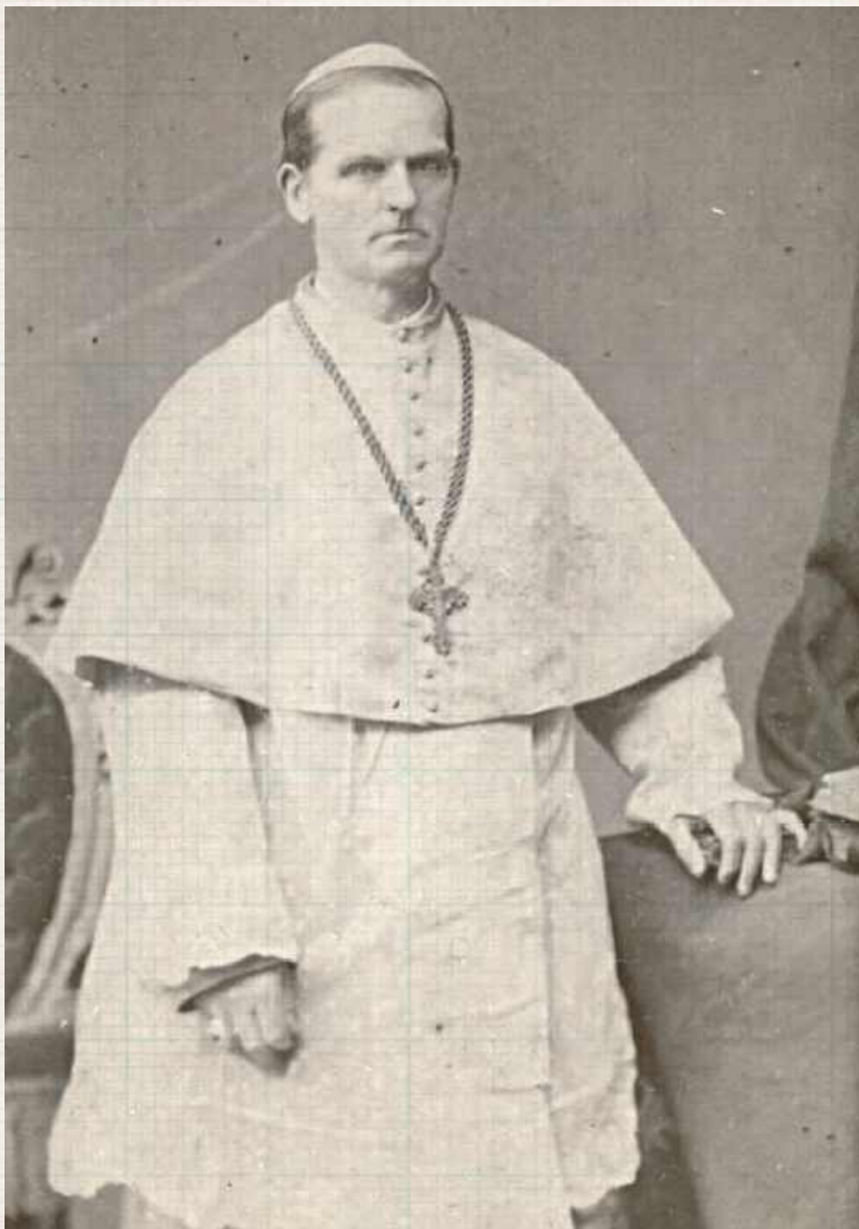
Kazimierz Józef Wnorowski był biskupem diecezjalnym lubelskim w latach 1883–1885. W listopadzie roku 1883 przybył z wizytacją do parafii Przemienienia Pańskiego w Garwolinie, odwiedzając także hutę szkła „Czechy” w pobliskich Trąbkach (Wikipedia)

Internowany w Wołogdzie oraz Wielkim Ustiugu, do kra-