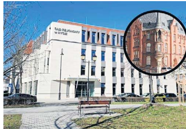
Wykonawca budynku 2 marca oficjalnie zakończył prace i przekazał obiekt inwestorowi.

Przeprowadzka dla pracowników sądu i petentów oznacza przeskokowanie stu lat, bo tyle liczy sobie obecna, ciasna siedziba sądu przy Pl. Katedralnym. Pomimo wynajmowania dodatkowych powierzchni biurowych personel sekretariatów pracuje po kilka osób w jednym pomieszczeniu, a sędziowie nawet po dwóch w jednym gabinecie.