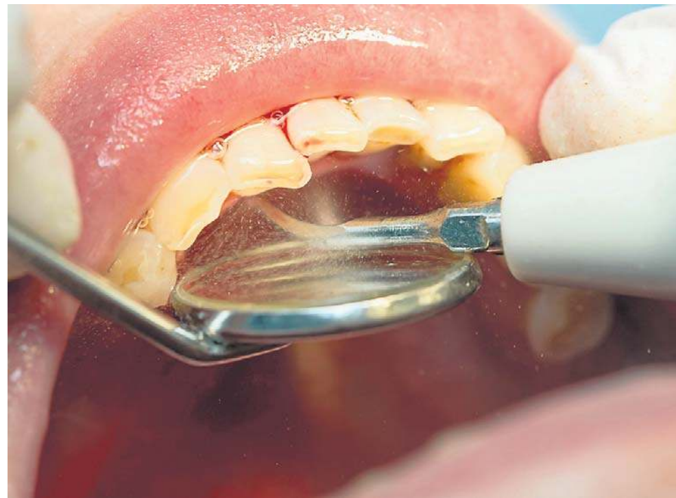
Za darmo na NFZ możesz wykonać raz w roku usunięcie kamienia nazębnego

Narodowy Fundusz Zdrowia refunduje skaling wraz z instruktażem higieny jamy ustnej raz w roku dla wszystkich osób objętych ubezpieczeniem społecznym. Natomiast piaskowanie nie jest refundowane i trzeba za nie zapłacić z własnej kieszeni.