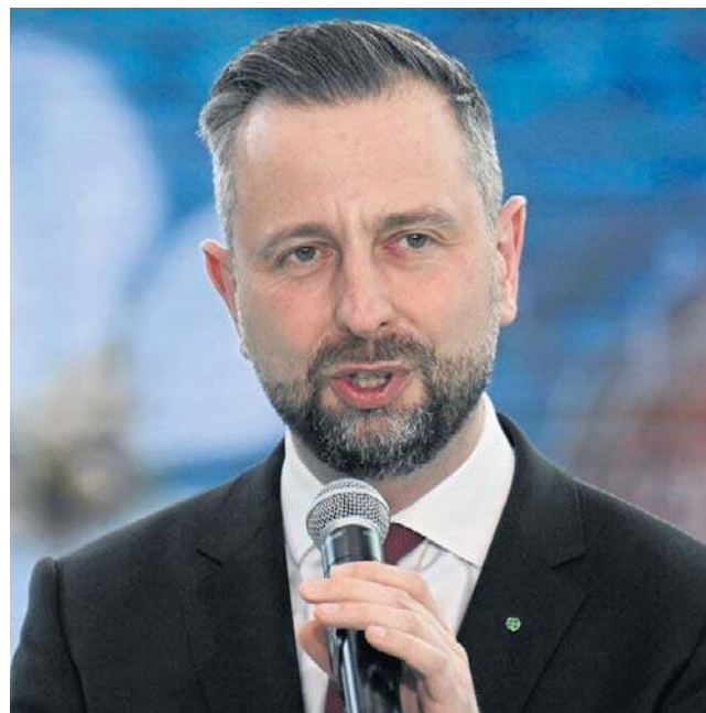
Władysław Kosiniak-Kamysz: Bezpieczeństwo Polski jest absolutnym priorytetem

W latach 2027-2029 do Polski trafić ma kolejnych 48 wyrzutni Patriot, czyli następne 6 baterii. Poza jednostką w Sochaczewie mają one wejść na wyposażenie dywizjonów obrony powietrznej w Bytomiu, Gdyni oraz Skwierzynie w woj. lubuskim