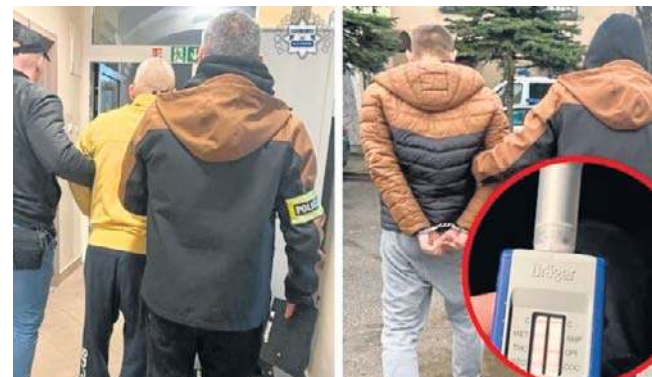
47-letni kierowca oraz jego 37-letni pasażer zostali zatrzymani. Obaj usłyszeli zarzuty posiadania narkotyków

Badanie narkotestem potwierdziło obecność narkotyków w organizmie. Podczas kontroli funkcjonariusze ujawnili w pojeździe substancje zabronione. Do wyjaśnienia sprawy został też zatrzymany 37-letni pasażer, również mieszkaniec powiatu kluczborskiego. Obaj mężczyźni usłyszeli zarzuty posiadania środków odurzających, za co grozi kara do 3 lat pozbawienia wolności. 47-latek działał w warunkach recydywy, co będzie miało wpływ na wymiar kary.