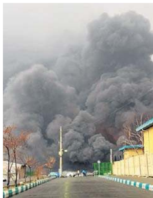
Kłęby dymu widać było z daleka

Według dziennika, który powołuje się na anonimowego amerykańskiego urzędnika, wojsko wykorzystало w nocy „dużą liczbę” ważących po około 900 kg bomb przeciwbunkrowych do zniszczenia arsenału. Prezydent USA Donald Trump zamieścił na platformie Truth Social trzydziestojednosekundowe nagranie, na którym widać potężne eksplozje. Osobno telewizja CNN potwierdziła