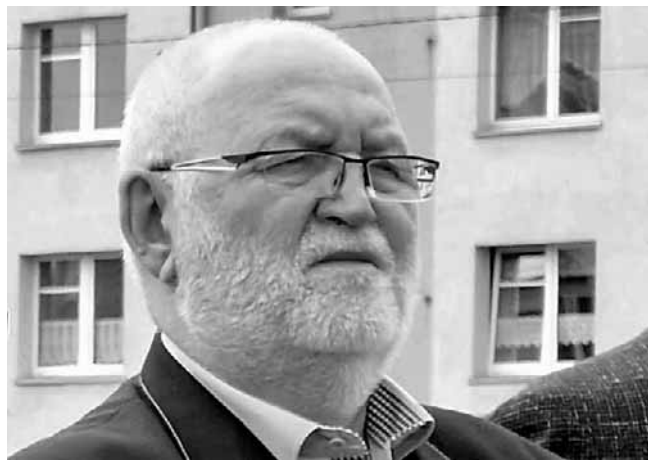
To cios tym większy, że samorządowiec wciąż miał przed sobą mnóstwo celów i planów na przyszłość.