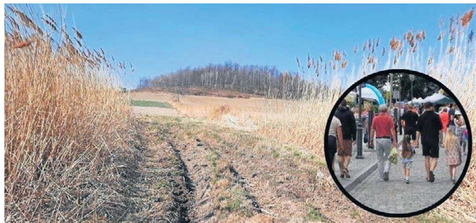
W sporach z sąsiadami chodzi zwykle o prace rolniczego sprzętu w godzinach nocnych, albo o zapach z hodowli.

Kontrowersyjna dla prawników zmiana ma dotyczyć sposobu sporządzania aktu notarialnego dla nabywania gruntów w terenach wiejskich. Resort rol-