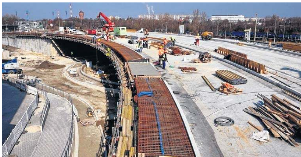
Inwestycja zakłada rozbudowę układu komunikacyjnego w rejonie CUP.

Przypomnijmy. Inwestycja zakłada rozbudowę układu komunikacyjnego w rejonie ulic Plebiscytowej, Bohaterów Monte Cassino, Kośnego i Pileckiego. Polegała między innymi na przebudowie ponad 400-metrowego odcinka drogi wojewódzkiej nr 435 w ciągu ulic Plebiscytowej i Bohaterów Monte Cassino, w ramach któ-