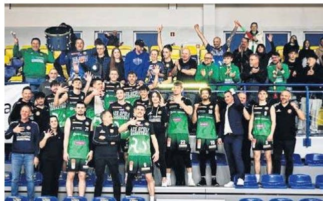
Tak koszykarze z Opola świętowali ze swoimi kibicami wywalczenie utrzymania w Bank Pekao 1 Lidze

Parę dni wcześniej Weegree AZS, plasujący się aktualnie na 13. miejscu w tabeli, zanotował z kolei sukces w innej, rozegranej awansem z 34. serii wyjazdowej konfrontacji z Novimex 1912 Polonią Leszno. Drużyna z Opola wygrała wtedy 89:75, przede wszystkim dzięki znakomitej postawie w czwartej kwarcie.