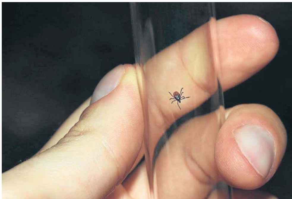
Biolog wyjaśnia, dlaczego warto zaprzyjaźnić się z czosnkiem, po jakie olejki eteryczne sięgnąć i co zamiast krótko przyciętego trawnika może naprawdę odstraszyć kleszcze

Wraz z ociepleniem klimatu sezon na kleszcze staje się coraz dłuższy, a zagrożenie