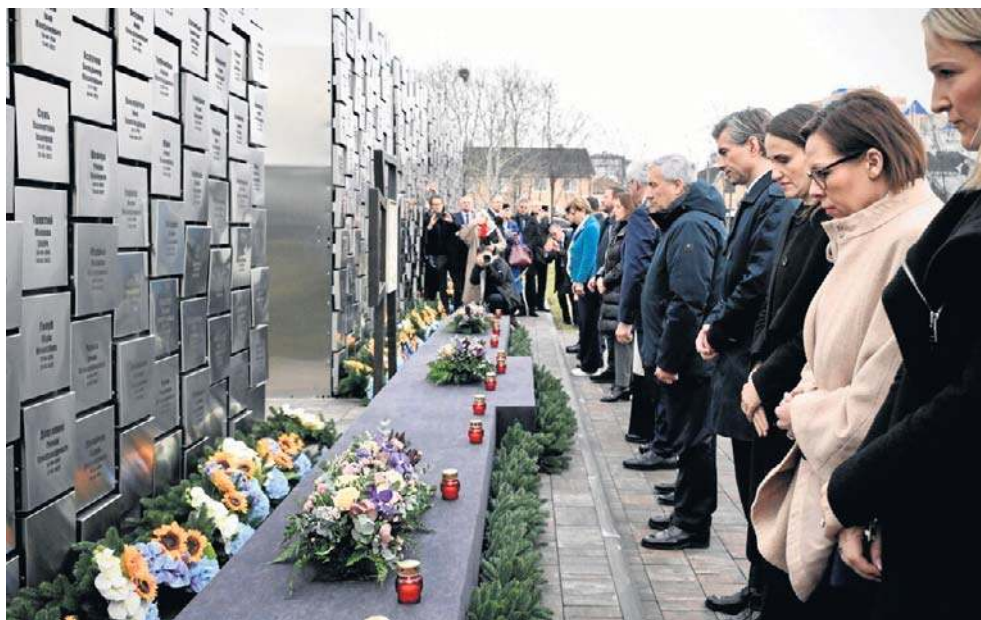
Ministrowie złożyli znicze pod pomnikiem ofiar zbrodni w Buczy i oddali hołd pamięci Ukraińców, brutalnie zamordowanych w tym miejscu cztery lata temu

„To scenariusz, który Rosja stosuje wszędzie tam, gdzie