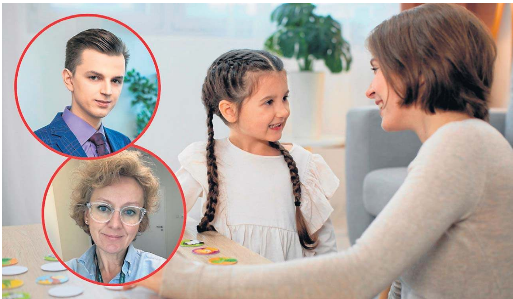
Eksperti podkreślają, że diagnoza autyzmu u kobiet bywa wyzwaniem

Jak podkreśla ekspert, zamiast wycofania dziewczynki mogą być nadmiernie grzeczne lub próbować zyskać akceptację,