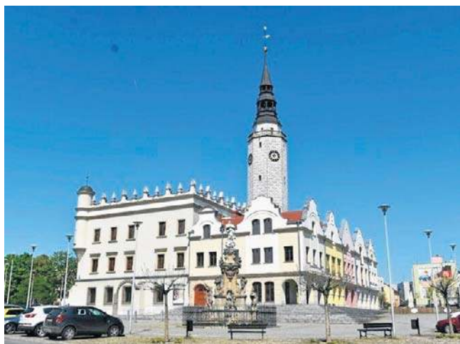
Teraz mieszkańcy Głubczyc mają czas na przygotowanie, jak najciekawszych propozycji projektów.

Czasu na dopracowanie koncepcji jest jeszcze sporo, bo nabór wniosków rozpocznie się