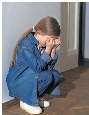
Dziewczynki mogą być nadmiernie grzeczne

- Rozpoznanie i zrozumienie własnych cech to nie tylko ulga, ale też szansa na życie w większej zgodzie ze sobą. Diagnoza nie zamyka, lecz otwiera na nowe możliwości, relacje i świadome dbanie o siebie - podsumowuje psychiatra Konrad Jurczakowski.