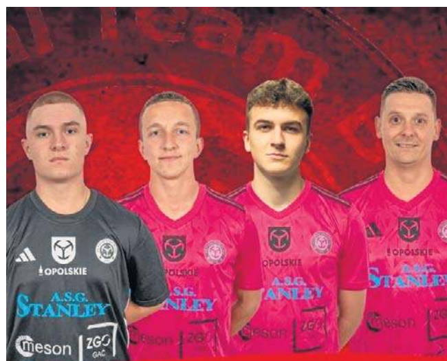
ASG Stanley Brzeg ciągle jest w grze o najwyższe cele w rozgrywkach grupy południowej 1 ligi futsalu