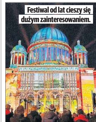
Festiwal od lat cieszy się dużym zainteresowaniem.

Kamienica ta należy do najbardziej oszpeconych budynków w centrum Łodzi, wkrótce ma rozpocząć się jej rewitalizacja. Najpierw jednak zajmą się nią twórcy współpracujący z Festiwalem Światła.