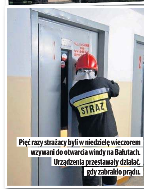
Pięć razy strażacy byli w niedzielę wieczorem wzywani do otwarcia windy na Bałutach. Urządzenia przestawały działać, gdy zabrakło prądu.