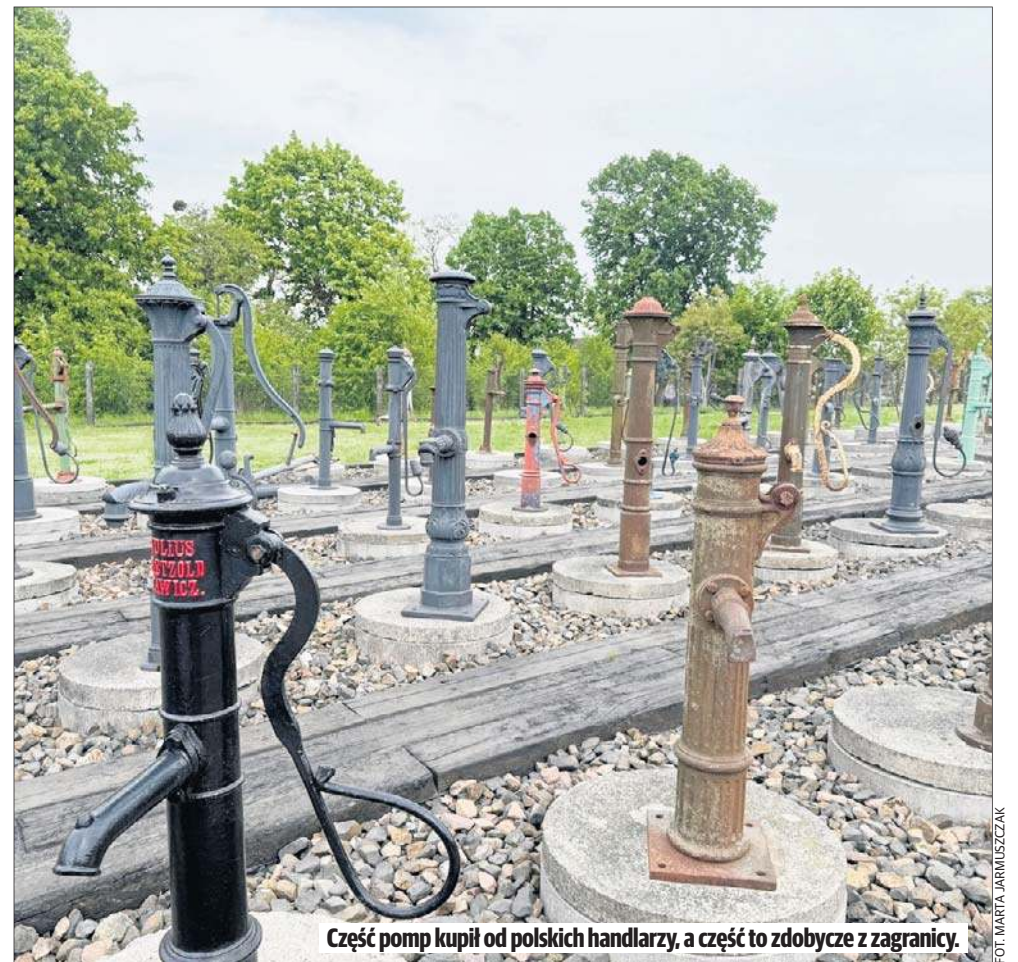
Część pomp kupił od polskich handlarzy, a część to zdobycze z zagranicy.