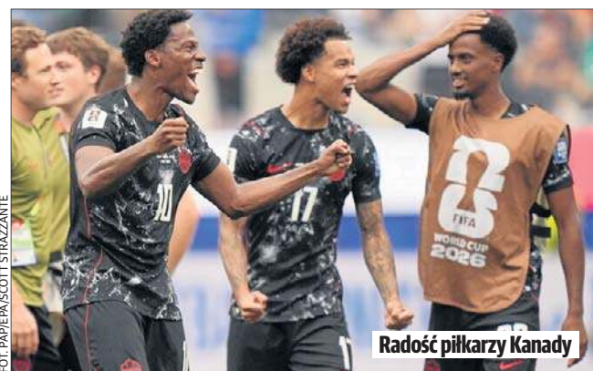
Radość piłkarzy Kanady

Piłkarska centrala zwróciła uwagę, że na boisku bezprecedensowy sukces odniosła Afryka, która do fazy pucharowej zakwalifikowała dziewięć zespołów, a odpadła jedynie Tunezja. Przypomniano, że to tej pory maksymalnie dwie ekipy z tego kontynentu dotarły do rozgrywek pucharowych, choćbyły one dwukrotnie mniej liczne (wcześniej 16 drużyn).