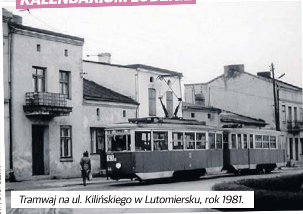
Tramwaj na ul. Kilińskiego w Lutomiersku, rok 1981.