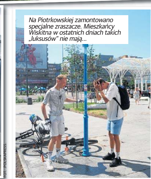
Na Piotrkowskiej zamontowano specjalne zraszacze. Mieszkańcy Wiskitna w ostatnich dniach takich „luksusów” nie mają...