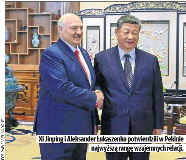
Xi Jinping i Aleksander Łukaszenko potwierdzili w Pekinie najwyższą rangę wzajemnych relacji.

Rozmowy w Pekinie odbyły się zaledwie tydzień po bezpośrednim spotkaniu Łukaszenki z przywódcą Rosji Władimirem Putinem. Poprzednia wizyta białoruskiego lidera w Chinach miała miejsce we wrześniu 2025 roku.