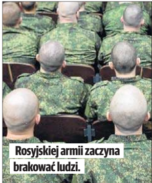
Rosyjskiej armii zaczyna brakować ludzi.

- Począwszy od października wojsko będzie gotowe przyjąć na przyspieszone szkolenie dziesiątki tysięcy osób na poligonach, a następnie w takich grupach rozdzielać je do działających oddziałów - opowiadał