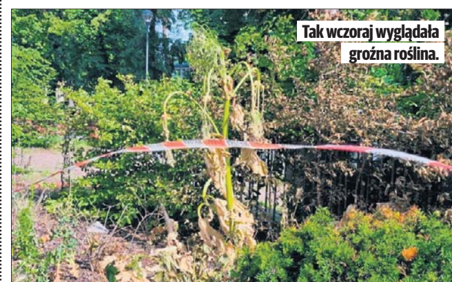
Tak wczoraj wyglądała groźna roślina.