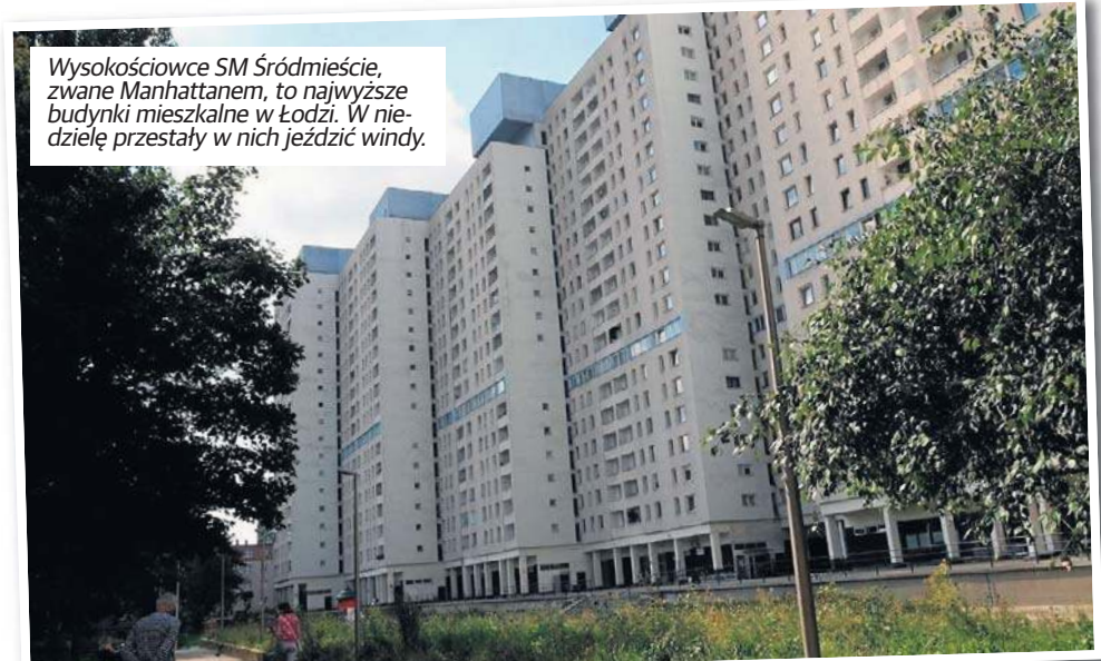
Wysokociowce SM Śródmieście, zwane Manhattanem, to najwyższe budynki mieszkalne w Łodzi. W niedzielę przestały w nich jeździć windy.

Niedzielny brak prądu w Śródmieściu i na Bałutach nie miał bezpośredniego związku z temperaturą - powodem była awaria transformatora przy ul. Legionów, która zabrała prąd 12 tys. odbiorców. Infrastruktura przesyłowa podlegająca spółce PGE jest zaprojektowana tak, by działała także w upały, ale ryzyko awarii w takie dni jest nieco większe z powodu większego nagrzewania się urządzeń. Bez problemów w upały działa natomiast produkcja prądu - elektrociepłownia Veolia działa normalnie.