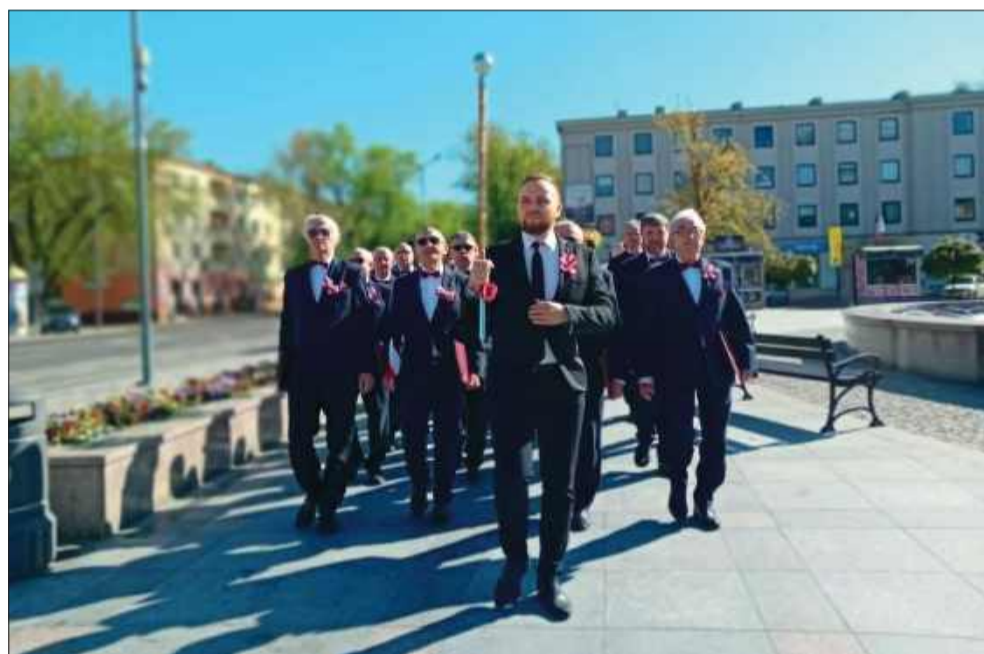
Tak w maju budzi się Mielec!