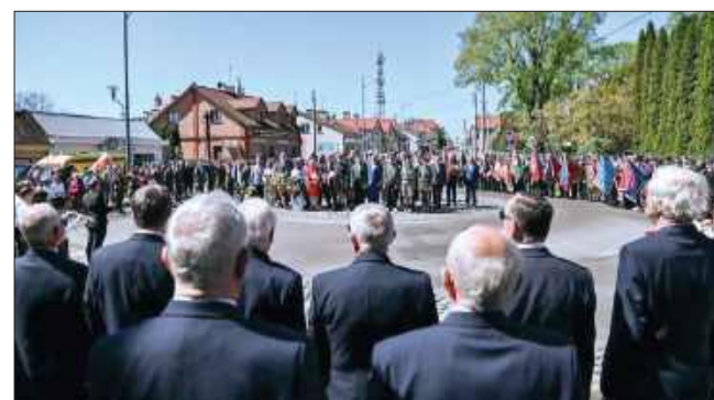
Tłumy mielczan zgromadziło się pod Pomnikiem Wolności