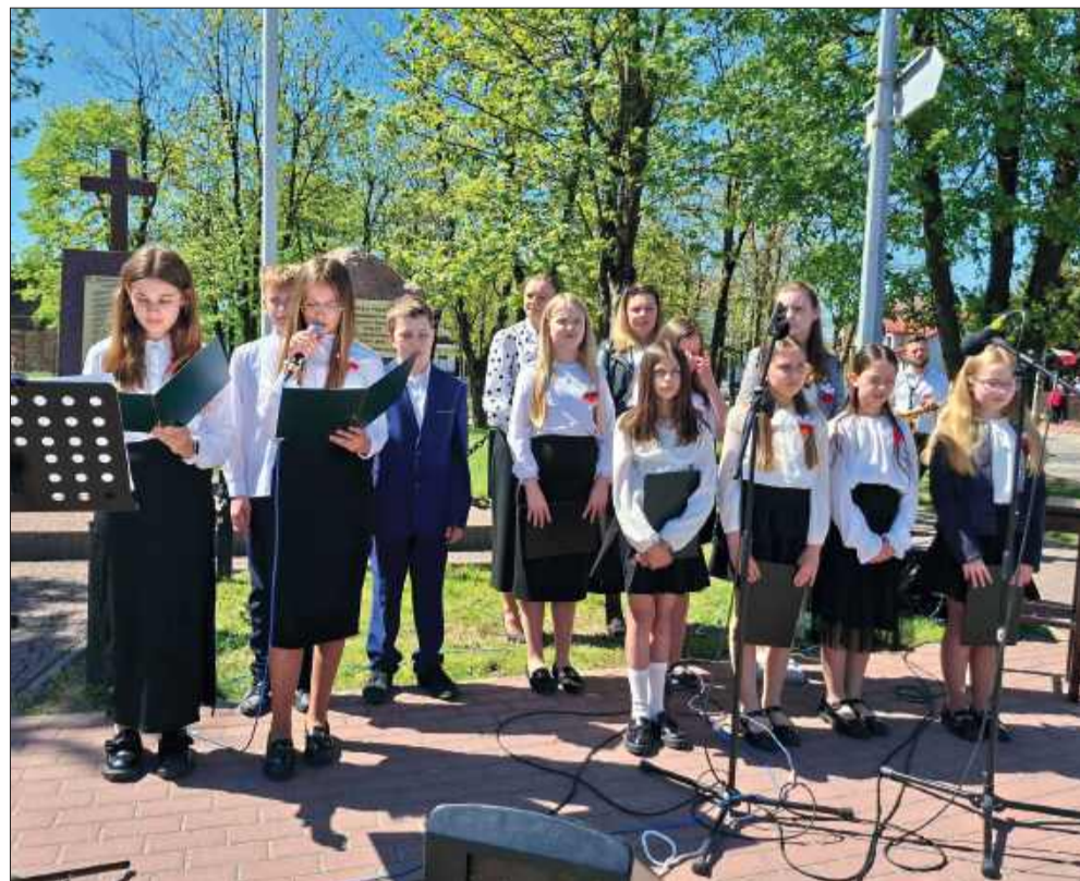
Uroczystości w Borowej.