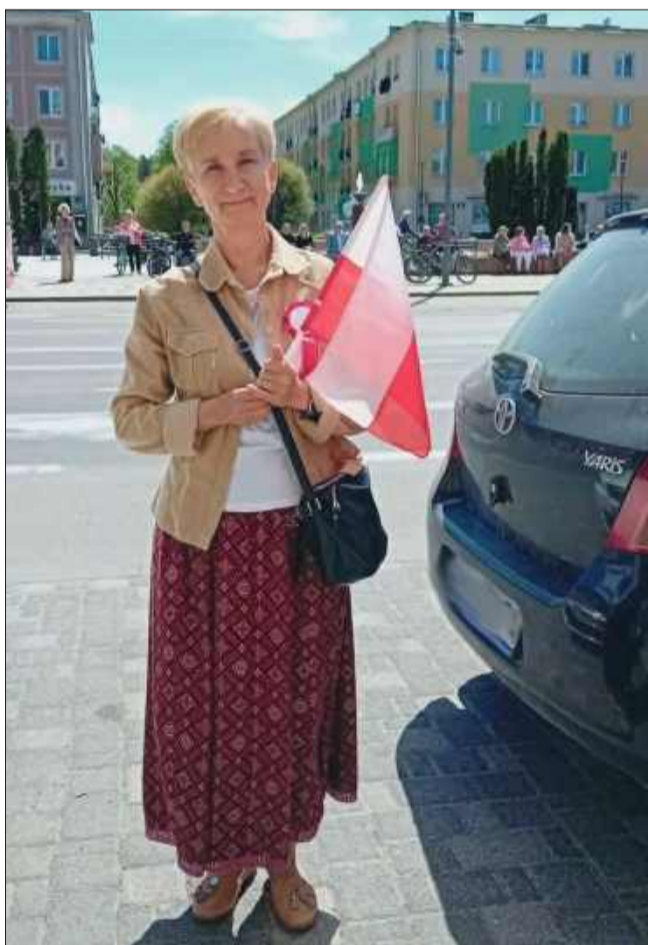
Mielczanie hucznie świętowali Dzień Flagi.