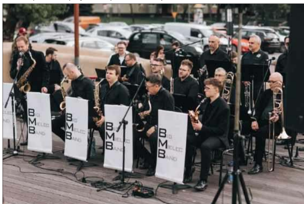
„Muzyczna Majówka” na górze Cyranowskiej.