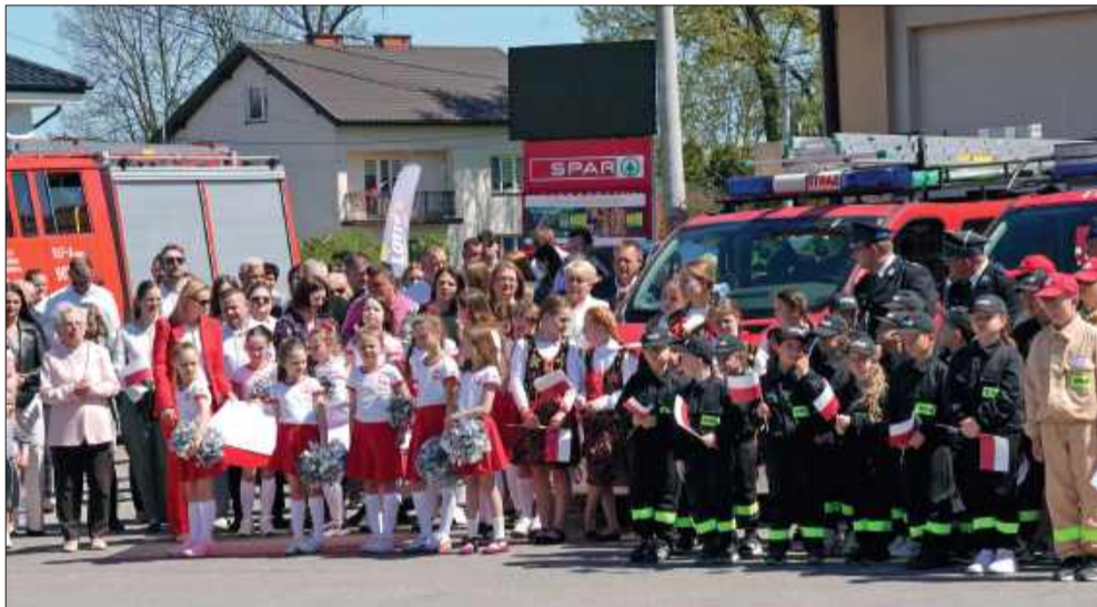
Mali mieszkańcy gminy Wadowice Górne.