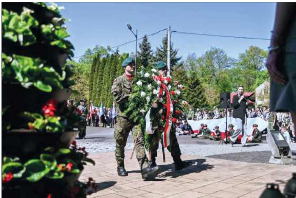
Symboliczne składanie wieńców pod pomnikiem

Tegoroczny długi weekend w Mielcu upłynął pod znakiem muzyki, wspólnoty i głębokiego patriotyzmu. Od koncertów plenerowych na Górze Cyranowskiej, przez radosne „pobudki” na osiedlach, aż po uroczyste obchody państwowe – miasto tętniło życiem przez trzy dni.