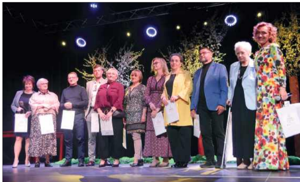
Młodzież interpretowała utwory uznanych twórców z regionu.

„III Radomska Wiosna Poetycka przyszła jak cichy wers i rozkwitła między słowami jak pęk w dłoni poety”. Pod takim hasłem w Radomyślu Wielkim odbyło się niezwykle spotkanie z literaturą, które połączyło młodzieńczą pasję z doświadczeniem uznanych twórców.