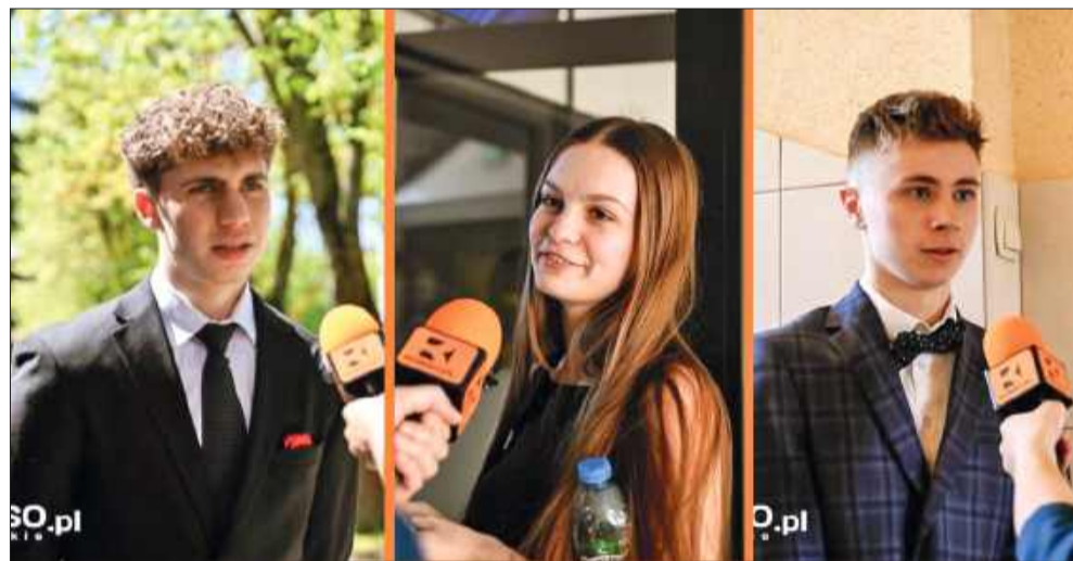
Maturzyści z uśmiechem opuszczali sale.

- Ja wybrałam temat pierwszy. Wybrałam „Lalkę” i „Zdążyć przed Panem Bogiem” - mówi jedna z maturzystek.