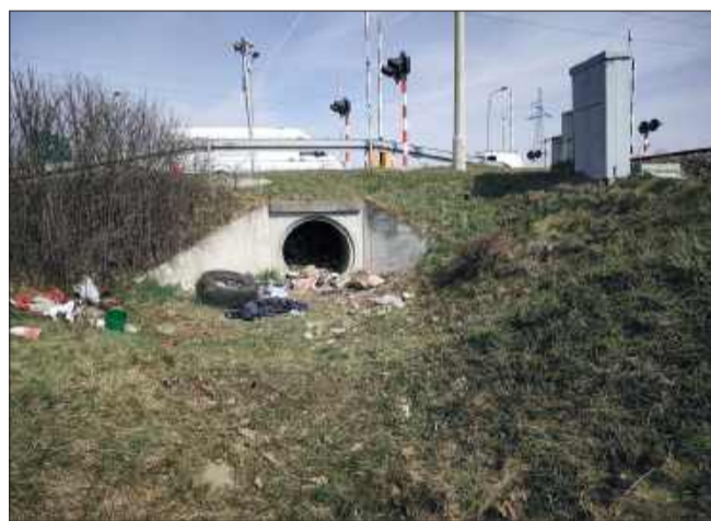
W przepuście znajdowała się masa śmieci.

Jak podała mielecka policja, biegłym udało się ustalić tożsamość zmarłego na podstawie badań porównawczych DNA. Był to około 60-letni mężczyzna,