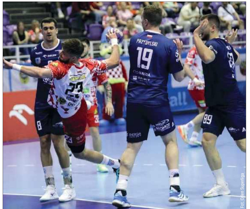
Mielczanie przegrali z Chrobrym Głogów i zagrają o siódmie miejsce na koniec sezonu.

Już za tydzień czeka ich ostatni, decydujący sprawdzian – wyjazdowe starcie z MMTS-em Kwidzyn, którego stawką będzie ostateczne zajęcie siódmego miejsca w ligowej tabeli.