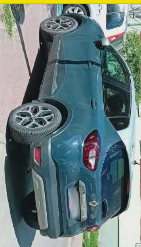
Szukaliście definicji „udańskiej fantazji”? Znaleźliście ją tutaj.