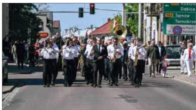
O oprawę muzyczną zadbała Mielecka Orkiestra Dęta

wych przeszedł ulicami miasta pod Pomnik Wolności. Po wspólnym odśpiewaniu hymnu, liczne delegacje – od parlamentarzystów po harcerzy i uczniów – złożyły kwiaty. gj