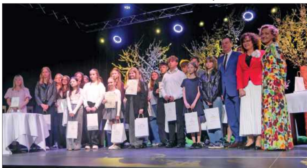
Niezwykły finał literackiego projektu w Radomyślu.

III Radomska Wiosna Poetycka zapisała się w sercach uczestników jak wiersz, do którego chce się wracać – pełen autentyczności, wzruszeń i nadziei na to, że młode pokolenie wciąż potrafi słuchać „echa słów”. MW