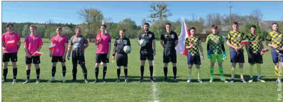
Za nami kolejna seria gier w A-klasie.