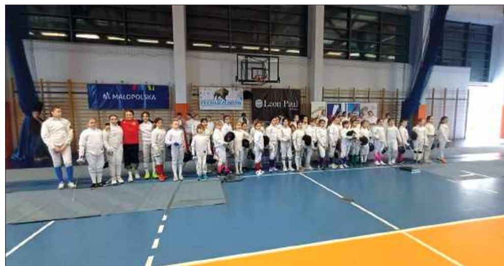
Delegacja PTG Sokół 1893 Mielec.

Zawodnicy PTG Sokół 1893 Mielec trzykrotnie stanęli na podium podczas drugiej odsłony 15. Pucharu Żubrów 2026 w Skawinie. Zawody odbyły się w miniony weekend, 25–26 kwietnia.