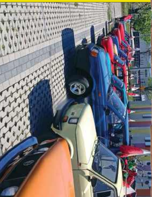
Mileckie klasyki też świętowały 3 maja!