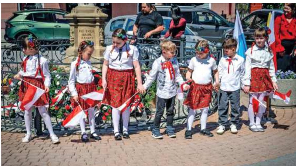
Obchody święta 3 maja na radomyskim rynku.