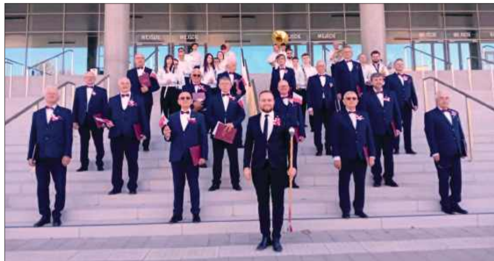
Orkiestra dęta od wczesnych godzin rannych odwiedzała miejskie osiedla.