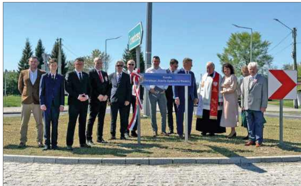
Rondo w Chorzelowie to teraz Rondo Świętego Józefa Opiekuna Rodzin.