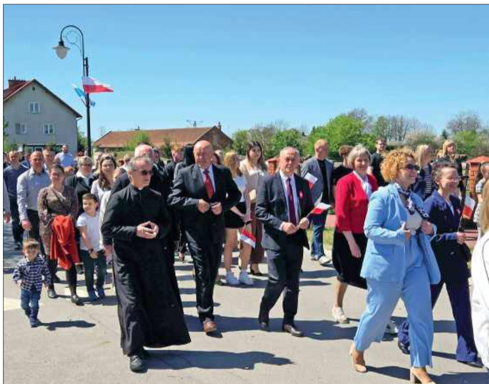
Mieszkańcy gminy Tuszów Narodowy w uroczystym pochodzie.