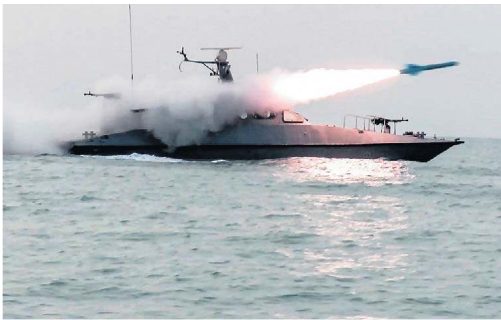
Ćwiczenia morskie Korpusu Strażników Rewolucji Islamskiej w cieśninie Ormuz

W rozmowach stronę amerykańską reprezentowali wysłannik prezydenta USA Steve Witkoff oraz zięć i doradca Donalda Trumpa Jared Kushner. Irańskiej delegacji przewodniczył szef MSZ Abbas Aragczi. W rozmowach, tak jak poprzednio, pośredniczyli dyplomaci z Omanu.