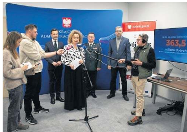
Do zostawienia 1,5 proc. podatku w Podlaskiem zachęcano podczas wtorkowej konferencji prasowej

- Wydaje mi się, że ta paleta, gama organizacji pożytku publicznego, które mogą skorzystać i bardzo dobrze wykorzystać potem nasze pieniądze,