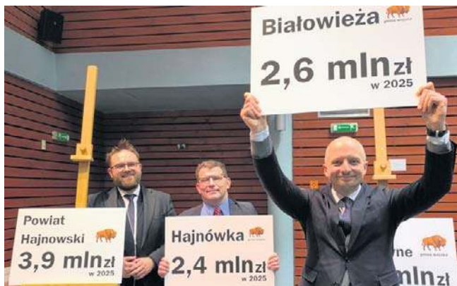
- Ochrona przyrody się opłaca - mówił w Białowieży wiceminister Mikołaj Dorożala (na zdjęciu z prawej)

Wiceminister ocenił, że subwencja ekologiczna jest zmianą fundamentalną w ochronie przyrody w Polsce, ponieważ dyskusja o tym jak wesprzeć sa-