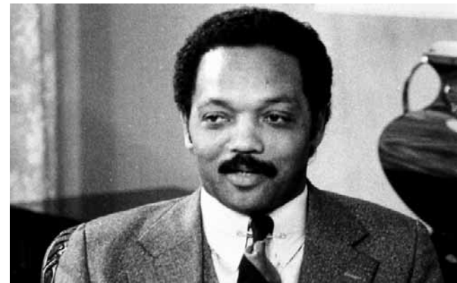
Jesse Jackson walczył o równouprawnienie czarnoskórych Amerykanów od lat 60. XX w.

W ostatnich dziesięcioleciach Jackson otwarcie wypowiadał się na temat czołowych polityków, w tym byłego prezydenta Baracka Obamy. Potępił prezydenturę Donalda Trumpa, mówiąc: „Pięćdziesiąt lat praw obywatelskich zostało zagrożonych”.