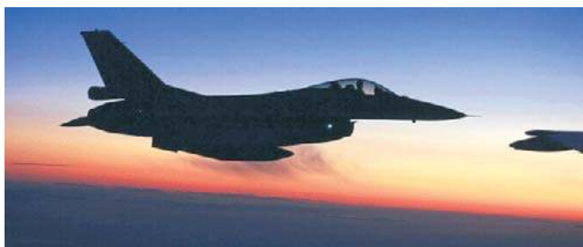
Za sterami F-16 siedzą też weterani z Holandii

W ostatnich tygodniach w Ukrainie utworzono eskadrę F-16, do której po raz pierwszy weszli piloci ze Stanów Zjednoczonych i Holandii - informuje francuski portal Intelligence Online specjalizujący się w pracy z danymi wywiadowczymi.