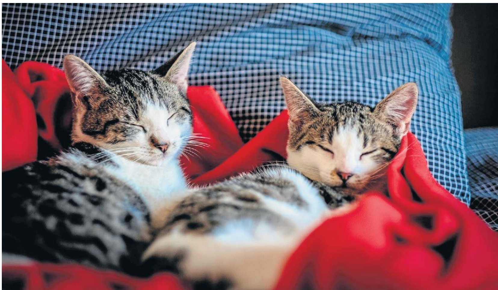
Dzień Kota obchodzi się w Polsce 17 stycznia oraz 8 sierpnia. Ma on podkreślić znaczenie obecności kotów w naszym codziennym życiu

Im bardziej dziecko było przywiązane do zwierzęcia, tym bardziej czuło się sprawne,