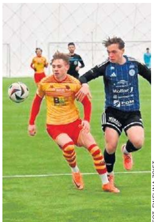
Zespół Wigier Suwałki wygrał z Jagiellonią II Białystok 4:1

- Rozegraliśmy obfitujące w płynne akcje spotkanie z wy-