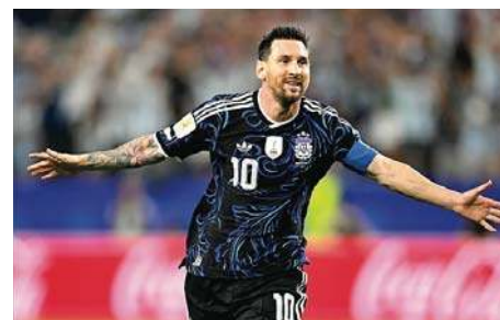
Zaczynamy wielkie granie |14