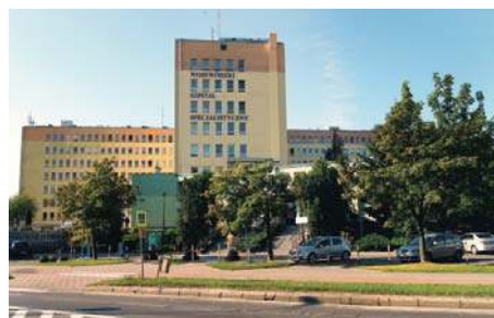
Kolejny protest w sprawie fuzji szpitali |2