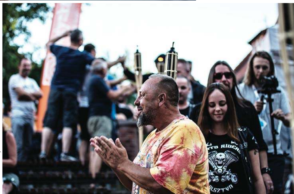
Fot. Materiał niedostępny

— Do tego zmierzam. Wrażliwy człowiek nigdy nie będzie do końca szczęśliwy, zwłaszcza w obecnych czasach.