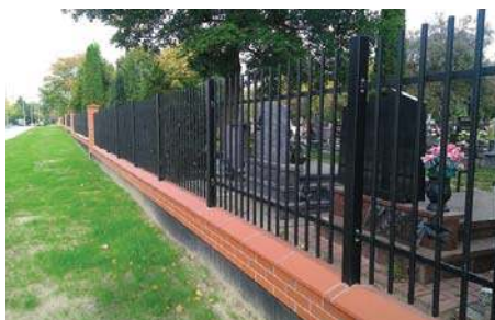
Robią z cmentarzy śmietnik |2