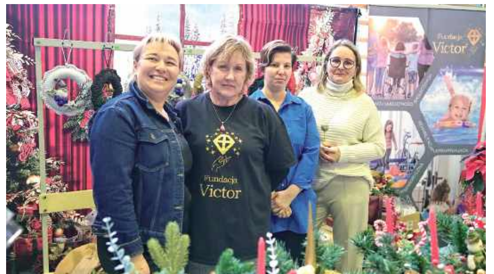
Nie zabrakło też przedstawicieli Fundacji Victor