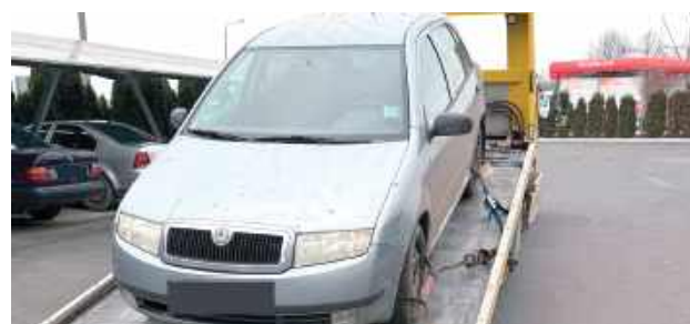
Podczas patrolu policjanci białskiej prewencji zwrócili uwagę na osobową Skodę. Auto miało widoczne uszkodzenia

- Podczas patrolu policjanci białskiej prewencji zwrócili uwagę na osobę Skodę. Auto posiadało widoczne uszkodzenia, dlatego postanowili zatrzymać kierowcę osobówki do kontroli drogowej. Siedzący za kierownicą mężczyzna zatrzymał się, jednak kiedy widział podchodzących do auta policjantów, ruszył z piskiem opon. Policjanci natychmiast ruszyli za nim w pościg. Kierowca nie reagował na sygnały świetlne i dźwiękowe, kontynuując ucieczkę. W trakcie ucieczki