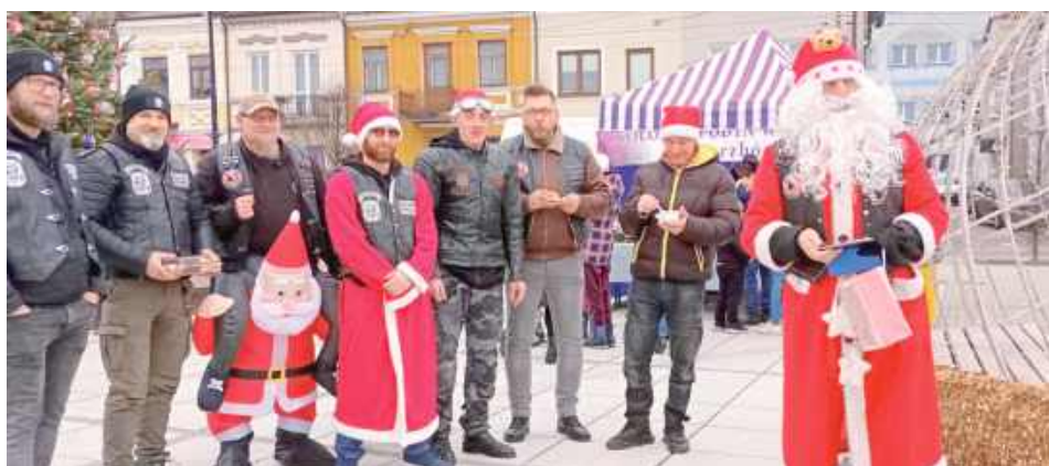
Parczewskich motocyklistów z Ludzie Chaosu Parczew wsparli motocykliści z zaprzyjaźnionych klubów, Club House AIKI BIKER FG Radzyń Podlask oraz Mad Joker's FG Biała Podlaska. Mikołaj z Radzyna Podlaskiego przyjechał z dużym zapasem słodyczy