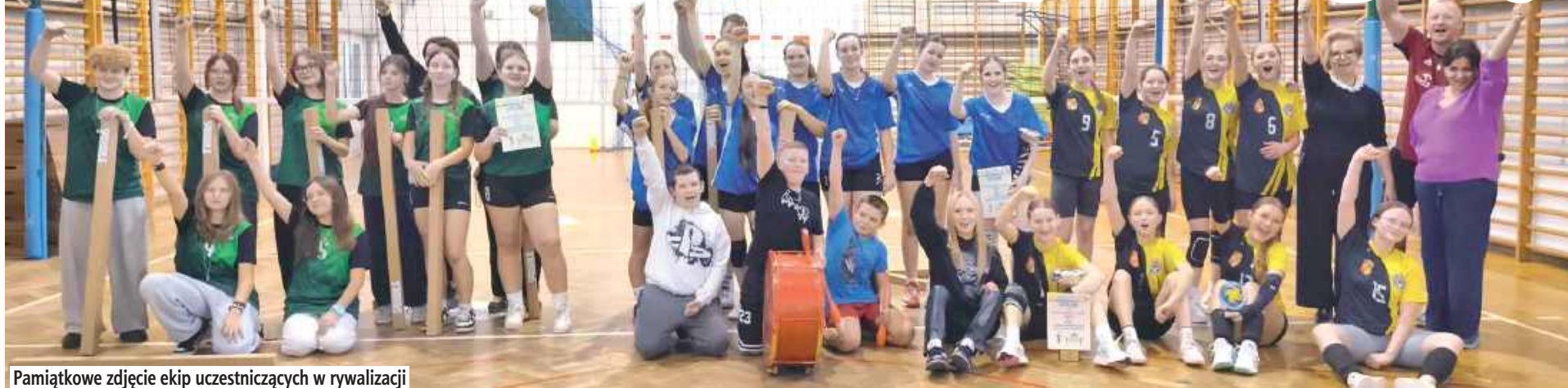
Pamiątkowe zdjęcie ekip uczestniczących w rywalizacji