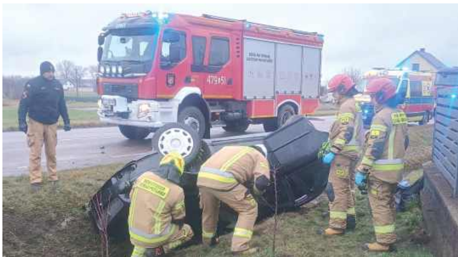
Na miejscu interweniowały trzy zastępy z JRG Łuków, jednostki OSP KSRG Stanin i OSP KSRG Krzywda

We wtorek, 9 grudnia po godzinie 13.30 doszło do niebezpiecznego zdarzenia na drodze prowadzącej z Krzywdy do Stanina.