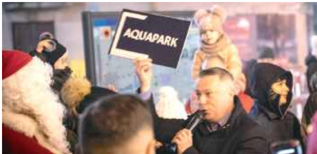
Święty Mikołaj przyniósł burmistrzowi dobre wiadomości

Tymczasem dokumentacja projektowa pokazuje, że planowany Aquapark, który powstanie przy Szkole Podstawowej nr 2, ma być jedną z najbardziej nowoczesnych i wszechstronnych tego typu realizacji w Polsce. Dwukondygnacyjny obiekt w nowoczesnej bryle będzie w pełni przystosowany do osób z niepełnosprawnościami -