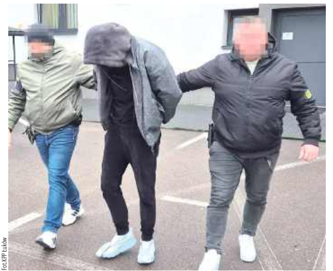
Z zabezpieczonych od 20-latka znacznych ilości substancji można byłoby wytworzyć kilkaset porcji dilerskich narkotyków

Podczas przeszukania pojazdu funkcjonariusze znaleźli marihuanę. Po dalszych czynnościach ścigania, mundurowi przeszukali również jego dom,