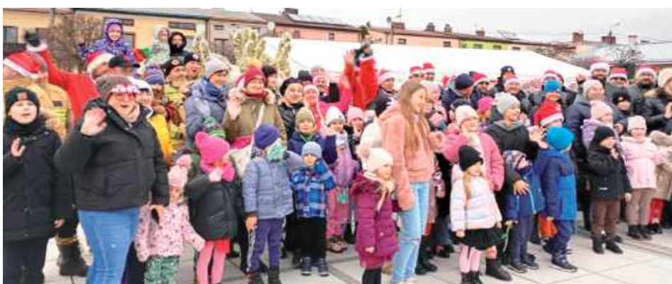
Mikołajki w mieście zakończyła wspólna fotografia

spodyń Wiejskich w Wierzbówce, barszczyk czerwony i bigos cieszyły się dużym powodzeniem. W trakcie Mikołajek zbierane były pieniądze