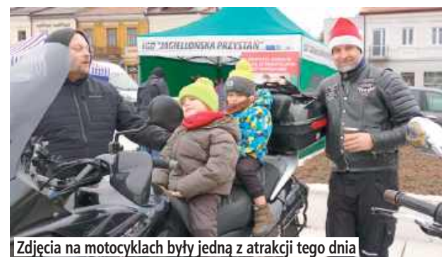
Zdjęcia na motocyklach były jedną z atrakcji tego dnia