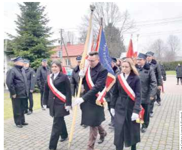
...oraz przemarsz pocztów sztandarowych

się na placu – podają Lasy Państwowe. Zginęło w sumie 96 osób. Cztery przeżyły, pomimo odniesionych obrażeń. Niedawno zostały zorganizowane obchody 83. rocznicy mordu w Białce. W programie była msza święta w kaplicy w Biał-