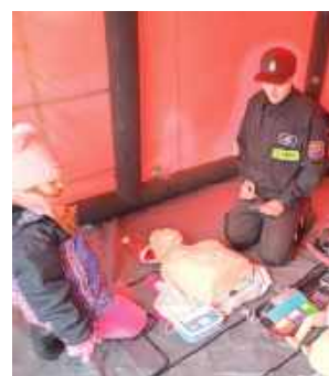
O tym, że udzielania pierwszej pomocy trzeba się uczyć, nie musimy nikogo przekonywać. Wszyscy chętni mogli poćwiczyć swoje umiejętności pod czujnym okiem druhów z OSP Wierzbówka

Parczew: Parczewskie Mikołajki w tym roku miały wyjątkową oprawę. Gmina Parczew oraz grupa motocyklowa Ludzie Chaosu Parczew połączyli siły. I Motomikołajki przyciągnęły tłumy.