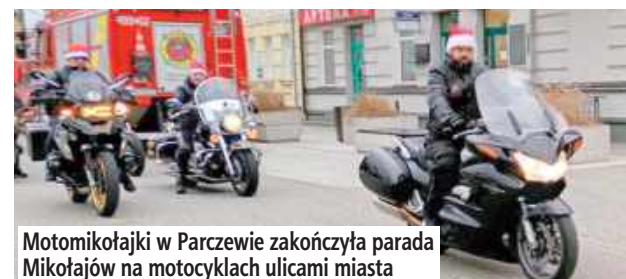
Motomikołajki w Parczewie zakończyła parada Mikołajów na motocyklach ulicami miasta