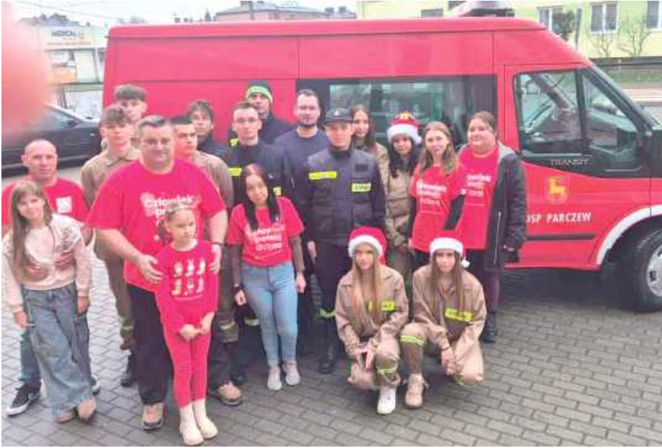
W Parczewie działało ośmiu wolontariuszy. Do pomocy zgłosiły się jednostki Ochotniczej Straży Pożarnej z Jasionki, Parczewa, Wierzbówki i Milanowa. Strażacy dowieźli paczki do wszystkich rodzin

Parczew: 13 i 14 grudnia to w tym roku Weekend Cudów, czyli finał akcji zorganizowanej przez Szlachetną Paczkę. W naszym rejonie pomoc dotarła do 32 rodzin.