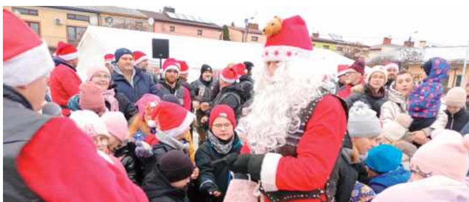
Nasze dzieci odwiedził również Mikołaj z Radzyna Podlaskiego

Parczewskie Mikołajki upłynęły w świątecznej atmosferze, dzieci ozdabiały pierniczki, a Mikołaje obdarowywali wszystkich upominkami. Na zmarzniętych uczestników czekały gorące pyszności przygotowane przez Koło Go-