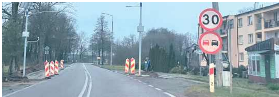
Osoby, które udają się na zakupy do sklepu, a nie mają samochodu, muszą przechodzić na drugą stronę DW 819 „na dziko”

W Dębowej Kłodzie powstaje przejście dla pieszych w ciągu drogi wojewódzkiej numer 819.