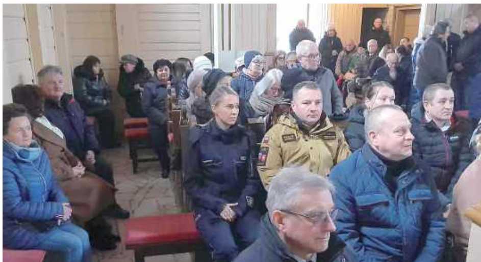
W programie była m.in. msza święta