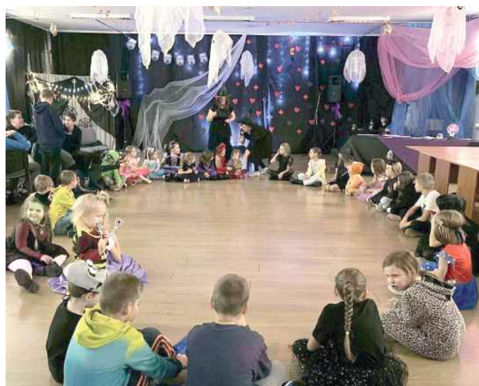
Sala została ładnie udekorowana