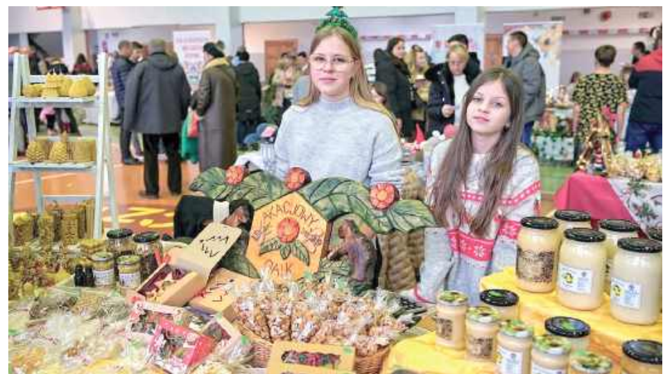
Można było kupić miód