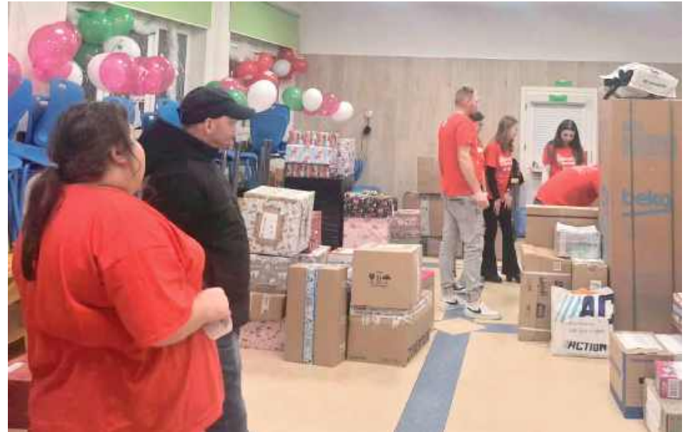
W magazynie Rejonowym, który mieścił w Szkole Podstawowej nr 3 w Parczewie, wciąż przybywało paczek, w których była odzież, gry, zabawki, żywność i słodkości, ale też sprzęt gospodarstwa domowego. Pomoc trafiła do wszystkich zgłoszonych rodzin

przywzyczały się radzić sobie same, często niewidoczne na co dzień, zmagające się z trudnościami w ciszy własnych domów. Dzięki Szlachetnej Paczce mogły jednak doświadczyć czegoś bezcennego, mogły poczuć, że nie są same, że ktoś dostrzega ich sytuację i chce pomóc.