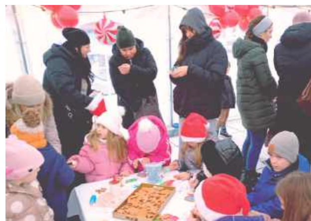
Podczas całego wydarzenia w specjalnym namiocie dzieci dekorowały pierniczki