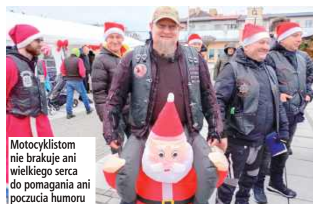
Motocyklistom nie brakuje ani wielkiego serca do pomagania ani poczucia humoru