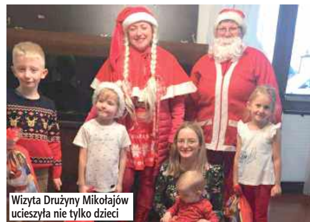
Wizyta Drużyny Mikołajów ucieszyła nie tylko dzieci

Sołecką, a kolejne Mikołajki już za rok. Bądźcie grzeczni, może