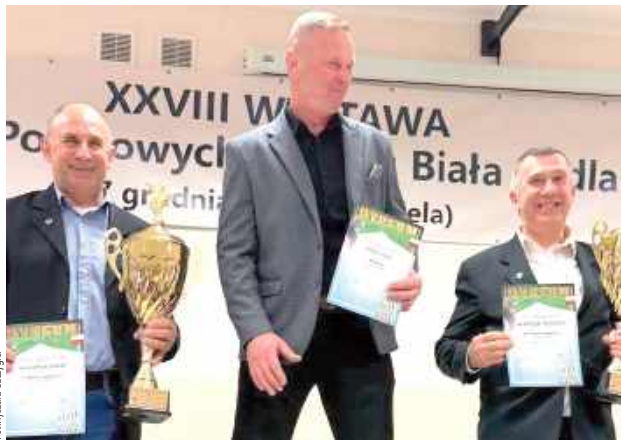
Środowisko hodowców gołębi pocztowych w regionie jest bardzo aktywne i prężnie się rozwija