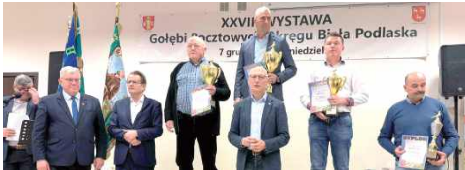
Wyróżnienia wręczali m.in. radny sejmiku województwa lubelskiego Ryszard Szczygieł, poseł Sławomir Skwarek, starosta łukowski Dariusz Szustek

W programie nie zabrakło najważniejszych momentów dnia: