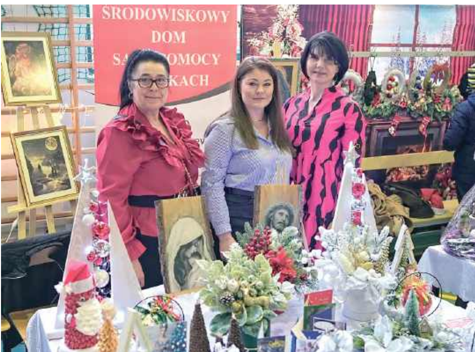
Swoje stoisko miał Środowiskowy Dom Samopomocy w Laskach

W Zespole Szkół im. Stanisława Staszica w Parczewie został zorganizowany jarmark bożonarodzeniowy. Można było kupić rękodzieła, ozdoby i słodczyce. Swoje stoiska miał m.in. Powiatowy Urząd Pracy w Parczewie oraz Warsztat Terapii Zajęciowej.