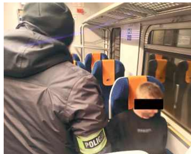
Do zatrzymania doszło w pociągu relacji Warszawa-Terespol, gdy mężczyzna wracał do miejsca zamieszkania

- Mężczyzna poszukiwany był listem gończym do odbycia kary pozbawienia wolności za przestępstwa narkotykowe. Przez kolejne miesiące próbował uniknąć odpowiedzialności, ukrywając się przed organami ścigania za granicą naszego