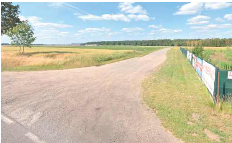
Przedmiotem sporu jest ta droga

Aby zrozumieć spór, trzeba się cofnąć w czasie do 2020 roku.